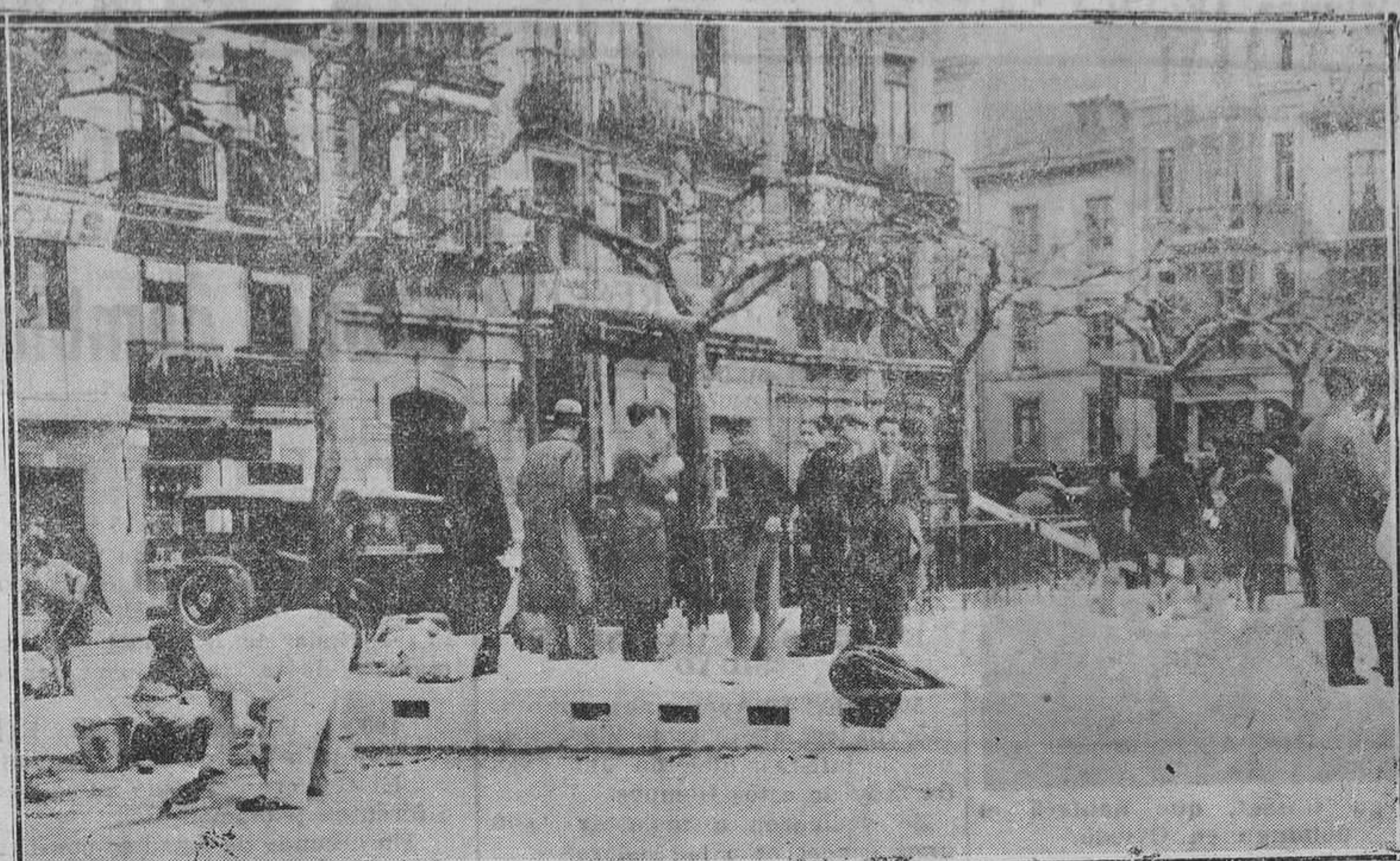
En la mañana de ayer se quitó la valla de madera que cerraba el trozo de la Escandalaria donde se ha construido el evacuatorio subterráneo. Las obras están a punto de terminar, y dentro de unos días se podrá inaugurar los nuevos servicios higiénicos.

Tercer caso de modernidad anunciadora. Se refiere a Marcial Lalande. En un bonito cartel de mano que va a dar lugar a que regrese el "Buenos Aires", para cargar más deportados, porque la imprenta, por falta de moral o porque tenía los carteles hechos antes del advenimiento de la República, ha colocado en la parte alta una magnífica bandera, con los antiguos colores nacionales que si a muchos nos hacen suspirar de alegría a otro les produce unos terribles cólicos hepáticos, y conste que no me refiero al señor Alborno. Debajo del nombre de Marcial Lalande se dice: "El mejor artista de todos los tiempos. El que supo hacer del torero arte puro, estilizado y sublime. El que hizo compatibles la seriedad con la alegría. El que abarcando con su talento otras actividades artísticas, triunfó en la célebre película: "Viva Madrid que es mi pueblo", que se proyectará la noche de la corrida en el acreditado "Salón Varietés", de esta ciudad". Sospecho que este empresario es aquél conocido pastor protestante norteamericano, que después de haber explicado a sus oyentes, el evangelio del día, terminaba así: