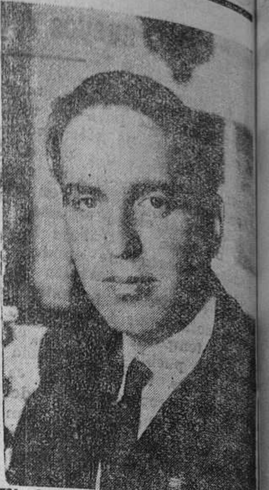
El doctor Marañón, que también hablará el domingo en Oviedo.

El director general de Seguridad al recibir a los periodistas les confirmó el hallazgo de explosivos diciendo que seguramente alguien los tendría en su domicilio y ante la posibilidad de que fueran ocupados en un registro los depositó en la calle de Cartagena para dejarlos abandonados y evitar toda responsabilidad.