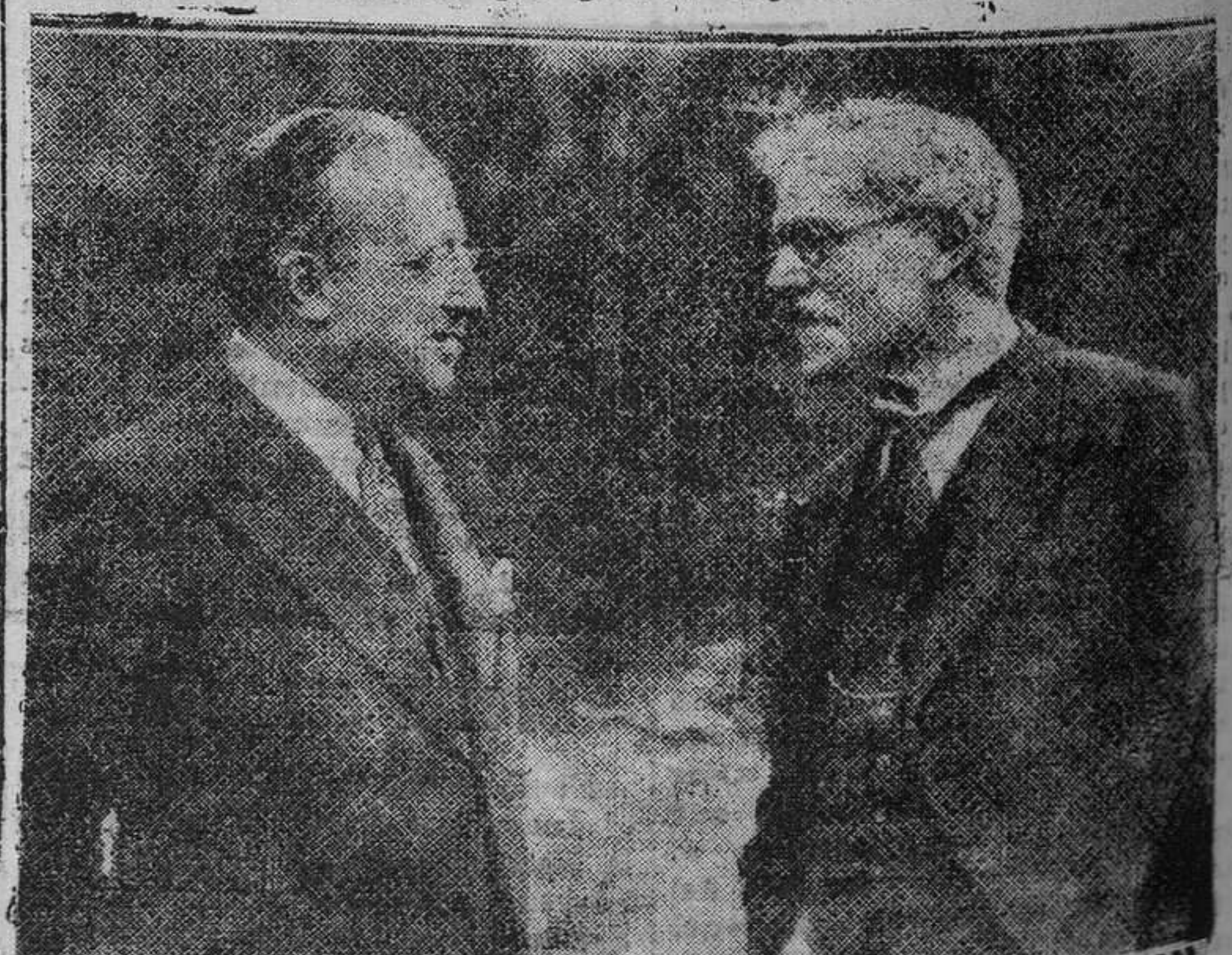
DEL VIJE DEL JEFE DEL GOBIERNO FRANCÉS A LONDRES.—Mr. André Tardieu y M. Ramsay MacDonald en los días de Downing Street, después de su entrevista reciente.

14.—La Asamblea acuerda solicitar del Gobierno y autoridades locales, la prohibición de la compra-venta de ganado en las casetas, para que se verifique especialmente en las ferias, y a pie de bodega, interviniendo únicamente aquellos que estén al corriente en el pago de los tributos que gravan ese comercio.