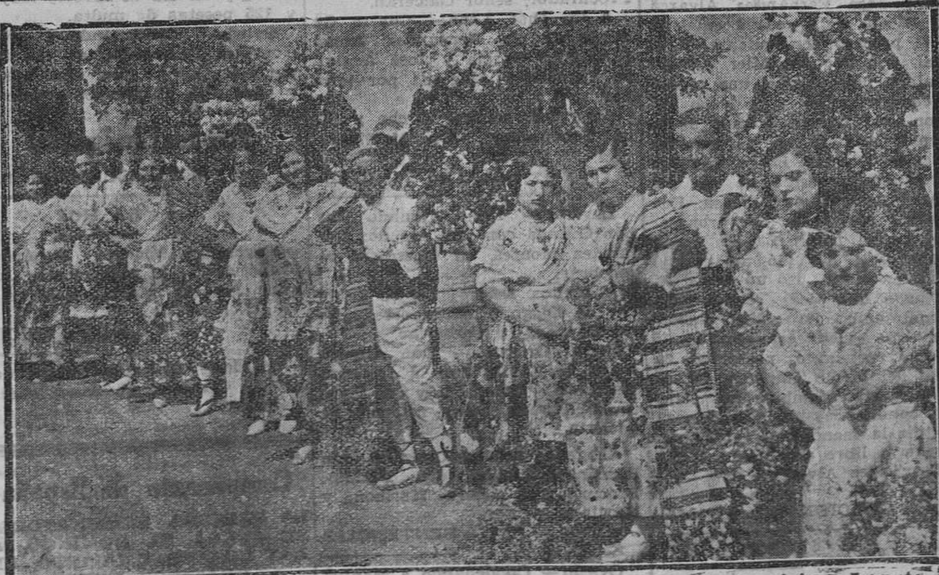
Grupo de huertanos que recibieron al presidente de la República en su viaje a Levante.

MADRID.—El gobernador civil ha impuesto una multa al párroco del pueblo de Garganta del Monte, por organizar una procesión sin permiso de la autoridad, y otra multa al alcalde de Valdemoro por asistir a otra procesión con carácter oficial.