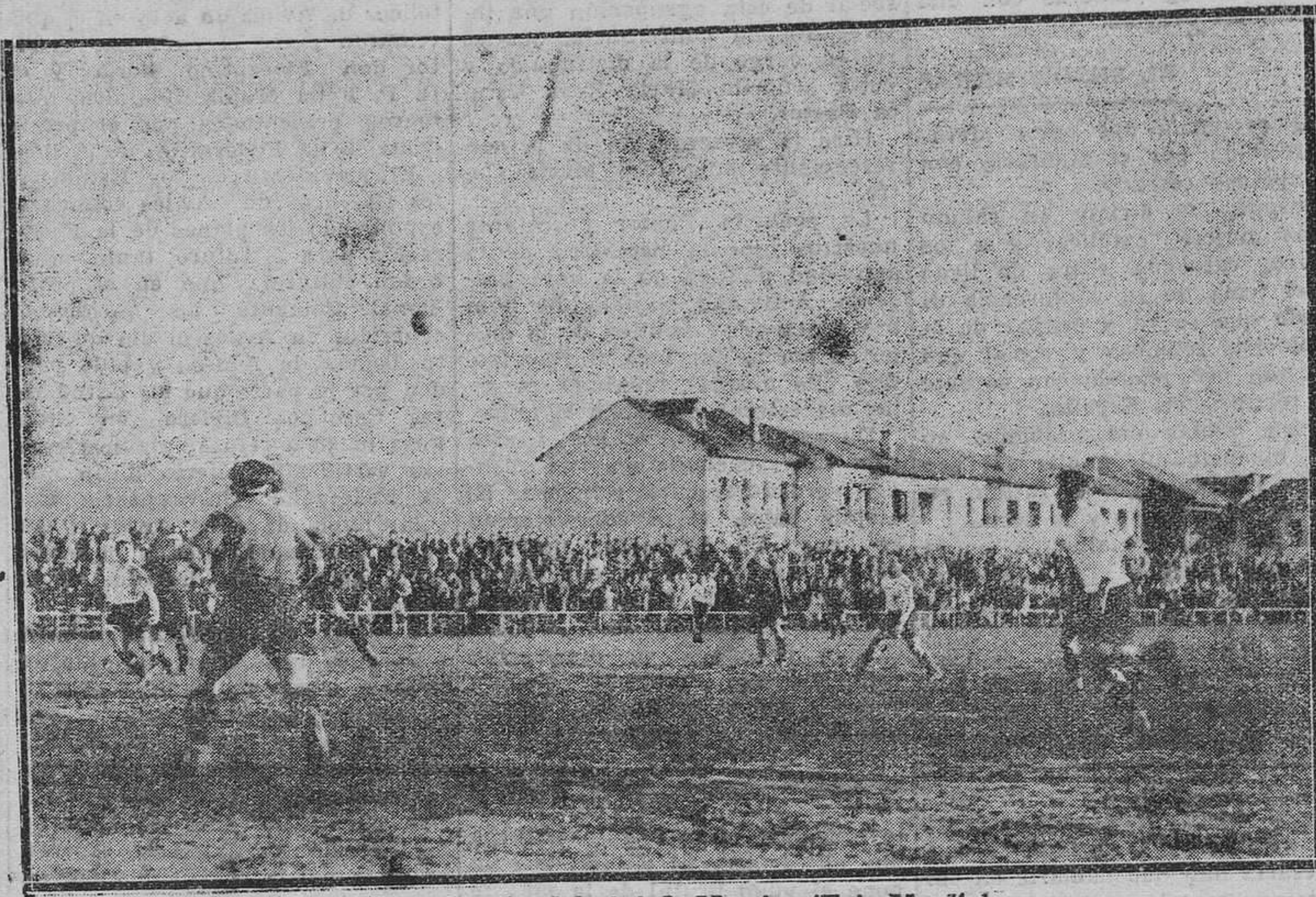
Una jugada del Oviedo-Murcia.

El público recibió también de uñas al "Murcia". Estos polvos fueron consecuencia de los todos de la Condomina, pero el recibimiento, así que quedó patente; y fué en contados instantes; que los murcianos no eran enemigos para tomar en cuenta, se convirtió en una incesante broma a su costa, interrumpida sólo para decirle al árbitro las más pintorescas cosas