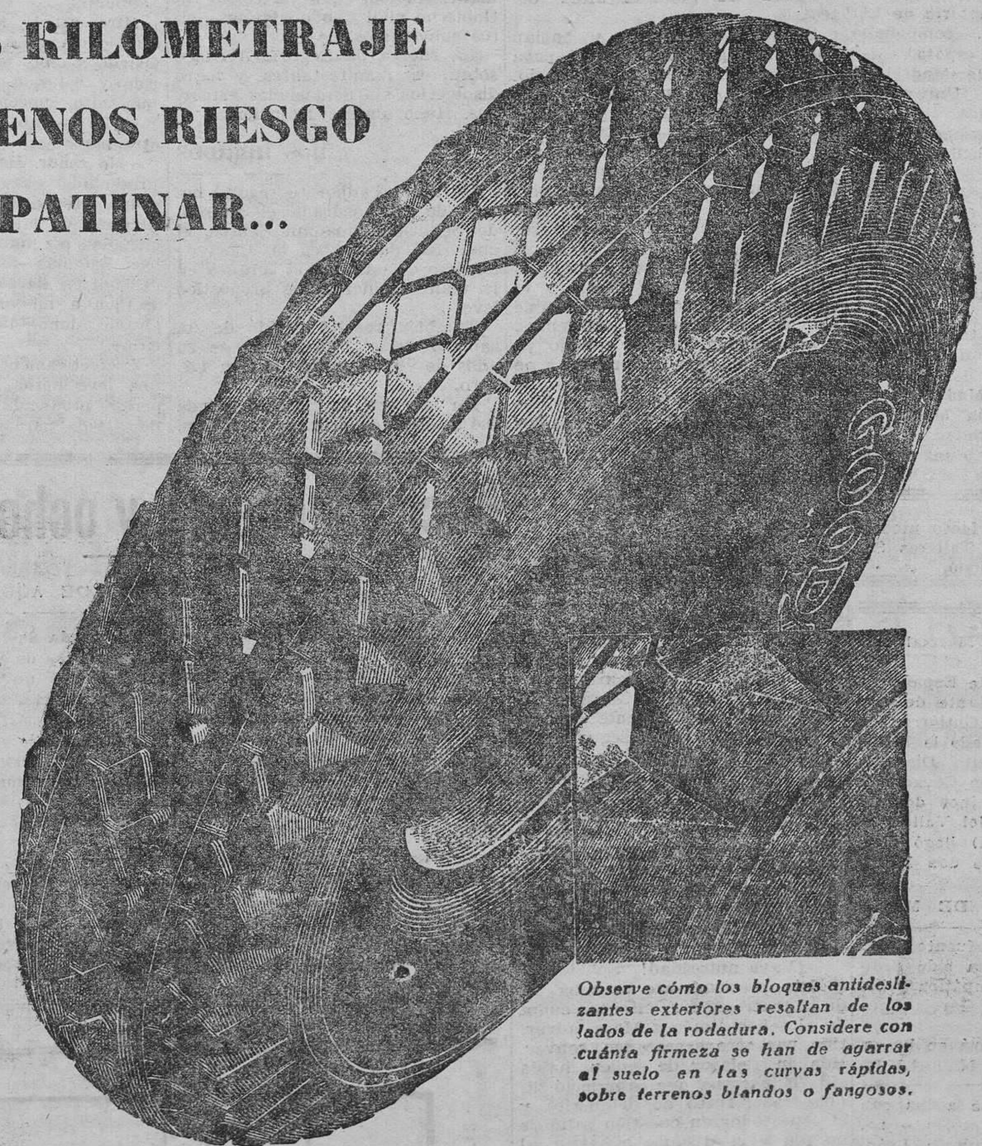
Observe cómo los bloques antideslizantes exteriores resaltan de los lados de la rodadura. Considere con cuánta firmeza se han de agarrar al suelo en las curvas rápidas, sobre terrenos blandos o fangosos.

Cuando Goodyear produce algo nuevo, significa que produce algo mejor. Así, por ejemplo, el nuevo y perfeccionado neumático de rodadura All-Weather aventaja de manera notabilísima a su justamente famoso predecesor. Examine en el centro de la rodadura los rombos gruesos y de agudas aristas. Piense en la seguridad que esto ofrece en caminos mojados... o resbaladizos... o en cualquier clase de caminos... sean cuales fueren las condiciones. Se trata, pues, de un neumático fuerte y duradero que representa una adición de gran estilo y conveniencia para cualquier automóvil.