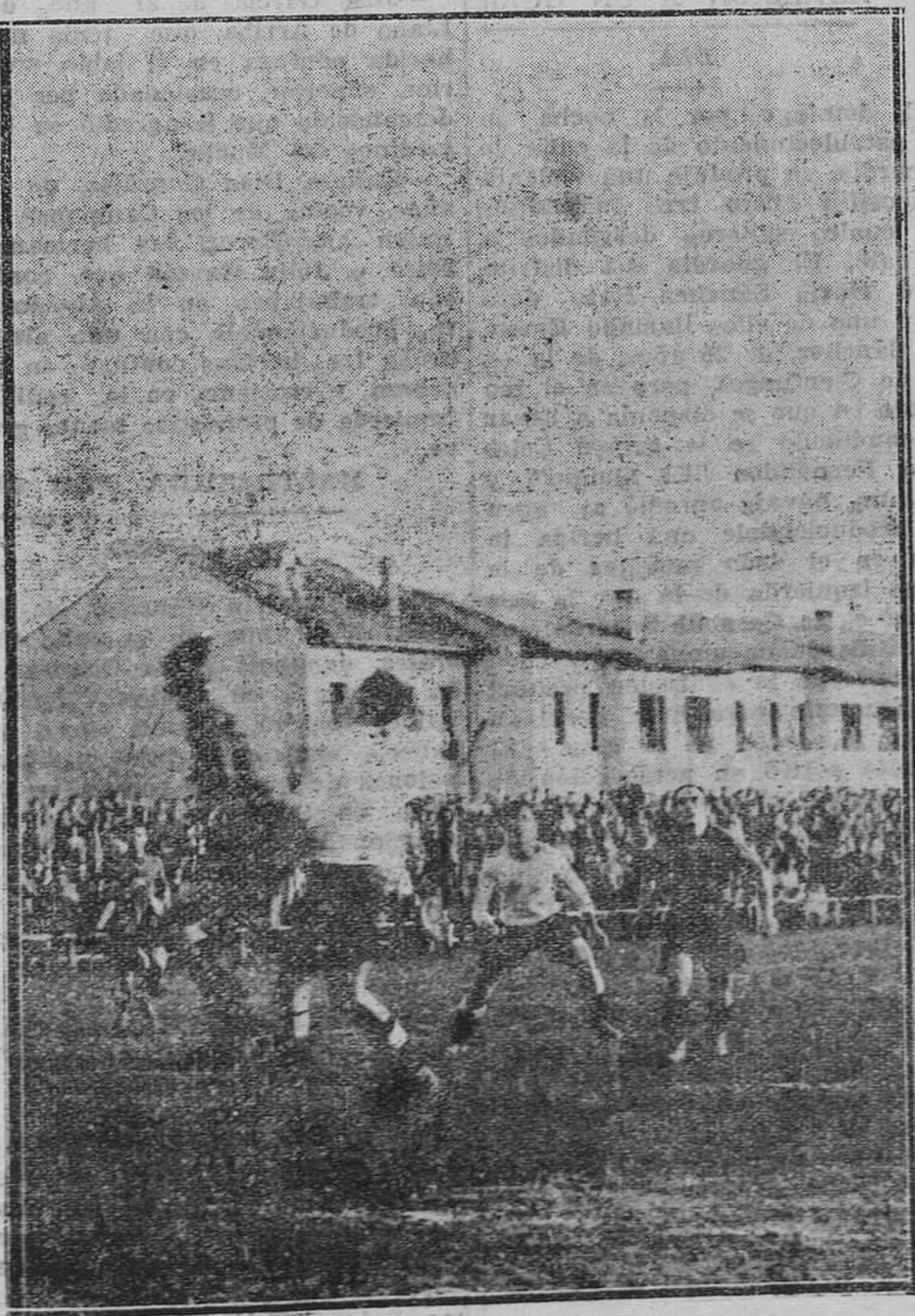
Otra jugada del Oviedo-Murcia.