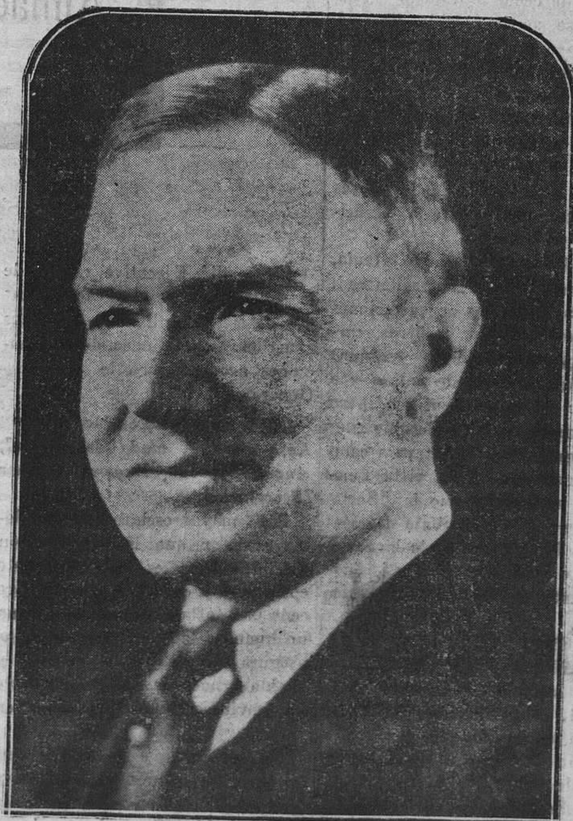
PARIS.— Mr. John D. Rockefeller, que acaba de ofrecer a la villa de París la suma de ciento cincuenta millones de francos para la construcción de una nueva Facultad de Medicina, adaptada a las necesidades actuales