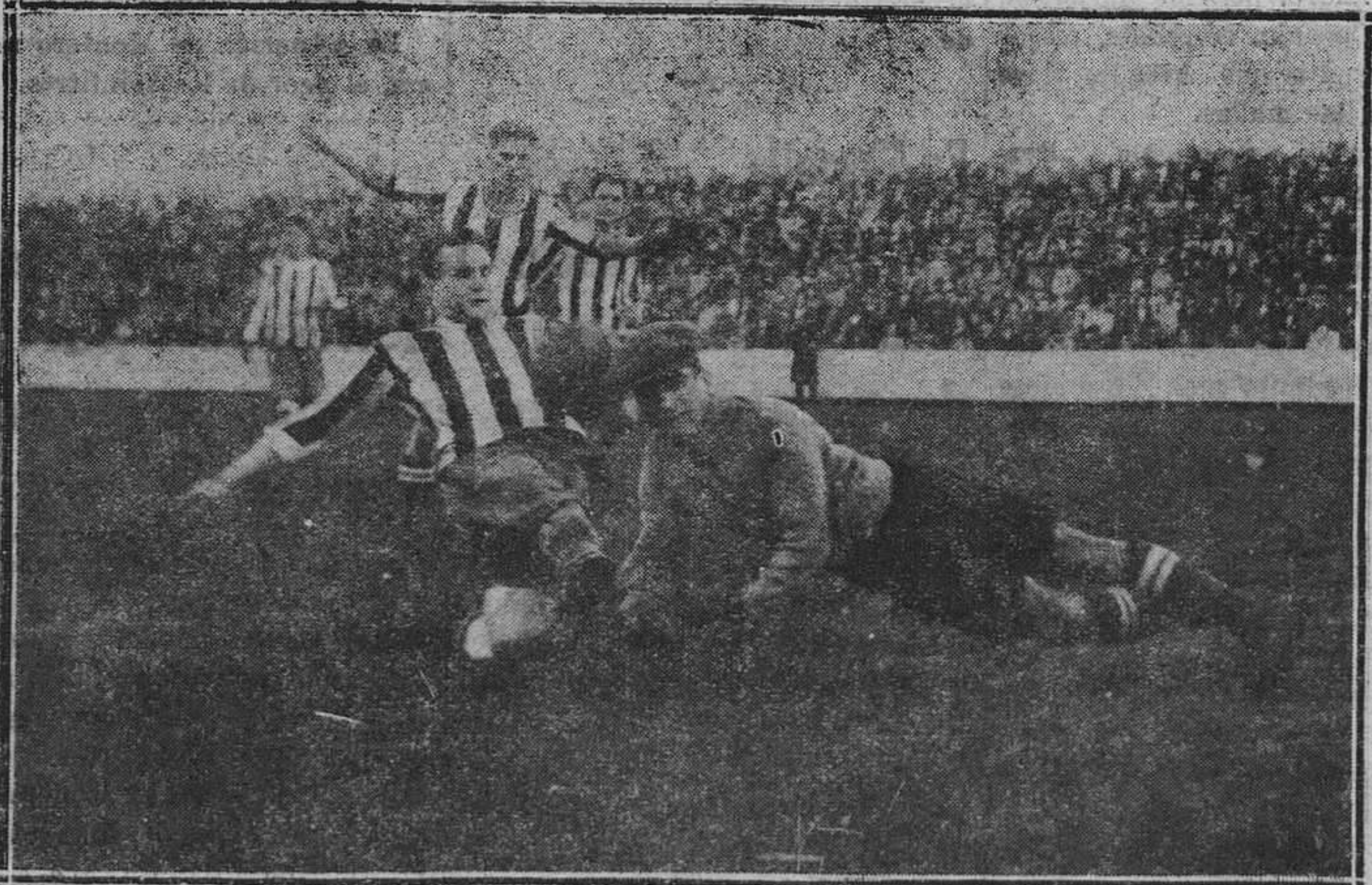
GIJÓN.— Del partido del domingo: Una interesante intervención del portero coruñés que le hizo retirarse lesionado