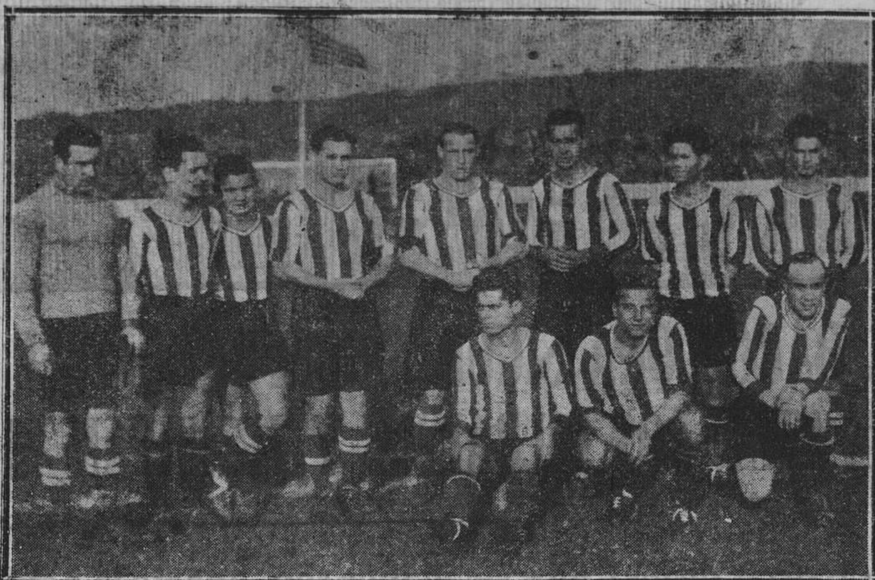
GIJÓN.— Del partido del domingo: El Deportivo de La Coruña que fué vencido en el Molinón

gan a dominar, pero sin resultado positivo, por la buena actuación de la defensa y medios y la eficaz ayuda de los interiores que se multiplican incansables.