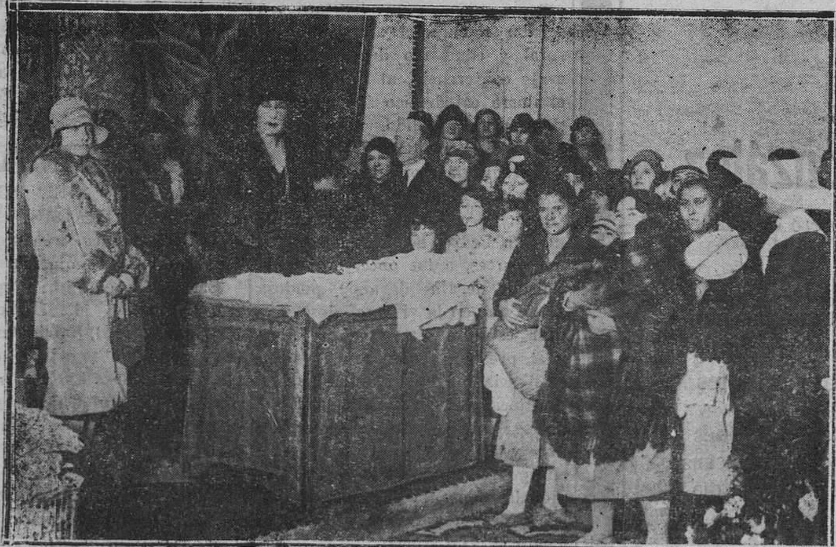
S. M. la Reina Victoria, con el ministro de Instrucción Pública, durante el reparto de ropas a los niños del Ropero Infantil "Reina Cristina".

Por la Alcaldía se ha dictado un Bando advirtiendo a los comerciantes e industriales que la constatación y marca periódica de los útiles de medir y pesar, se verificará en los días comprendidos entre el 2 y el veinte del próximo Enero, en las oficinas del Fiel Contraste, y que de no hacerlo en el plazo señalado incurrirán en las sanciones que determina el vigente Reglamento de Pesas y Medidas.