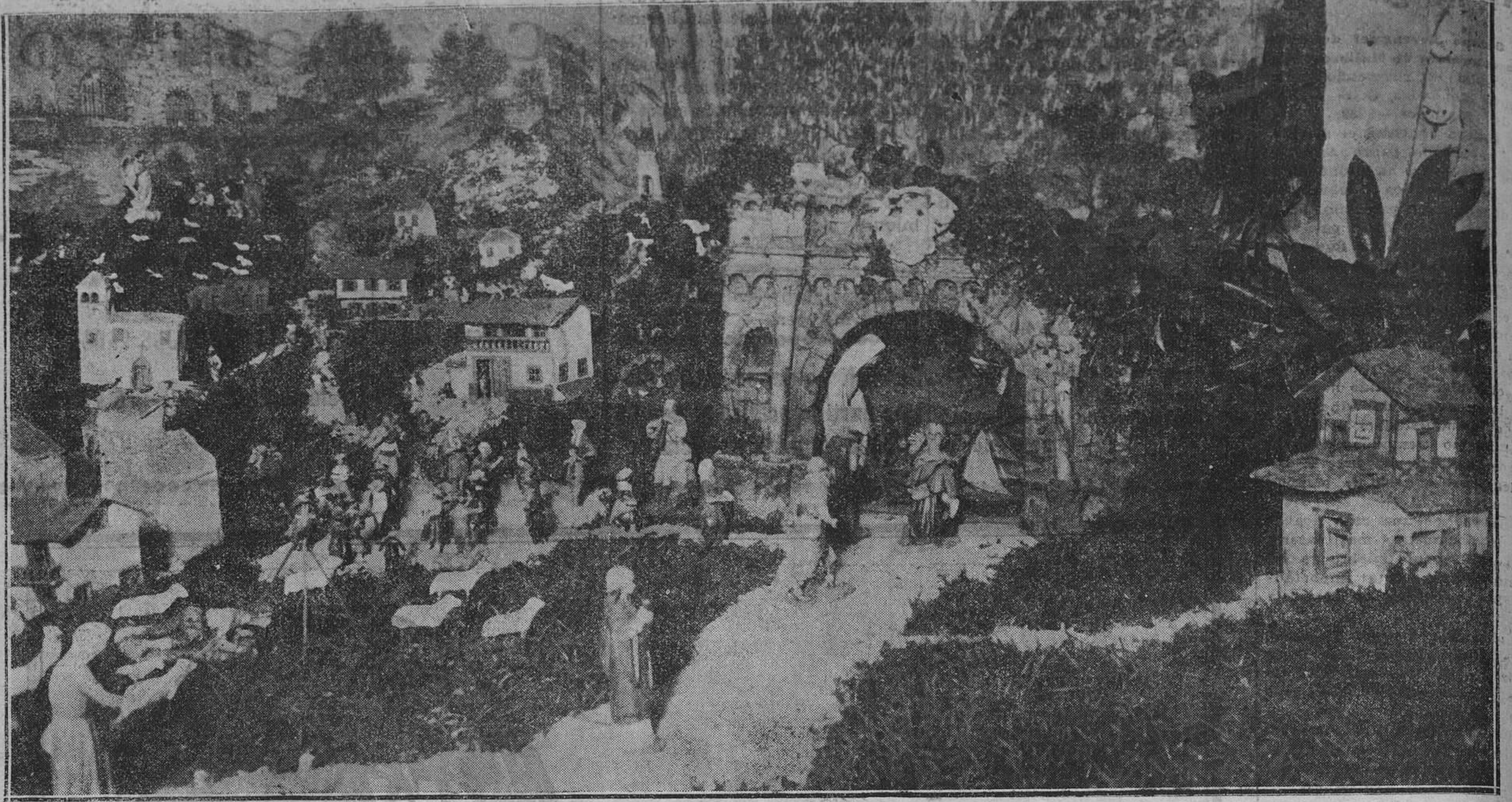
OVIEDO. —La escena del Portal, del magnífico Nacimiento de la Residencia Provincial