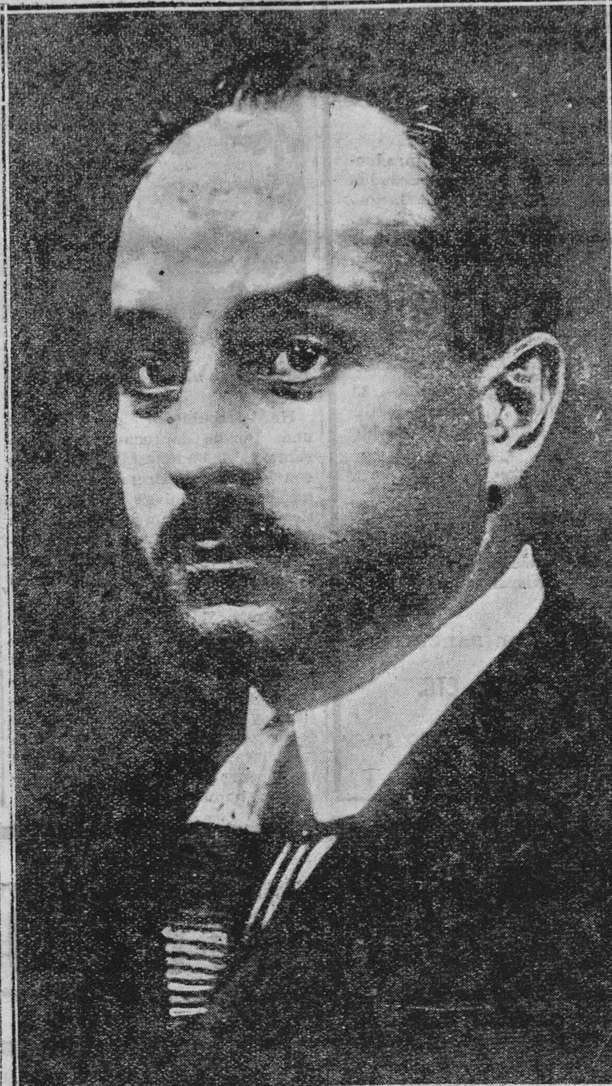
César Rossi, que estuvo complicado en el asesinato de Matteotti, y el cual, con motivo de la reciente amnistía, ha recobrado la nacionalidad italiana y la posesión de los bienes que habían sido confiscados.

Y apunta el siguiente diagnóstico: "Lo más terrible sería, no el perder la guerra, sino merecer ser derrotados."