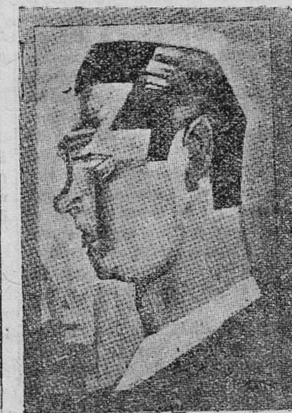
Richard Arlen, modelo de galanes, de atletas y de deportistas.

Sin embargo Brancroft, con su inmenso talento artístico y su ductilidad, ha sido explotado este año en los estudios, para realizar un film de gran actualidad. Nos resar vamos el título, pero podemos adelantarnos que el desarrollo del mismo tendrá por escenario la Rusia de la Revolución, y el simpático y popular George, encarnará el papel de un revolucionario cruel de la gran nación roja.