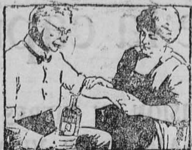
AUN VIEJOS DOLORES REUMATICOS

ceden ante este sencillo tratamiento. Aplíquese el Linimento de Sloan suavemente y éste llegará a los tejidos roídos por el dolor la sangre fresca y nueva que necesitan para curarse.