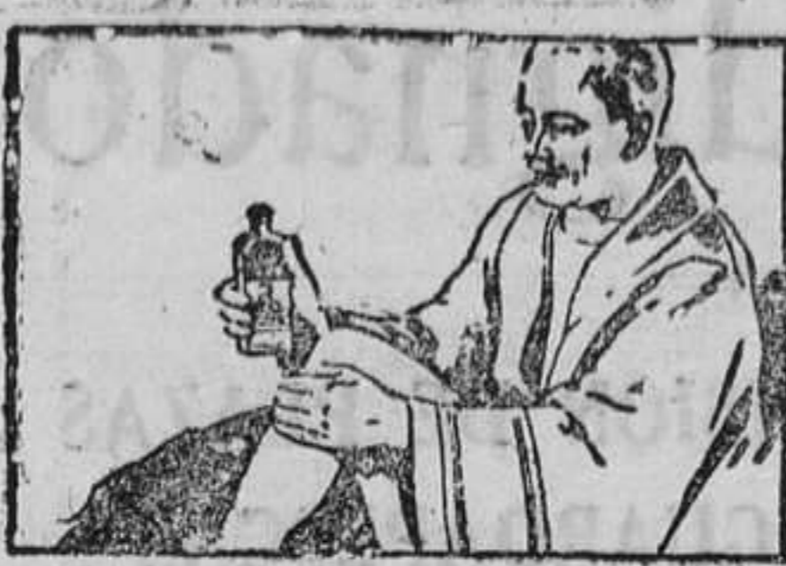
AL PRIMER ASOMO DE REUMATISMO

¡Ud. puede eliminarla merced al Linimento de Sloan! Aplíquese con suaves palmaditas.