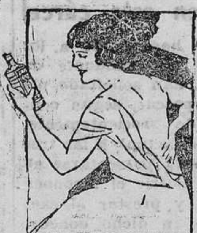
DOLOR DE ESPALDA

Alivie el dolor con Linimento de Sloan. Aplíquese suavemente sin frotarlo. Produce alivio inmediato.