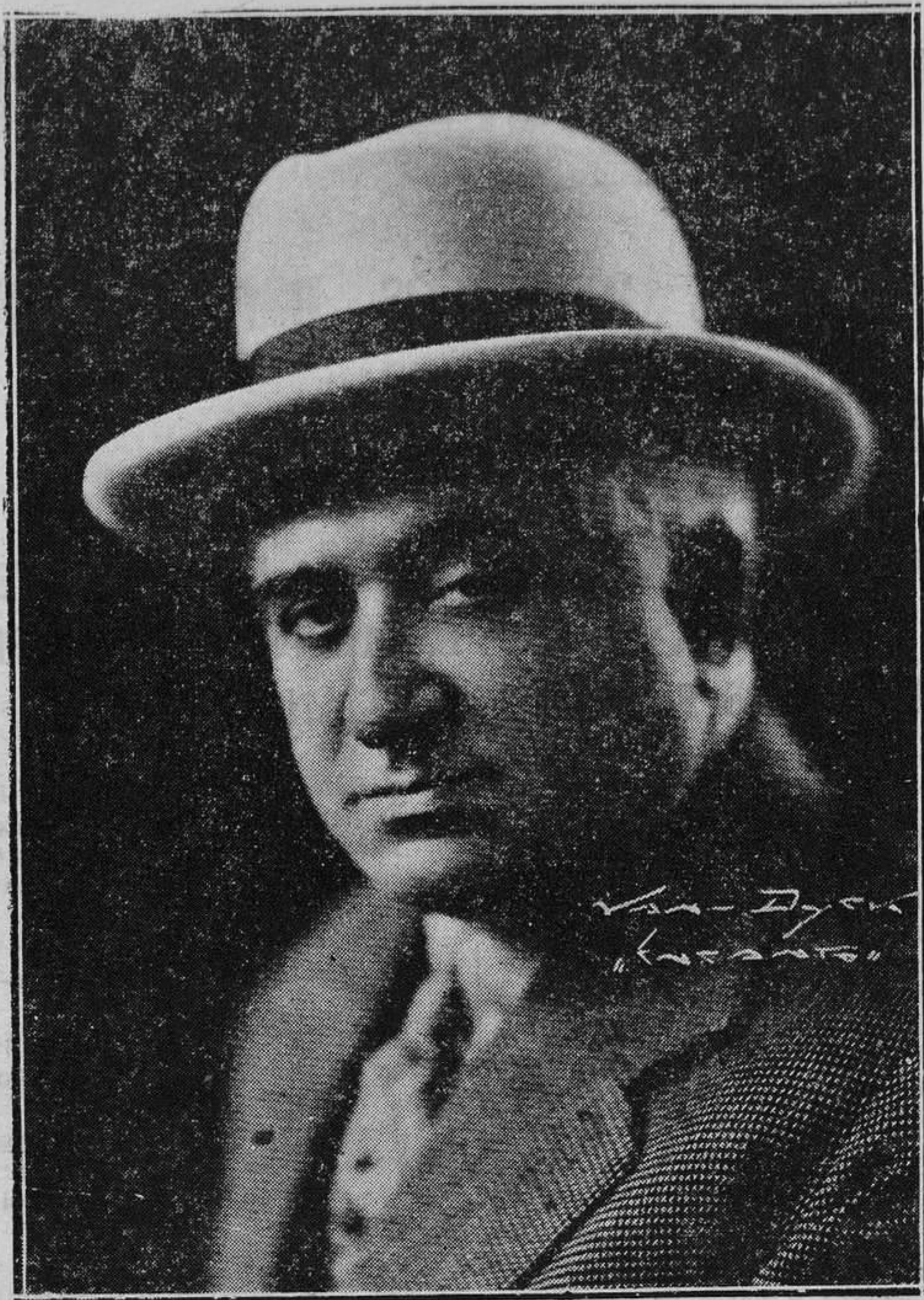
El ilustre pianista asturiano don Benjamín Orbón, que mañana vendrá a Oviedo, donde la Orquesta Filarmónica de Madrid estrenará sus "Danzas Asturianas".

Quedan con papel a la liquidación a 165. Nortes quedan ofrecidos a 208 al contado y con dinero a 207. Hay dinero para Metros nuevas sin cambio y para Tranvías a 93. En alza de medio entero sobre el viernes.