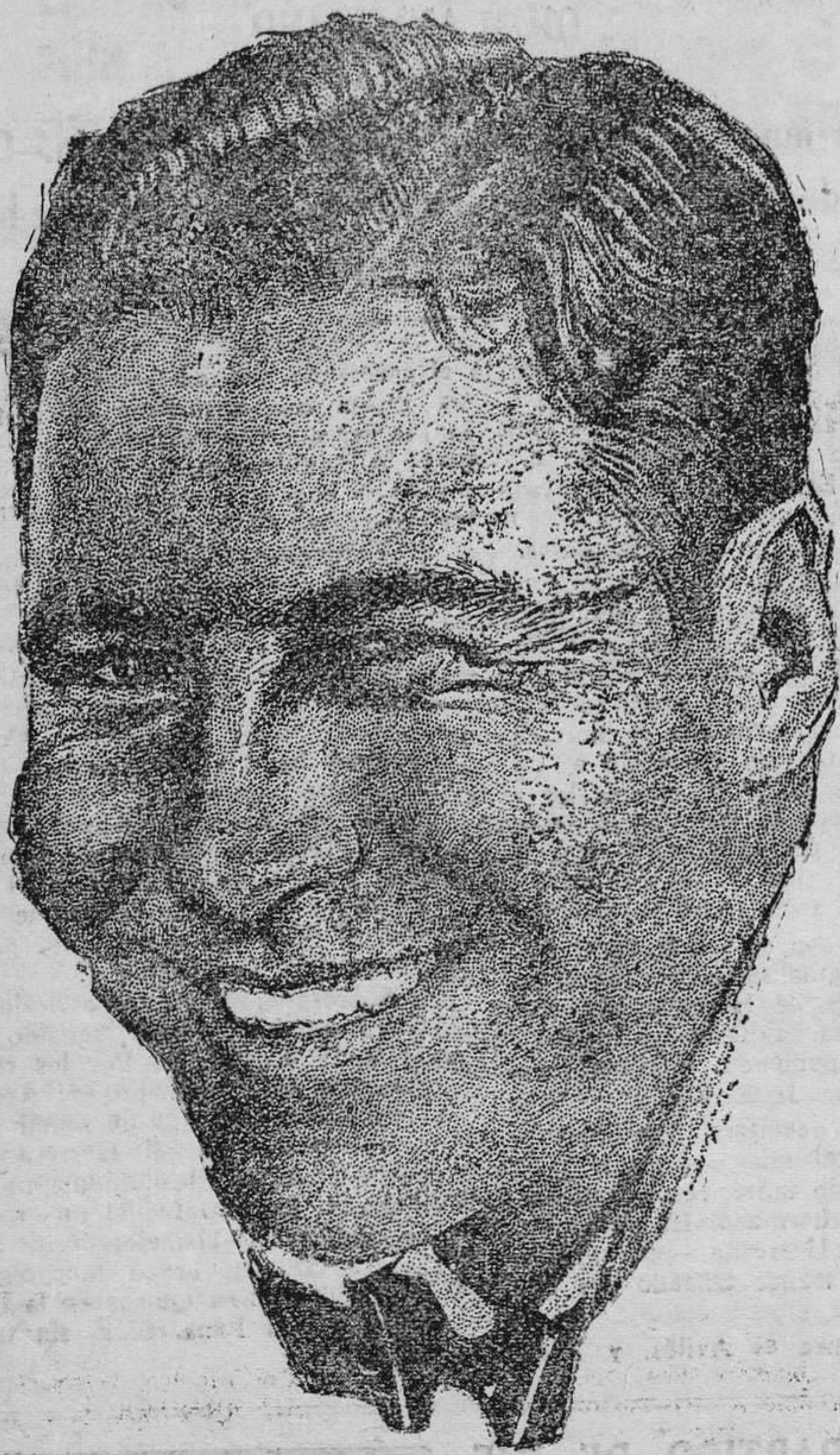
Jack Oakie, uno de los actores más graciosos de la pantalla moderna y de los que cuentan con la predilección de los públicos.