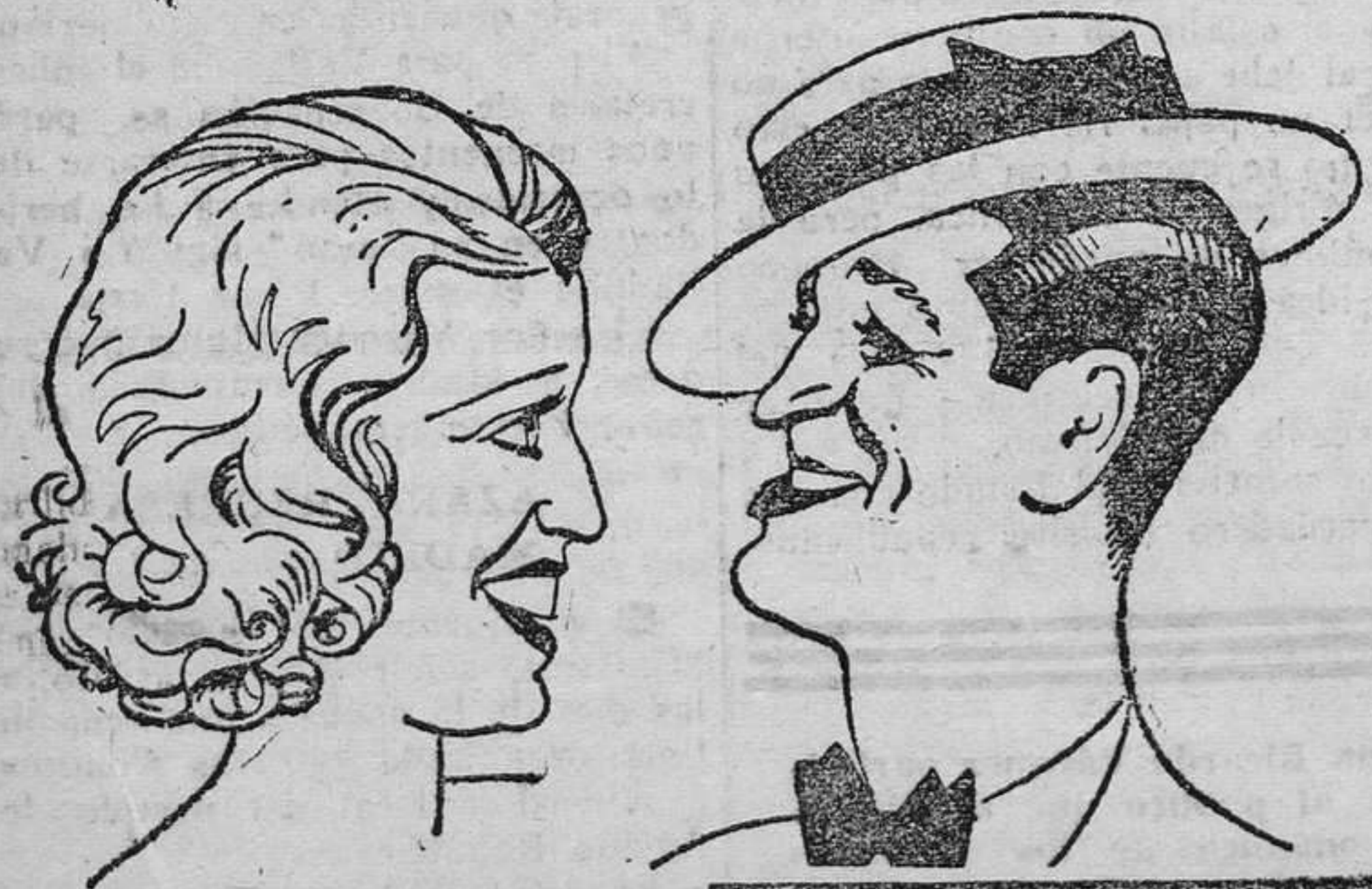
JEANNETTE MAGDONALD MAURICE CHEVALIER

A las 7 1/4. A las 10 1/2. Lleva cinco días en el cartel la película "Las luces de Buenos Aires", con Gardel, Gloria Gu- rán y Sofía Bozán, y los llenos son absolutos en todas las funciones. Hoy se proyectará nuevamente "Las luces de Bu- nos Aires". Pronto, "La Llama Sagrada", en español, y "Rey de los Frescos".