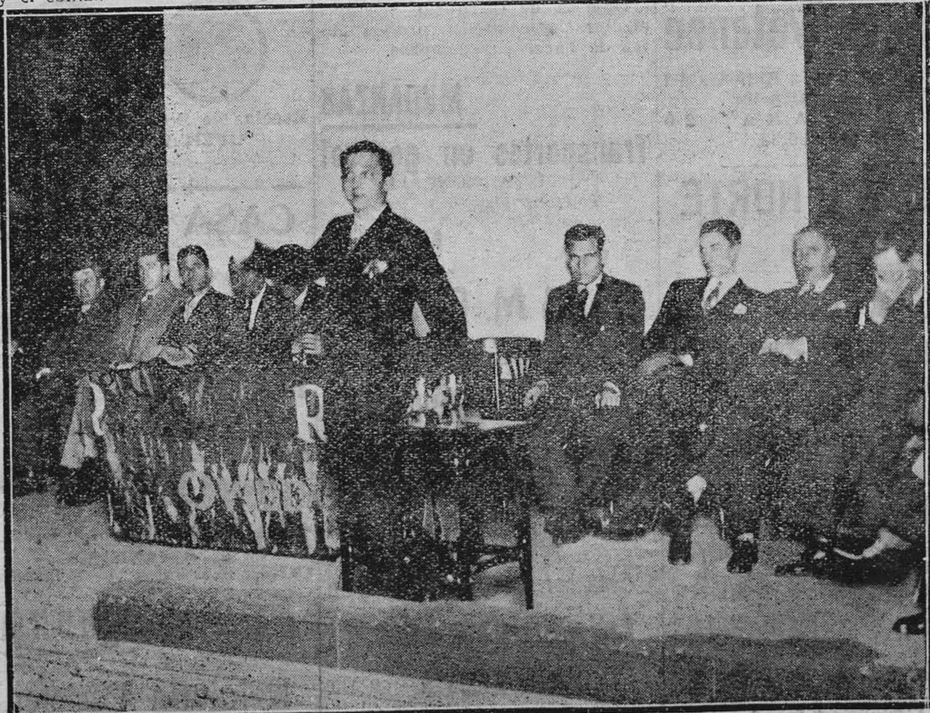
OVIEDO.—La presencia del mitin por eso celebrado el domingo en el Jovellanos por los radicales. (Foto Mena).

El miércoles regresarán el doctor y el comandante a Madrid.