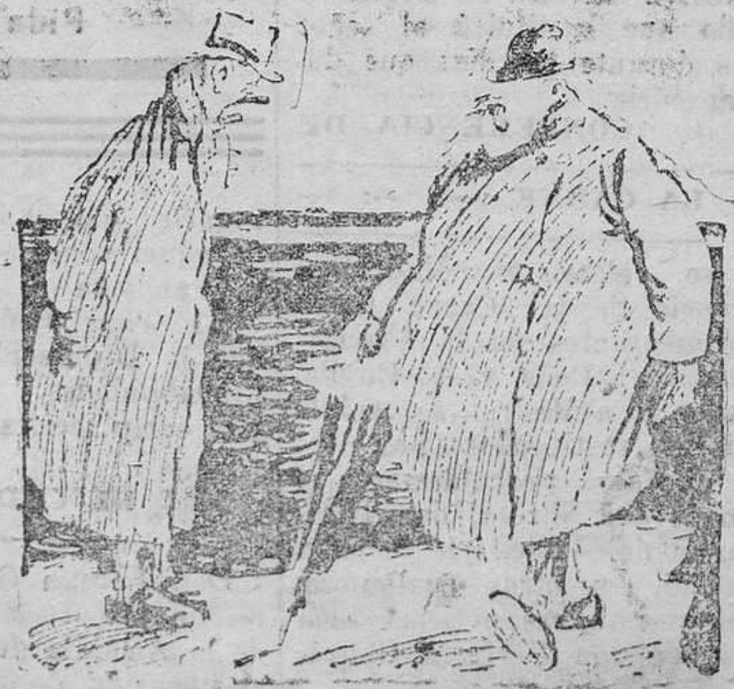
— Parecía que el mundo iba a cambiar. — Si es así, ¿por qué no vamos a hacer algo?