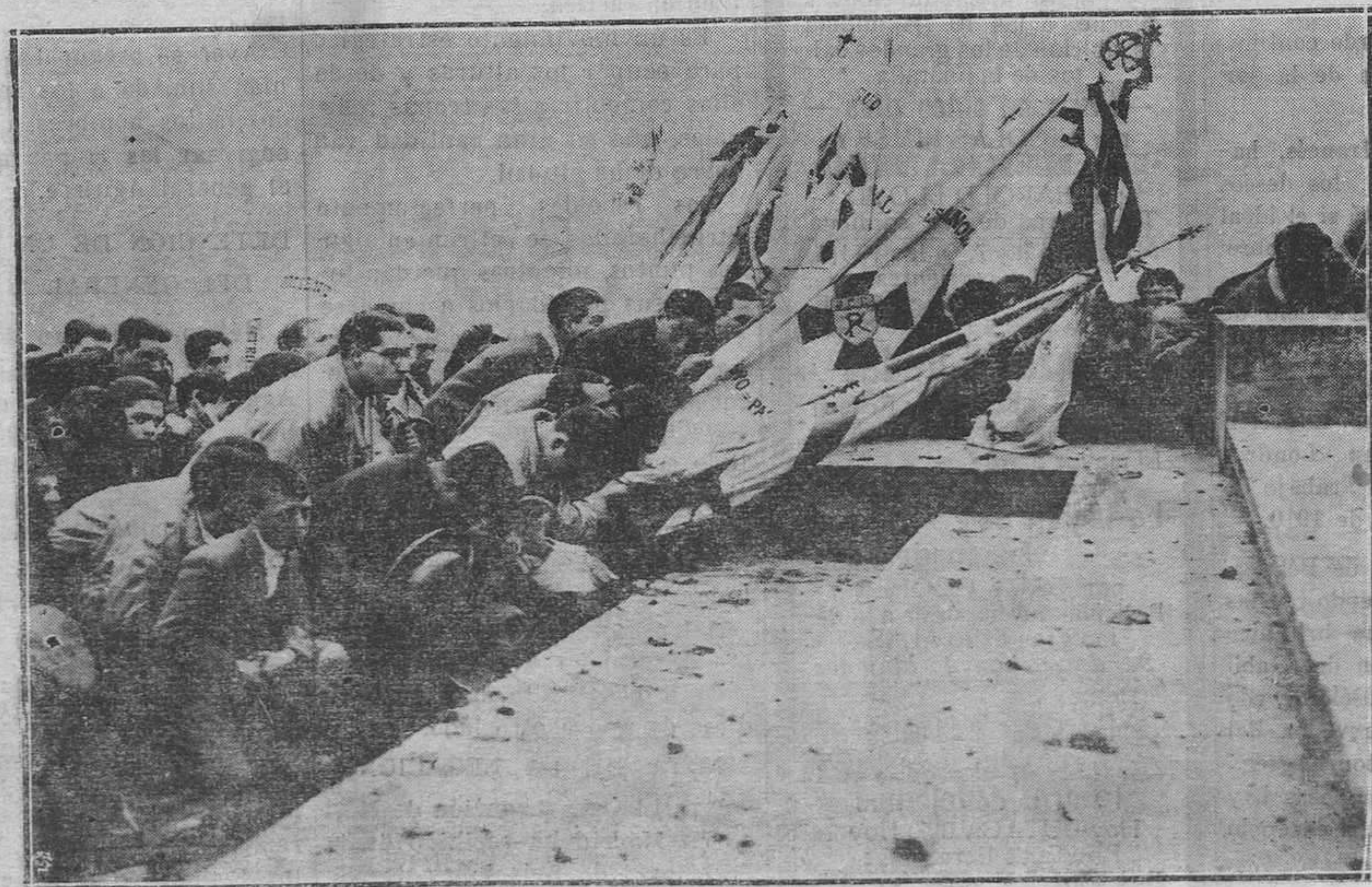
EN EL CERRO DE LOS ANGELES.—Un grupo de banderas de las Juventudes Católicas, en el momento de la elevación.

Los peritos hulleros que espera el Comité económico han de presentar sus observaciones, hechas más sobre la realidad del problema que sobre las saluciones que se ofrecen. Las empresas mineras se quejan de los déficits, pero hay que tener en cuenta antes de llegar a una cierta aplicación de los métodos de racionalización.