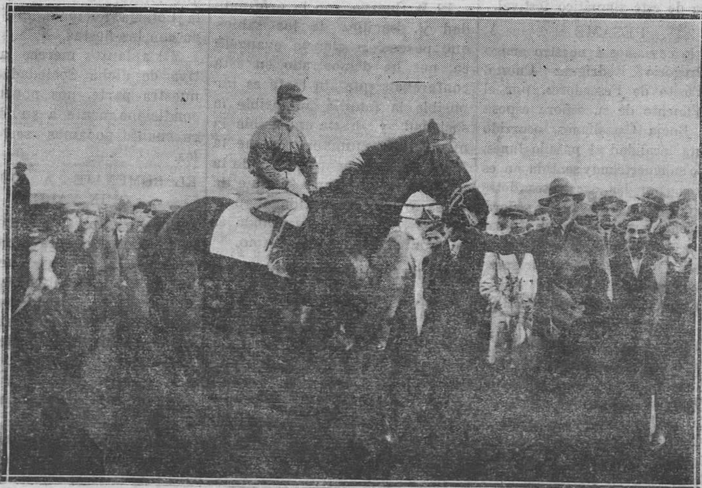
MADRID. — El caballo "Brownie", ganador del premio Sevilla, en el segundo día de carreras celebradas en la Castellana.

A su entierro celebrado el domingo 10, se formó numerosa