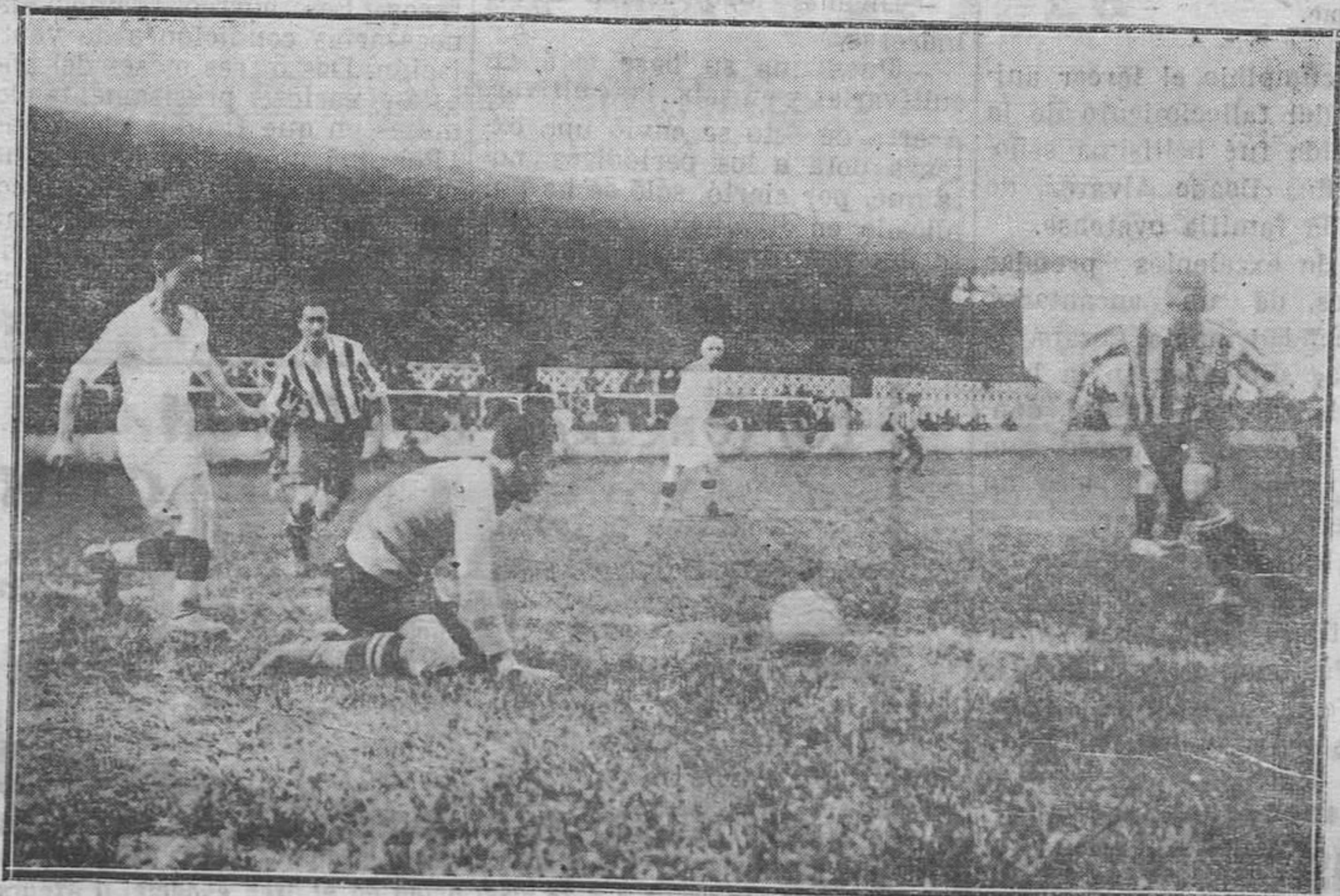
GIJÓN.—Un momento de apuro para el guardameta valenciano