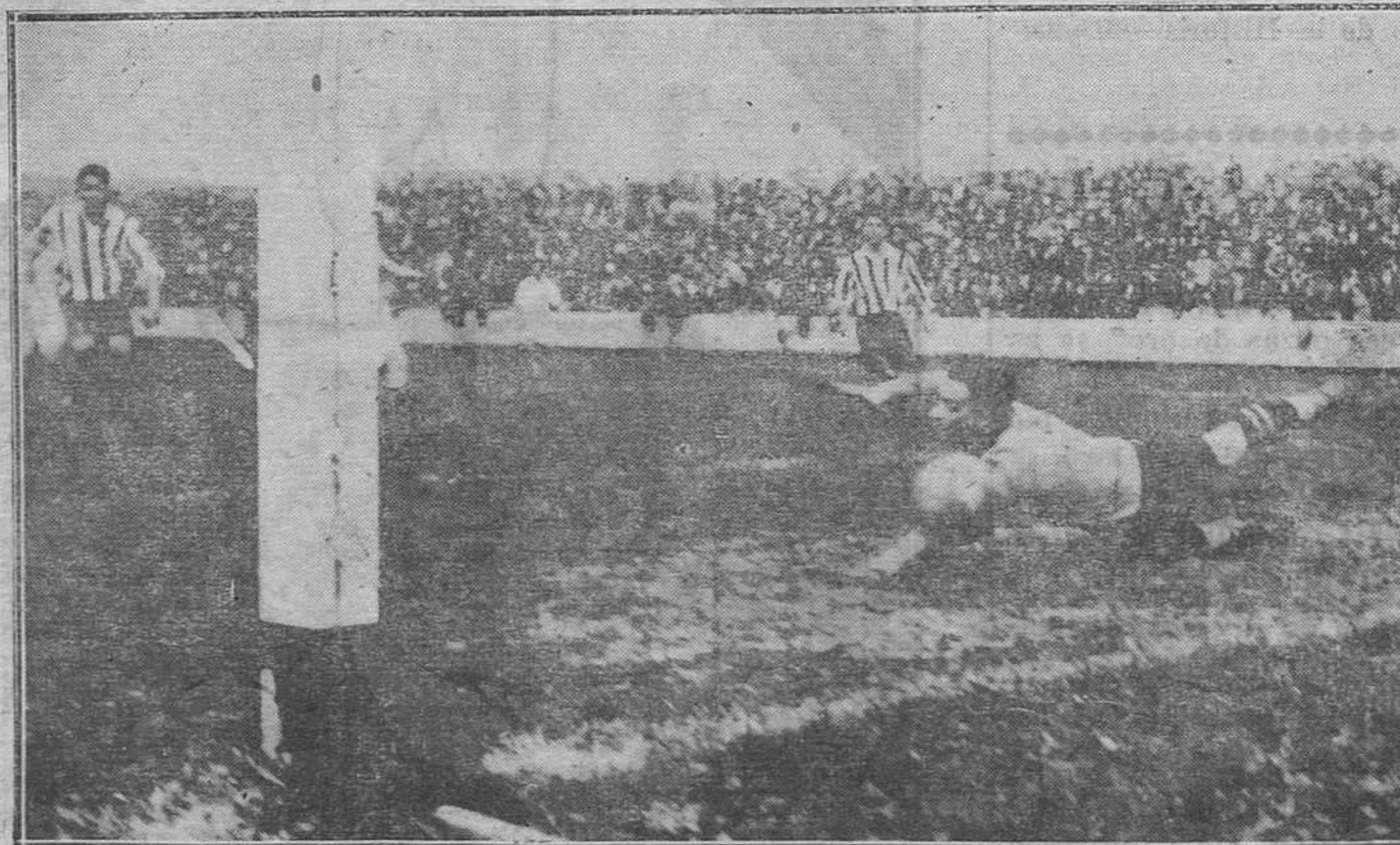
GIJON.—El segundo goal marcado por Campanal en el partido Sporting-Valencia.

GARAGE CENTRAL - Uria, 56 - OVIEDO - Telf. 3960