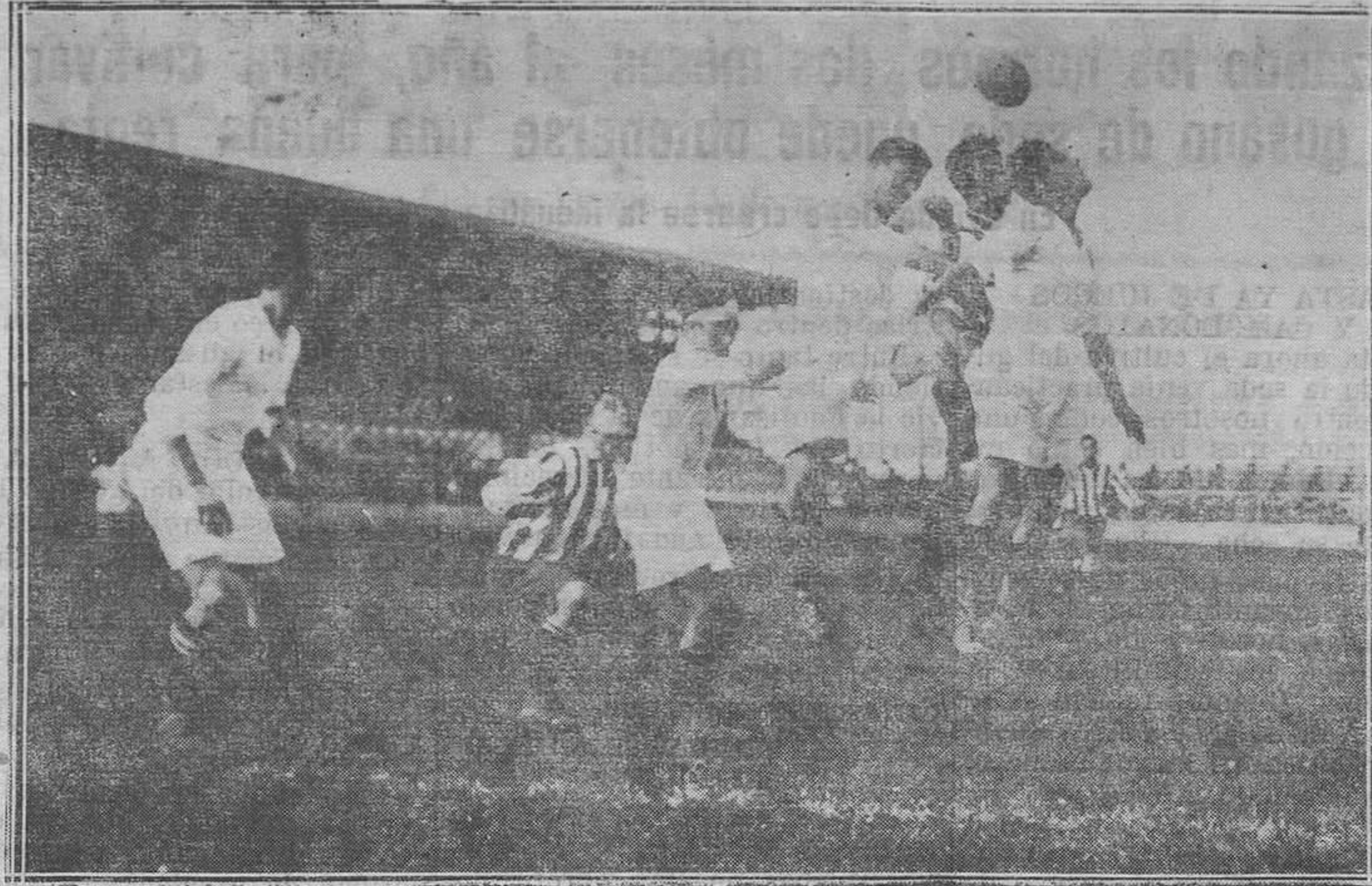
GIJÓN.—El remate de un corner en el partido Sporting-Valencia

Regresó de la Corte, el ex-señor del Reino don Indalecio