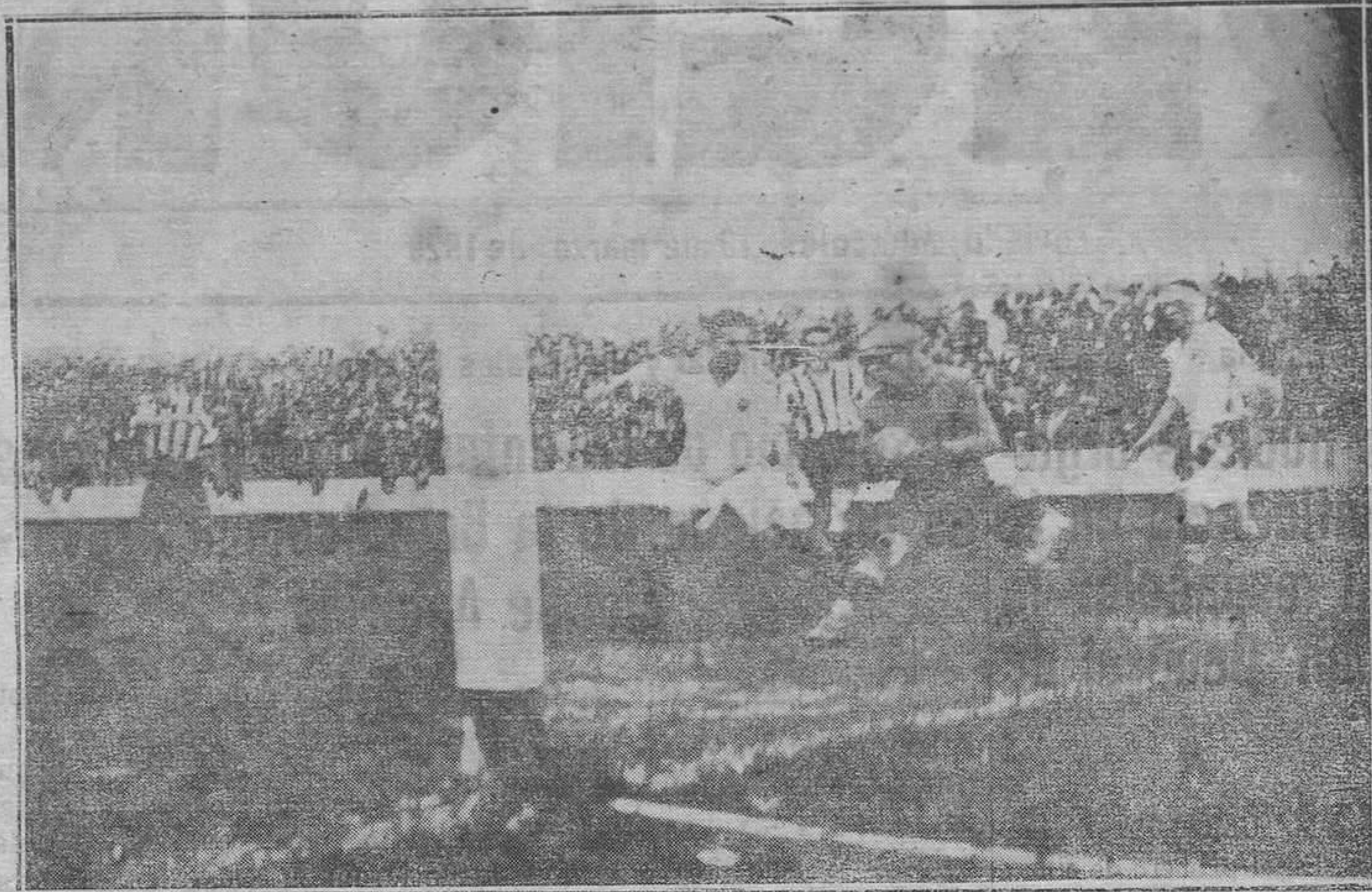
GIJON.—El portero gijonés esquivando la acometida valenciana.