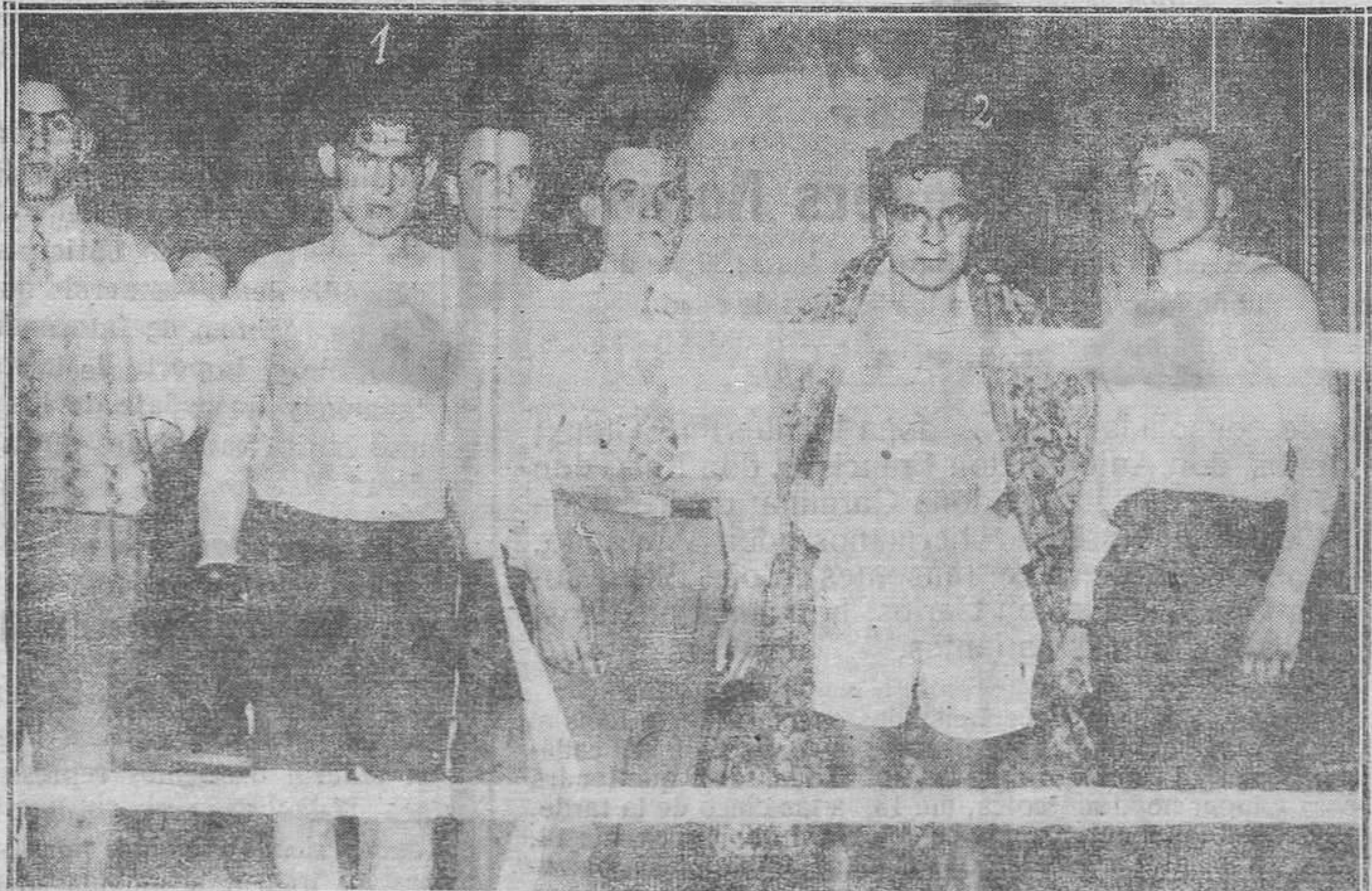
OVIEDO DE LA VELADA DEL SABADO EN EL PRINCIPADO.—La Pañera de Sabugo (1) que resultó vencedor en su lucha con Viejo (2)

"Índice de Libros".— Una revista mensual, que defalla todas las publicaciones de obras en castellano, dando, además, una síntesis, muy concisa, pero muy acertada, de cada libro.