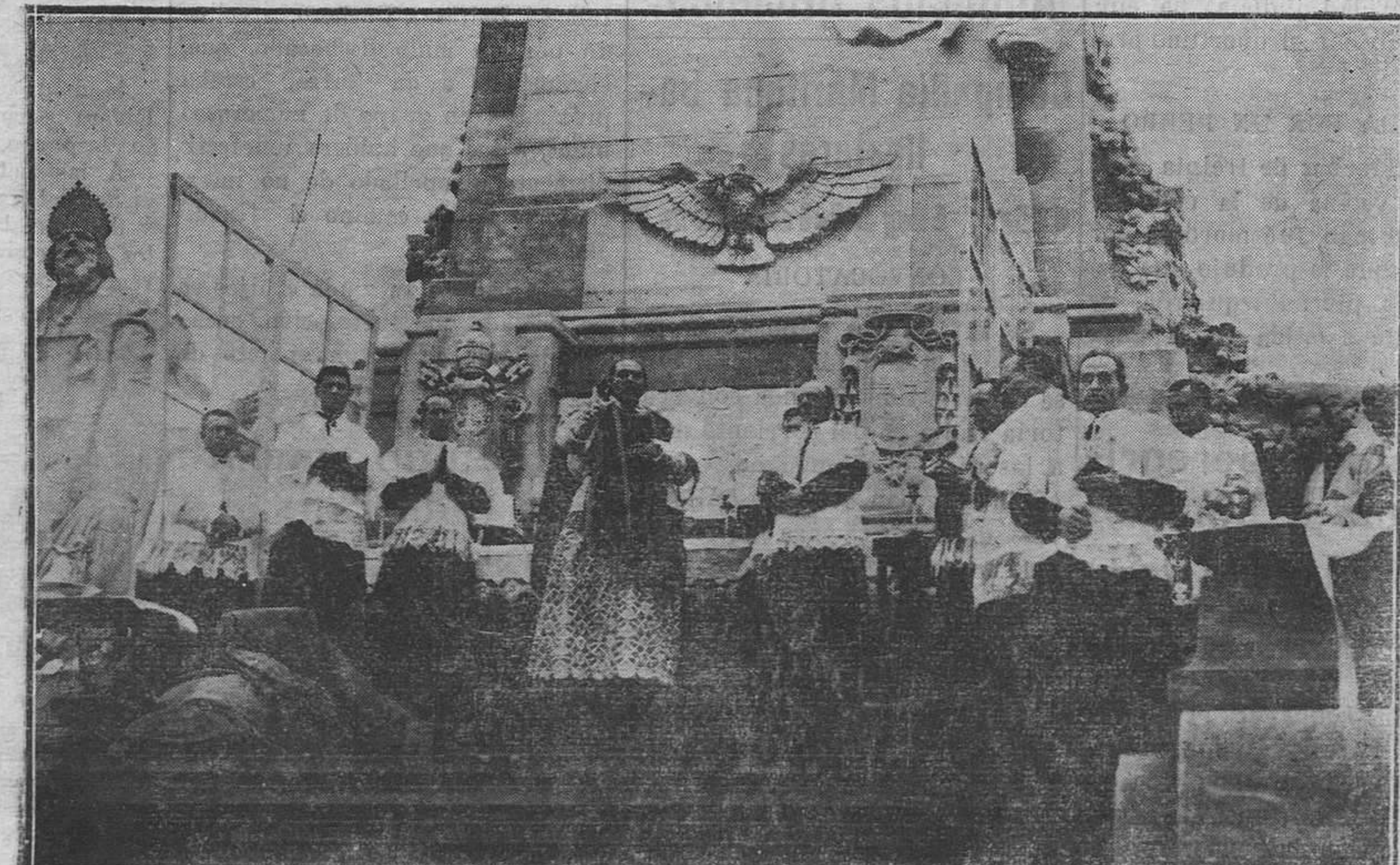
EN EL CERRO DE LOS ANGELES.—El cardenal Segura dirige una alocución a las Juventudes católicas