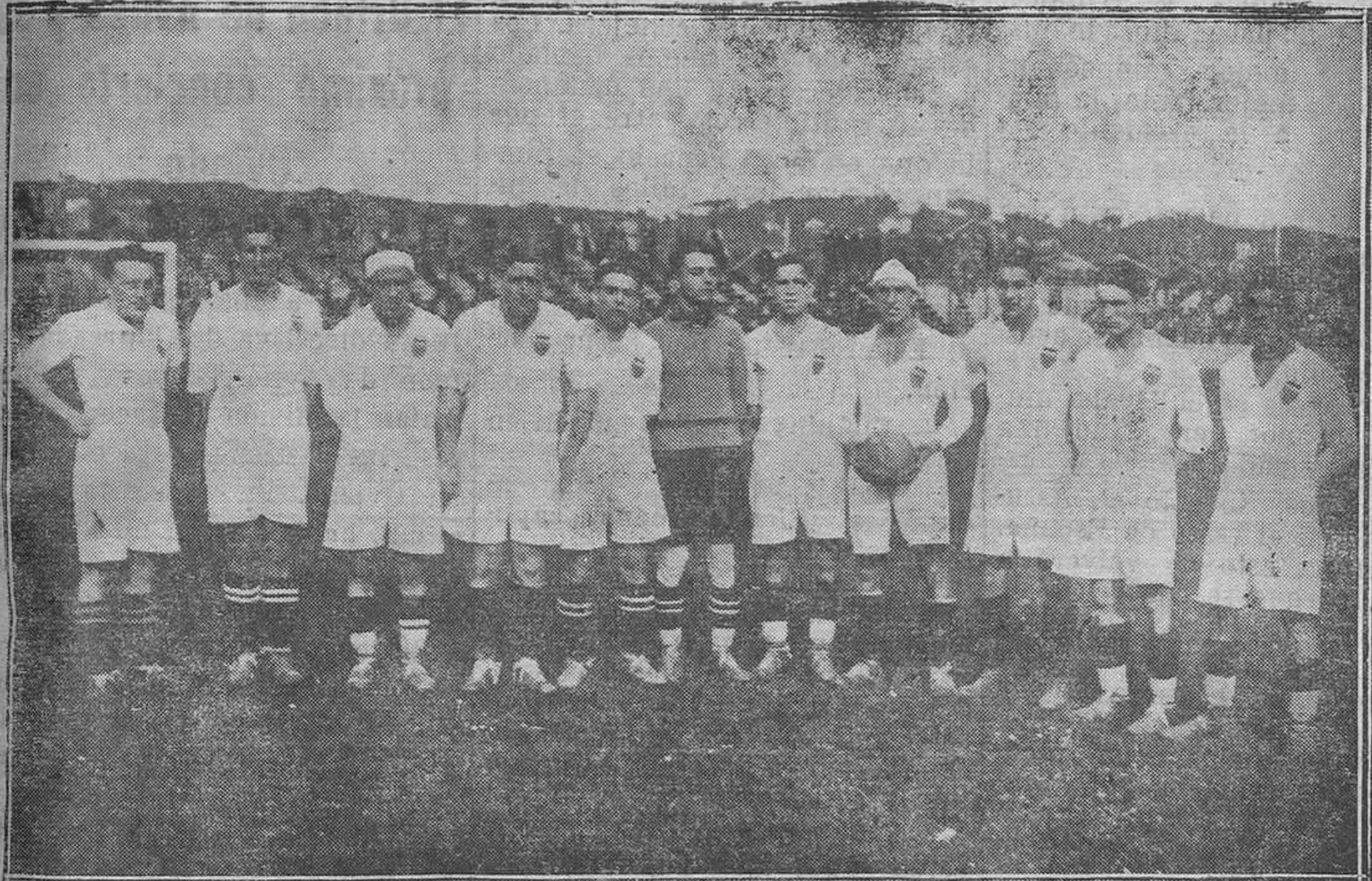
GIJÓN.—El equipo del Valencia que el domingo fué vencido en el Molinón por el Sporting

Grandes elogios se hacen a esta nueva Junta, compuesta por prestigiosas personas, de las cuales es de esperar que dado el entusiasmo que en ellas siempre reinó en pro de esta popular sociedad, sea una realidad muy pronto, las aspiraciones de los años tan altruistas inspiradas por sus fundadores.