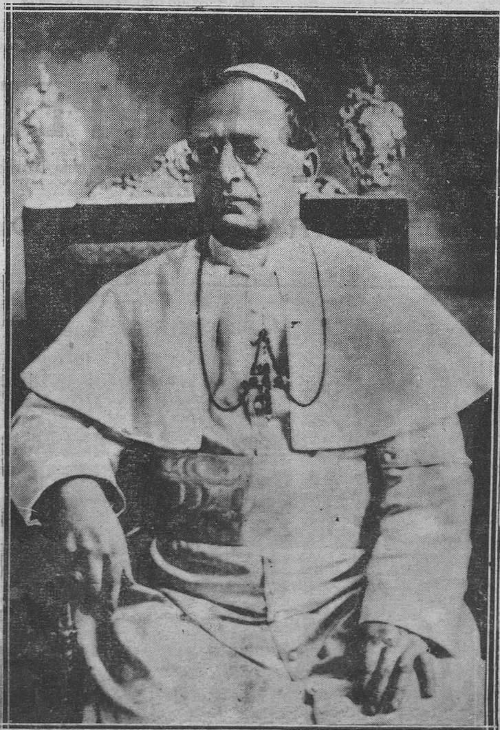
Su Santidad Pío XI

Si no se cambian procedimientos, ¿qué importa que el médico encargado de la asistencia de los enfermos, sea el más sólido prestigio del Cuerpo de Beneficencia Provincial? Fracasará mientras en su servicio no campe el lema del glorioso Azúa: "mucho aire, mucho sol."