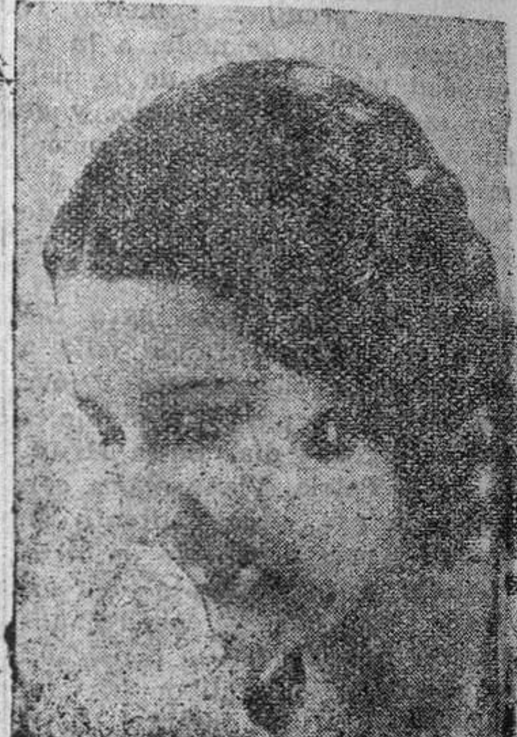
La simpatísimas y atrayente Imperio Argentina... Su voz, su sonrisa, su simpatía, han quedado grabadas en todos los públicos, que nuevamente la reclaman. Un poco de paciencia y la ya famosa "star" reaparecerá en su próxima producción, aún no terminada de filmar, "¿Cuándo te suicidas?".