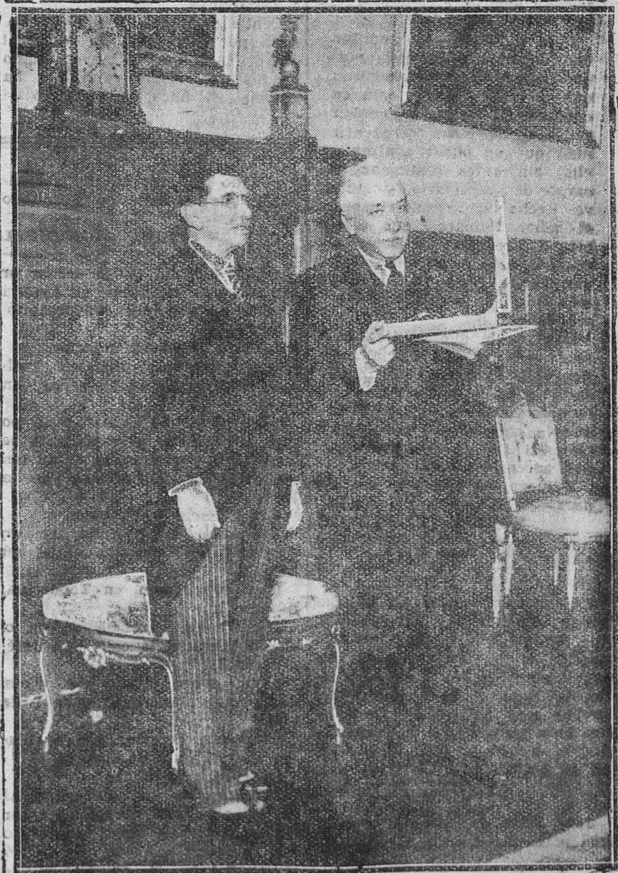
MADRID.—El presidente de la República recibe del ministro de Bolivia las insignias del "Gran Cordon", la más alta condecoración boliviana, que le ha sido otorgada por el Gobierno de Bolivia.