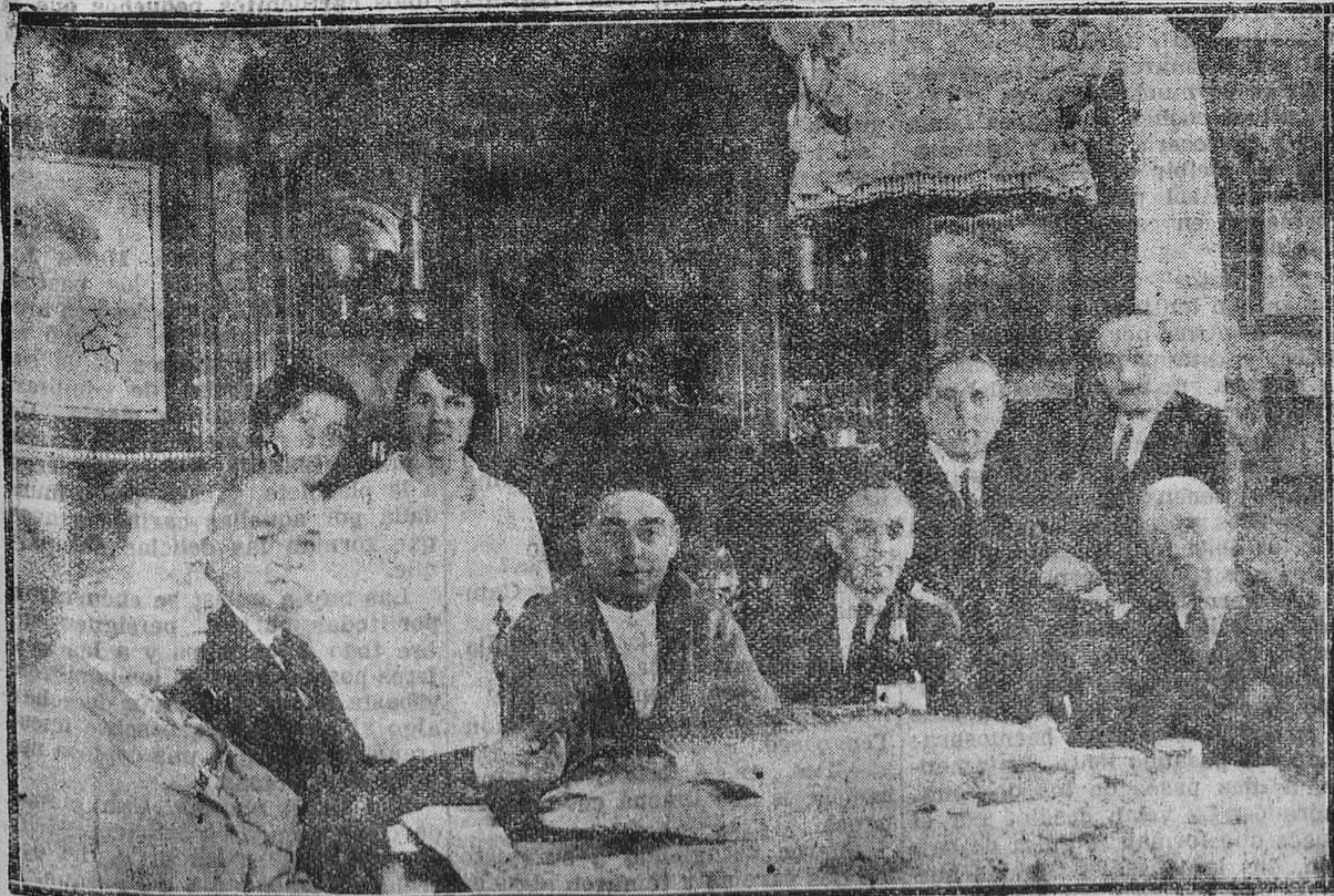
OVIEDO.—Un grupo de conocidas personas en torno a un magnífico ejemplar de quinientos kilos de peso. (Foto Klark).

Como REGION no hizo más que recoger una denuncia formulada en un centro oficial cremos que compete a los tribunales aclarar lo que de cierto hay en la cuestión.