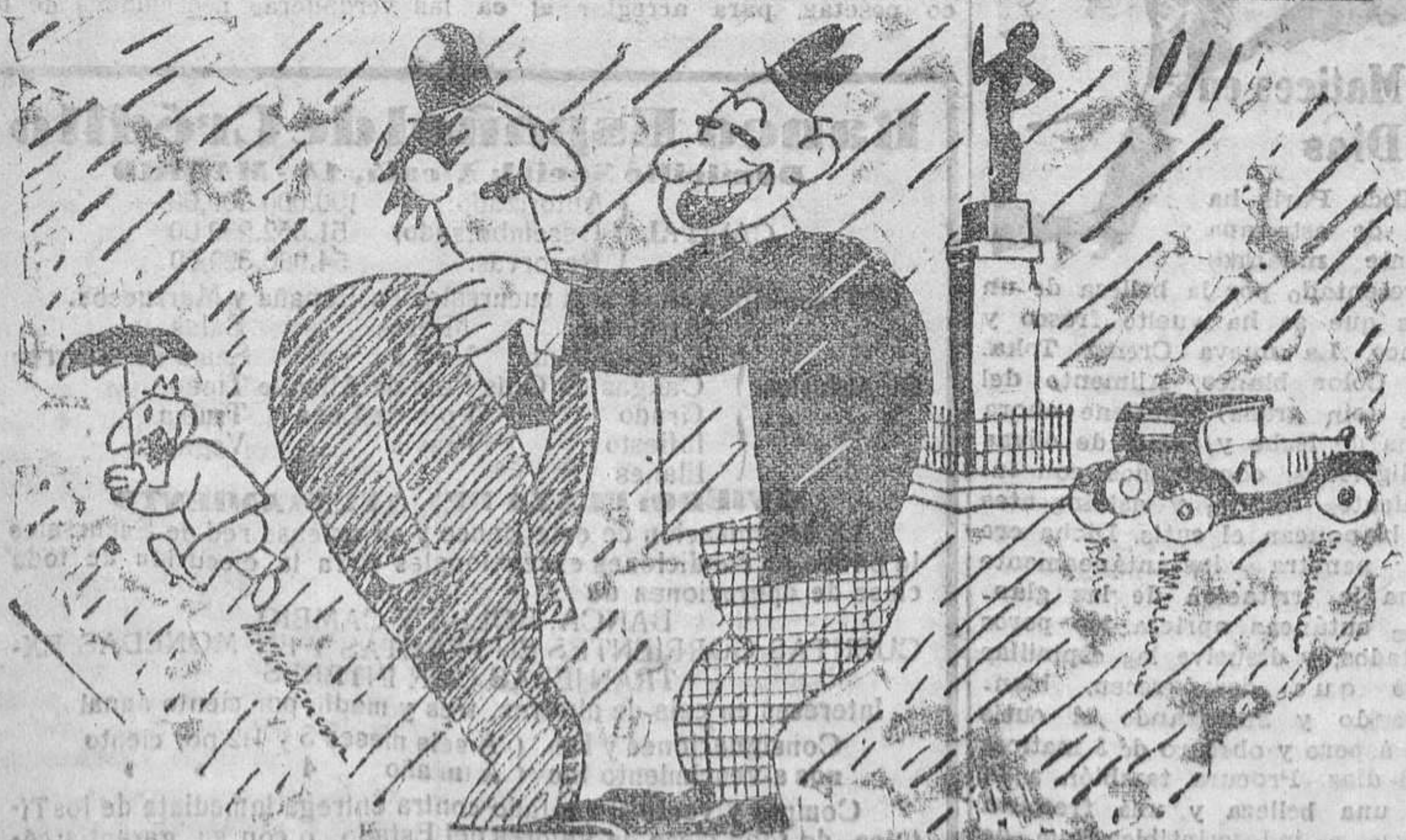
—¿Cuánto envidia a los habitantes de la América del Sur! Allí, aunque llueva, no se mojarán. —Hombre, ¡porque tienen el Paraguavi!

(De la colección de "La Unidad" en la biblioteca de la Universidad).