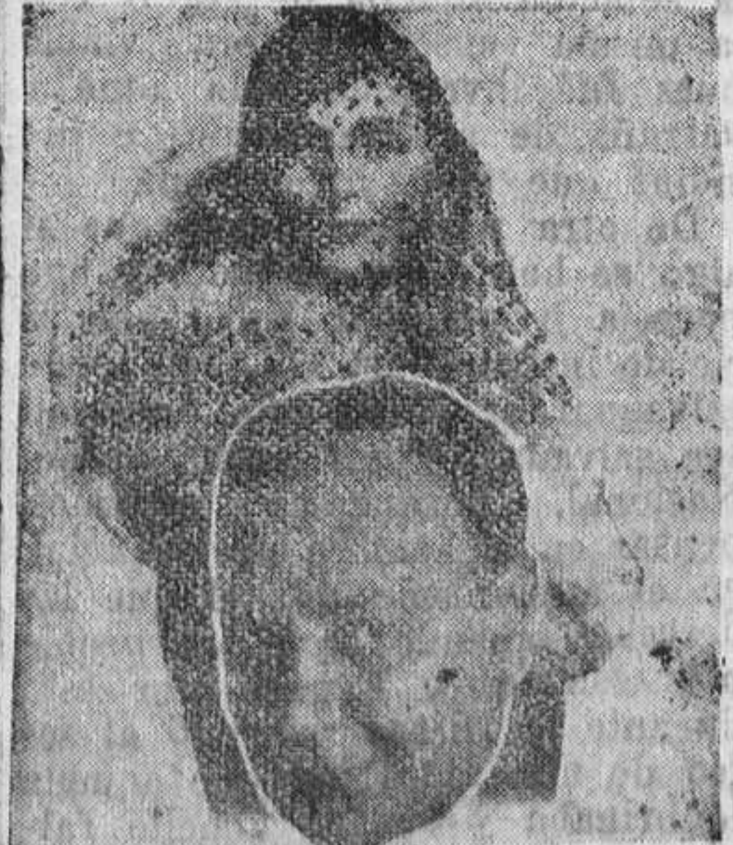
Marlene Dietrich y Emil Jannings, dos actores alemanes, dos actores geniales de la pantalla, son los protagonistas de "El ángel azul". Primera y última producción en la que actuaron juntos.

Para sustituir a viejo Lon, ha sido designado Wallace Beery, un buen actor, un formidable actor de carácter, que por uno de esos misterios de directores y "studios" permanece alejado de los públicos.