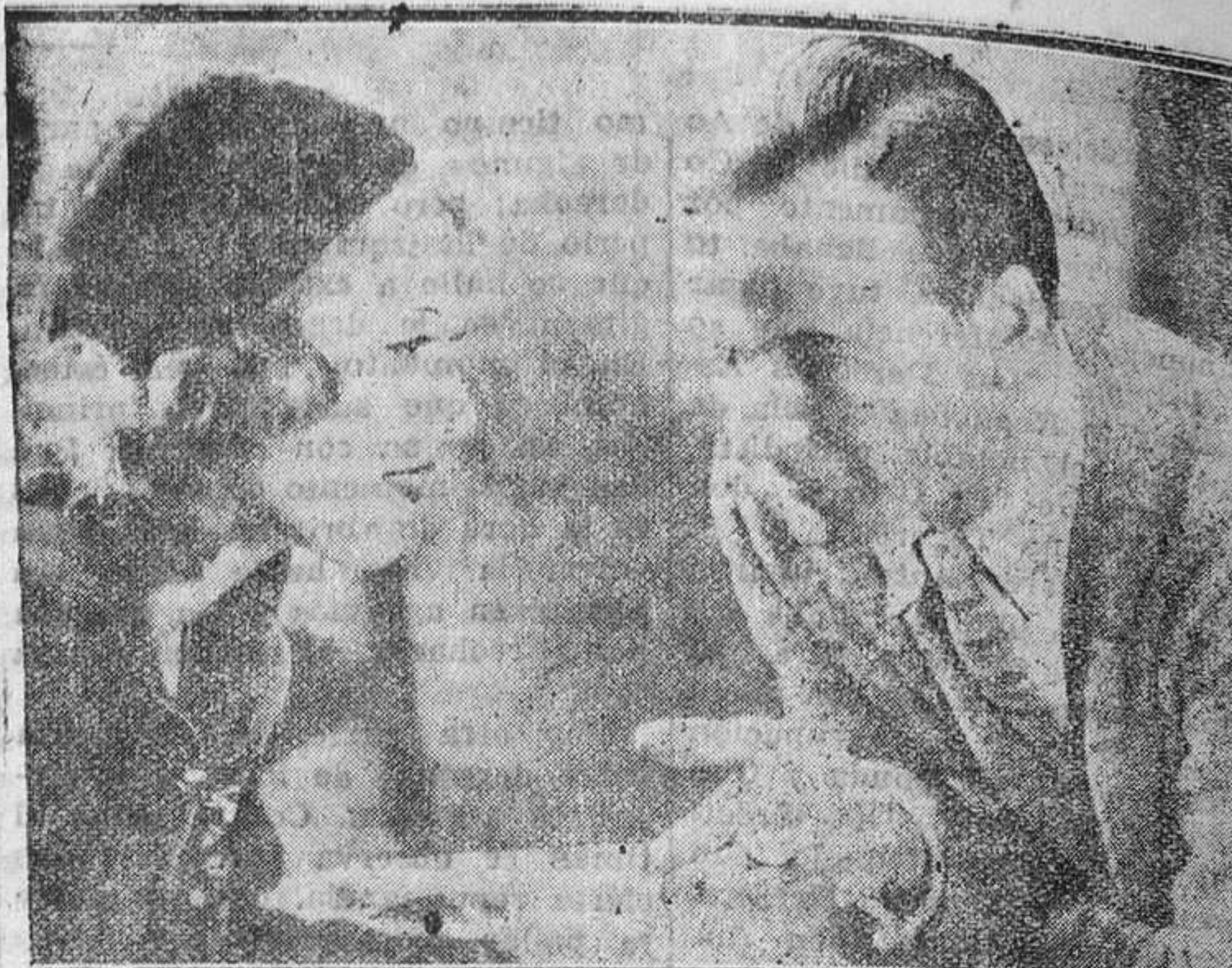
La encantadora y graciosísima Ancy Ondra no descansa... ni deja descansar a los estudios alemanes. En su última producción, "Una amiguita como tú", la deliciosa muñeca del "cine" alemán admira por su arte rebosante de alegría.