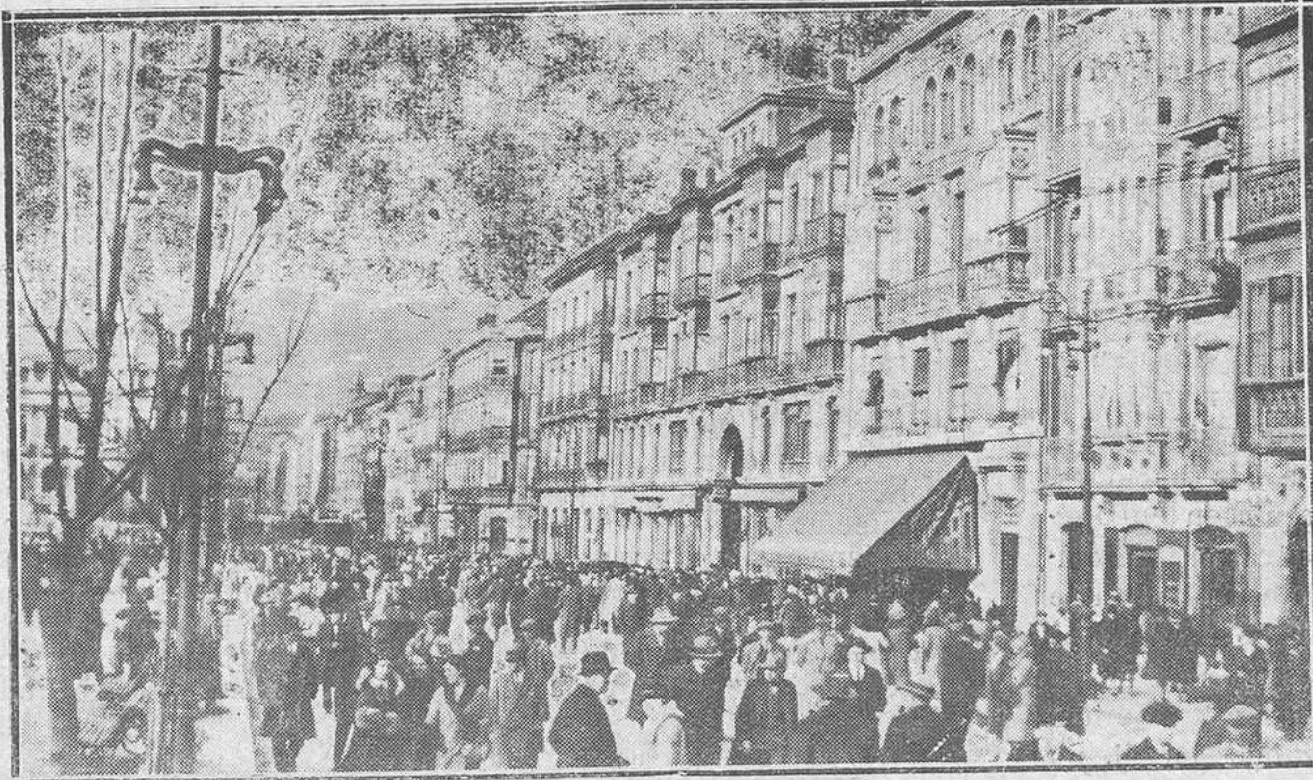
OVIEDO. — El paseo de mediodía en la calle de Uría.