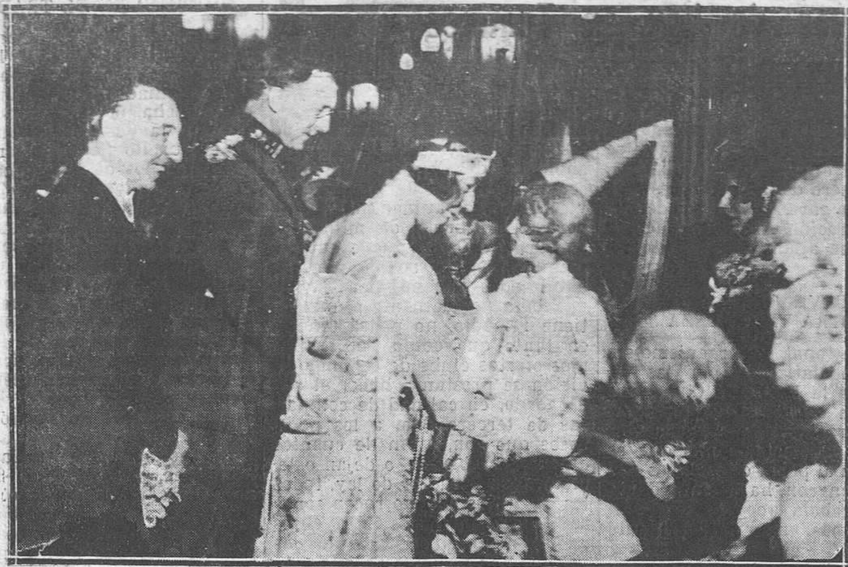
BRUSELAS. — S.S. M.M. los Reyes de Bélgica conversando con aristocráticos niños que han asistido al gran baile celebrado por la sociedad "Gran Armonía".

—Vamos a ver, niña, si te presentas a ese concurso en que van a elegir la mujer más bella de