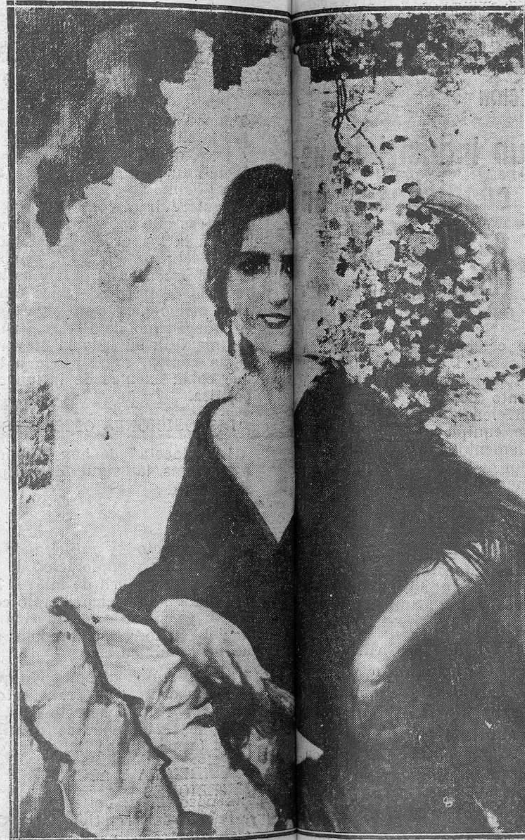
Exposición quiteriana. "Canción Manuel Benedicto"