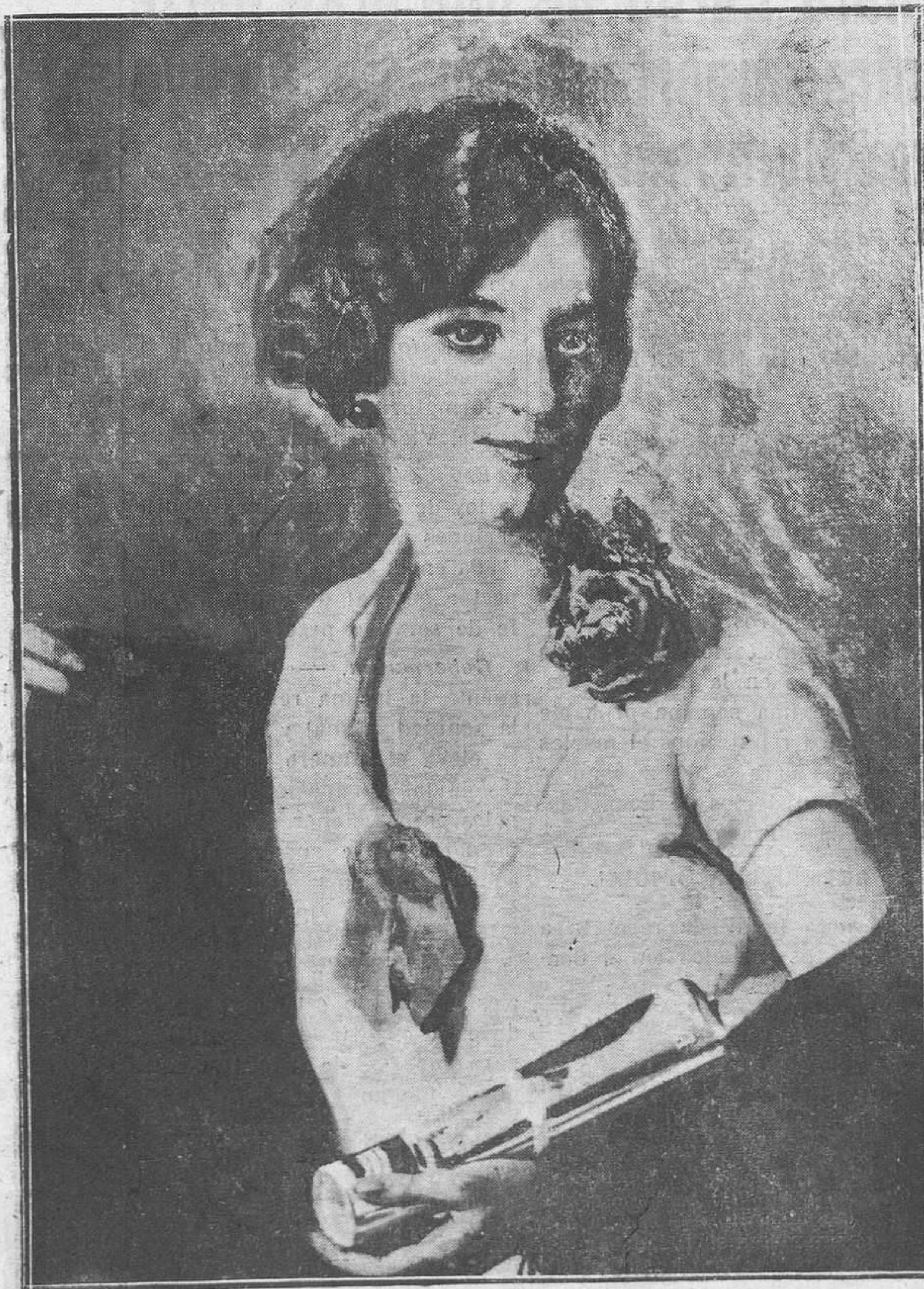
Exposición quiteriana. "Pipiola", por Juan Francés.