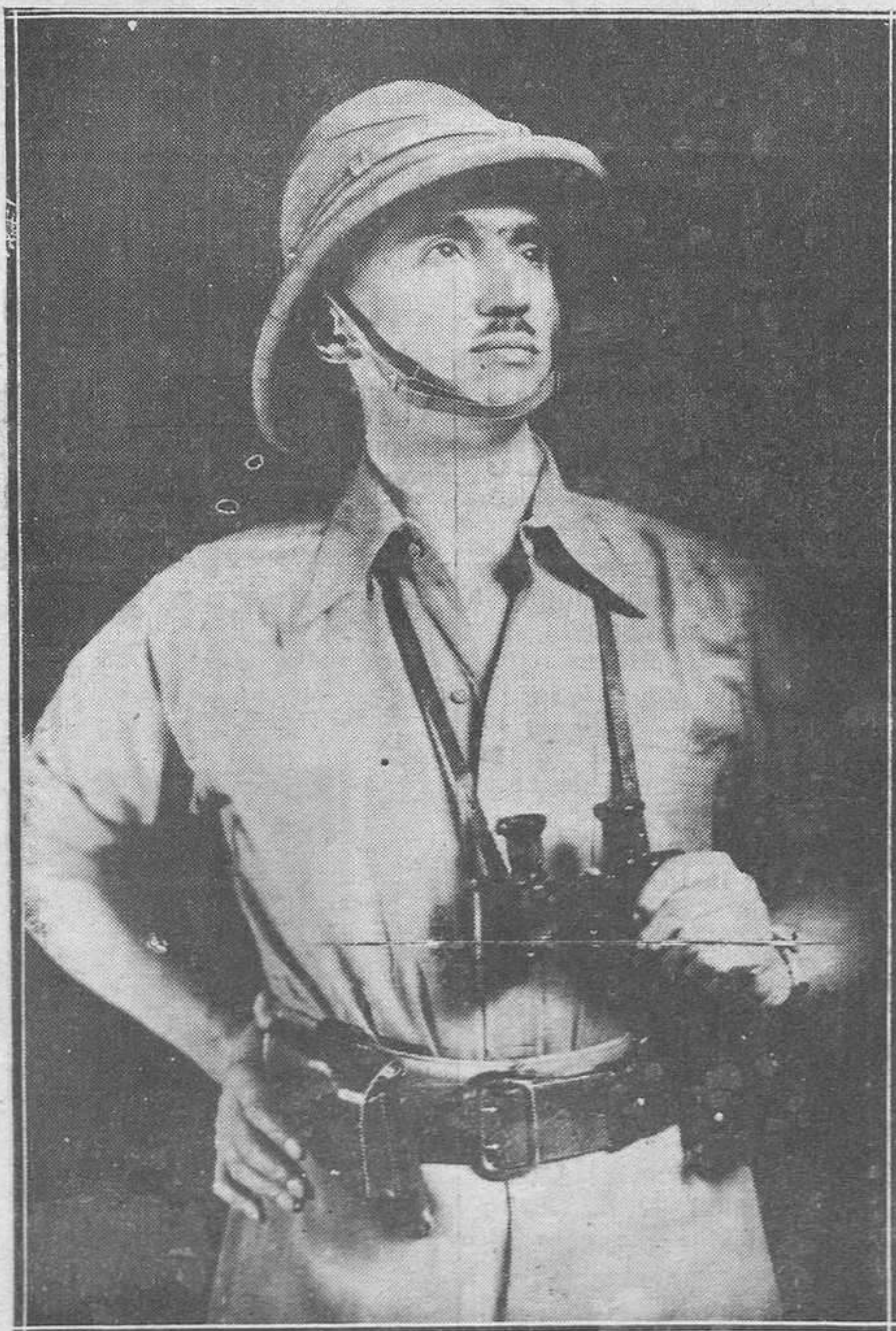
El príncipe Sixto de Borbón, que está efectuando un viaje a través del desierto de Sahara, para estudiar el itinerario más directo y favorable para el recorrido "Alger-Lago Tchad". La misión, al frente de la cual va el príncipe Sixto de Borbón, ha llegado ya a Tamarrasset, en donde ha colocado una lápida conmemorativa en el monumento de Leperrine y Foucault, en presencia de Amenokel, "goum" de los Tonareg.

Terminó diciéndoles que esperaba contar con ellos si algún día la Patria los necesitase.