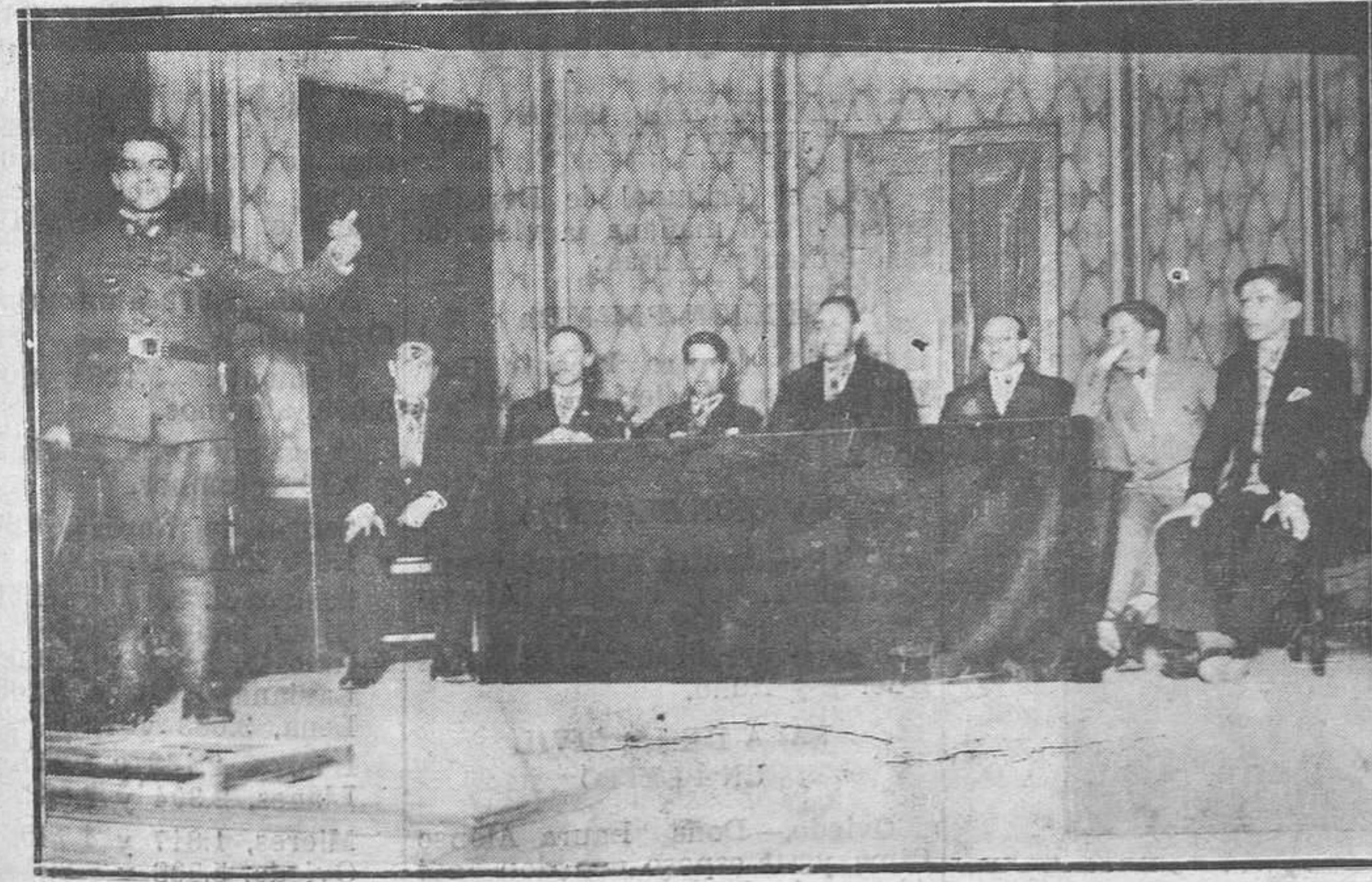
GIJON.—El presidente de la Federación de Juventudes Católicas Asturianas, durante el discurso del mitin celebrado en el Salón Ideal.

TODOS LOS AVISOS AL Teléf. n.º Servicios de ELECTRICIDAD: 1415 Servicios de GAS: 1415 Pedidos de COK: 1415 Sociedad Popular Ovetense