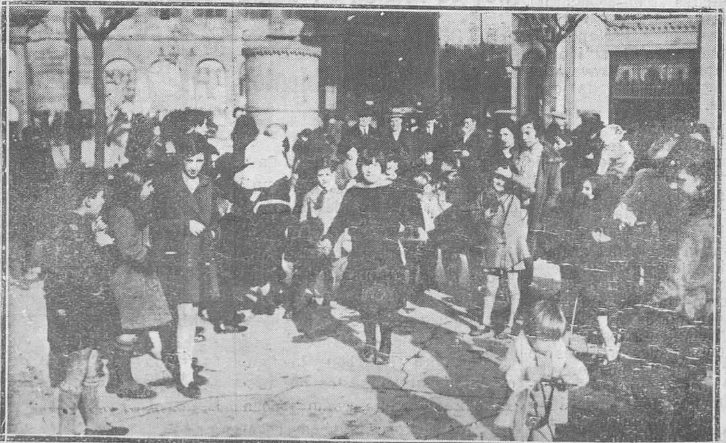
OVIEDO. — Tomando el sol en la Plaza de la Escandalerá.

A todos ellos asistió, convenientemente, el médico de Cudillero, don Carlos Riaño, quien dispuso que luego se les trasladase al Hospital de Avilés, donde se encuentran.