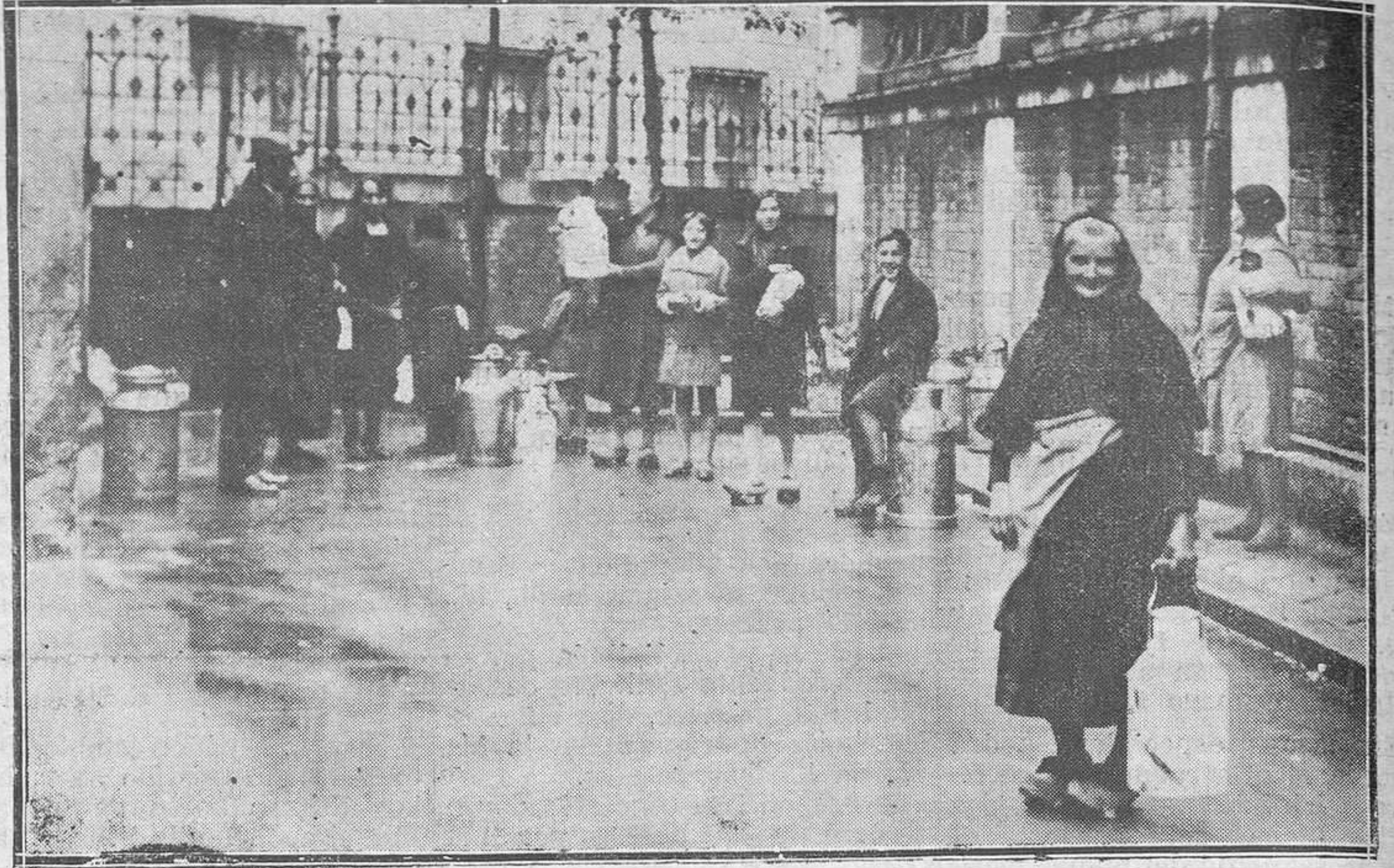
OVIEDO.—Aunque no lo parezca, esto es el actual mercado de leche.

La Alcaldía les contesta que por tratarse de una barriada es tablecida en calle particular, esos y otros servicios urbanos corresponde establecerlos a los dueños de la finca en ella enclavada. El Municipio sólo se encarga de la conservación de los servicios cuando éstos se han entregado en debidas condiciones.