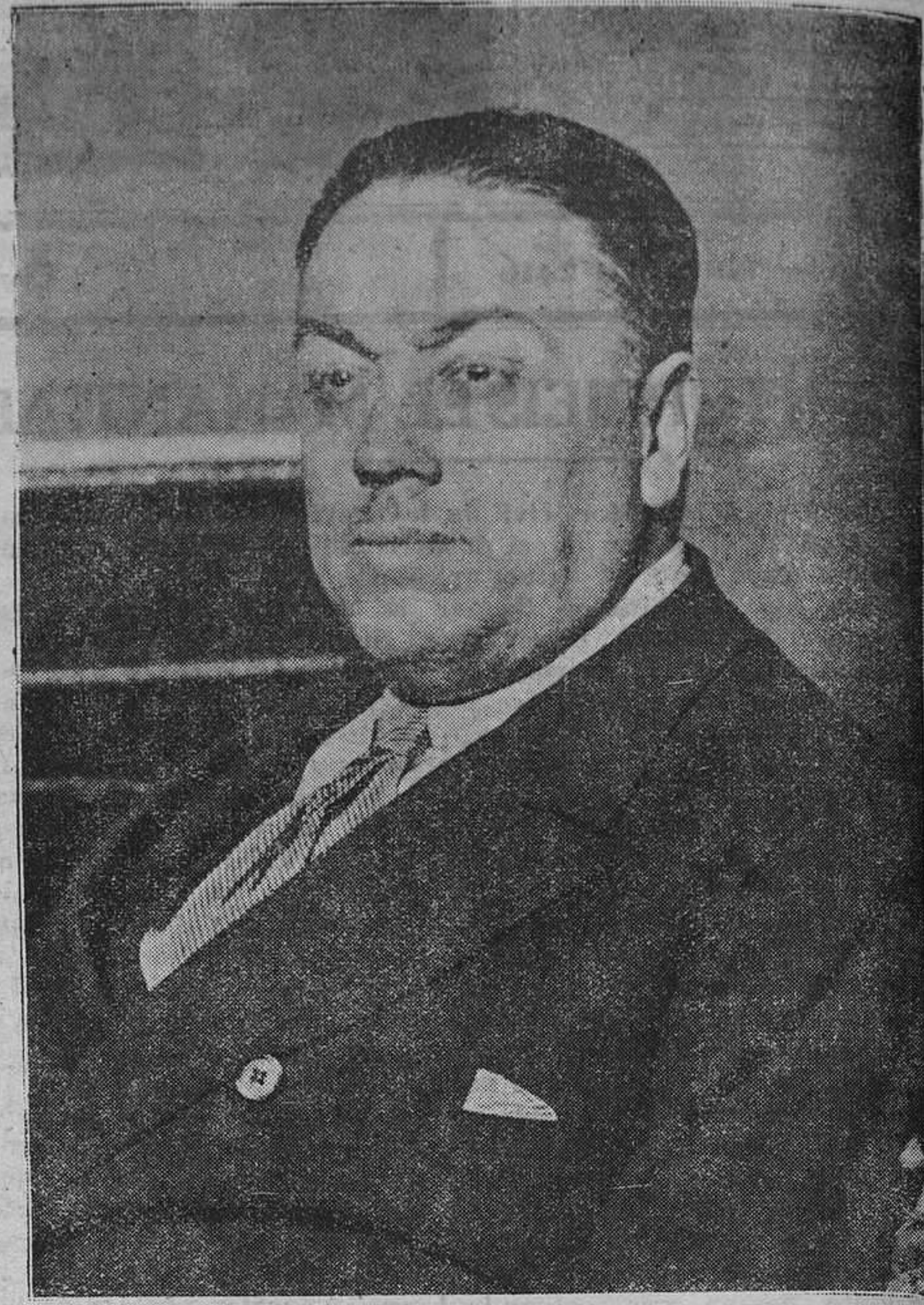
Señor Martínez Barrios, ministro de Comunicaciones y Ferrocarriles del Gobierno Provisional de la República.

Somos nosotros los que más hemos luchado por destruir el poder de la Monarquía y los que más hicimos por acelerar el ad- venimiento del movimiento que hoy vive el país. No podemos conformarnos con su estructura-