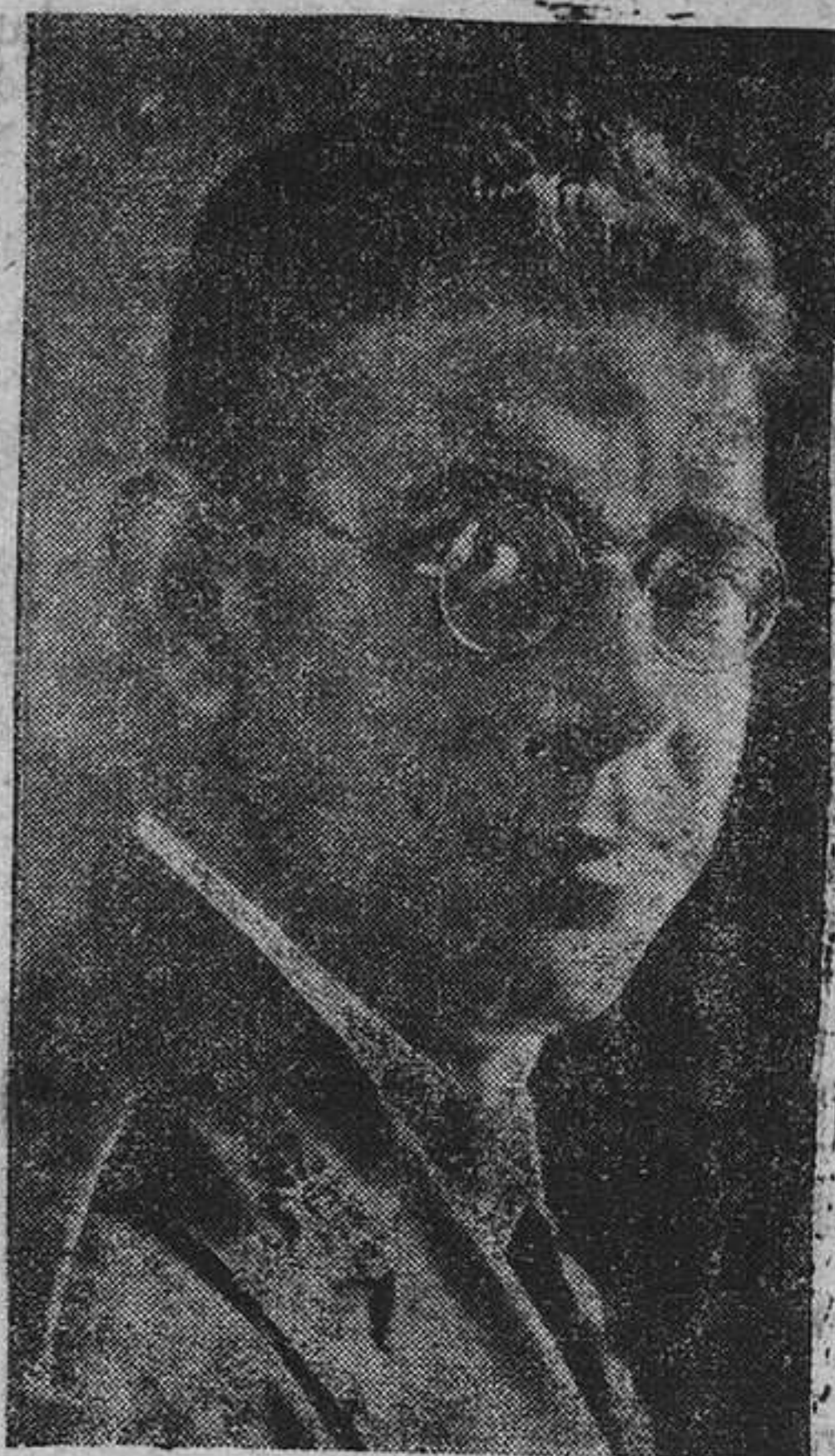
MADRID.—El general Mola, último Director general de Seguridad con la Monarquía, que ha ingresado en Prisiones Militares

Dijo también que se hallaba dispuesto a proceder en este asunto al igual que en los demás que se incoarán, con la máxima energía, pero dentro siempre de las prescripciones de la ley.