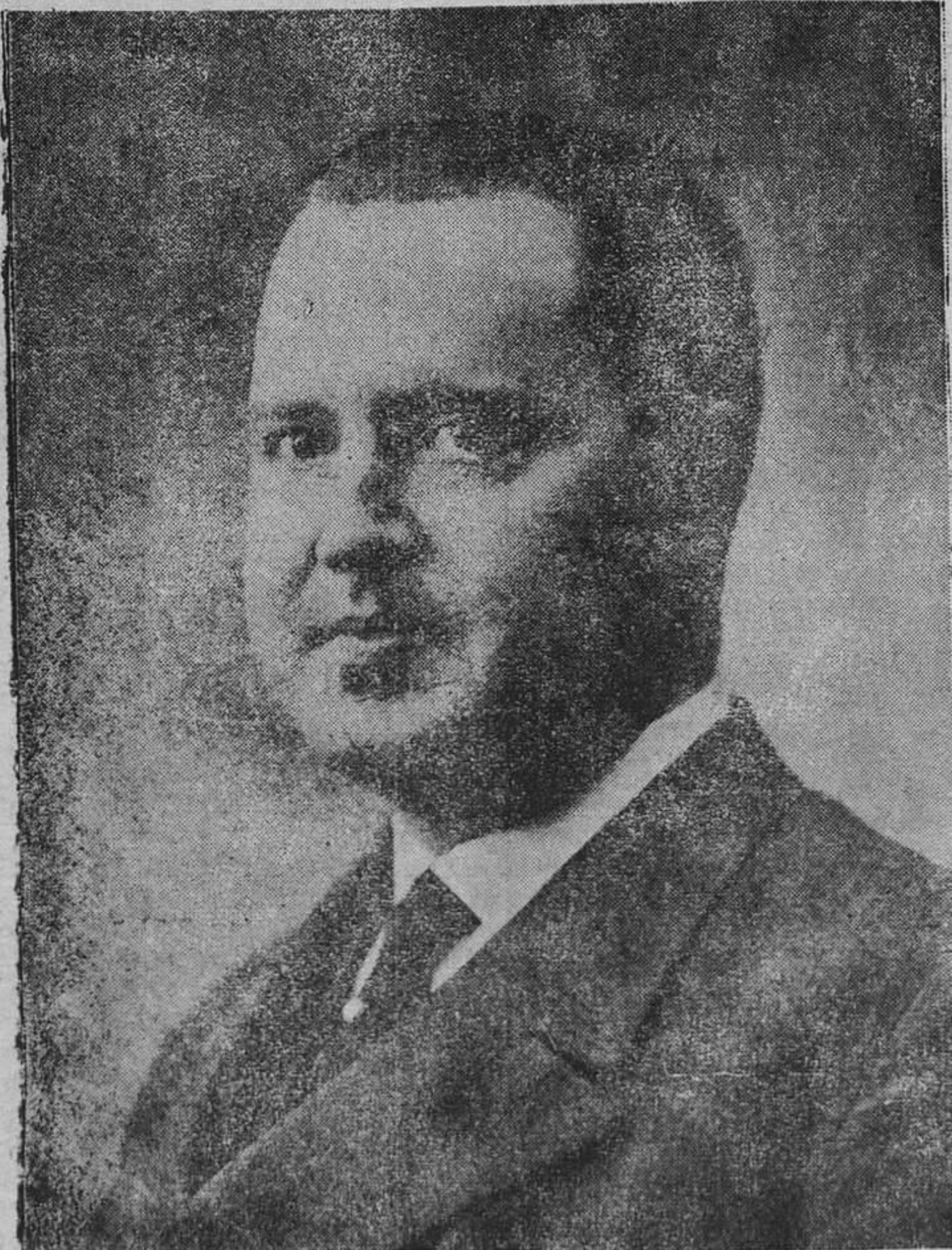
Don Angel Galarza, fiscal general de la República. (F. Vidal)

Por la Federación Comunista de Asturias.—EL COMITE RE- PUBLICANO.