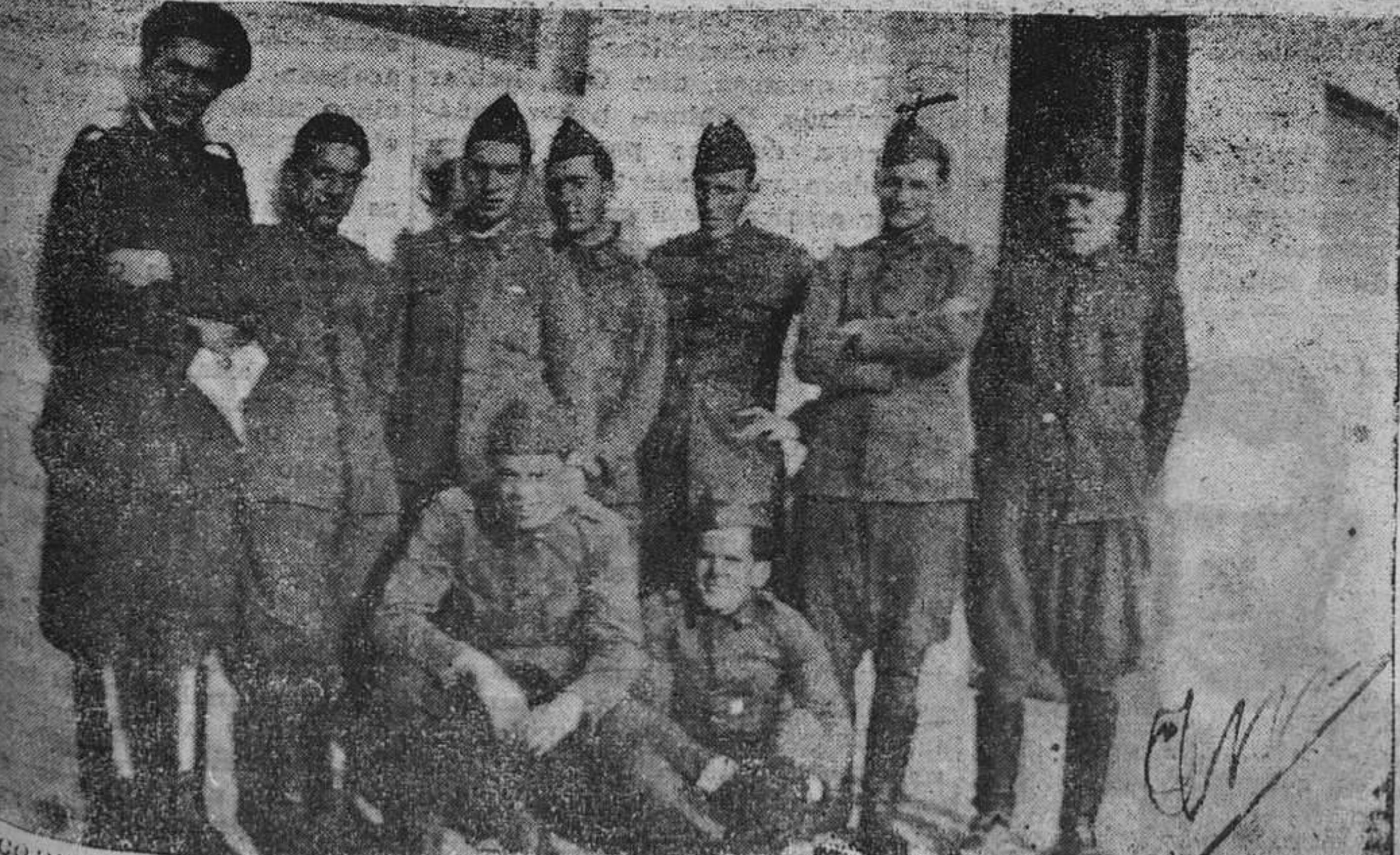
LA GUISUNA.— Grupo de aspirantes que se encuentran sirviendo en el tercer Regimiento de Artillería de la Montaña