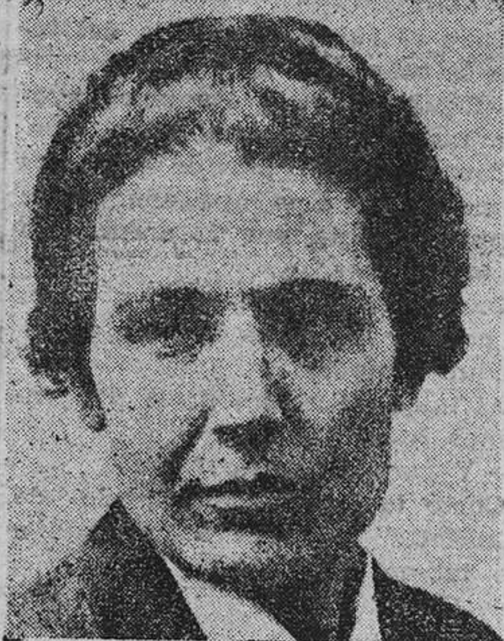
MADRID.— Doña Victoria Kent, recientemente nombrada directora de Prisiones