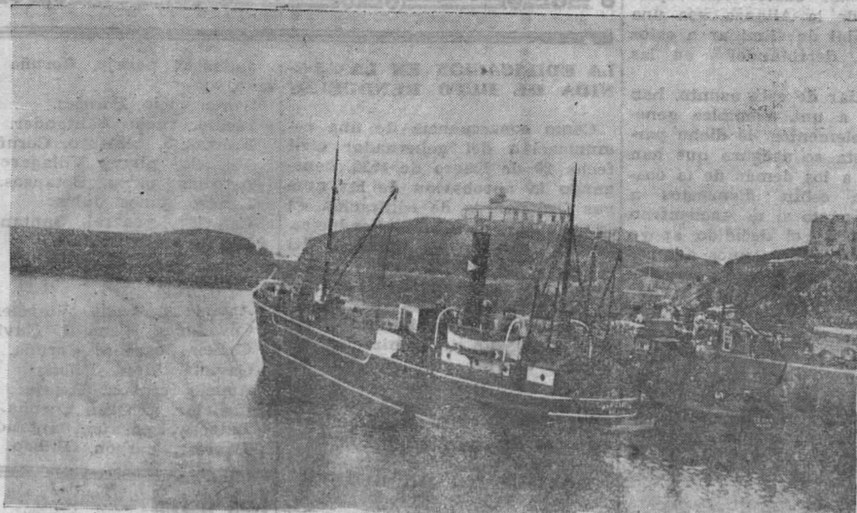
REGION TAPIA.—Vista del faro y del puerto.