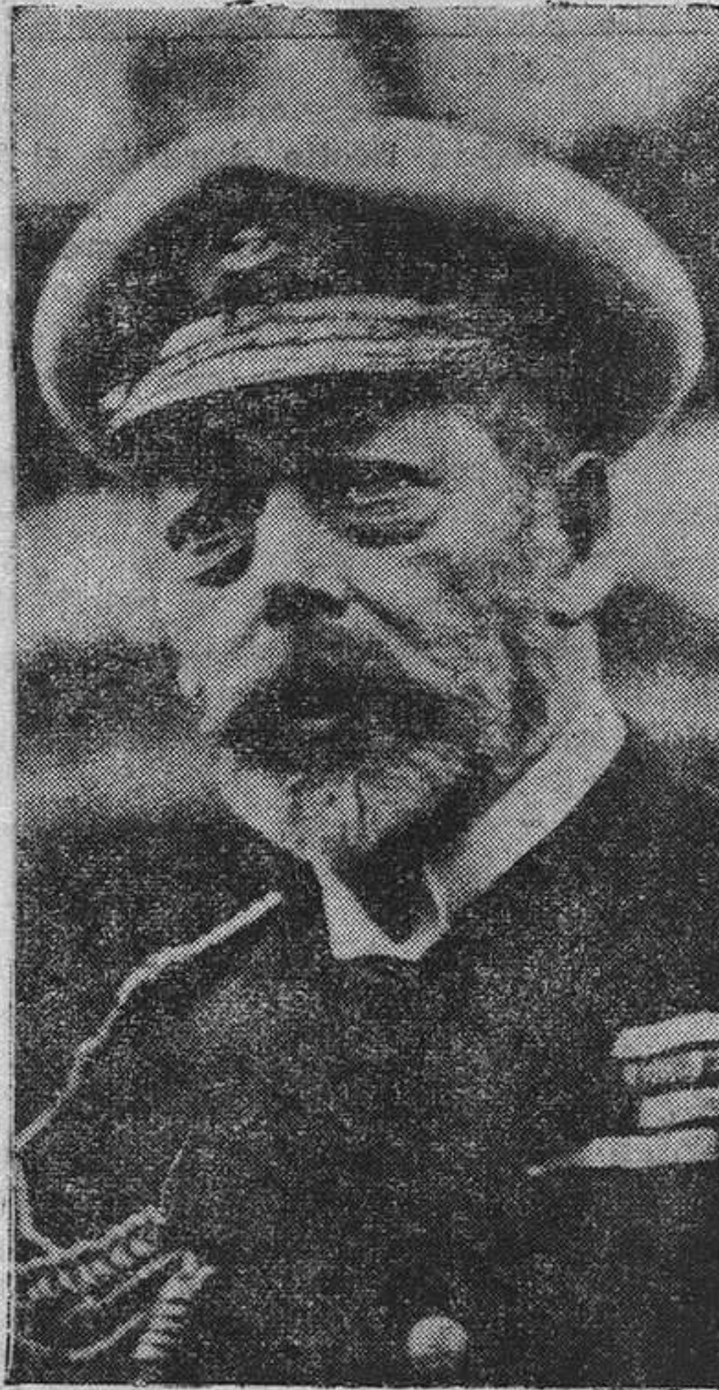
El Rey Jorge de Inglaterra, que se encuentra nuevamente enfermo.

En Oviedo: Posada Herrera, Restaurant Fierro. Teléfono 25-40. En Gijón: Alvarez Garaya y Langreo, 22, La Higiene. Teléfono -- 712 --