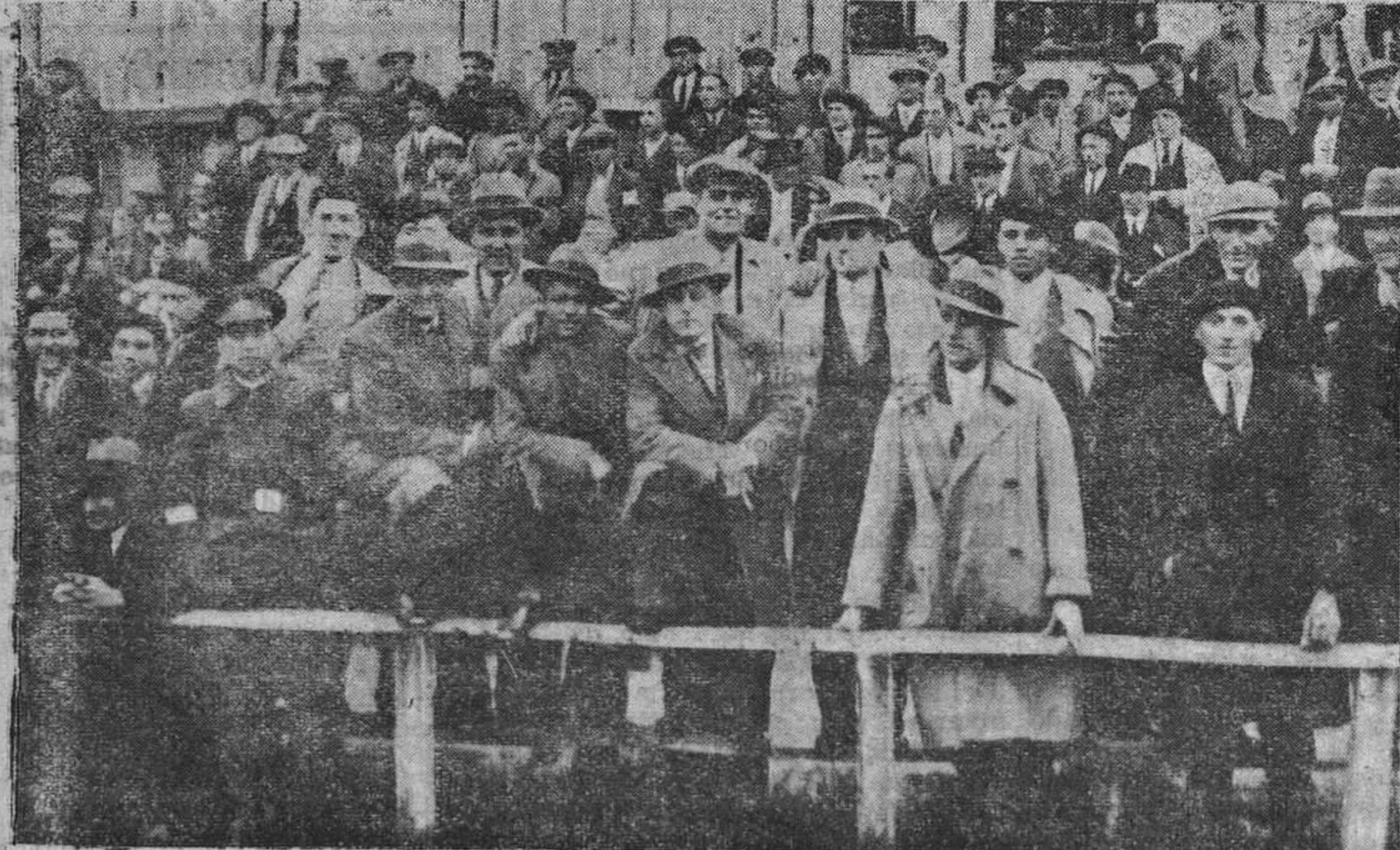
OVIEDO.—El público durante el descanso del partido entre el Castellón y el Oviedo, hace cábalas sobre cuál será el equipo que vaya a parar a la "categoría" de colista.