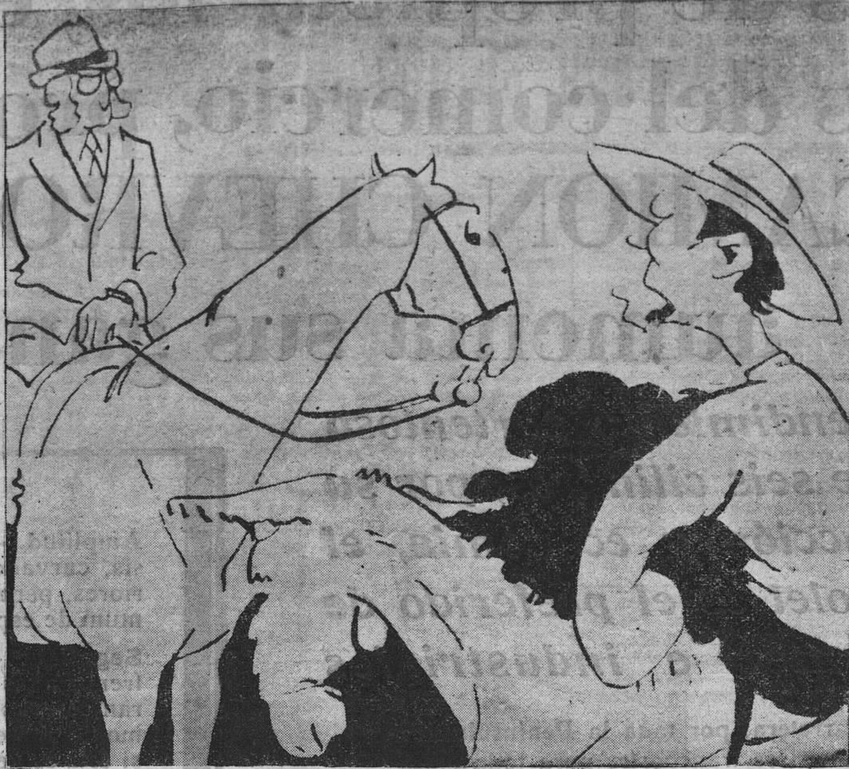
—; ¿Cómo va el burro, jitanillo! —; A caballo, señor!