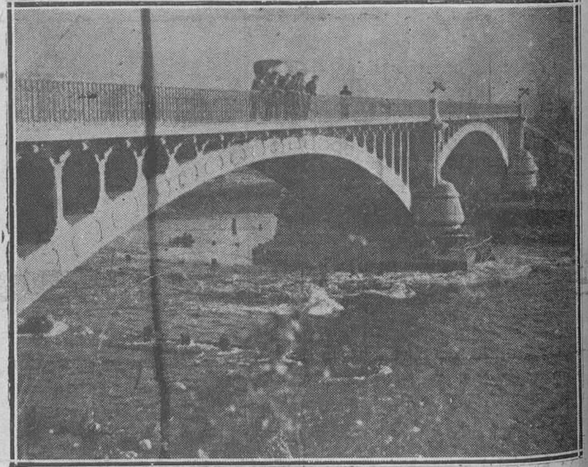
MIERES.-El puente de la Perra, que en la última riada ha sido destruído en más de su mitad; parte destruída (x x).

Ha quedado cortada la vía del Vasco en su paso junto a los lavaderos de la mina de Ortiz. Los cargaderos de carbón se han hundido en su mitad, y se