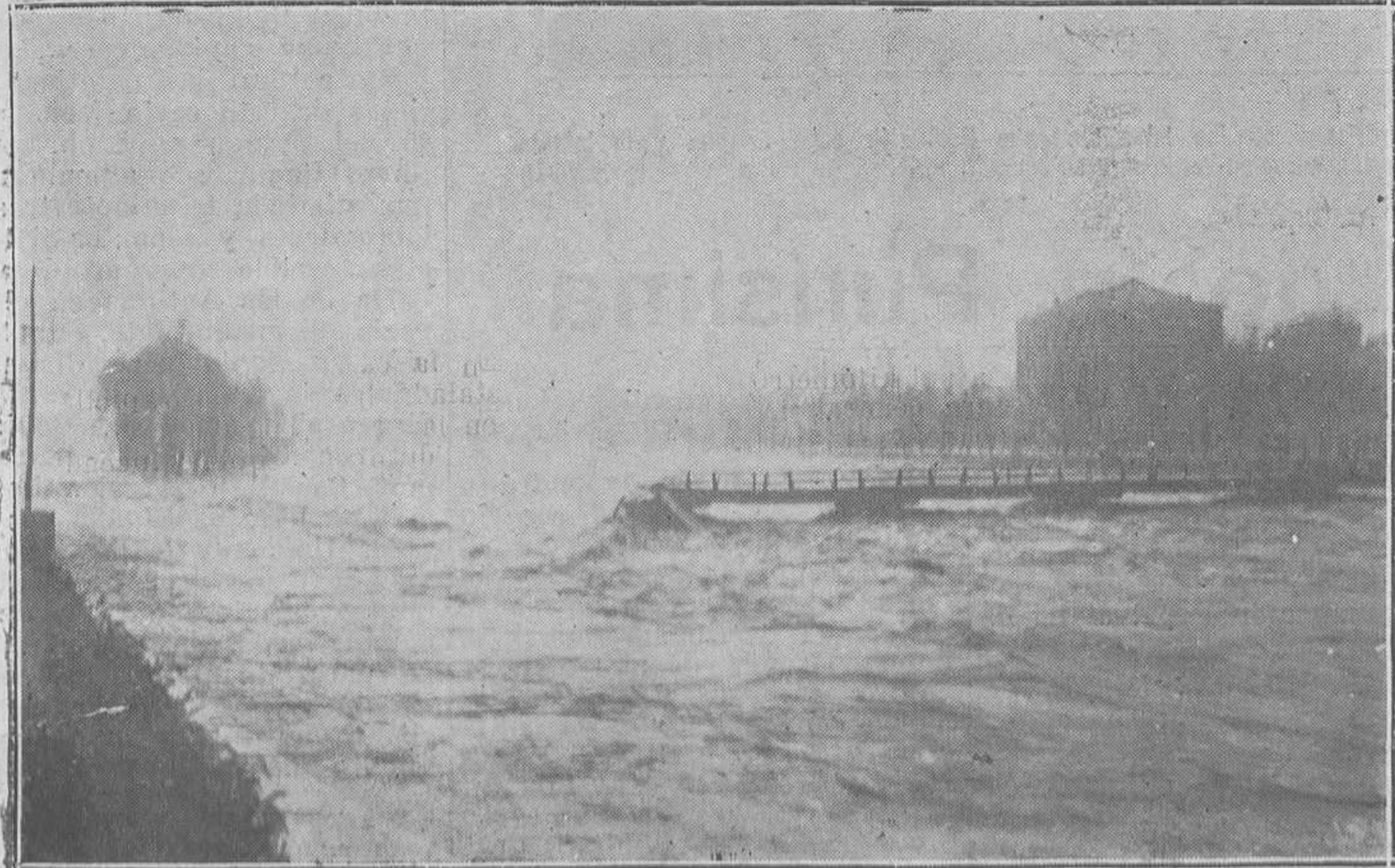
SAMA DE LANGREO.-Estado en que quedó el histórico puente viejo, después de las últimas inundaciones y cuya destrucción lloran hoy muchos viejos langreanos.

Por haber socavado el río Aller sus cimientos, se ha hundido la casa de un vecino de Santa Cruz, sin que ocurriese desgracias personales.