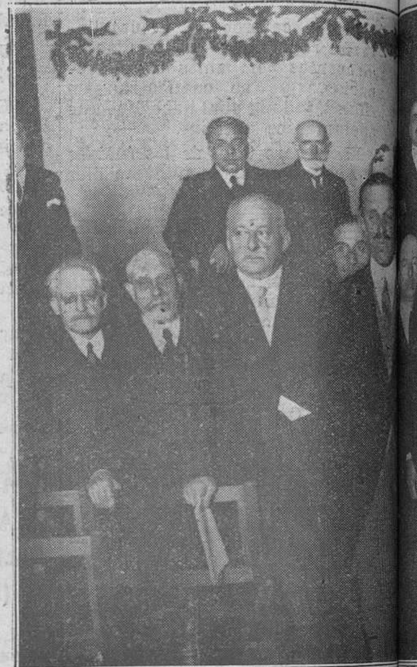
S. M. el Rey con el jefe del Gobierno, el director de la Academia de Ciencias, etc., que la docta Corporación ha celebrado la publicación...

Sobre todos los artistas que plasmaron la Inmaculada Concepción de María, sobresale Murillo, el mortal pintor sevillano. Ninguno delineó a María con tan propios, luminosos y celestes colores como