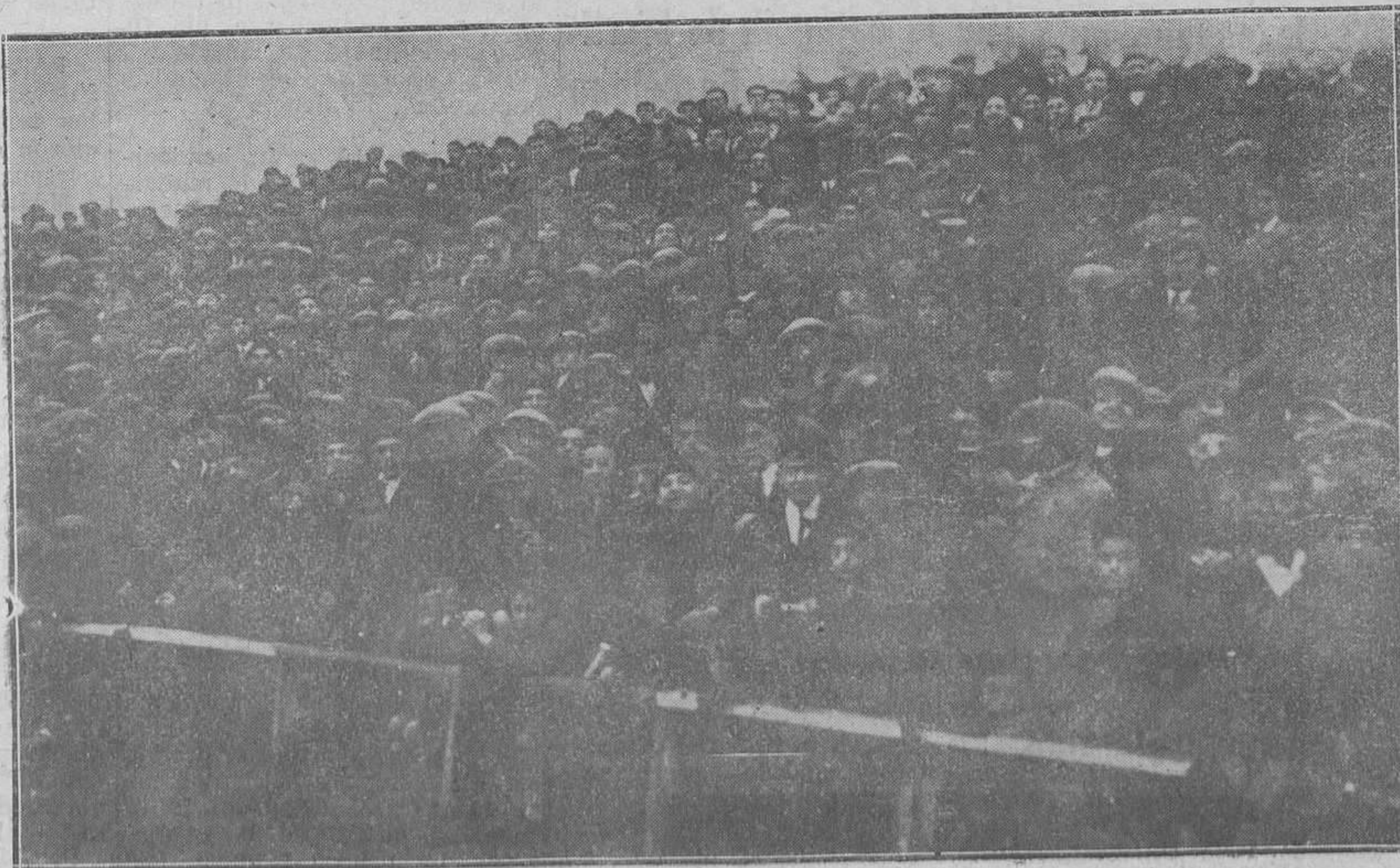
GIJÓN. Un aspecto de la general, en el Molinón.