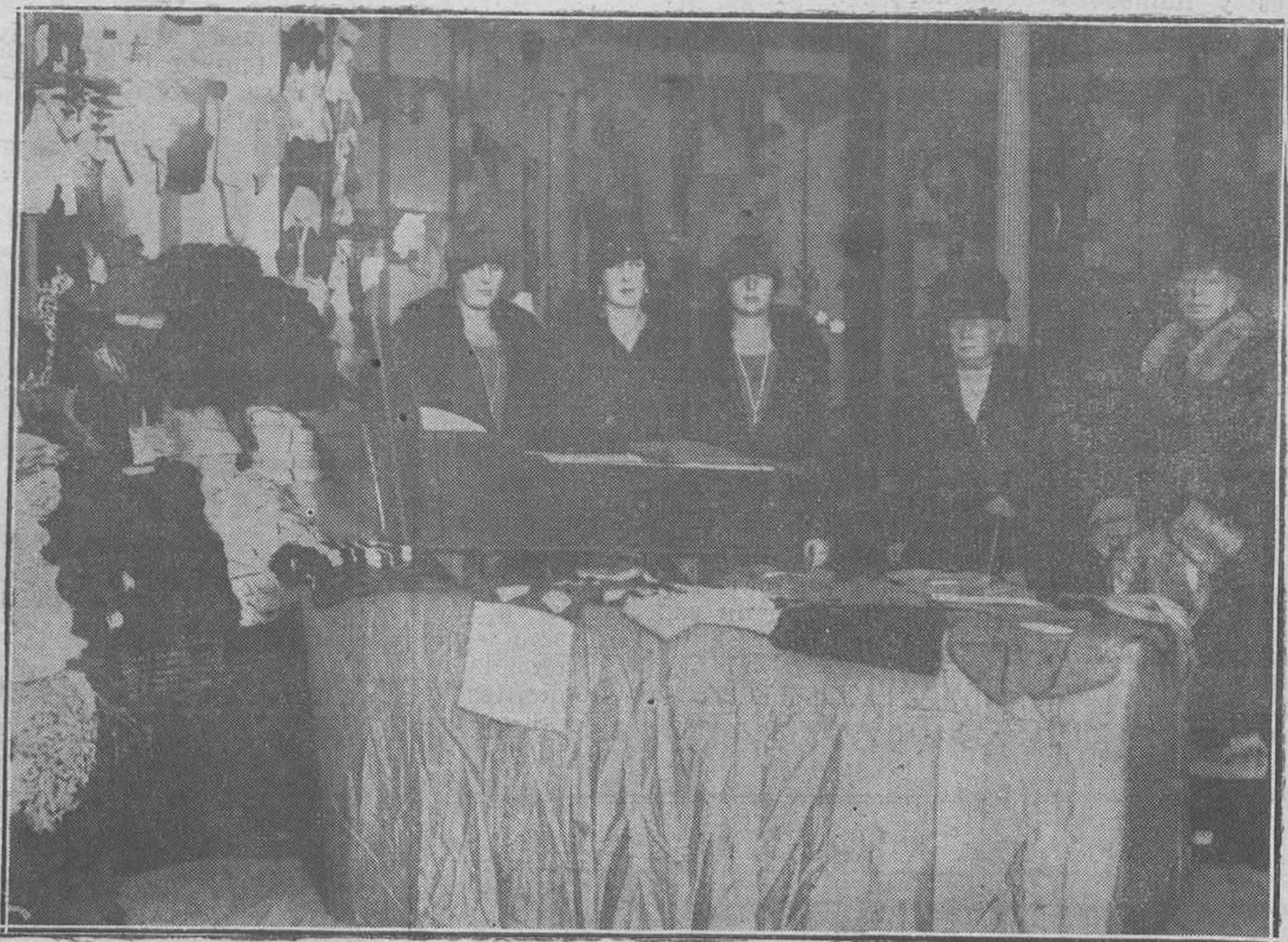
SS. NN. las Reinas doña Victoria y doña María Cristina, con las Infantitas doña Beatriz y doña Cristina y la Infanta doña Isabel, en la inauguración del Ropero de Santa Victoria.

Nadie debe molestarse cuando las gentes se rían de él, si motivos dió para que de él se rieran.