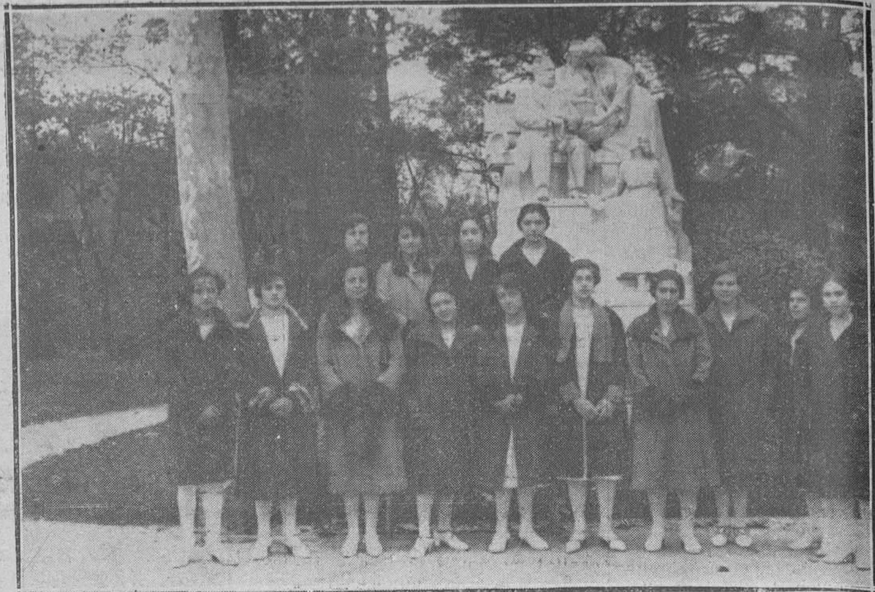
MADRID: EL ORFEÓN DE MIERES.-Un grupo de crfeonistas a te el monumento a Campoamor.

Debido al desprendimiento de tierras que produjo el deslizamiento de un tren del ferrocarril Económico de Asturias llegaron los trenes de Asturias de la tarde y noche del lunes.