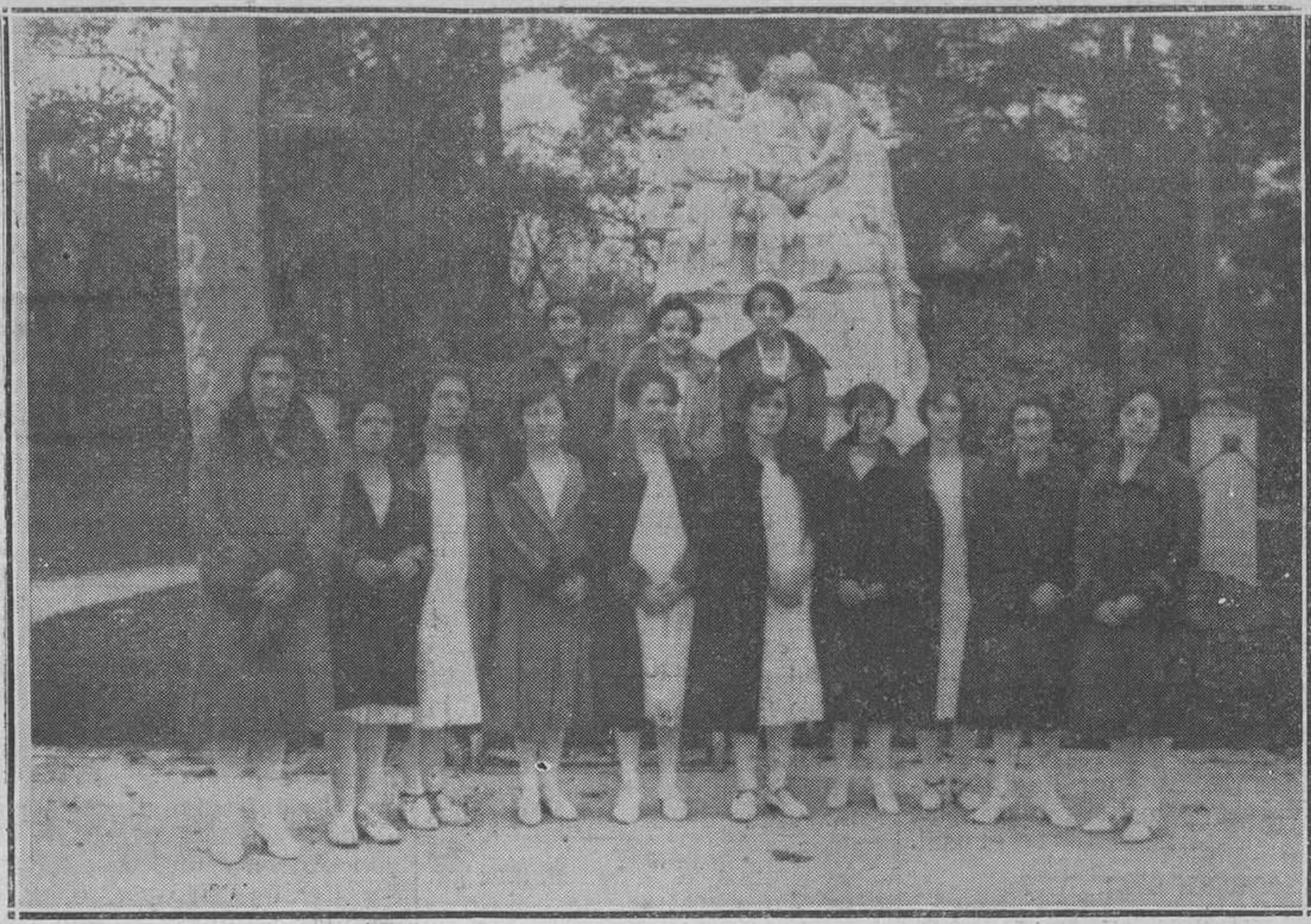
MADRID: EL CRIFON DE MIERES.-Otro grupo de orfeñistas ante el monumento a Campamor.