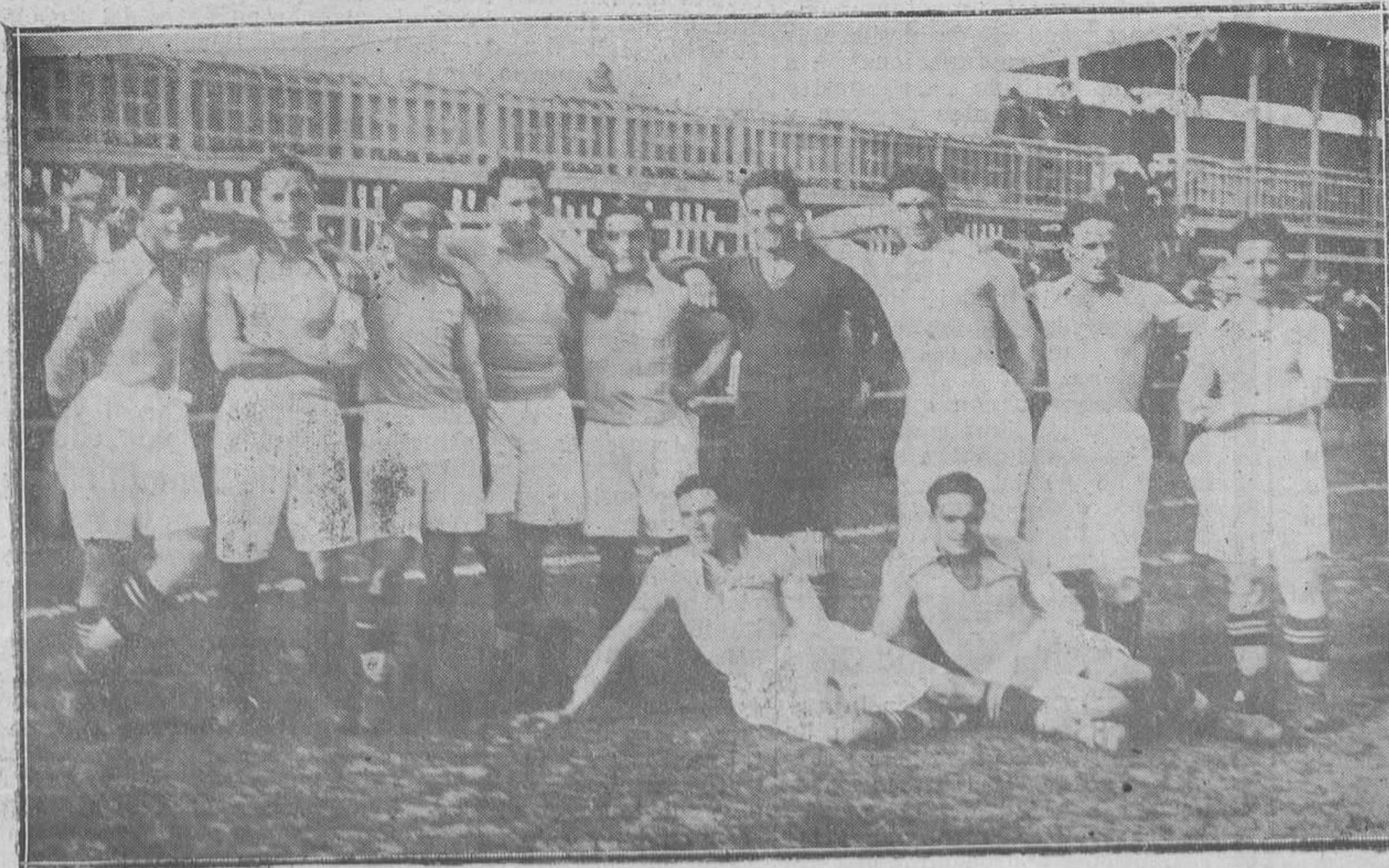
BIJON.-El Real Oviedo, que jugó el domingo en el Molinón con el Real Sporting.