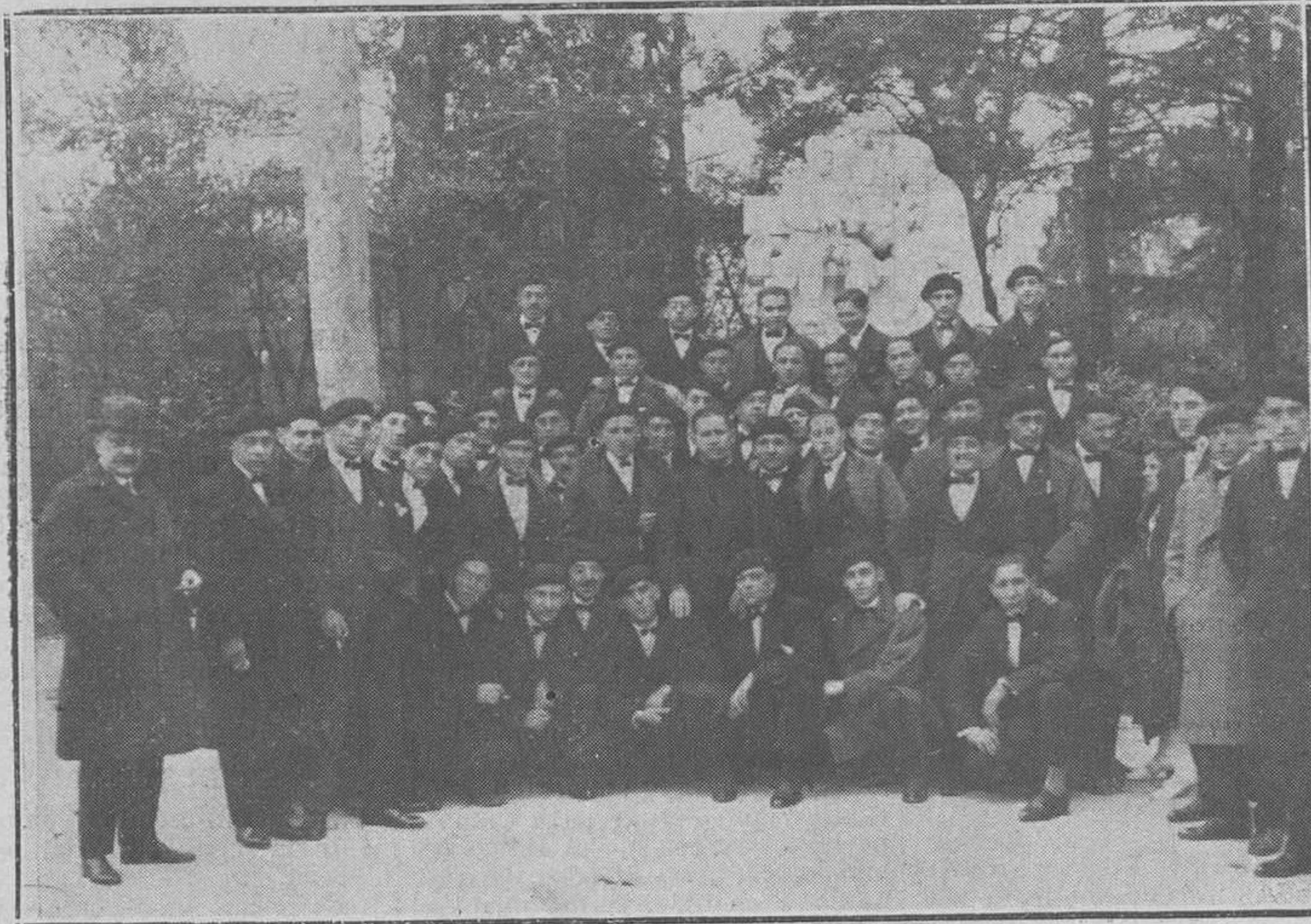
MADRID: EL CRFEON DE MIERES.-Los crfeonistas ante el monumento a Campoamor.

En el fondo de un profundo barranco emergían de entre una enorme masa de tierra desprendida algunas vigas y materiales de las casas destruidas.