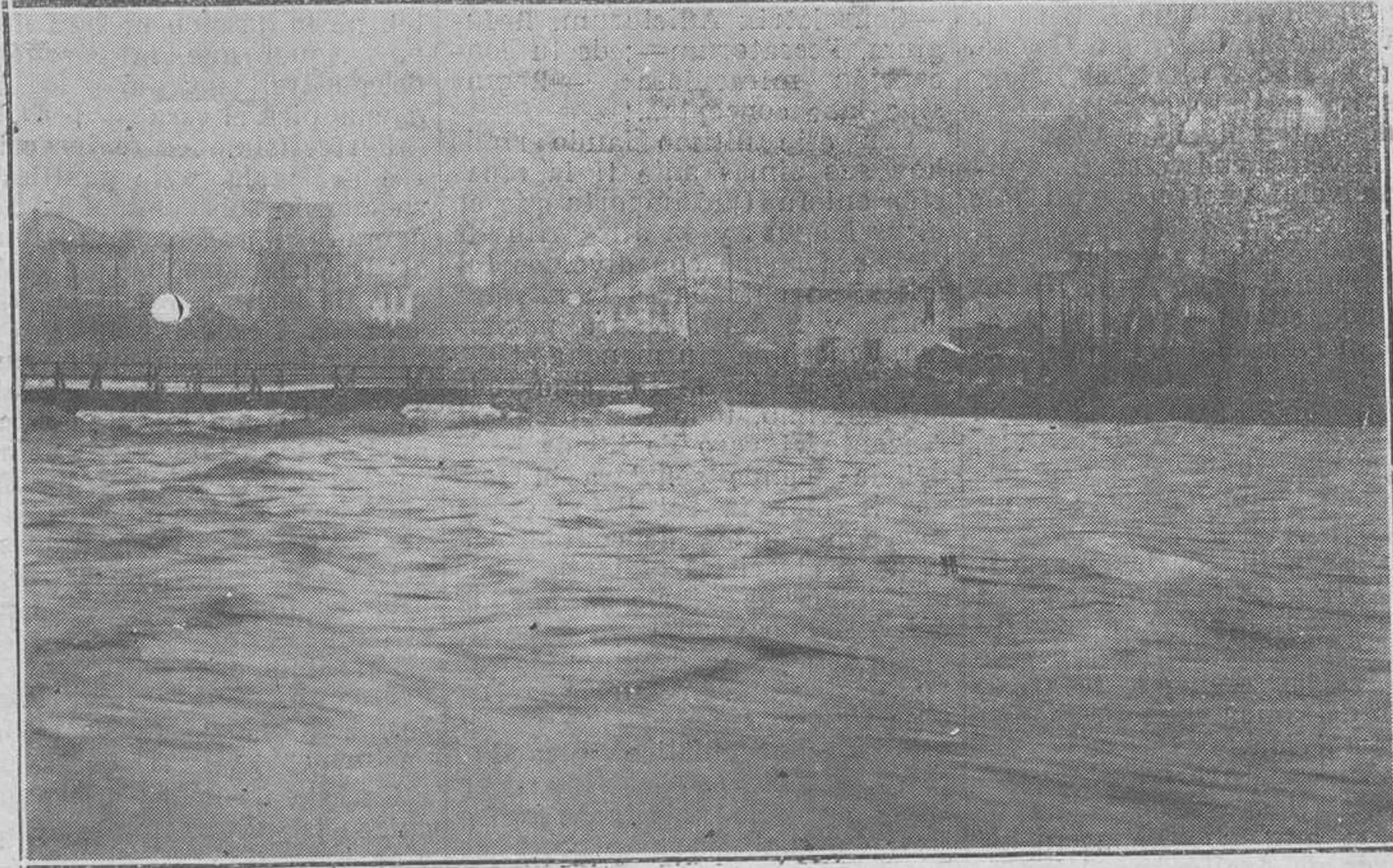
SAMA DE LANGREO.-Otro aspecto del estado en que quedó el puente viejo, después de las últimas temporales. Dicho puente ponía en comunicación al pueblo de Sama con la estación del ferrocarril de Langreo y era transitadísimo.

En Requejo ha habido que desalojar las casas, debido al desbordamiento del río San Juan, quedando inundados completamente los sitios bajos del barrio.