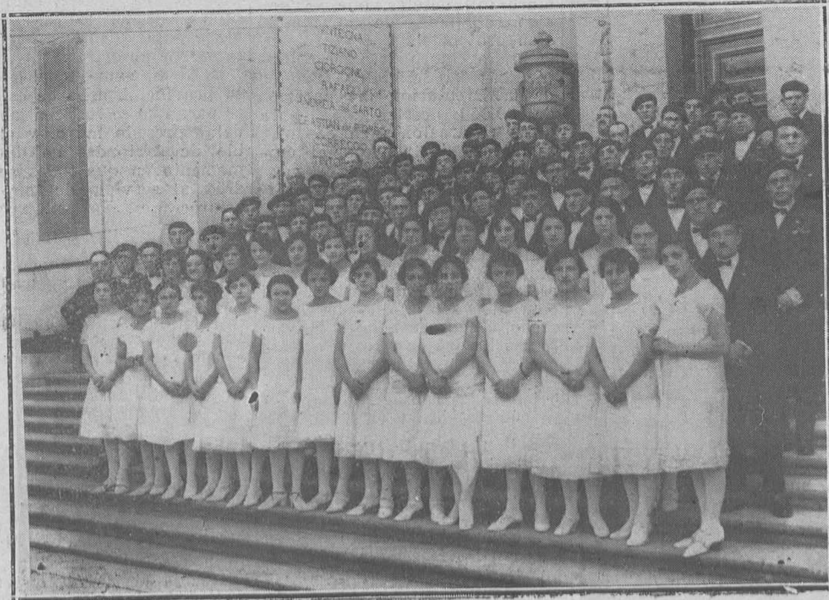
EL ORFEON DE MIERES, QUE SE ENCUENTRA EN MADRID.-El Orfeón de Mieres en las escaleras del Museo del Prado.