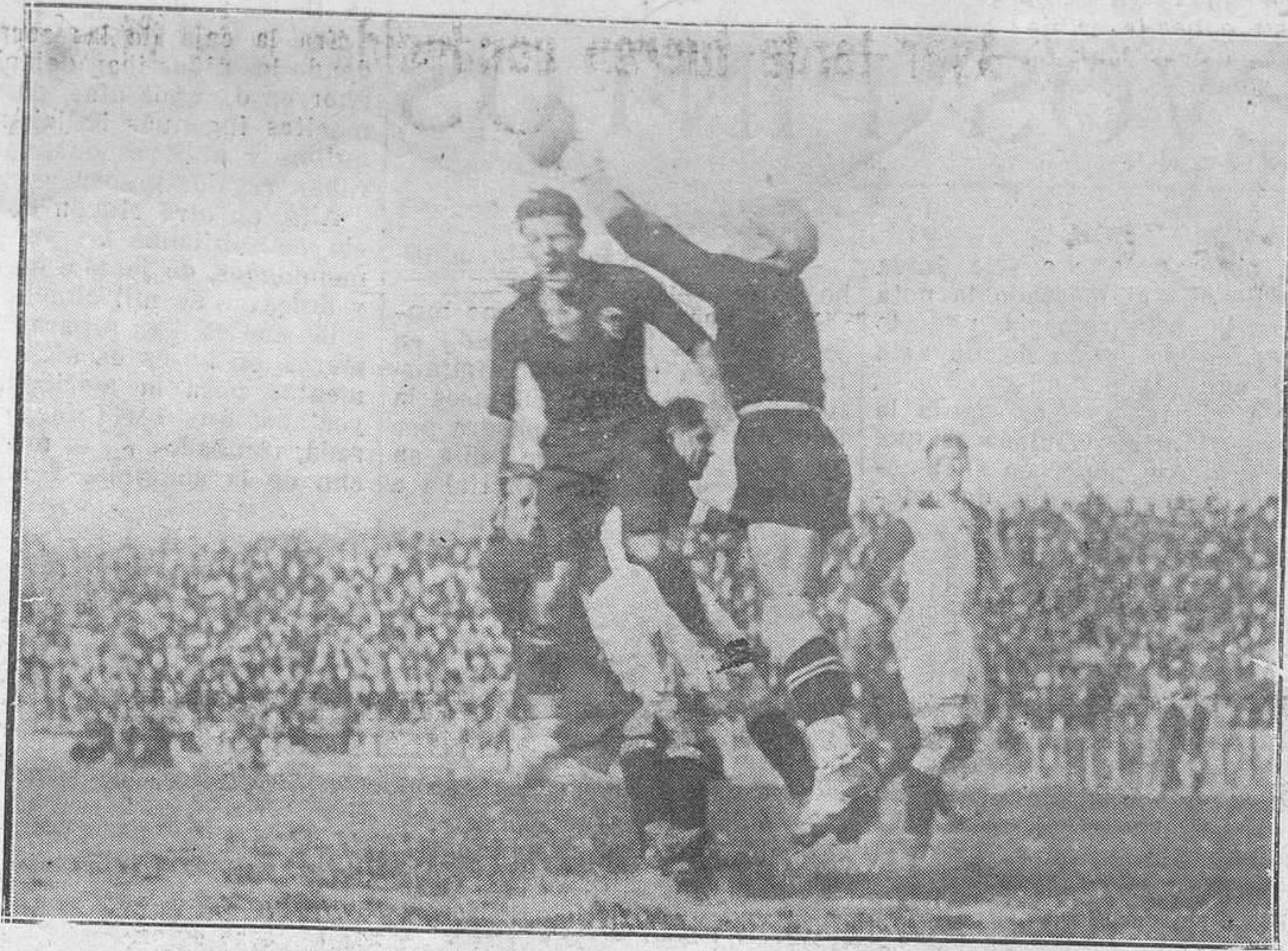
SANTANDER: DEL PARTIDO ESPAÑA SUIZA. -Una parada del portero suizo, en el primer tiempo.