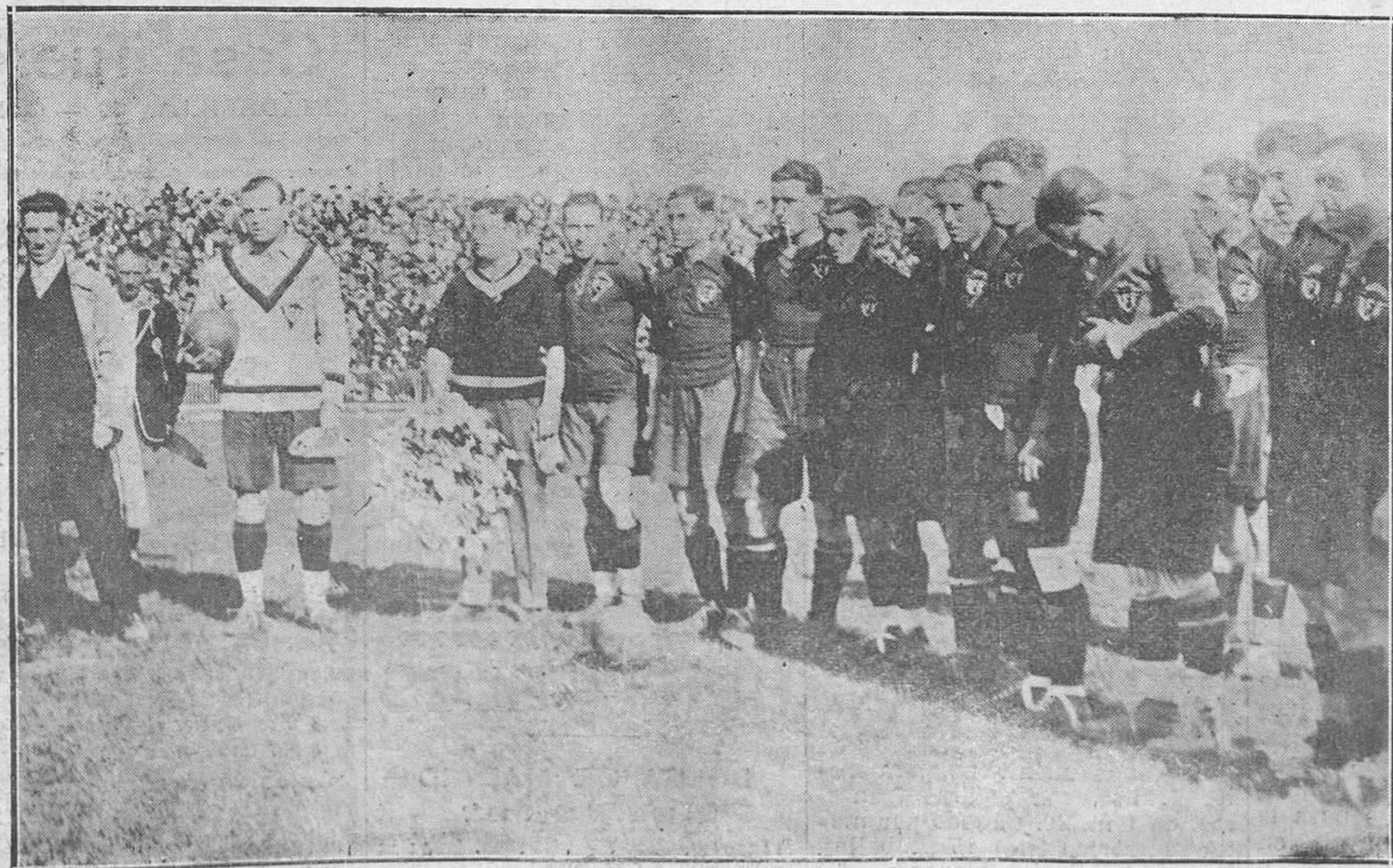
Santander.-El equipo español