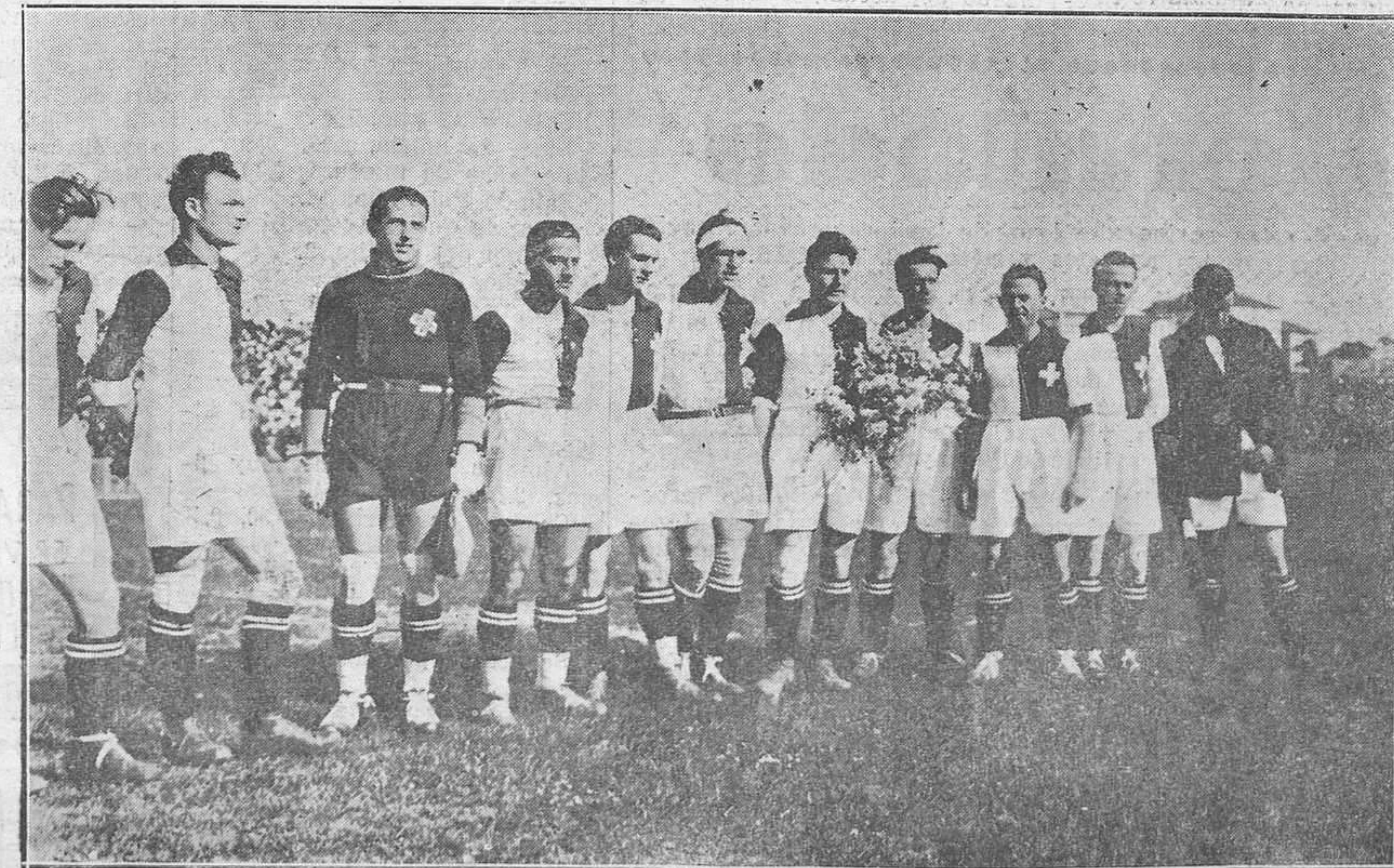
Santander.-El equipo suizo