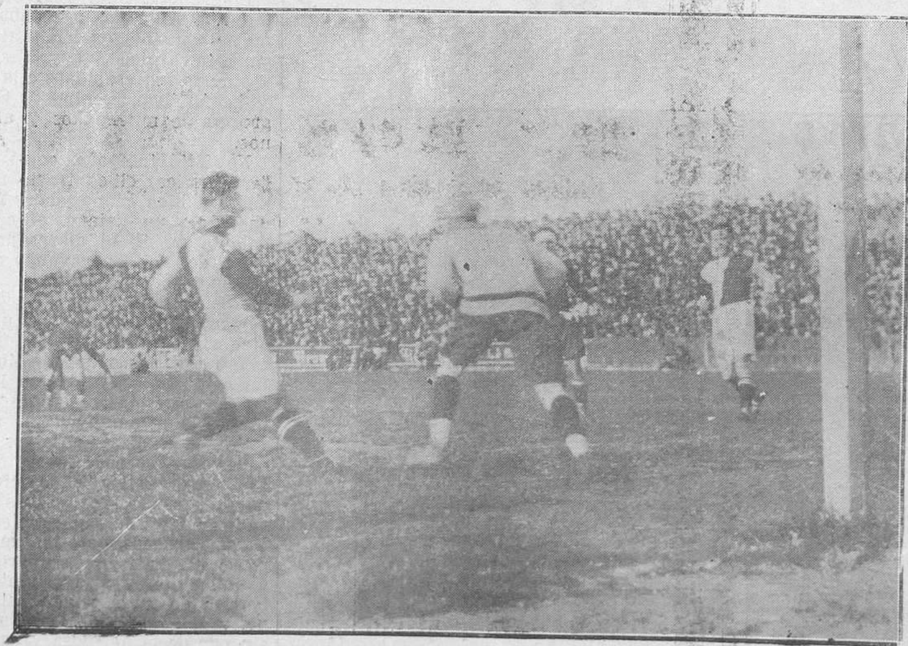
SANTANDER: DEL PARTIDO ESPAÑA SUIZA. -Zamora bloqueando un balón.