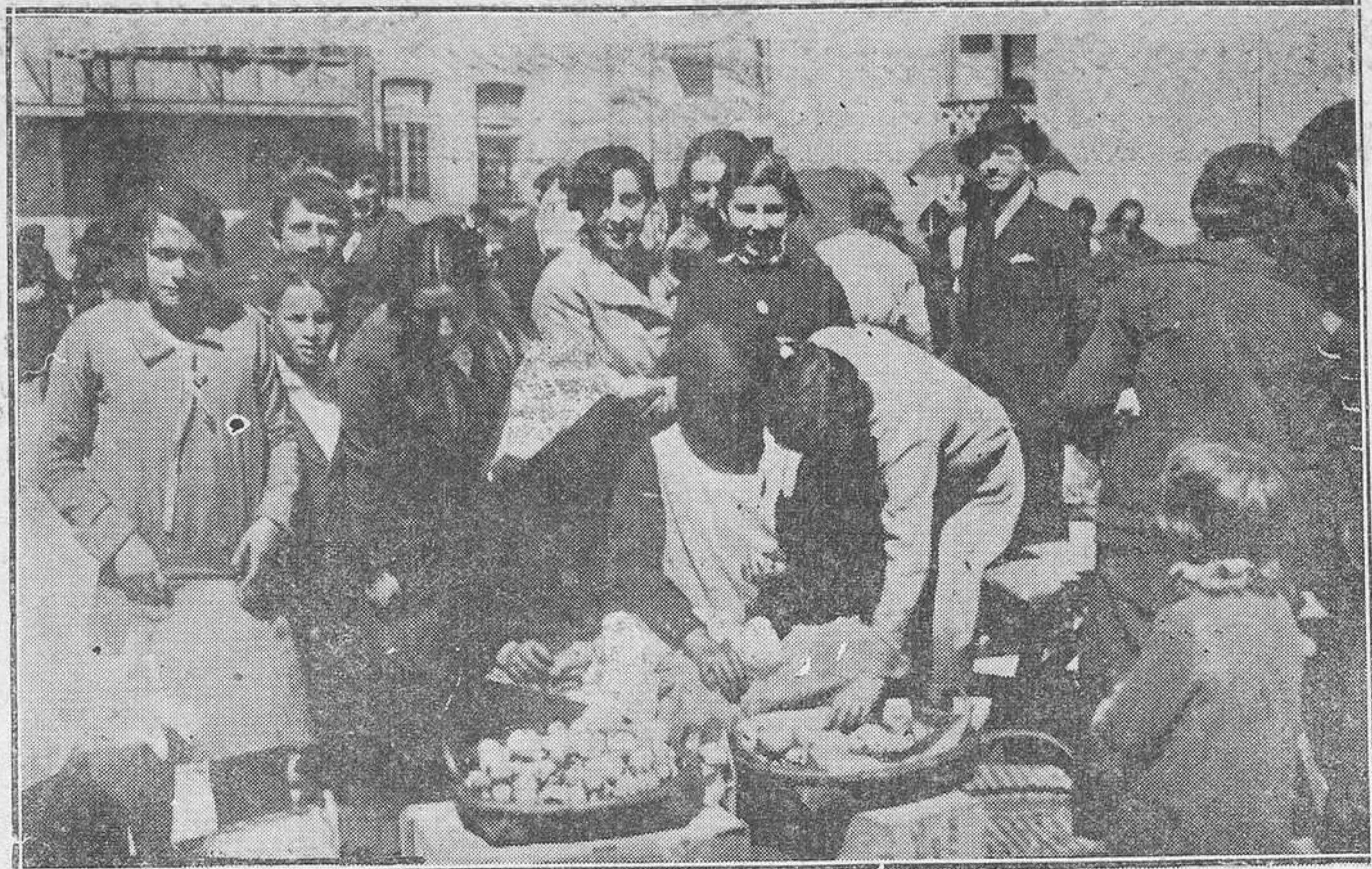
POLA DE SIERO.-En la romería de los "huevos pintos".-Un grupo de romeros comprando los huevos

Y un poco más allá, una mujer enlutada había plantado en la carretera tres bolos diminutos; hacía ver a los curiosos la imposibilidad de que pasara por entre ellos la bola que tenía en la mano, y luego los invitaba a