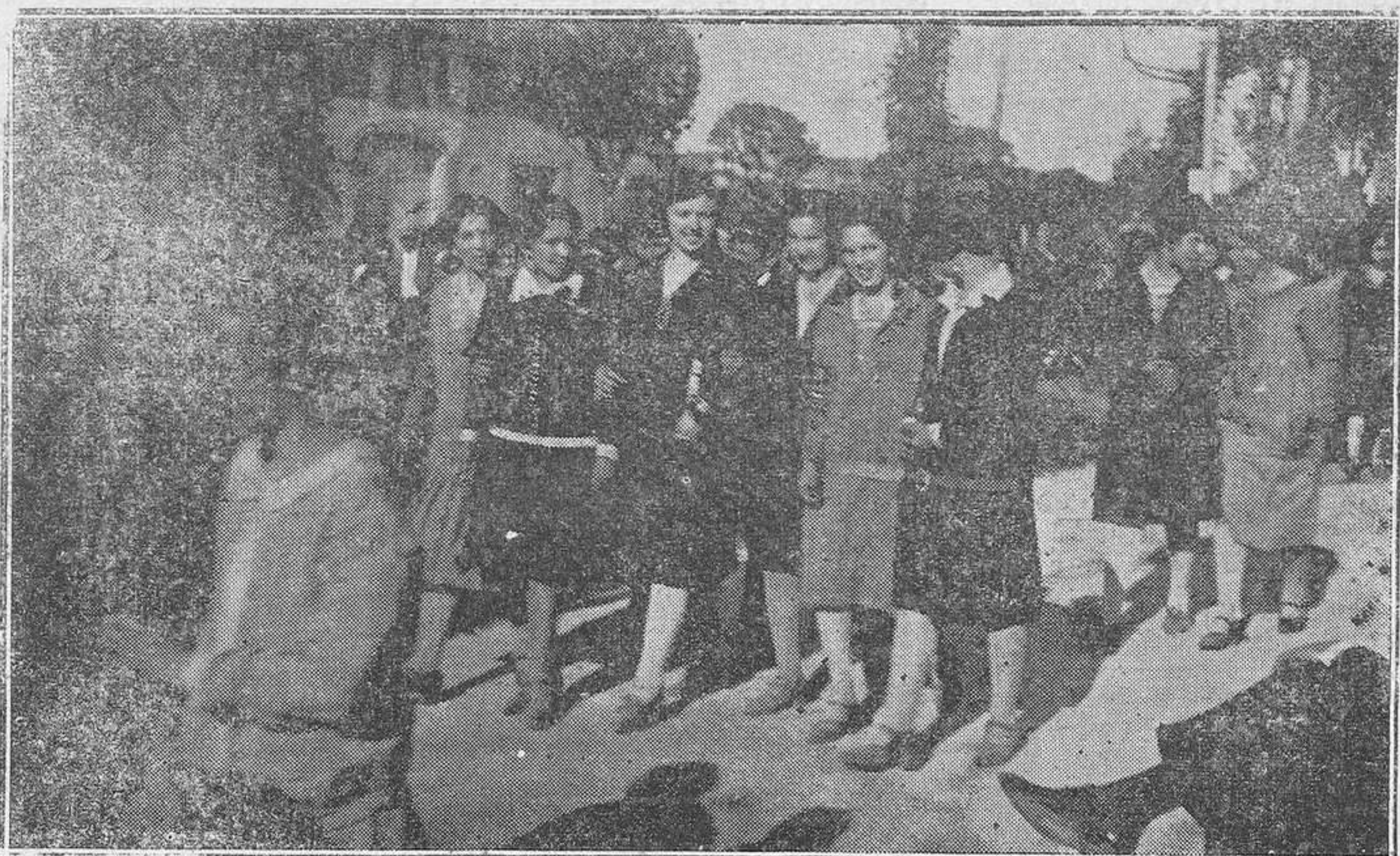
POLA DE SIERO.—Un grupo de jóvenes concurrentes a la romería de los "nuevos pintos".