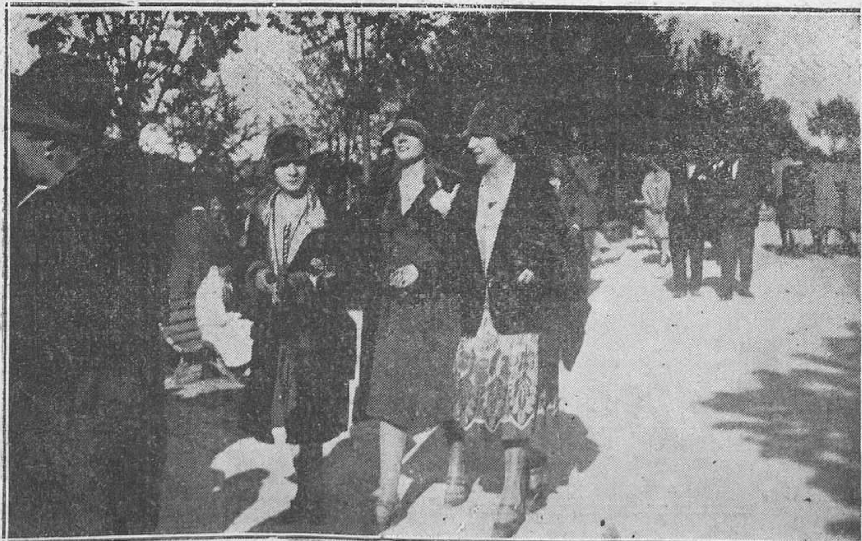
POLA DE SIERO.-En la romería de los "huevos pintos".-Uno de los paseos del parque.