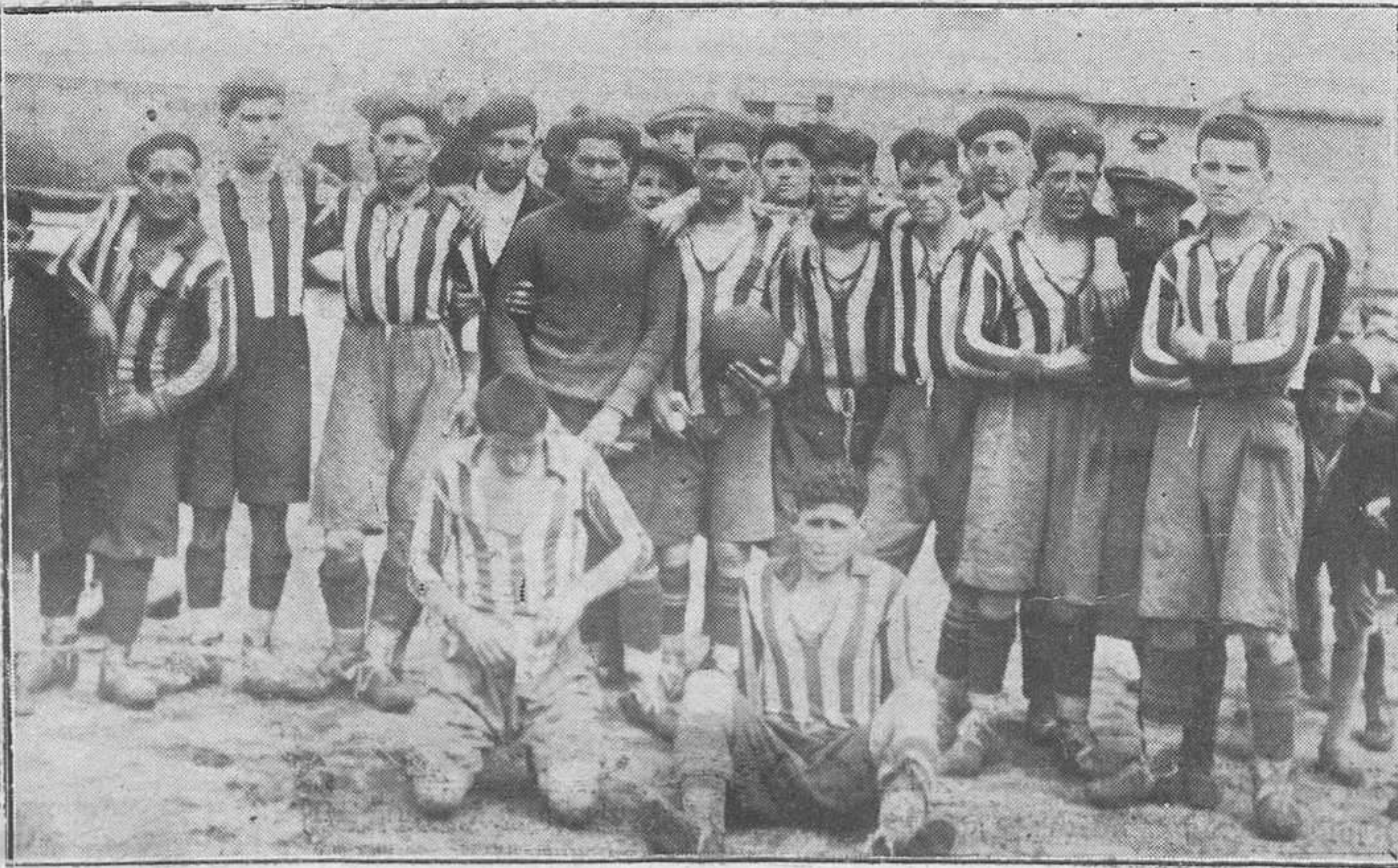
OVIEDO: CAMPEONATO DE SEGUNDA CATEGORIA.—El Sporting de Sa to Domingo, que jugó el domingo último en Vetusta, resultando vencedor por 4-1.

Marqués de Teverga, 2 -- Teléfono 4-67 -- OVIEDO