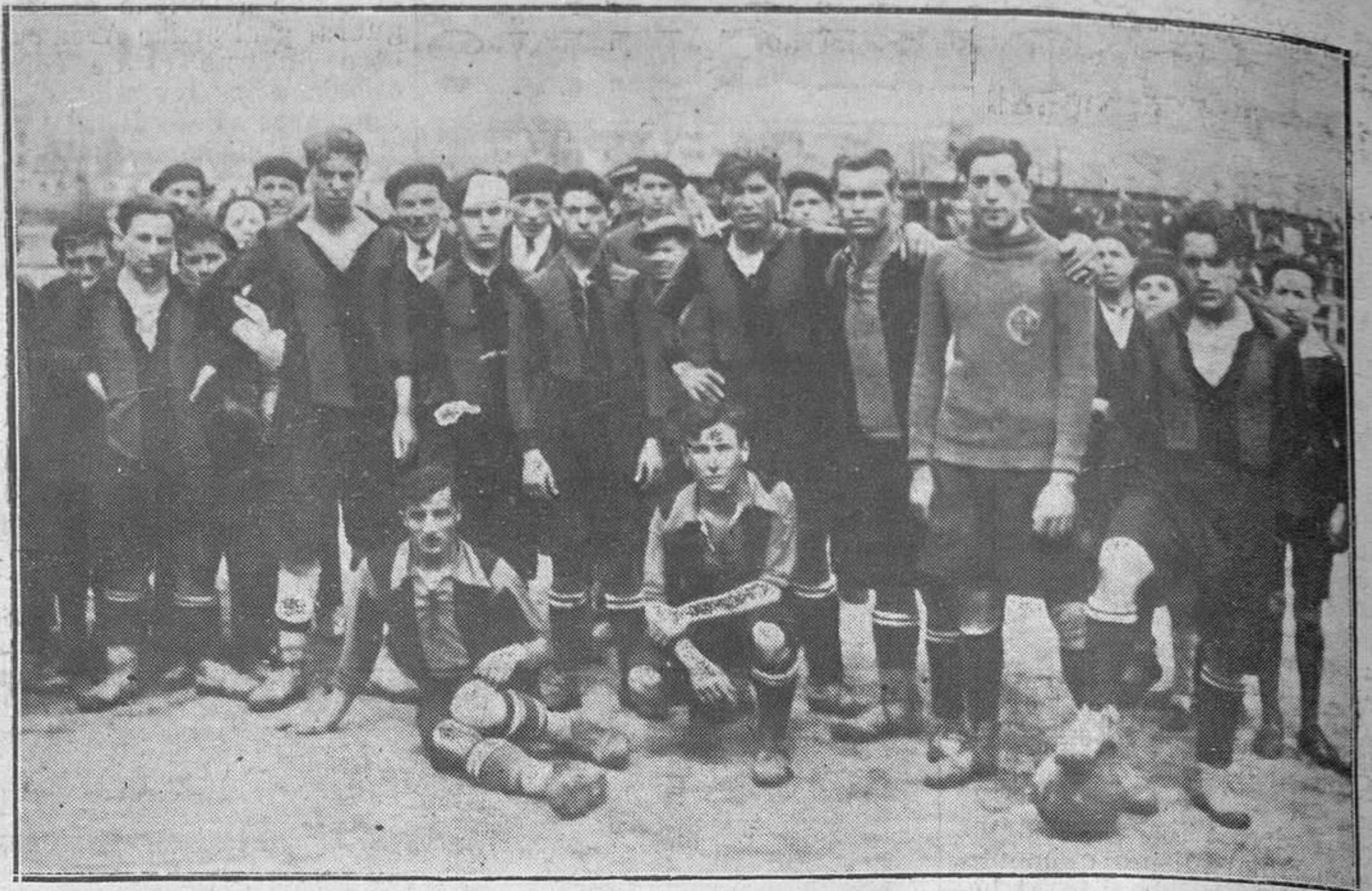
OVIEDO: CAMPEONATO DE SEGUNDA CATEGORIA.—El Fruela, que fué vencido el domingo último en vetusta.

Este partido fué a beneficio de las familias damnificadas con motivo del incendio ocurrido el