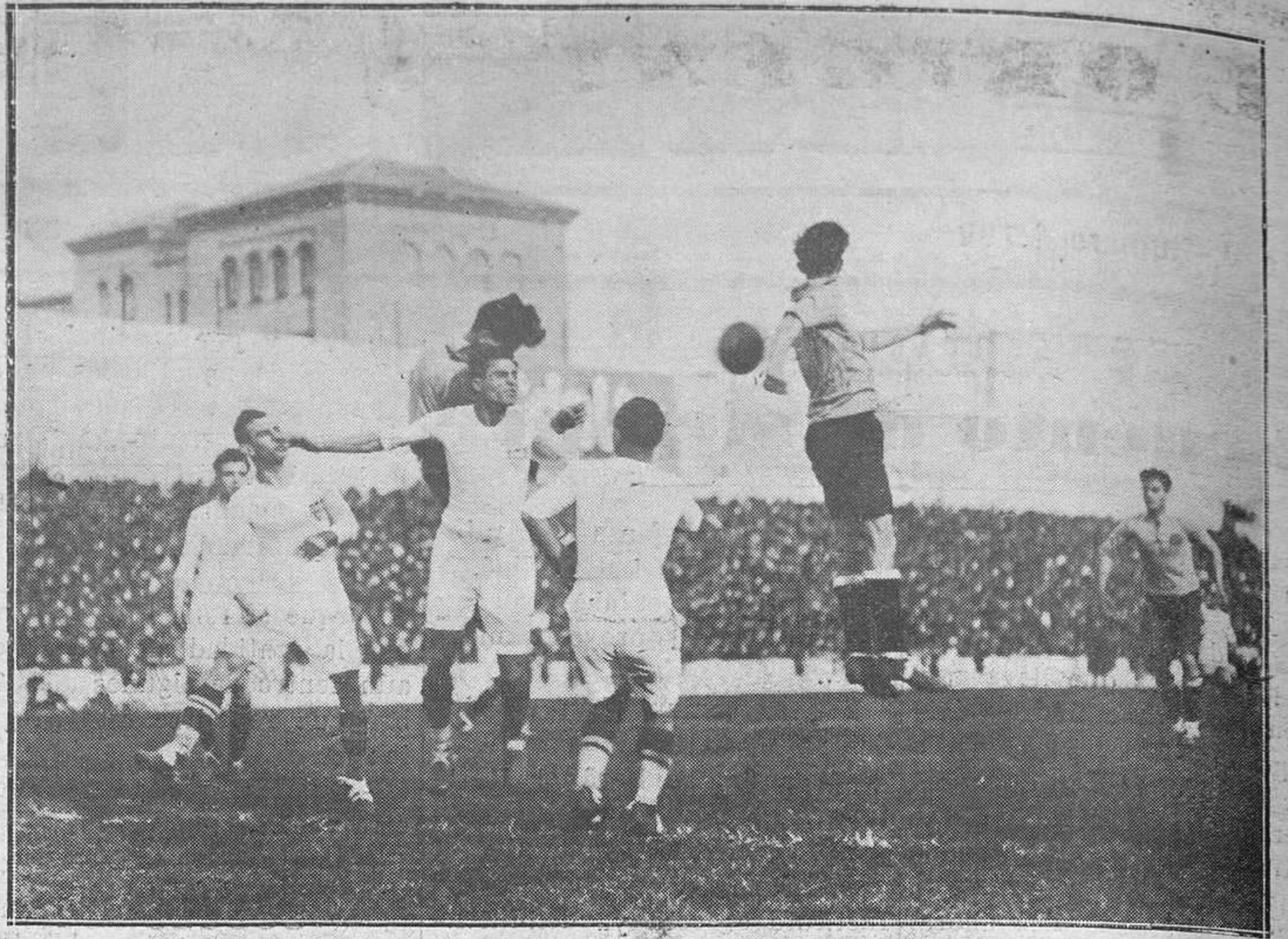
MADRID.-Del partido Real Madrid-Sevilla F. C.: venció el primero por 3-2