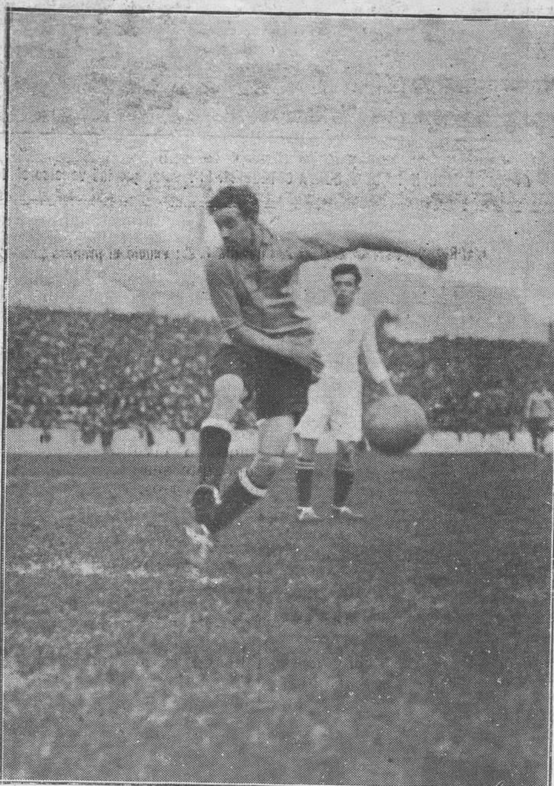
MADRID.—Del partido Real Madrid-Sevilla F. C.; vació el primero por 3-2. (Vidal)

Muy bien! Y creemos nosotros que es necesario ayudar cumplidamente a los trabajos que el señor Beltrán se propone realizar.