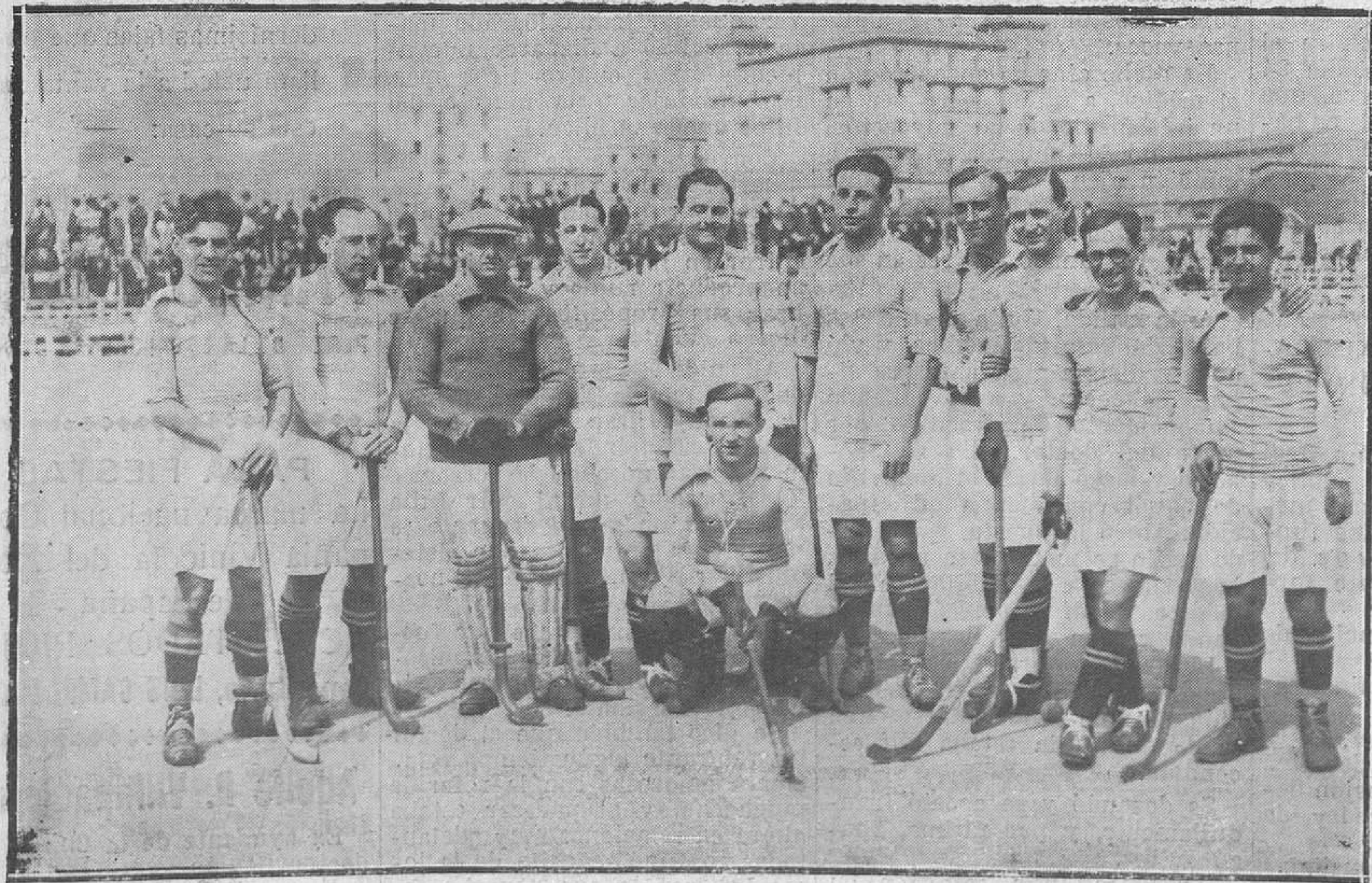
MADRID: DEL PARTIDO DE HOCKEY REAL OVIEDO-ATHLETIC DE MADRID.—El equipo de Oviedo.