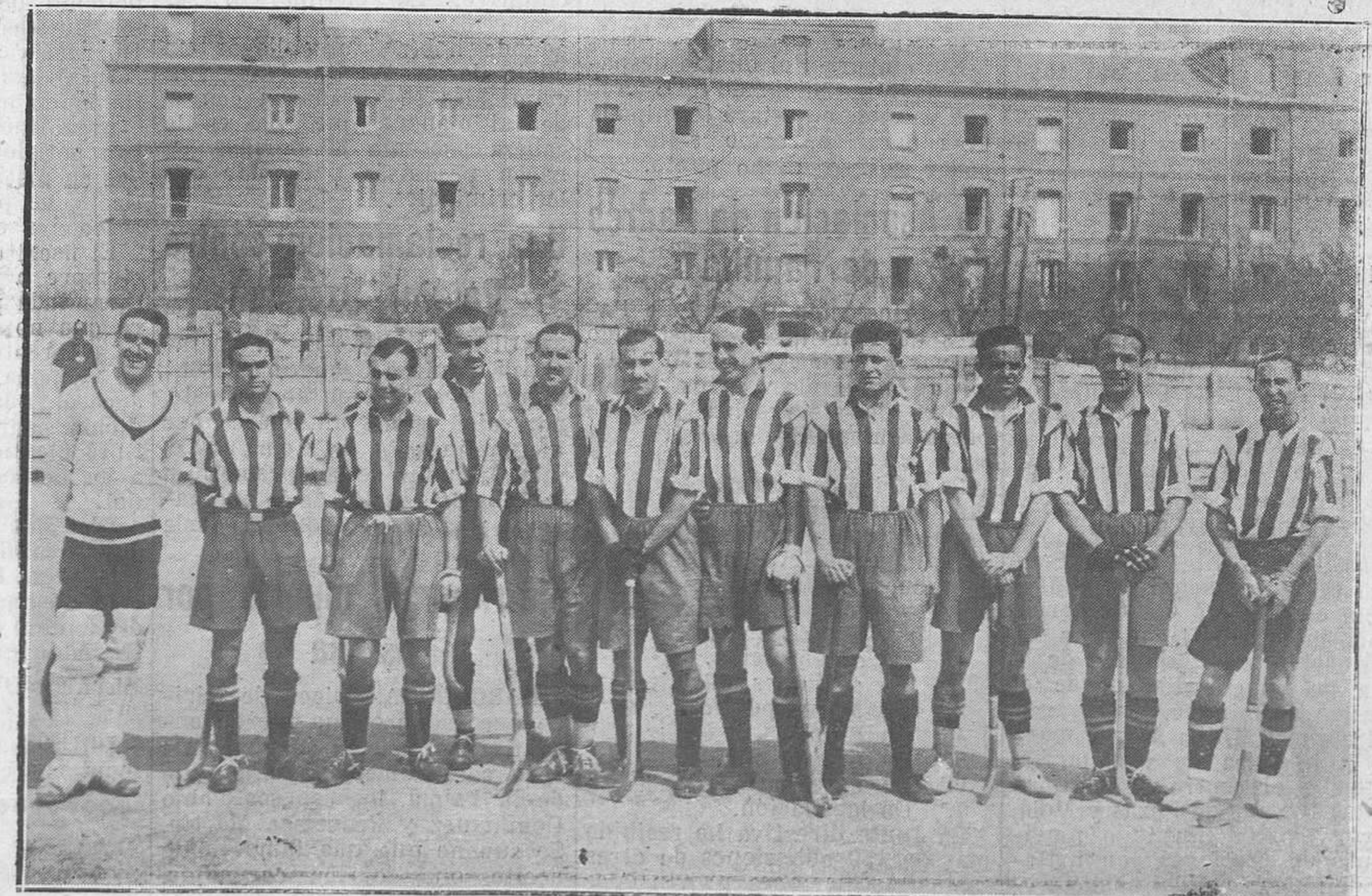
MADRID: DEL PARTIDO DE HOCKEY REAL OVIEDO-ATHLETIC DE MADRID.—El equipo del Athlético.