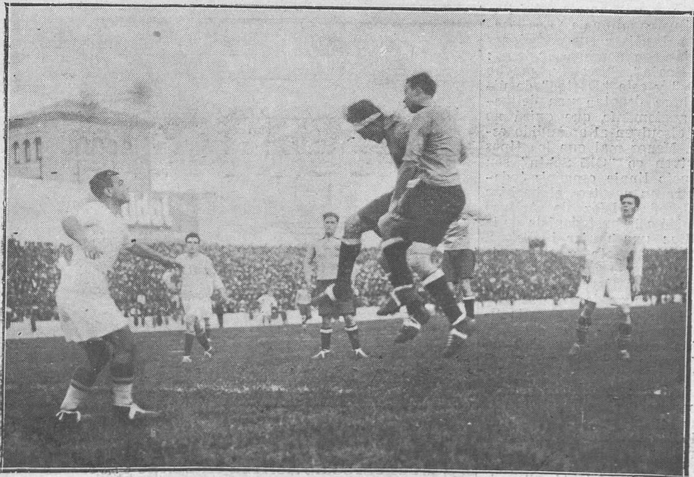
MADRID.-Del partido de foot-ball, de campeonato de España, jugado entre el Real Madrid-Sevilla F. C.; venció el primero por 3-2.

Enviamos a su distinguida familia la sincera expresión de nuestro pésame.