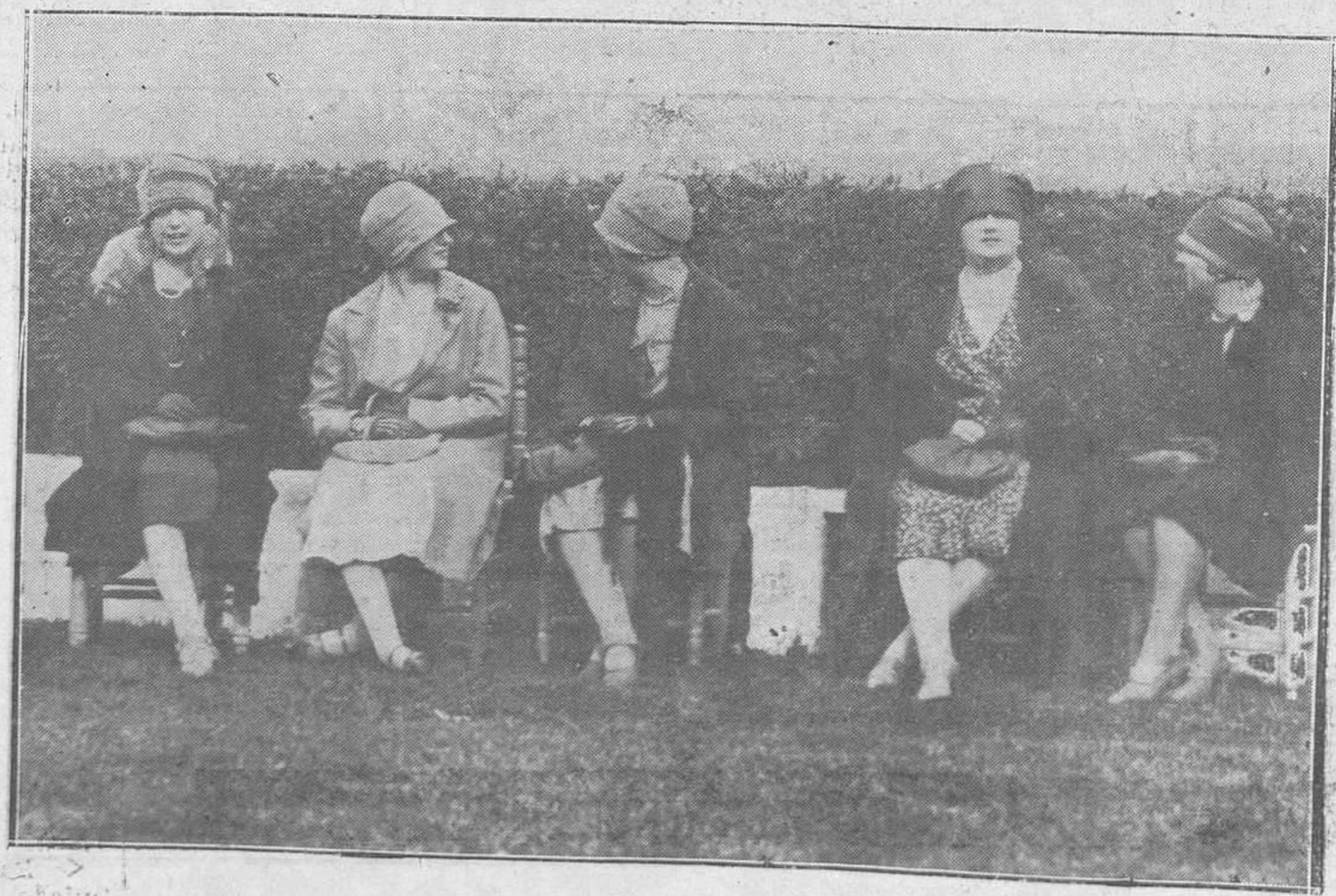
MADRID: EN EL HIPÓDROMO DE LA CASTELLANA.—En el intervalo de una carrera.

Esta tarde, a las tres en punto, se reunirá el Círculo de Estudios de la A. C. N. de P. en el local del Centro Diocesano de Acción Católica.