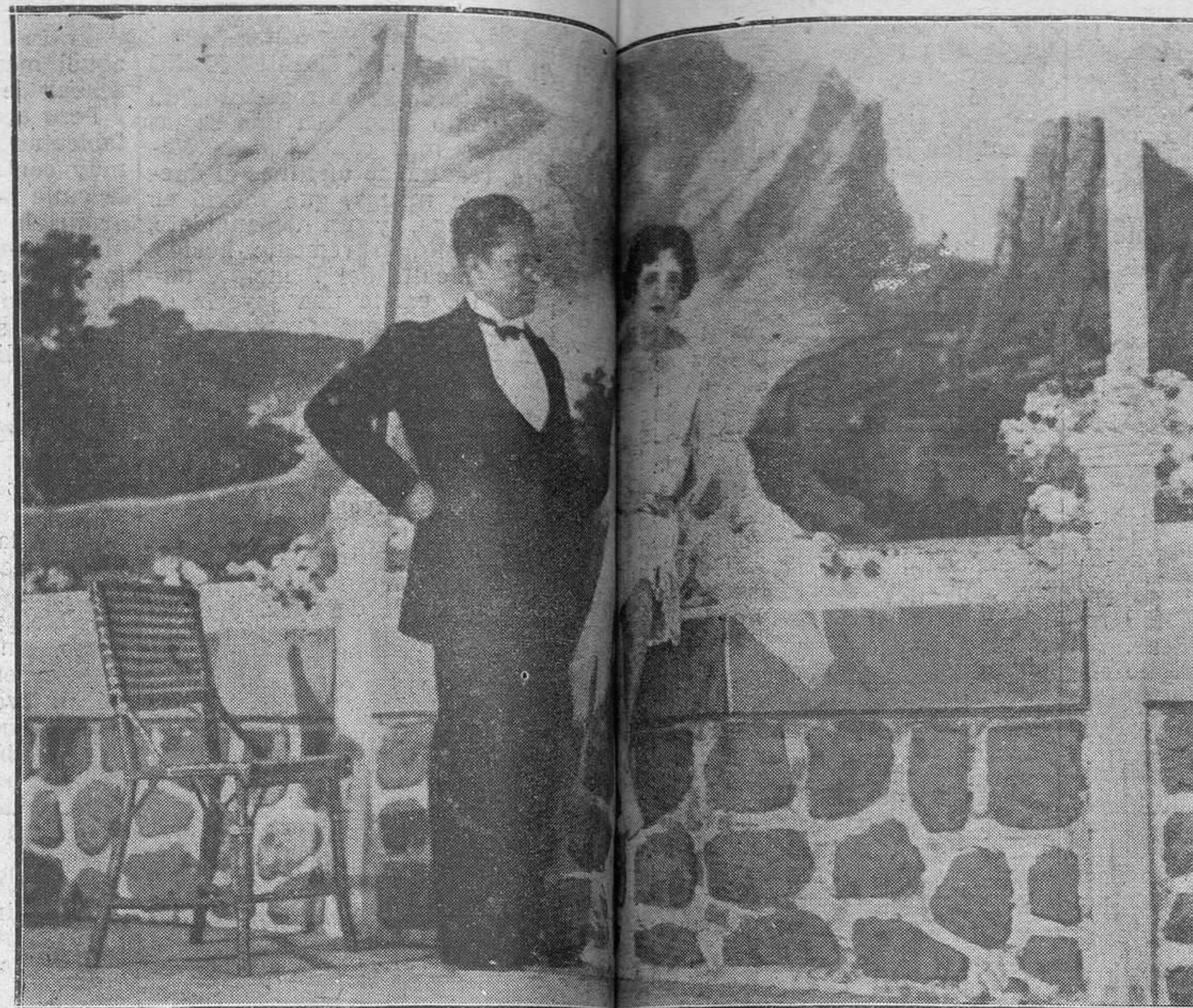
MADRID.—Una escena de la comedia "En paz", original de don Larra, que se estrenó en el teatro Lara.

La burla significa en muchos casos falta de ingenio.