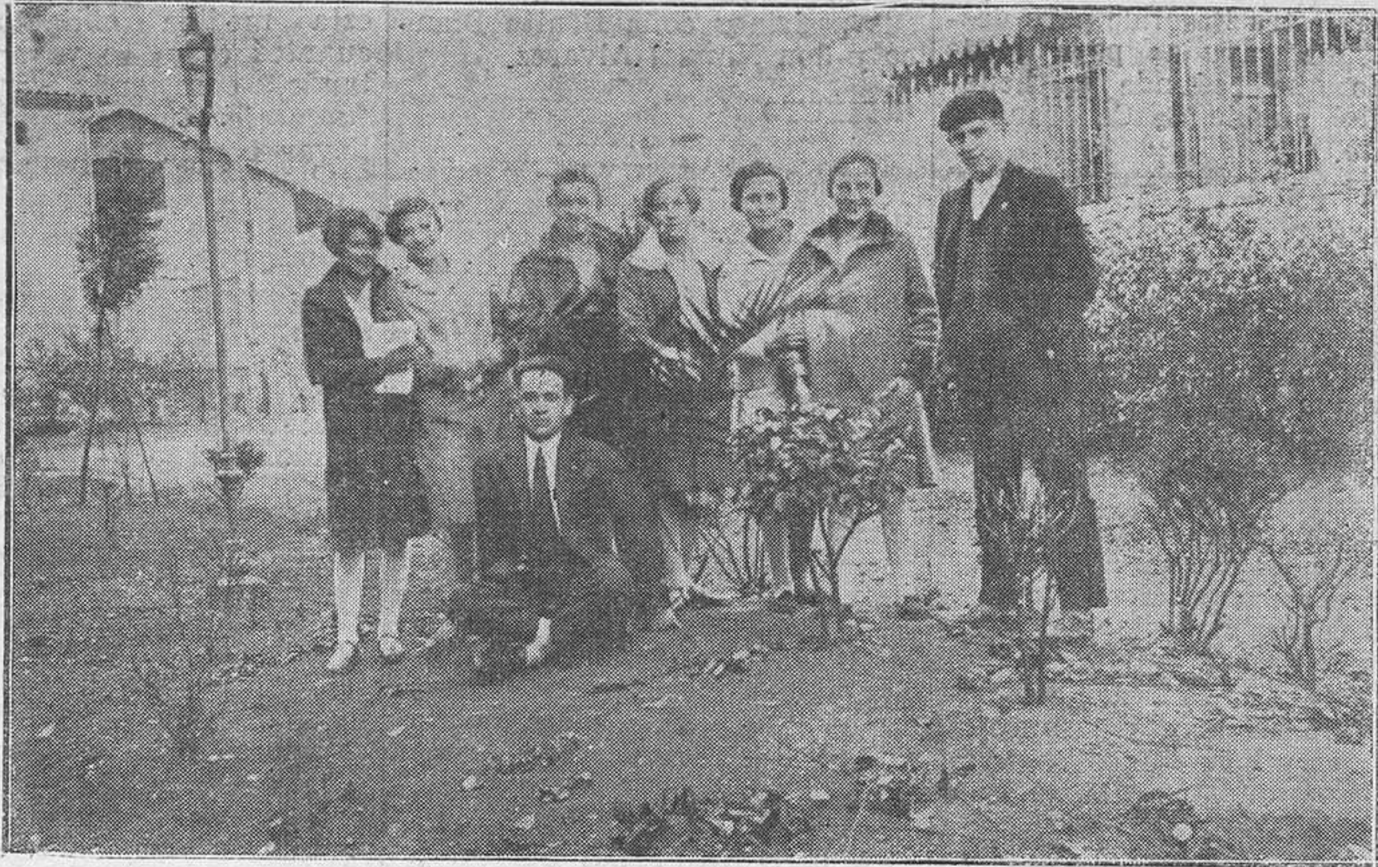
SOTRONDIO.-Un puñado de rapacinas.