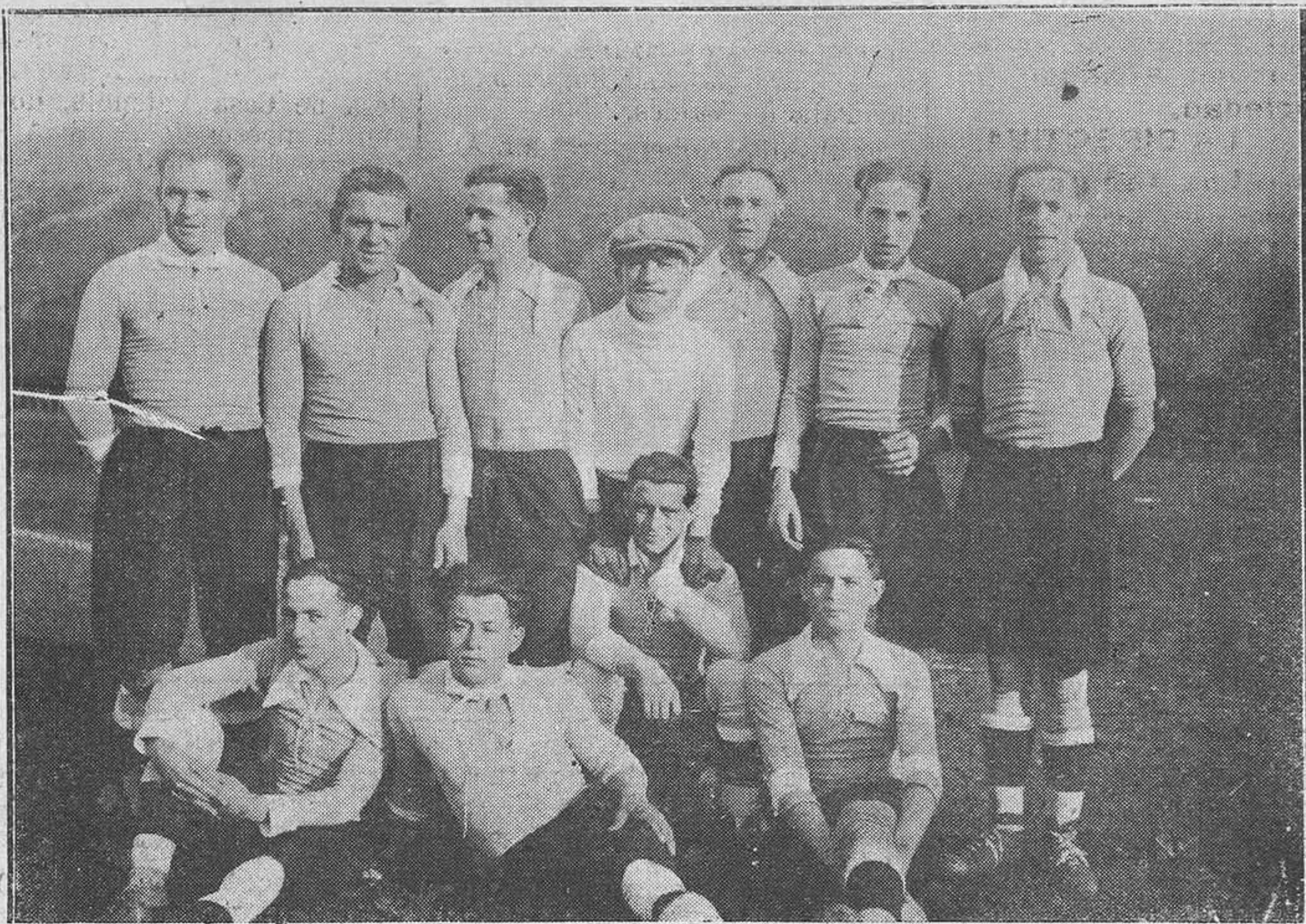
TRUBIA.-Juvancia F. C. de Trubia, que en la actual temporada está obteniendo grandes triunfos sobre los de su categoría.

Para terminar, vamos a dar una noticia grata, pues no llovían a ser malas.