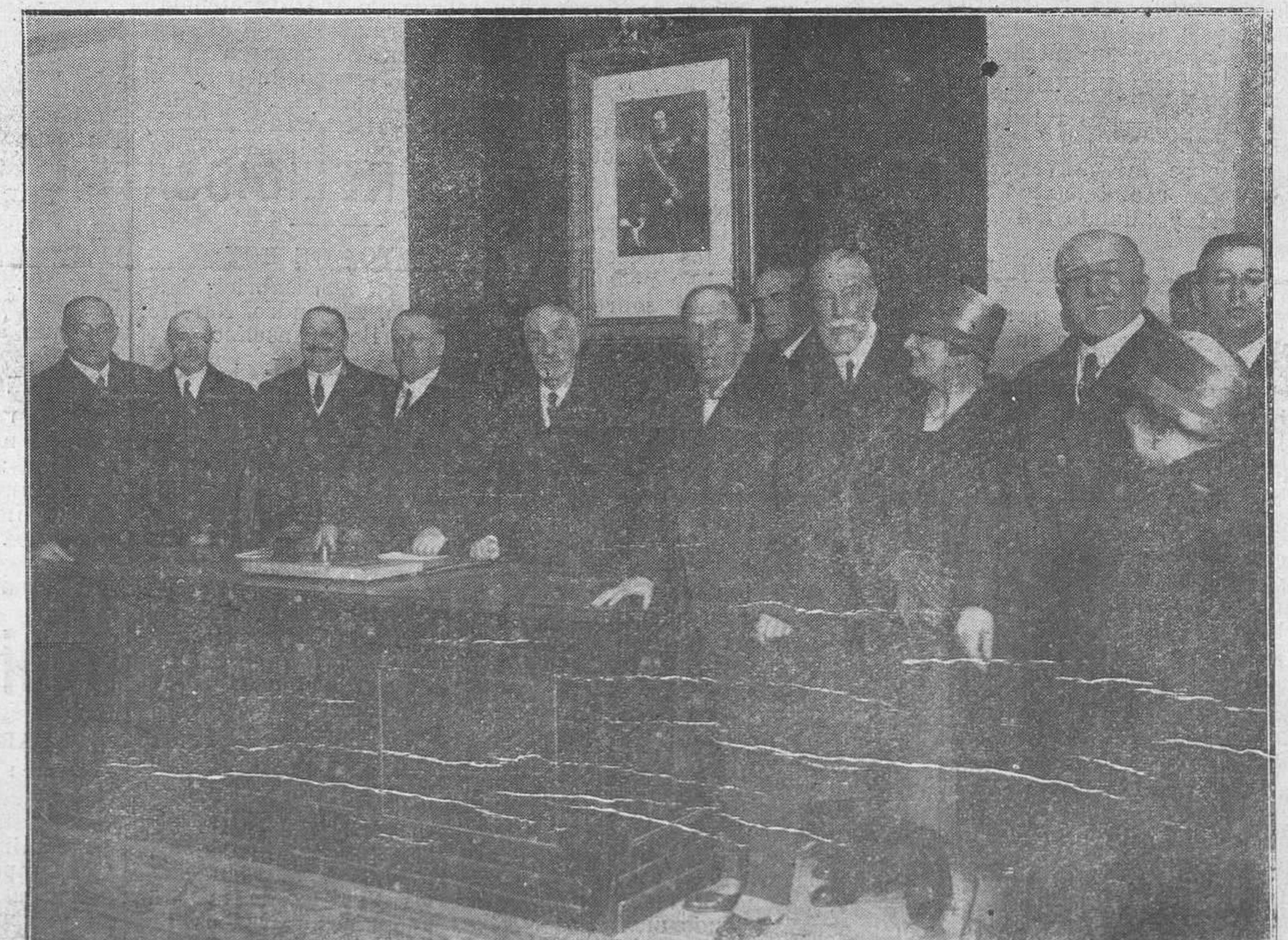
MADRID.—Acto inaugural del curso de estudios organizado por el Tribunal tutelar de niños, y que ha sido presidido por el ministro de la Gobernación.