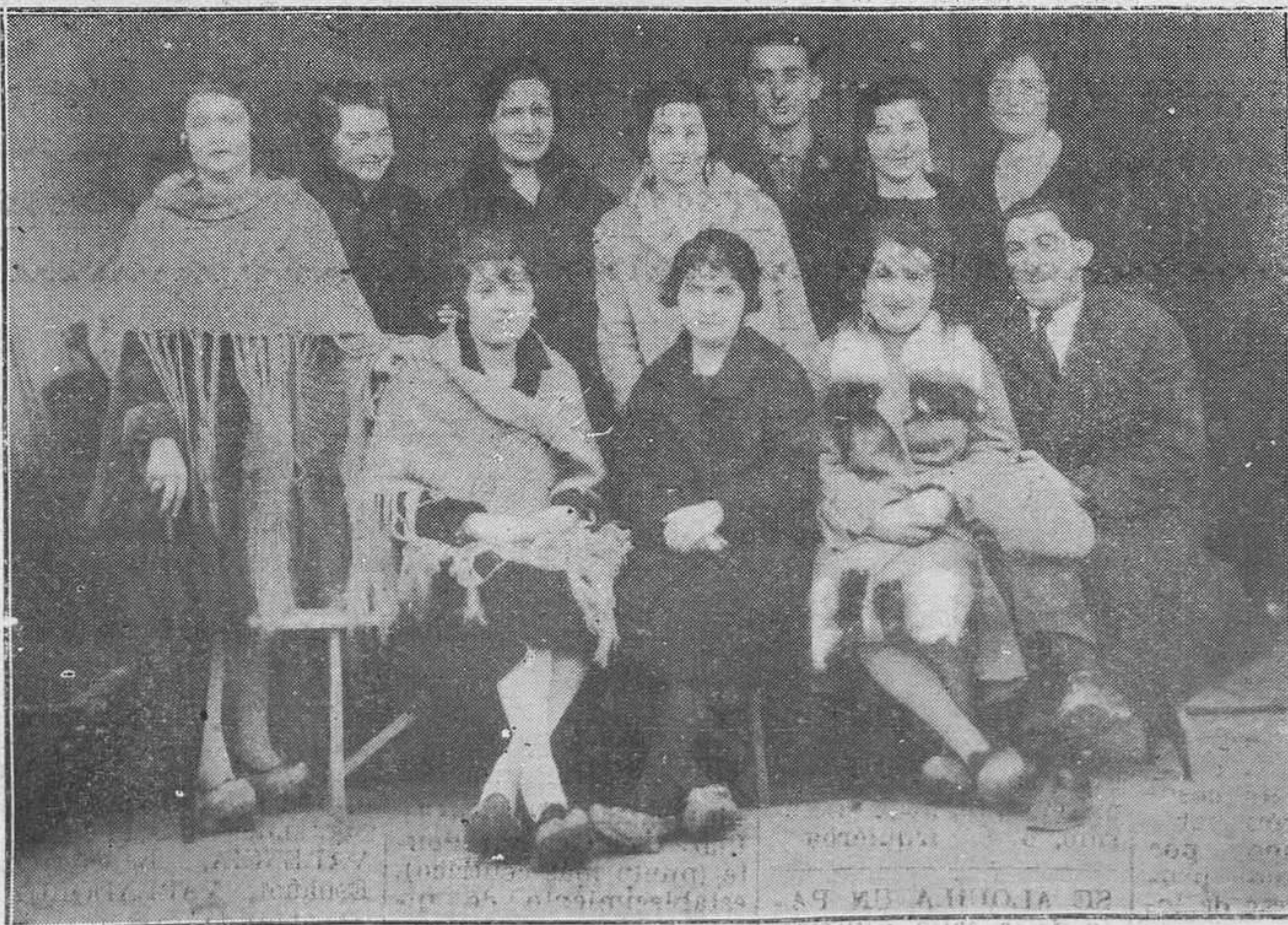
LUANCO.-Plañel de lindas "arañitas" luanquinas posando para REGION.