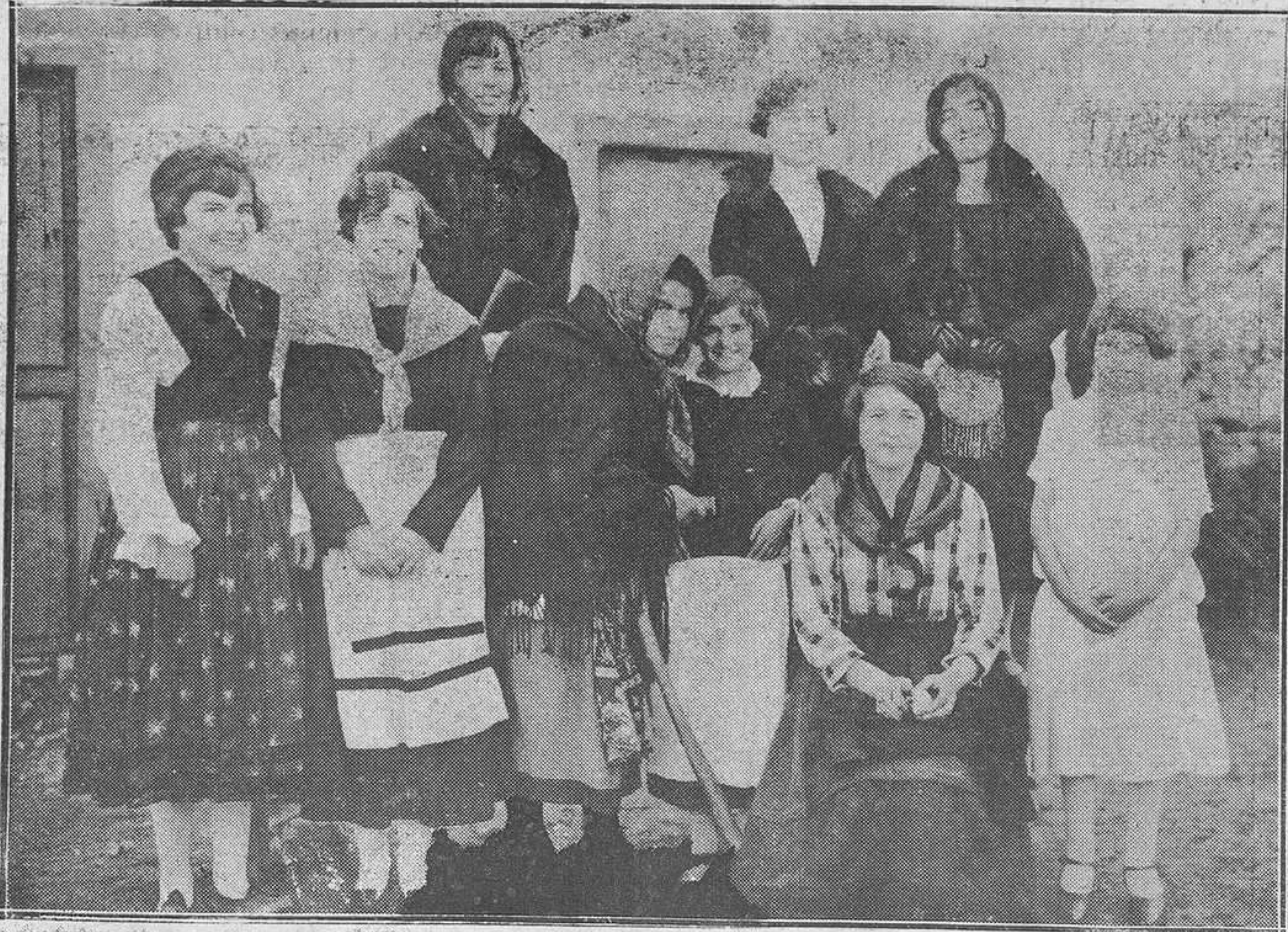
PARRES LLANES. De la representación del sainete "La tía Lechuza".

Estas liquidaciones datan desde el año de 1920 y ascienden