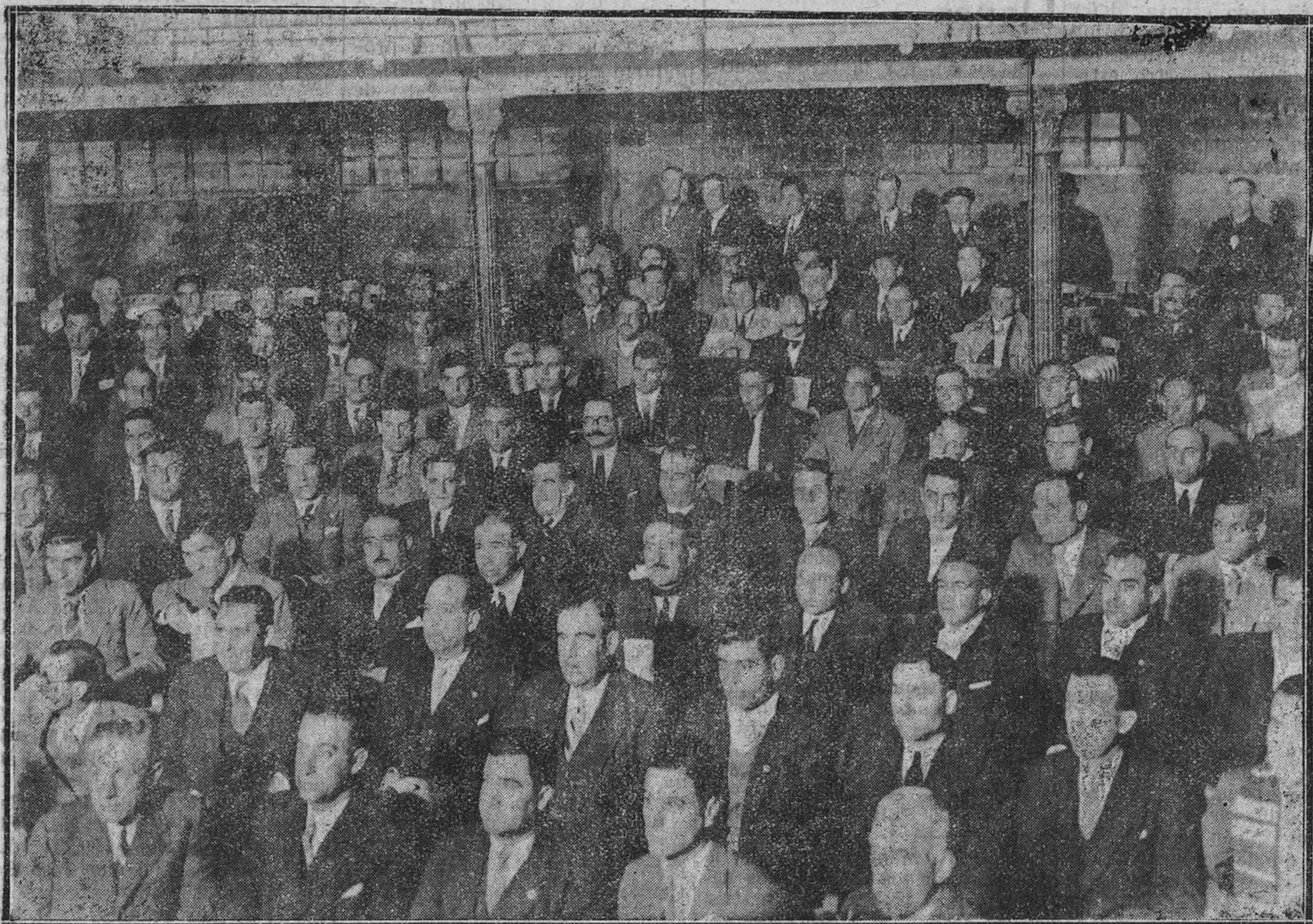
MADRID.—Un aspecto de la platea del teatro de la Casa del Pueblo durante la sesión de clausura del Congreso Nacional Ferroviario.

Muelle Central de Fomento. Apartado 67. Teléf. 253