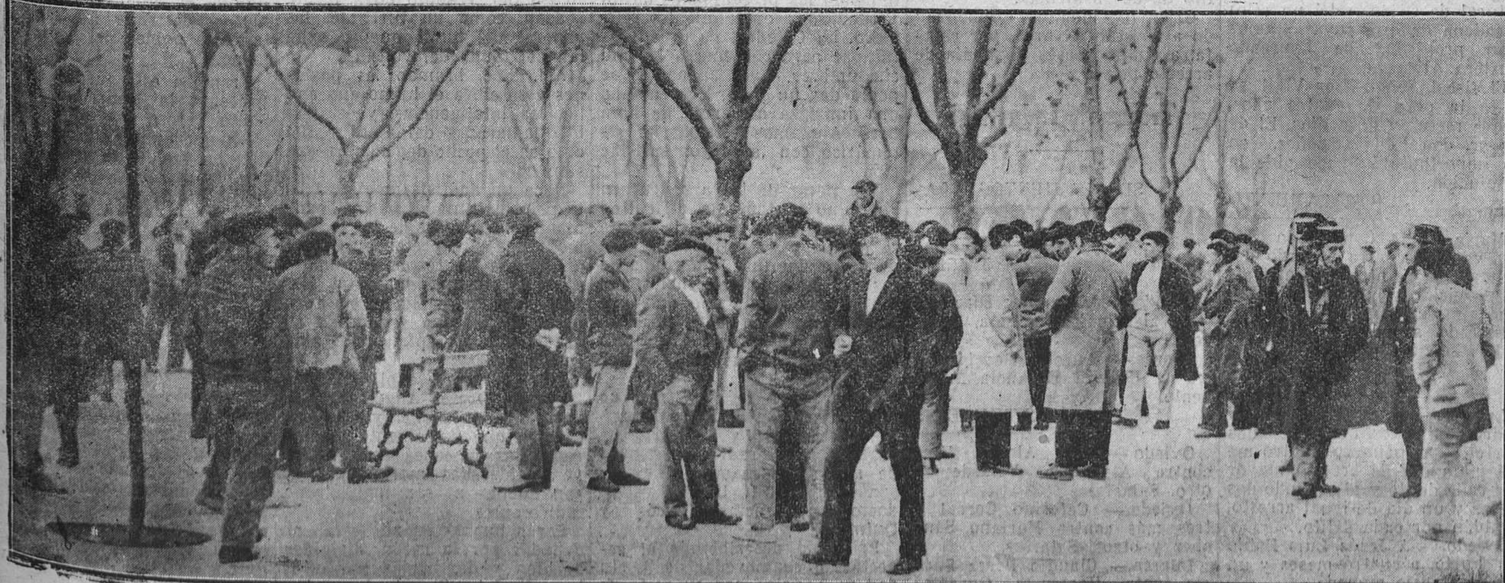
BILBAO.—Grupo de obreros comentando la marcha del plebiscito celebrado con motivo del conflicto de Altos Hornos. (Foto Gil del Espinar).

(CONTINUA ESTA INFORMACION EN LA PAGINA 14)