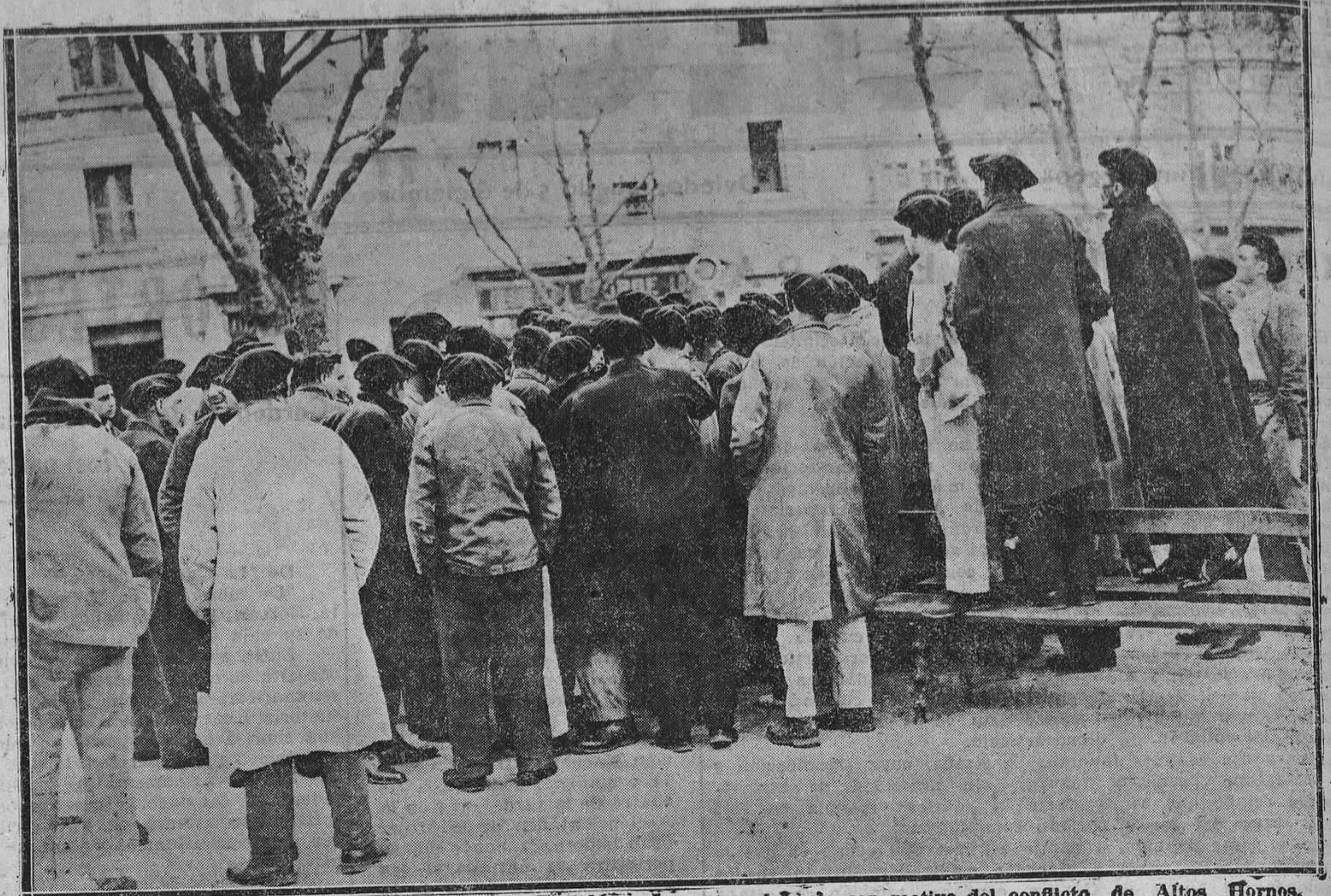
BILBAO.—Un aspecto de la plaza de Baracaldo durante el plebiscito celebrado con motivo del conflicto de Altos Hornos.