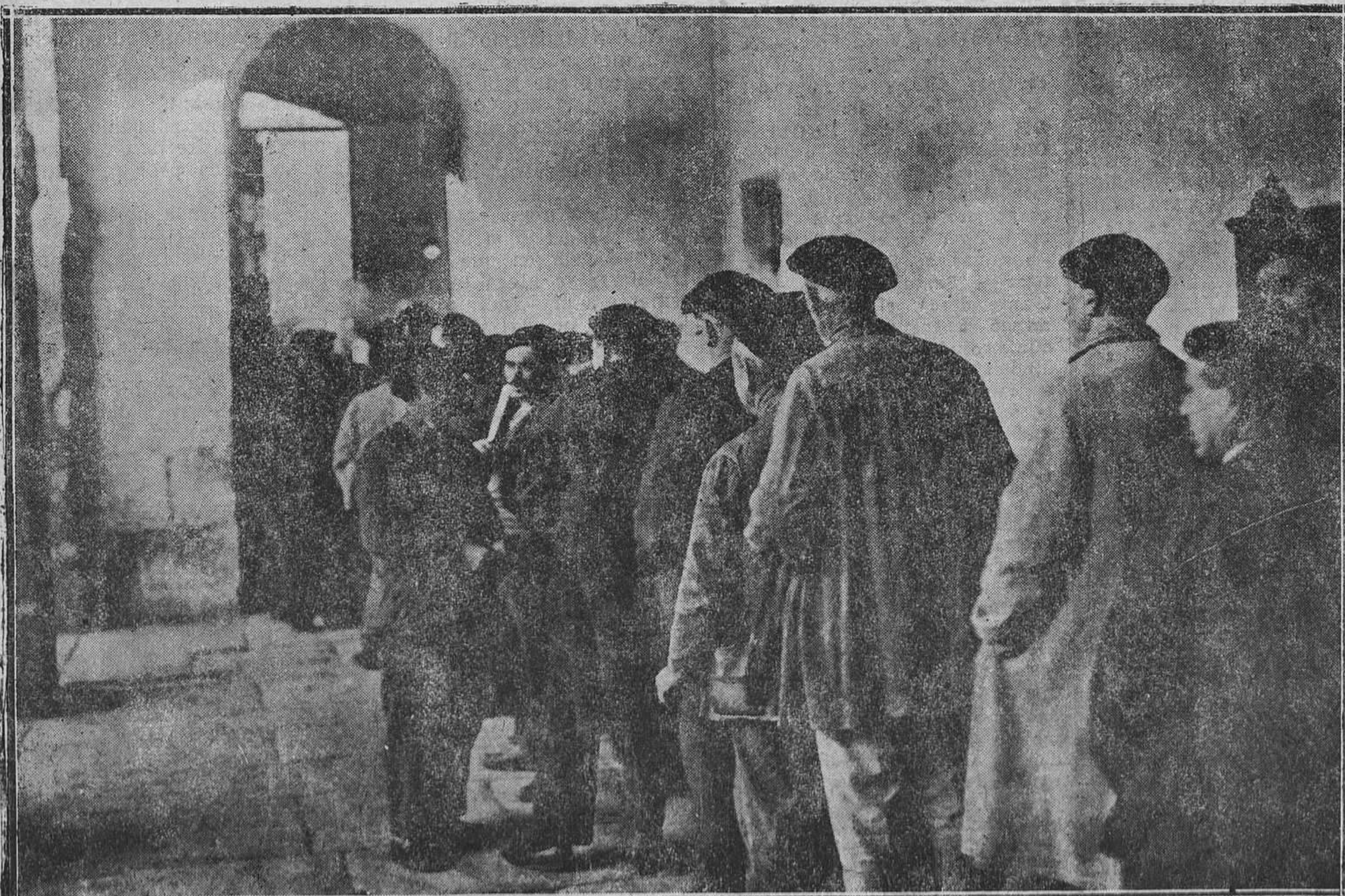
BILBAO.—Un grupo de votantes en el plebiscito celebrado para solucionar el conflicto de Altos Hornos.

El Pronosticador Lambrecht anuncia: "Se mantendrá o variará poco el tiempo reinante". El telegrama del Observatorio de Madrid recibido hoy dice: "Bajas Occidente Escocia, Altas en Rusia. Probable Cantabria y Galicia tiempo de lluvias. Resto de España cielo nublado y nebuloso. Tendencia a empeorar. Rutas aéreas del Sur de España y Canarias buen tiempo. Habrá marcada en el Cantábrico".