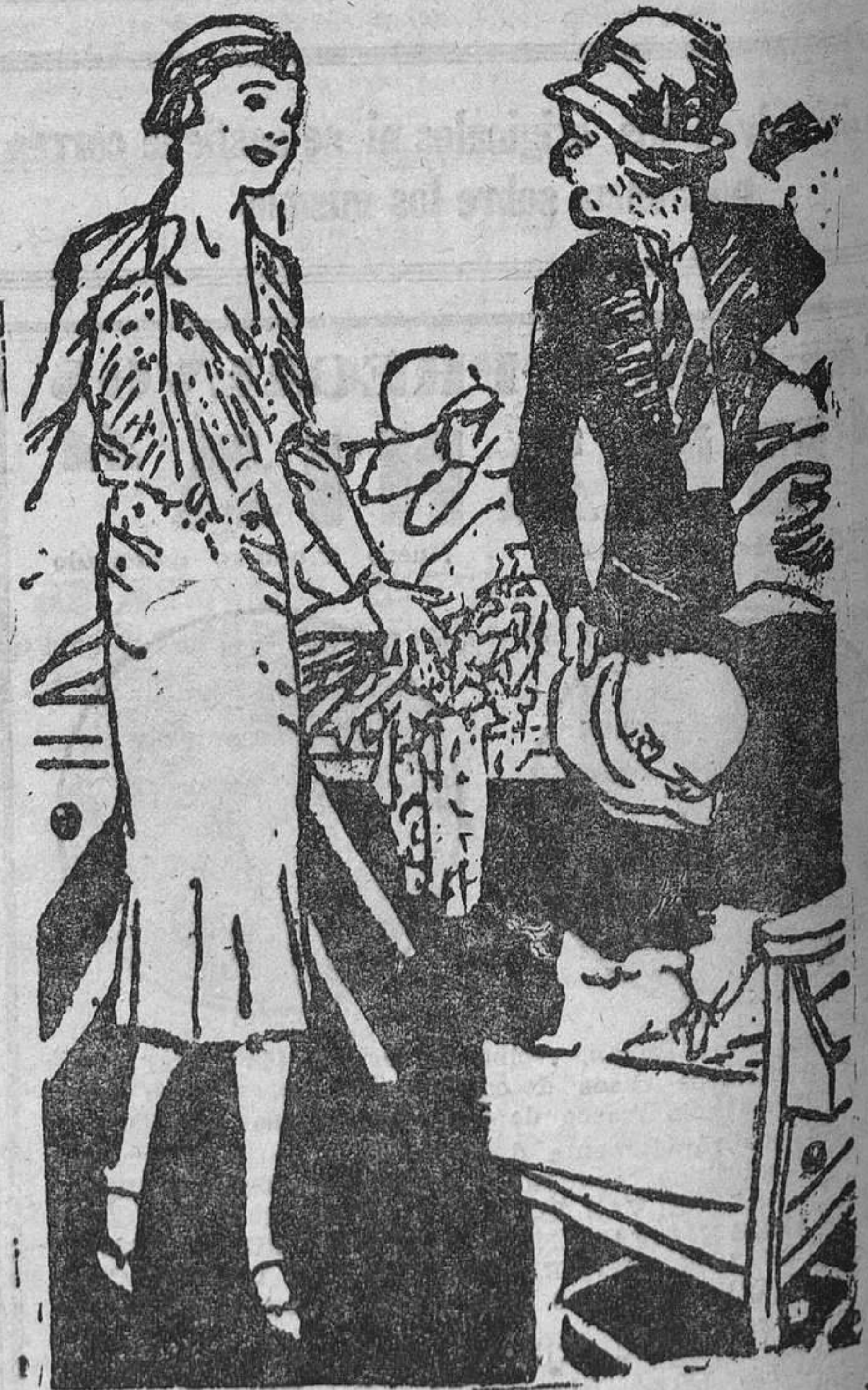
LA ENCANTADORA DAMA (en la venta de caridad).—LA DAMA DEL COMITE.—¡Cielos! ¡Pero si ese cuarto es el vestuario!