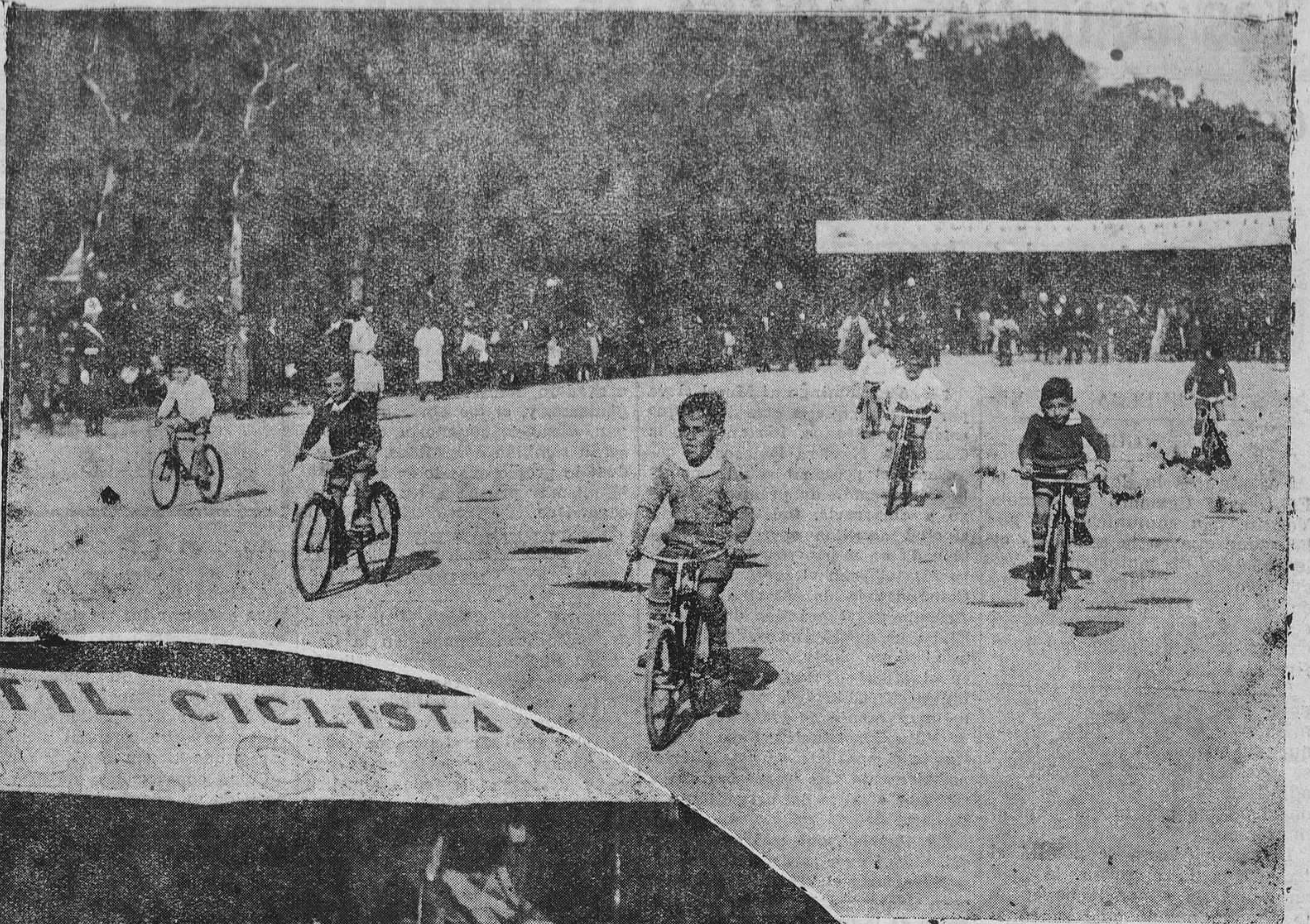
MADRID.—Un momento de la carrera infantil ciclista celebrada en el Retiro.