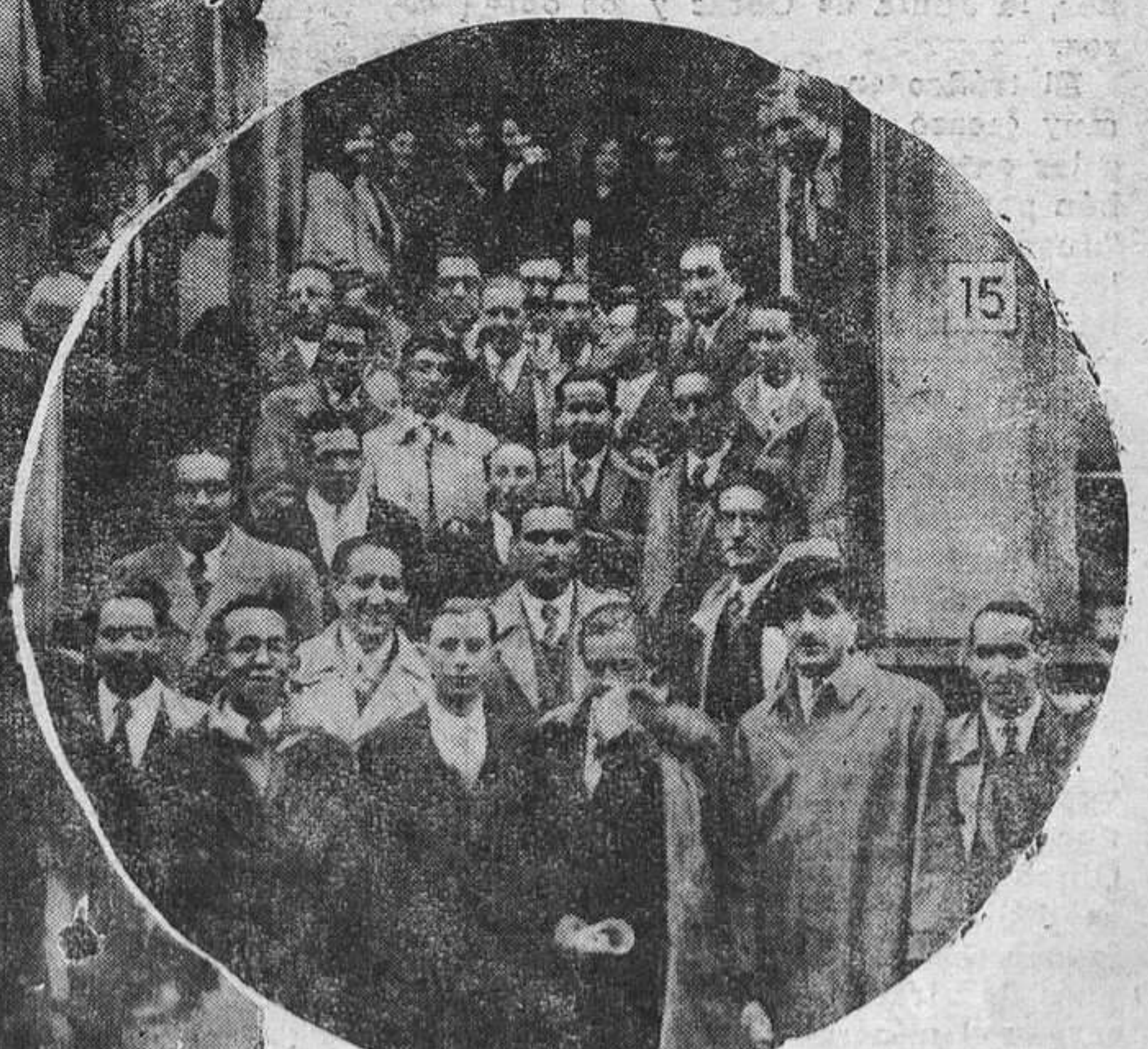
OVIEDO.—Un grupo de cursillistas de Magisterio ante la puerta de la Normal.

el m... reste... de su... cele... teatro... nol... sical... e" (S... rre... e, qu... la qu... e nola... bles... ; pos... o. p... loma... tretón... aberla... os can... n, por... ás gu... eguid... empo... vertu... a, au... toda... un "E... eles... /El N... remata... que el... laudir... felic... ecos... nzado... enviá... uy sim... or Gen... pación... inados... balla... os que... onados... FE... LAN... CIOS... ntesta... te Fe... última... voca... nta ge... se ce... e Sin... ates el... mingo... res de... ETIVA... n... de el... en... Amá... foren... icipal... lego... de of... o uno... rpo de... s días... s nuev... imado... lamos... s... EZ... nio de... al a la... Inmue... bleidad... neda... e, 24