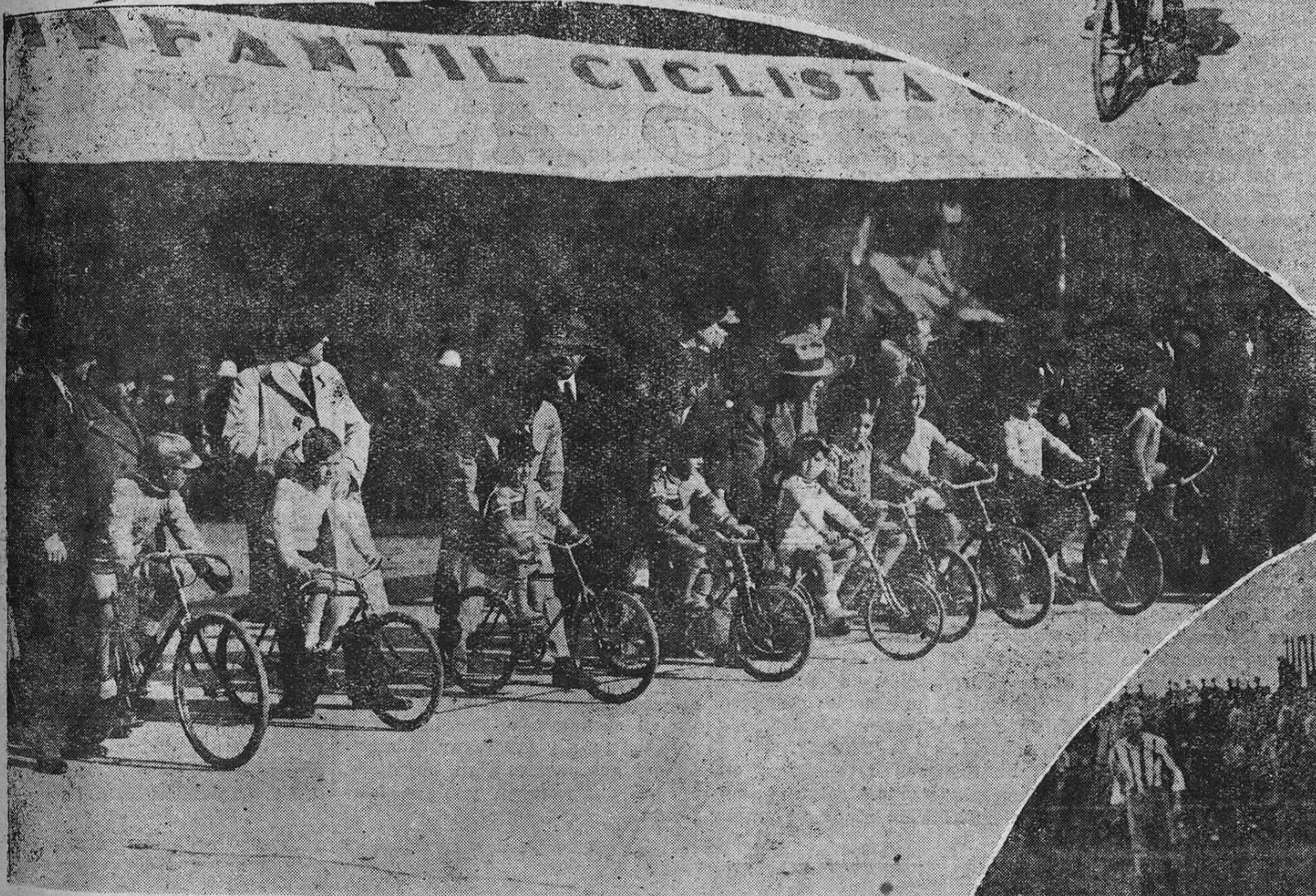
MADRID.—De la carrera infantil ciclista celebrada en el Retiro. Los pequeños corredores preparándose para la salida.