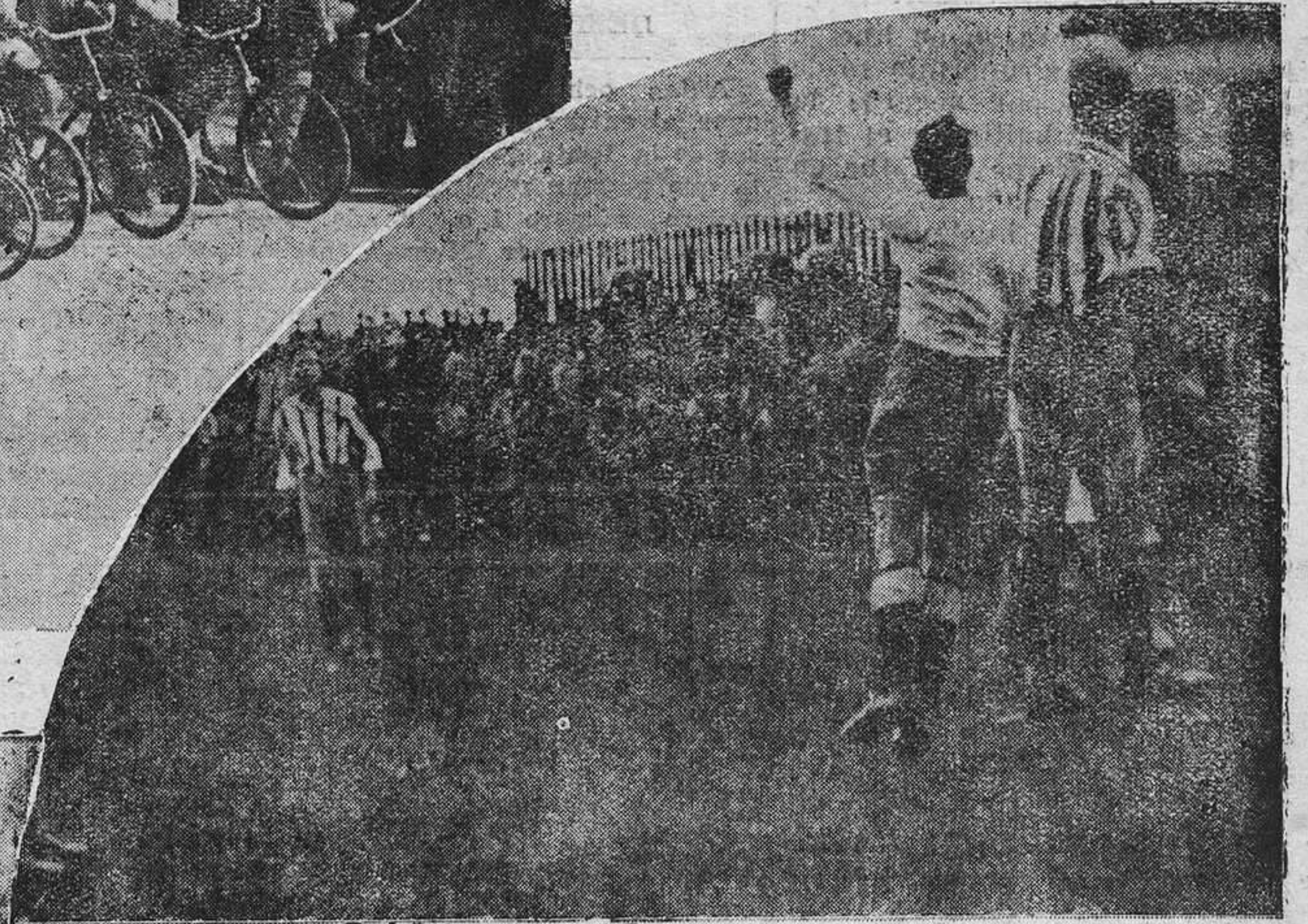
DEL PARTIDO DE TEATINOS.—Uno de los contados momentos en que Sión vió su terreno comprometido. (Foto Mena).