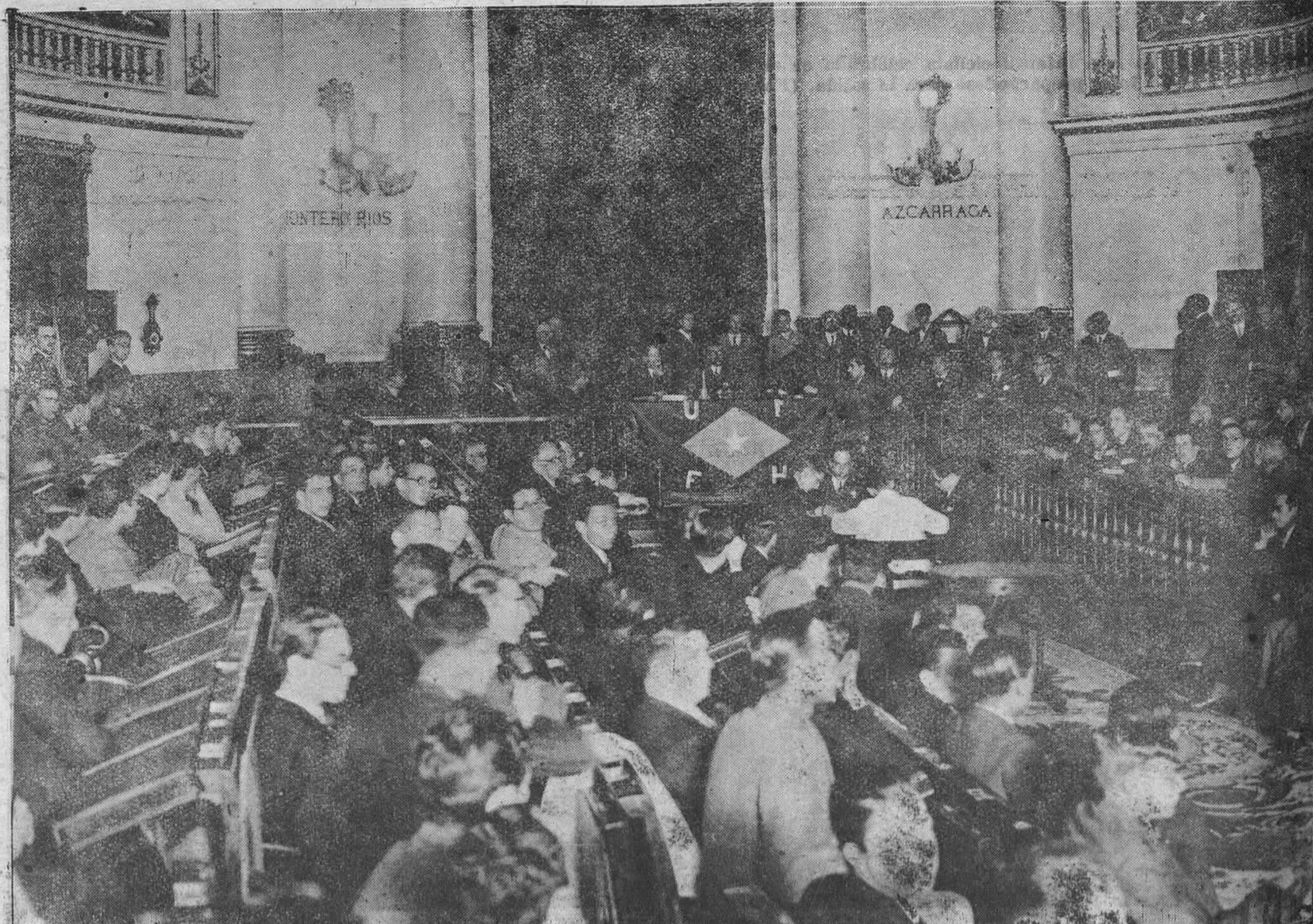
MADRID.—Aspecto del Senado durante la sesión de clausura del Congreso de la Unión Federal de Estudiantes, a la que asistieron representantes del Gobierno y de la Cámara Constituyente. (Foto Vidal).

El vapor noruego "Edward", que conduce madera, sigue sin aljar su cargamento. Por la mañana se disponía a atracar al muelle del antepuerto, pero, sin duda, recibió contraorden y sigue fondeado.