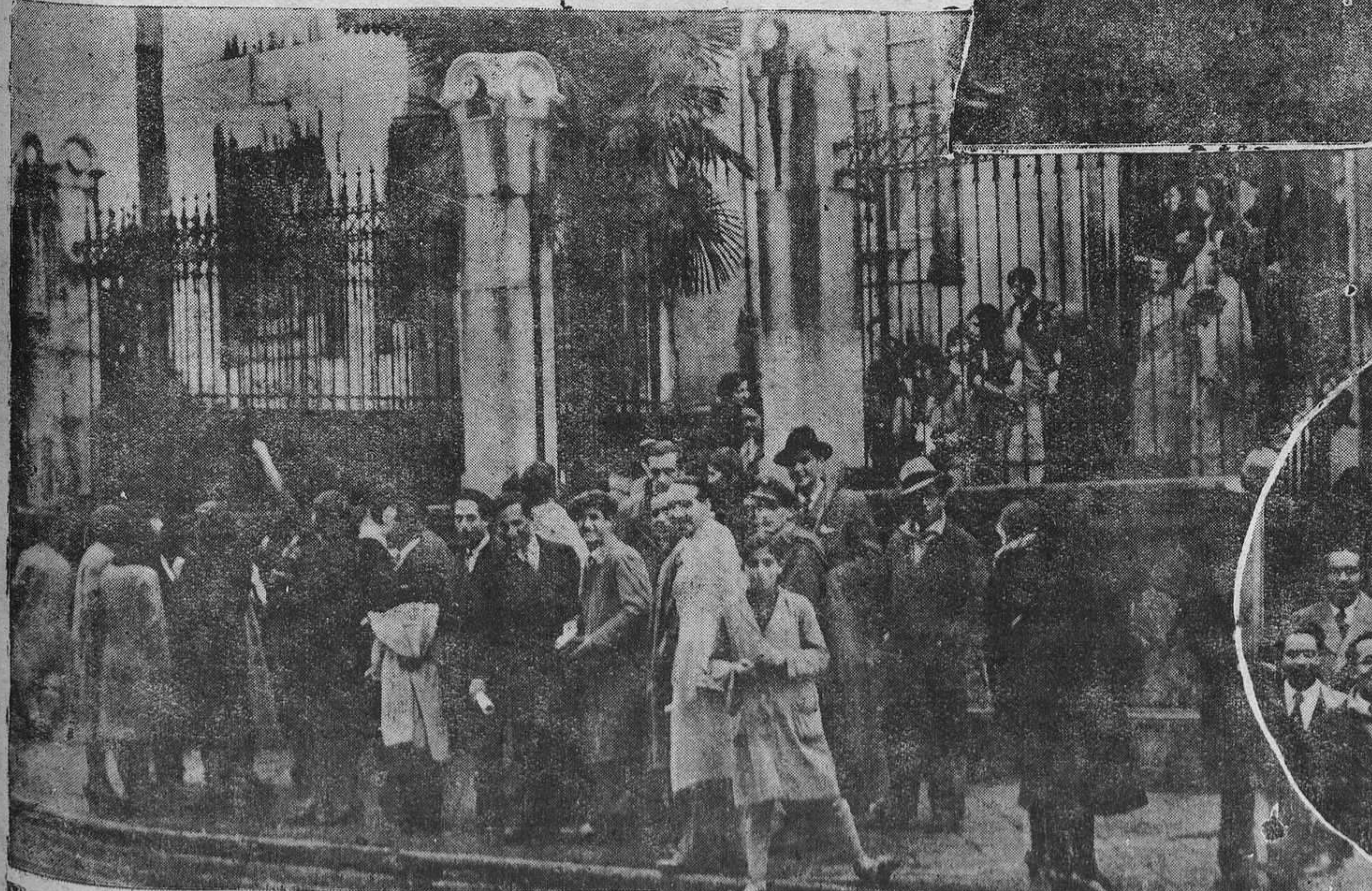
OVIEDO.—Los cursillistas en el momento de entrar pacíficamente en la Normal a las clases celebradas el lunes.