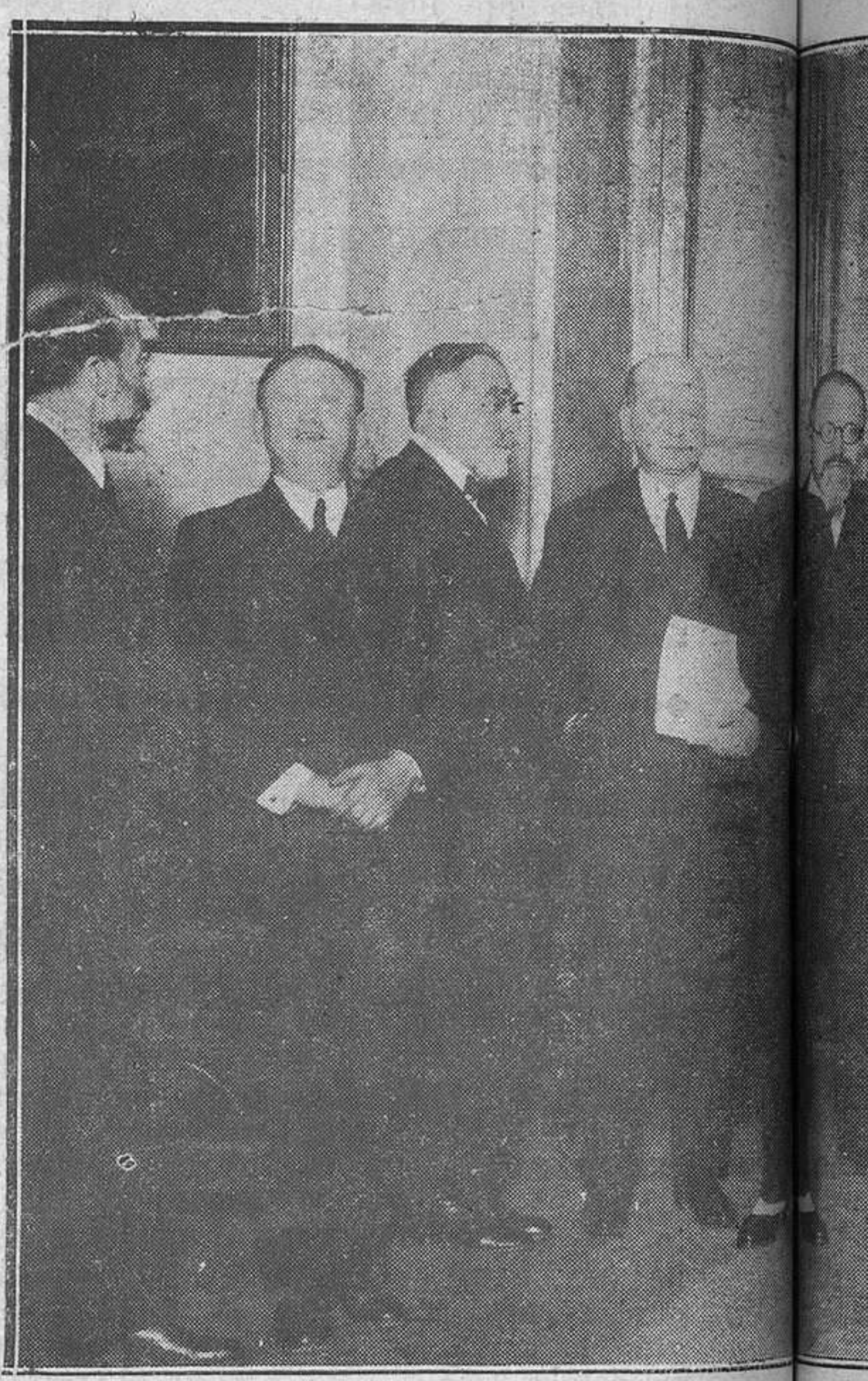
Madrid.-El excelentísimo señor duque de Alba, presidente de la Academia de la Historia, rodeado de varios académicos.

Nosotros nos reimos también, pero otra cosa que dentro.