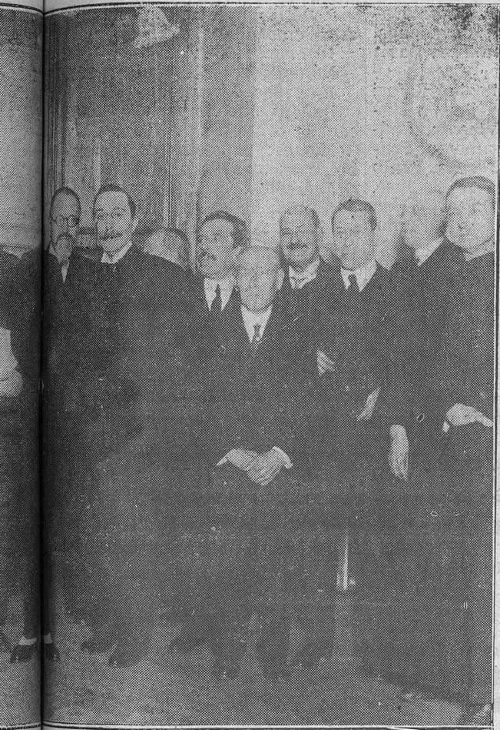
...haber tomado posesión de la presidencia de la Real de Avilés que han asistido al acto.

La jugada que dió el goal, como decimos, fué provocada por Trucha, pero Oscar pudo, si no muy bien, parar el tanto. Se tiró al balón, pero tuvo también desgracia, porque lo tocó y se le coló dentro. Continúa el juego con las mismas características: mucho coraje por parte de Avilés, y más desconcierto por parte de los de Oviedo. Una cuantas jugadas más y termina la primera