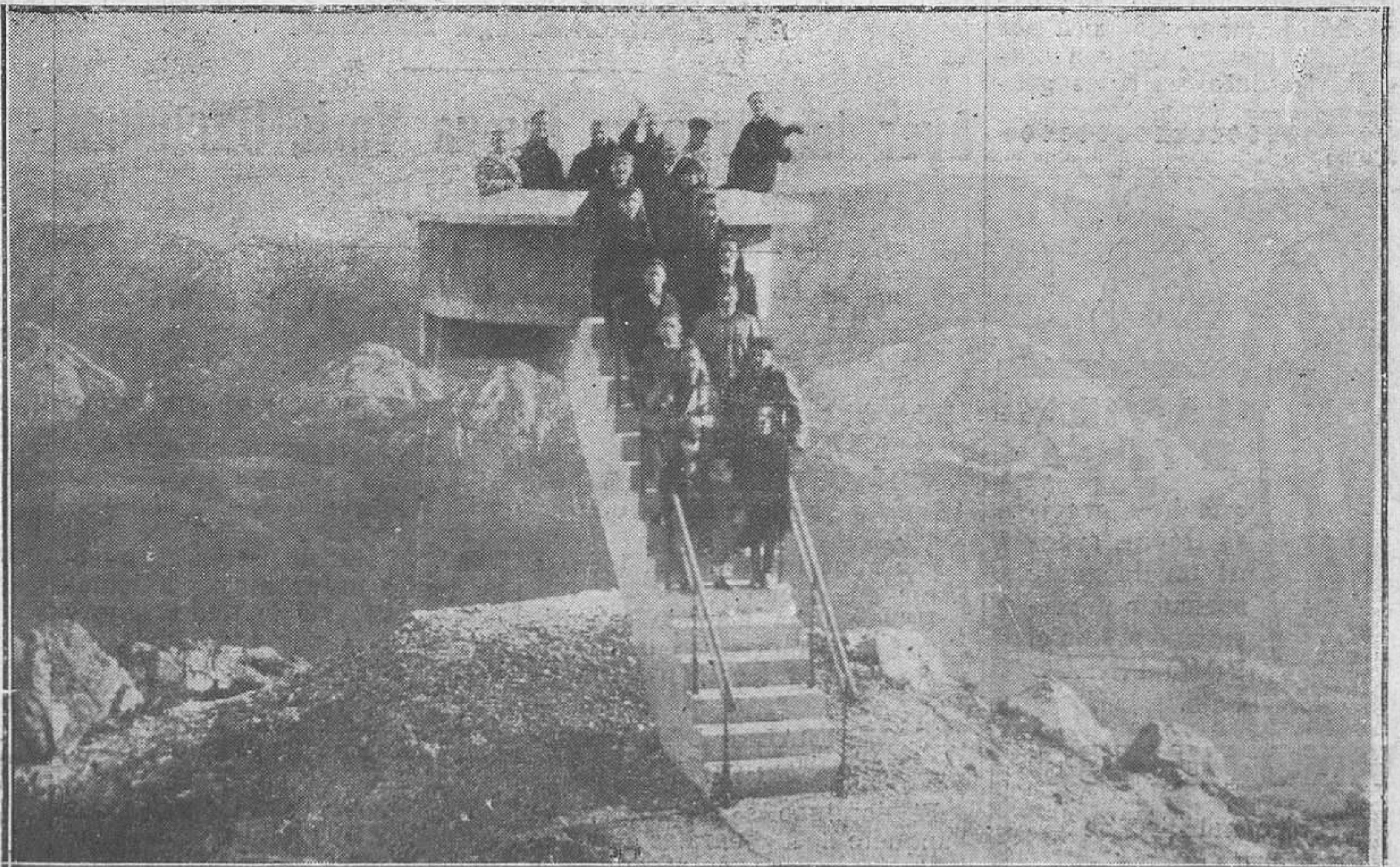
Arrións.-Excursionistas de la Coral Covadonga en su visita al Mirador del Fito.