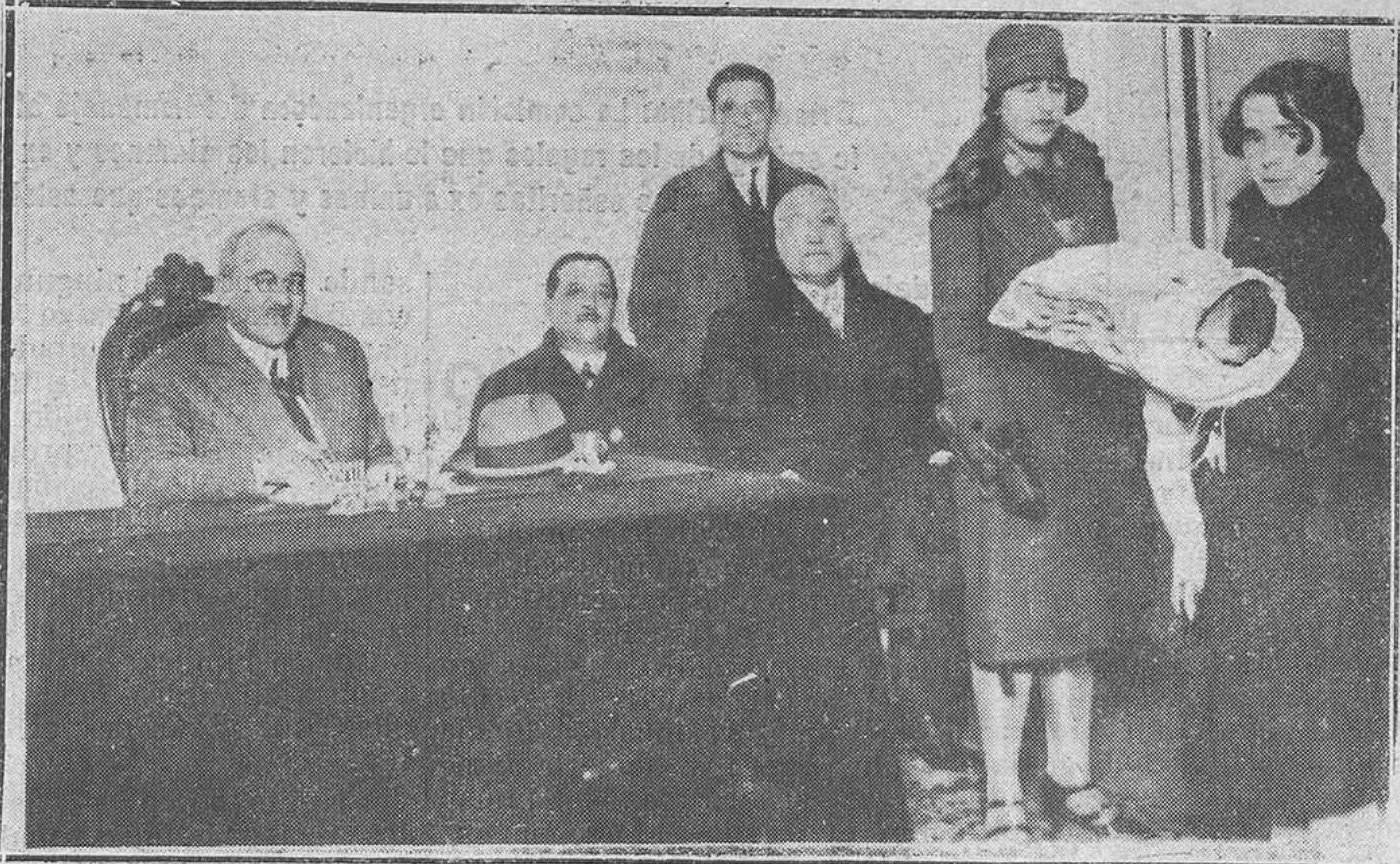
Oviedo.-Un momento de la entrega de prendas, en la Gota de Leche.

muy interesante. El presidente escuchó con sumo agrado al señor Soto, quien le informó de los nuevos proyectos de moder-