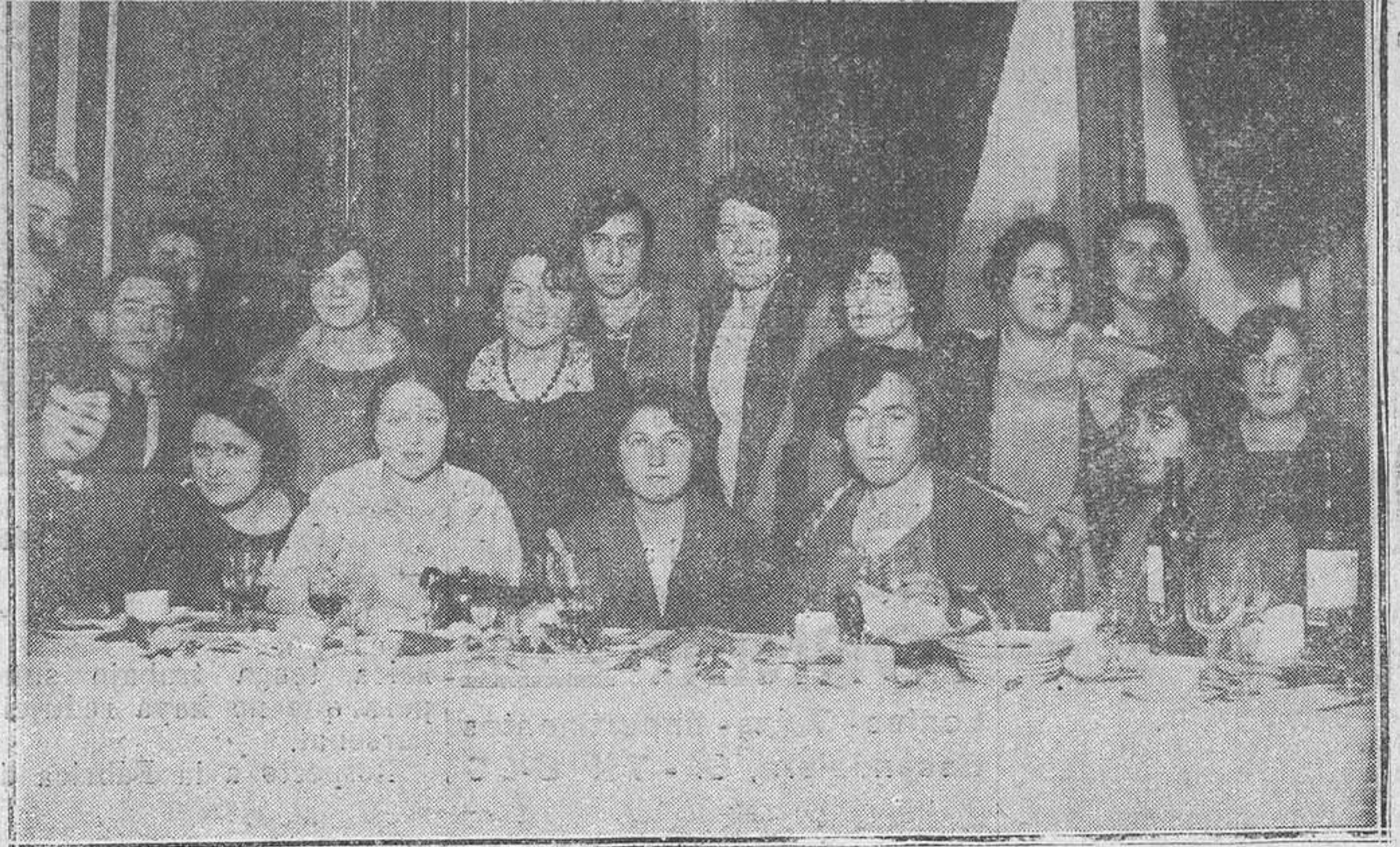
Oviedo.-Arriba: La comisión organizadora del homenaje al director del Liceo Asturiano, haciéndole entrega de los regalos que le hicieron los alumnos y ex alumnos del Colegio.-Abajo: Algunas de las señoritas ex alumnas y alumnas que asistieron al homenaje.