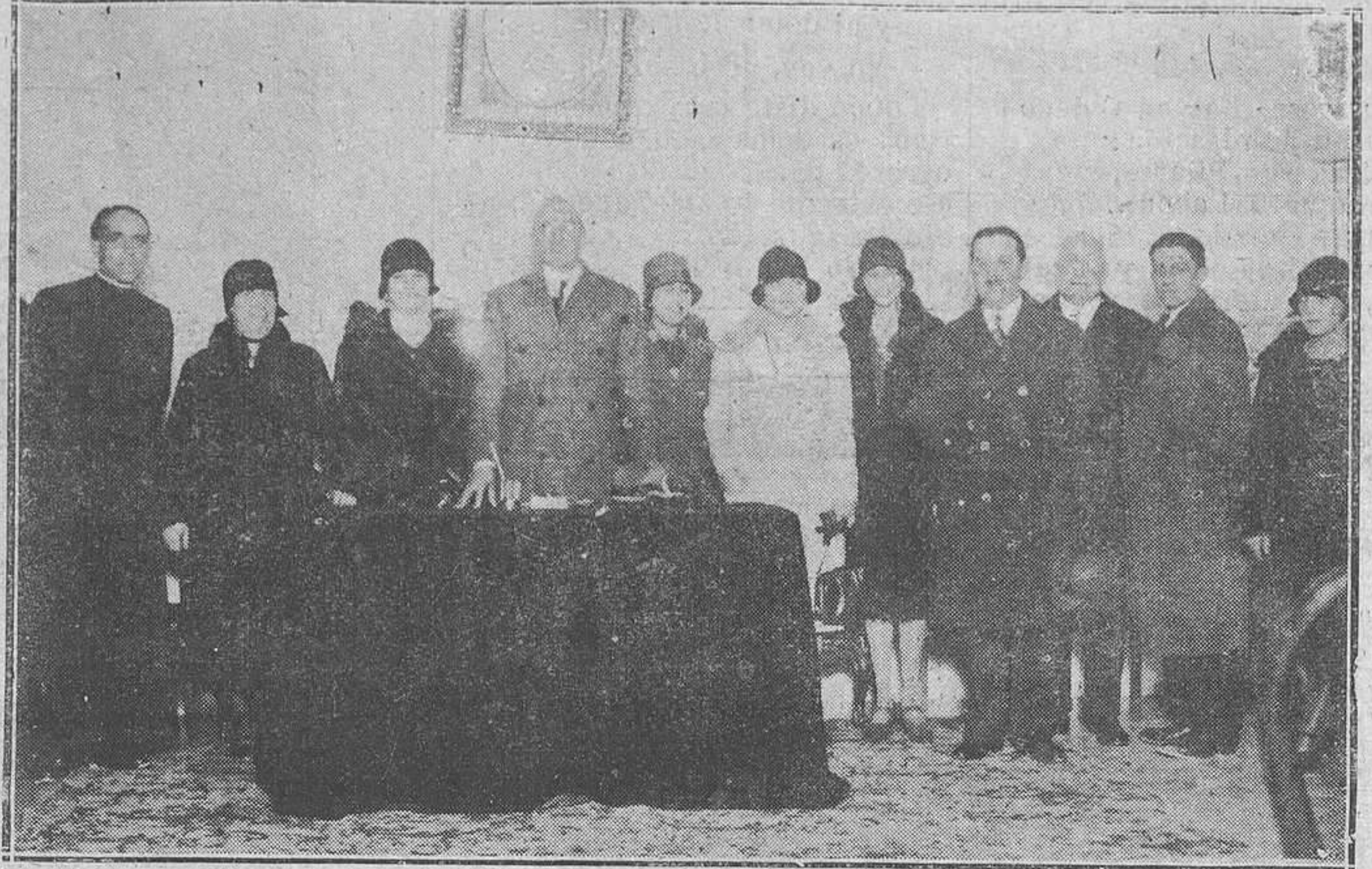
Oviedo.-Las autoridades y Junta de Damas de la Gota de Leche, presidiendo el reparto de ropas celebrado ayer tarde.

Después de una bonita portada de "Pascual", publica una bien hecha caricatura del actual alcalde de Gijón. "De cómo y por qué sale a luz esta revista", por la Redacción.—"Postales de mi álbum", por O. F.—