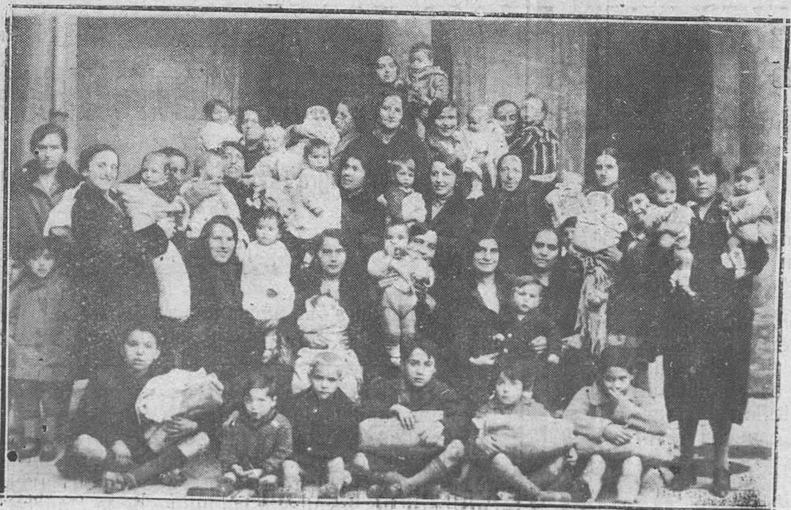
Oviedo.-Grupo de madres que con sus hijitos acudieron ayer tarde a la Gota de Leche, al reparto de ropas.