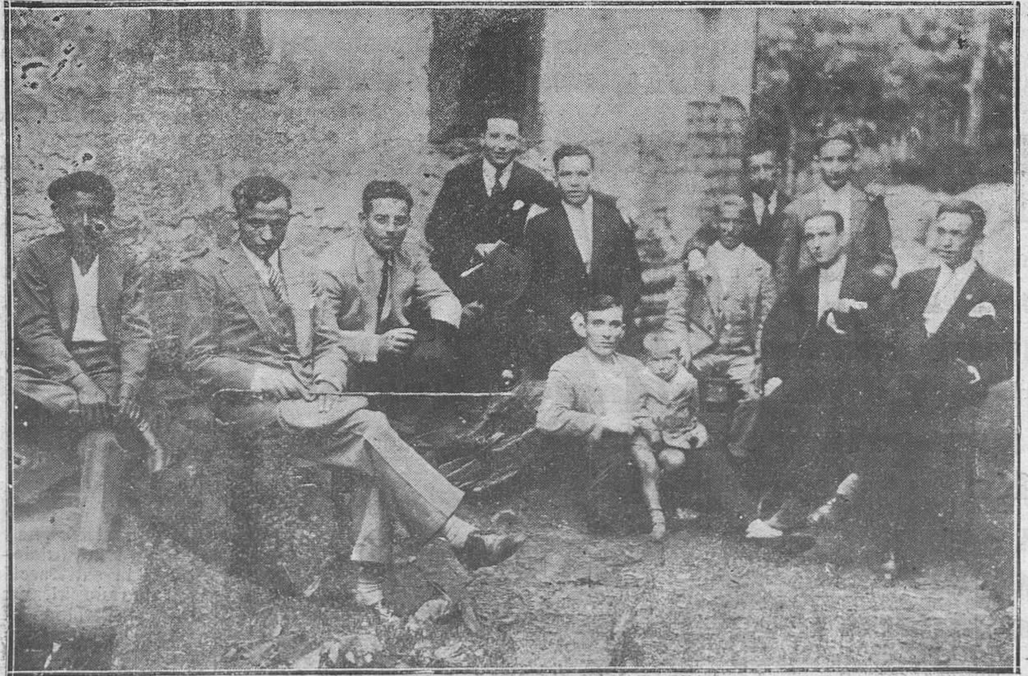
560-Añer.-Un grupo de romeros.

El paro afecta a unos 500 obreros, y con este motivo vienen a engrosar las filas de los que pululan por las calles en paro forzoso.