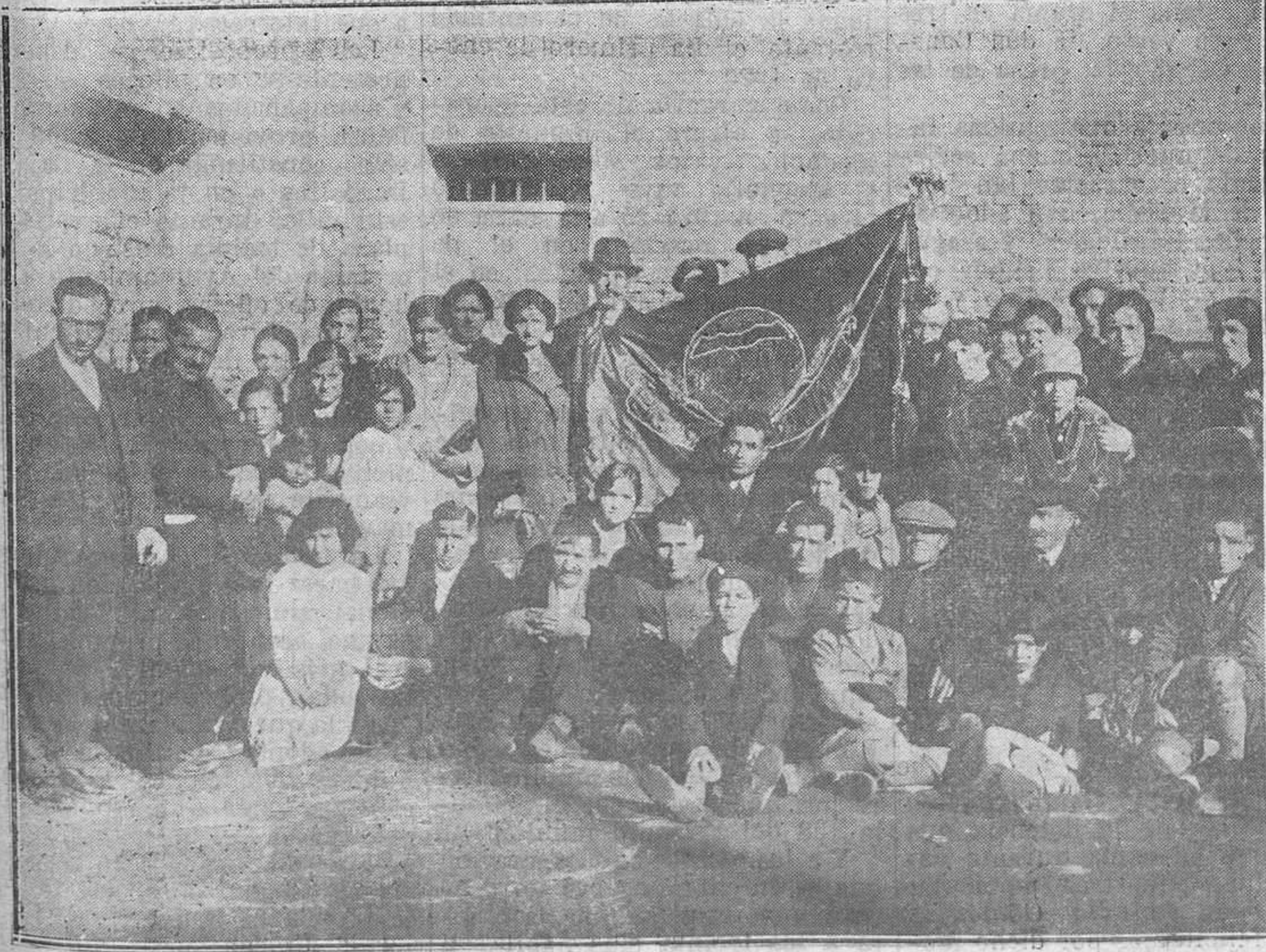
Madrid.—La nueva bandera de la "Unión de Vecinos" del barrio de Picazo, que ha sido bendecida en la parroquia de San Ramón y apadrinada por la hija del alcalde de Madrid.

Consultorio Rodríguez San Pedro.-Piel, nerviosas y mentales.-Uría, 72.-Oviedo.-Tel. 10-40