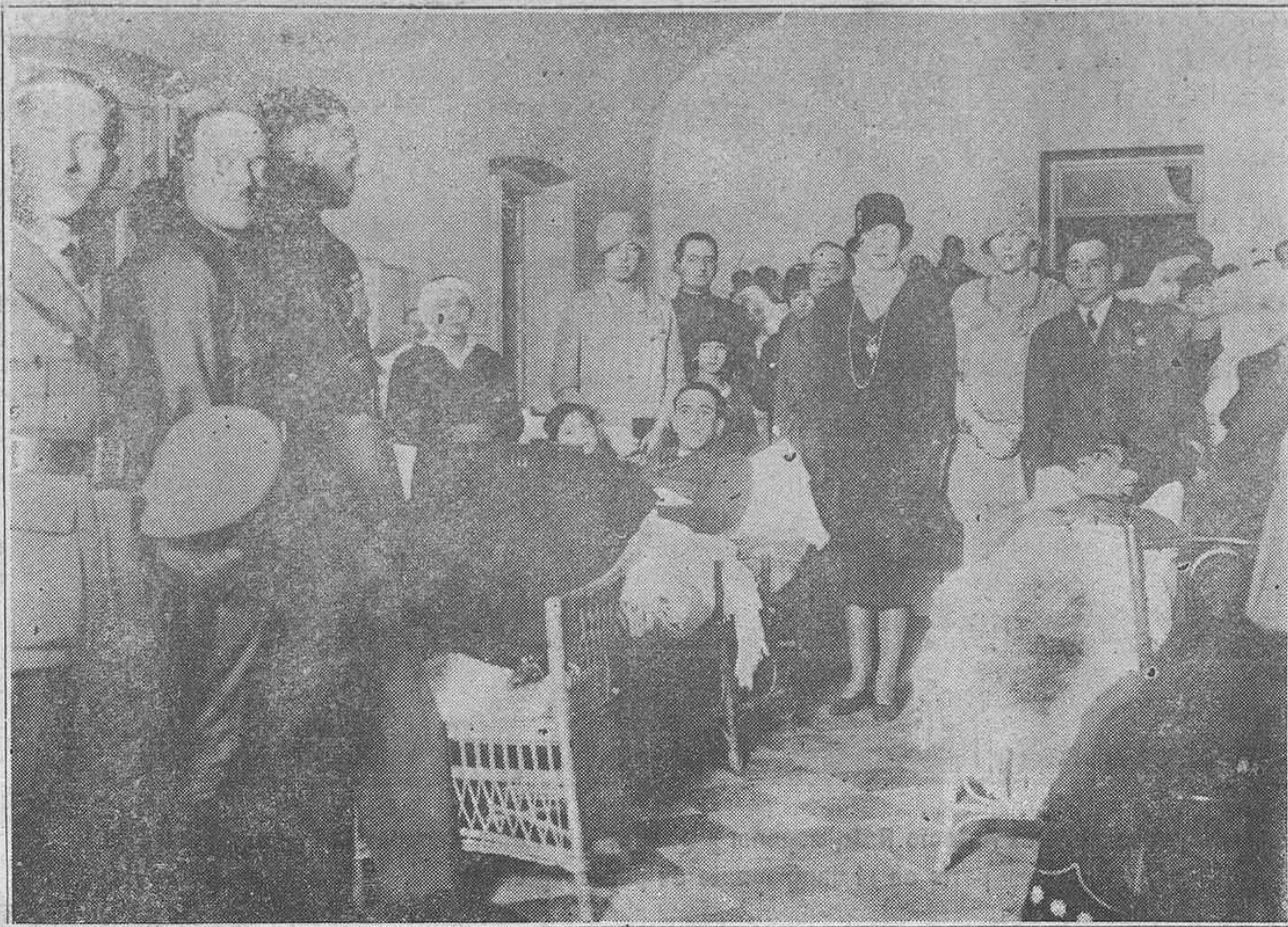
Madrid.—S. M. la Reina doña Victoria, con sus augustas hijas las Infantas doña Beatriz y doña Cristina, visitando a los enfermos y heridos, en el Hospital militar de Carabanchel, a los que han entregado gran cantidad de regalos.