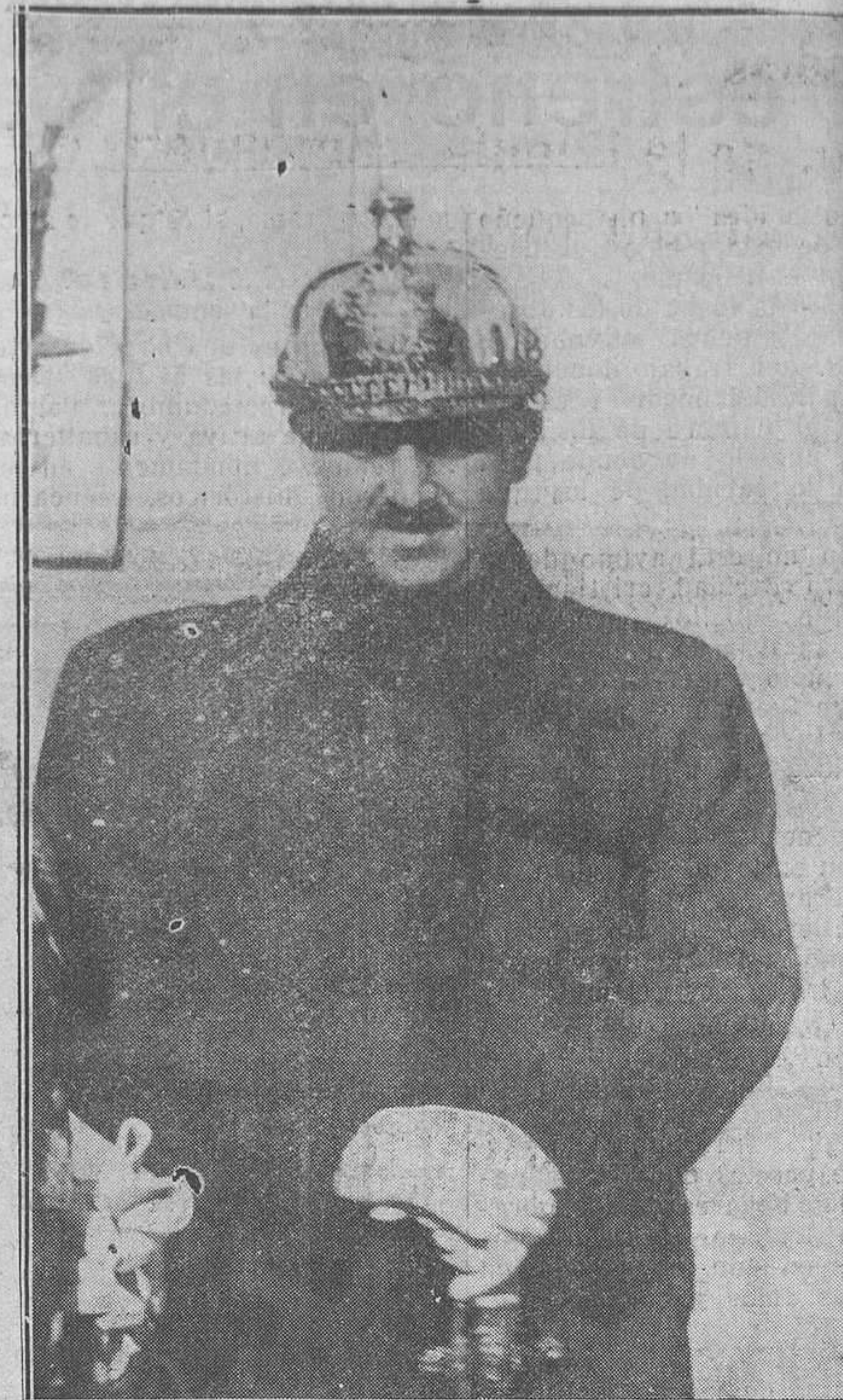
Madrid.—El general don Francisco Franco, que ha sido nombrado director de la Academia general militar de Zaragoza, según hemos adelantado hace muy cerca de un mes.