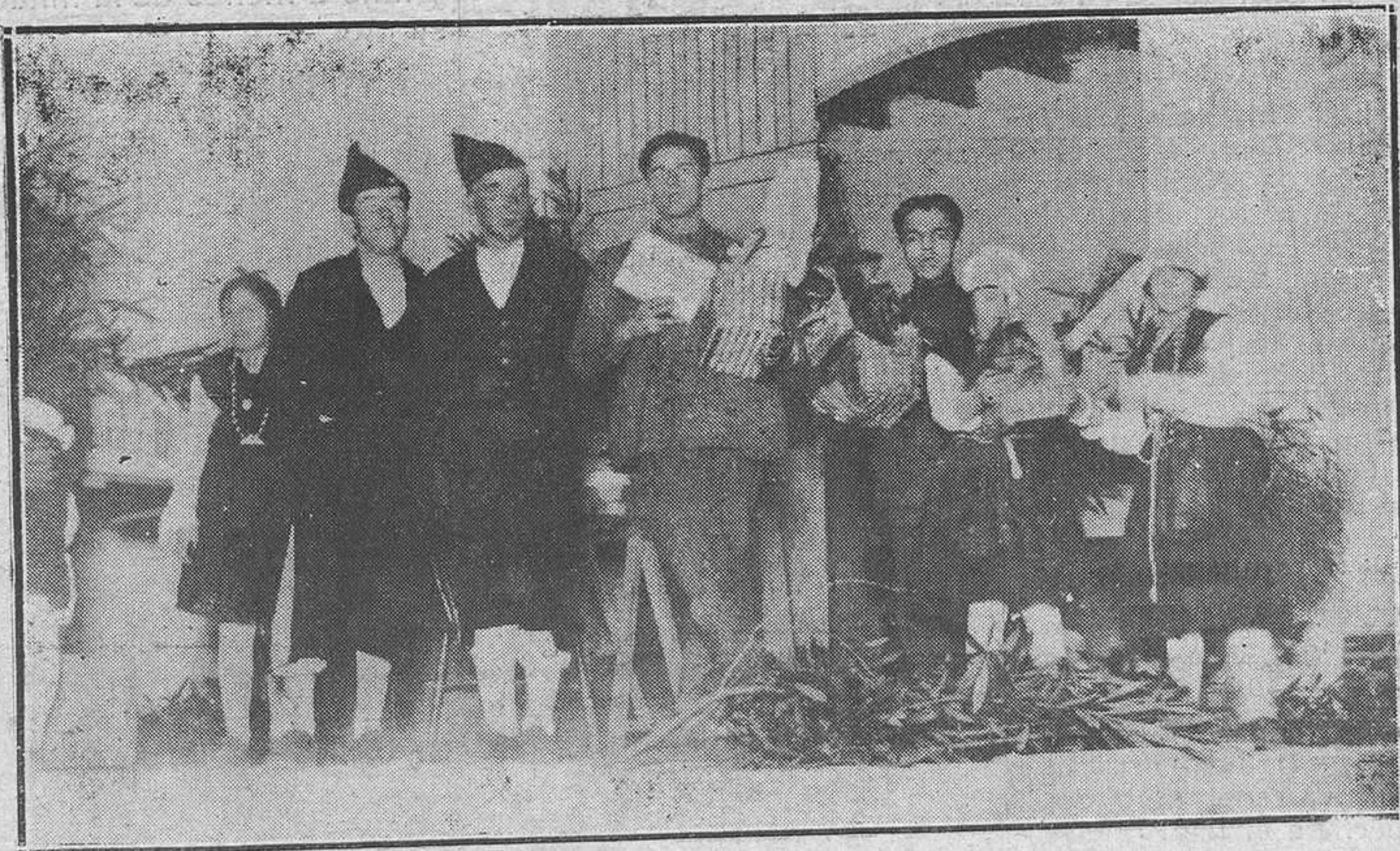
Oviedo: La fiesta de las damas catequistas.—Los obreros recogiendo las castas.

Idem de don Silvestre Cano, pidiendo rehabilitación de licencia para ampliar un hueco de puerta en la casa número 22