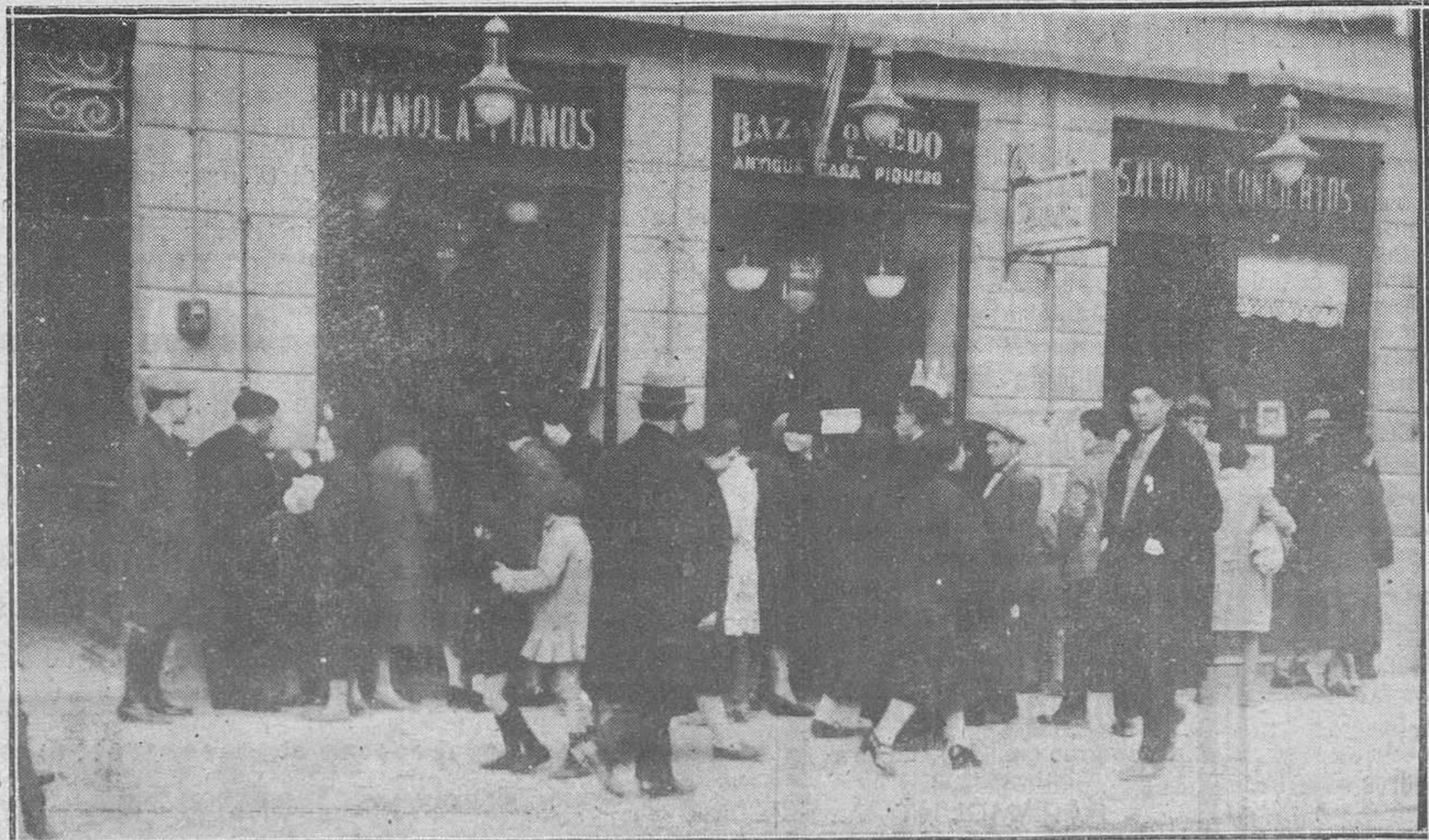
Oviedo: La fiesta de Reyes.-El público ante los escaparates del Bazar Piquero, admirando los juguetes de REGION (Mena)

Y lleno de ingenua emoción, dormía, para tornarme despierto! ¿Qué juguetes prefería el poeta de pequeño? Tal vez por extraña herencia, gustaba de un instrumento musical. Era el violín el juguete de mis sueños. Como hoy gozo con la música, gozaba en aquellos tiempos con mi pequeño violín, el juguete de mis sueños.