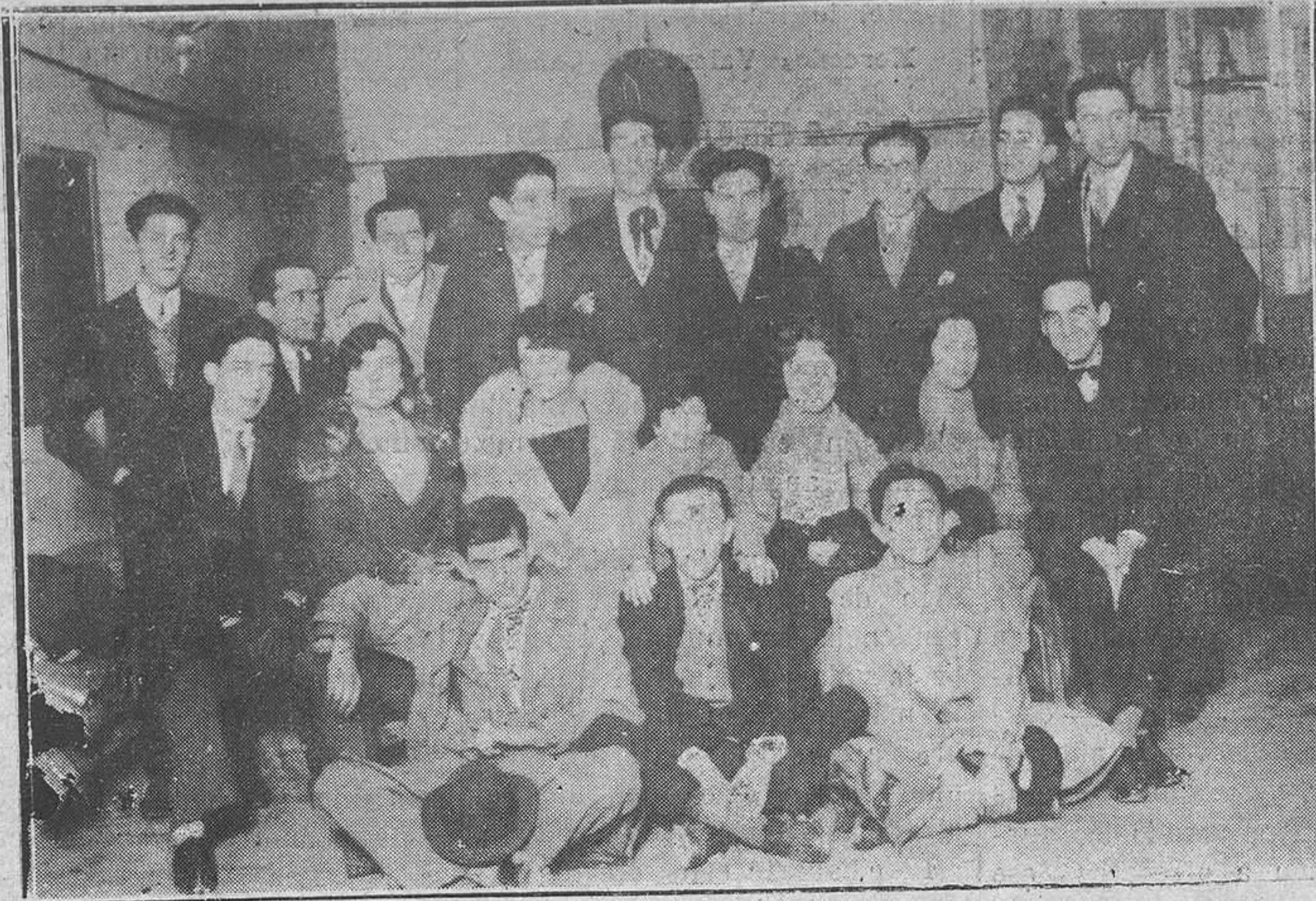
El cuadro artístico, formado de una selección de otros diversos cuadros, que dará un gran festival en el Campoamor a beneficio de los obreros en paro forzoso.

Se aprobaron las nuevas clasificaciones que propone el inspector de cédulas de la zona quinta en los padrones de Tineo y Cangas de Narcea, comunicándolo así a las Alcaldías para conocimiento de los interesados.