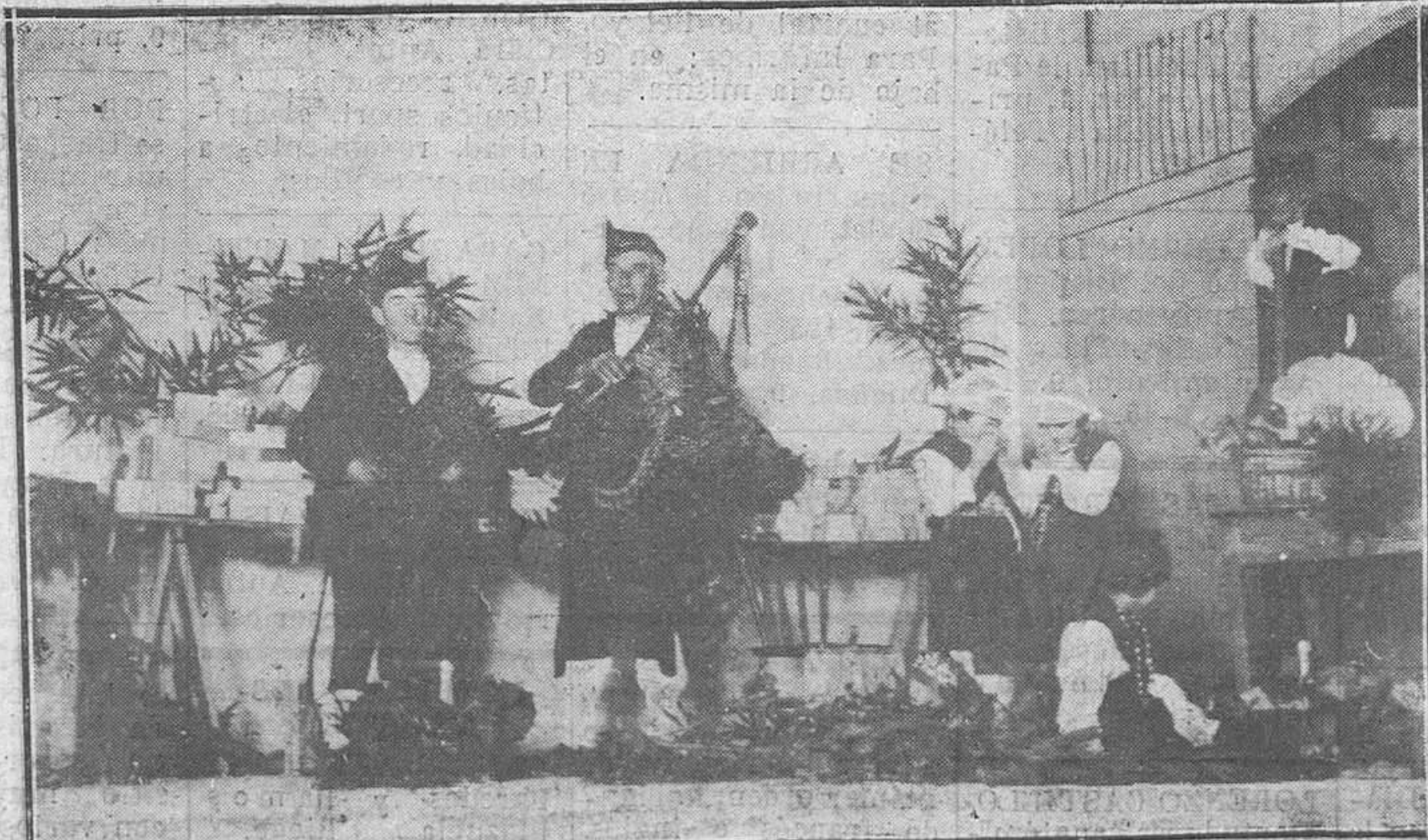
Oviedo: La fiesta de las damas caquisistas en el Popular Cinema.—Cuadro asturiano.