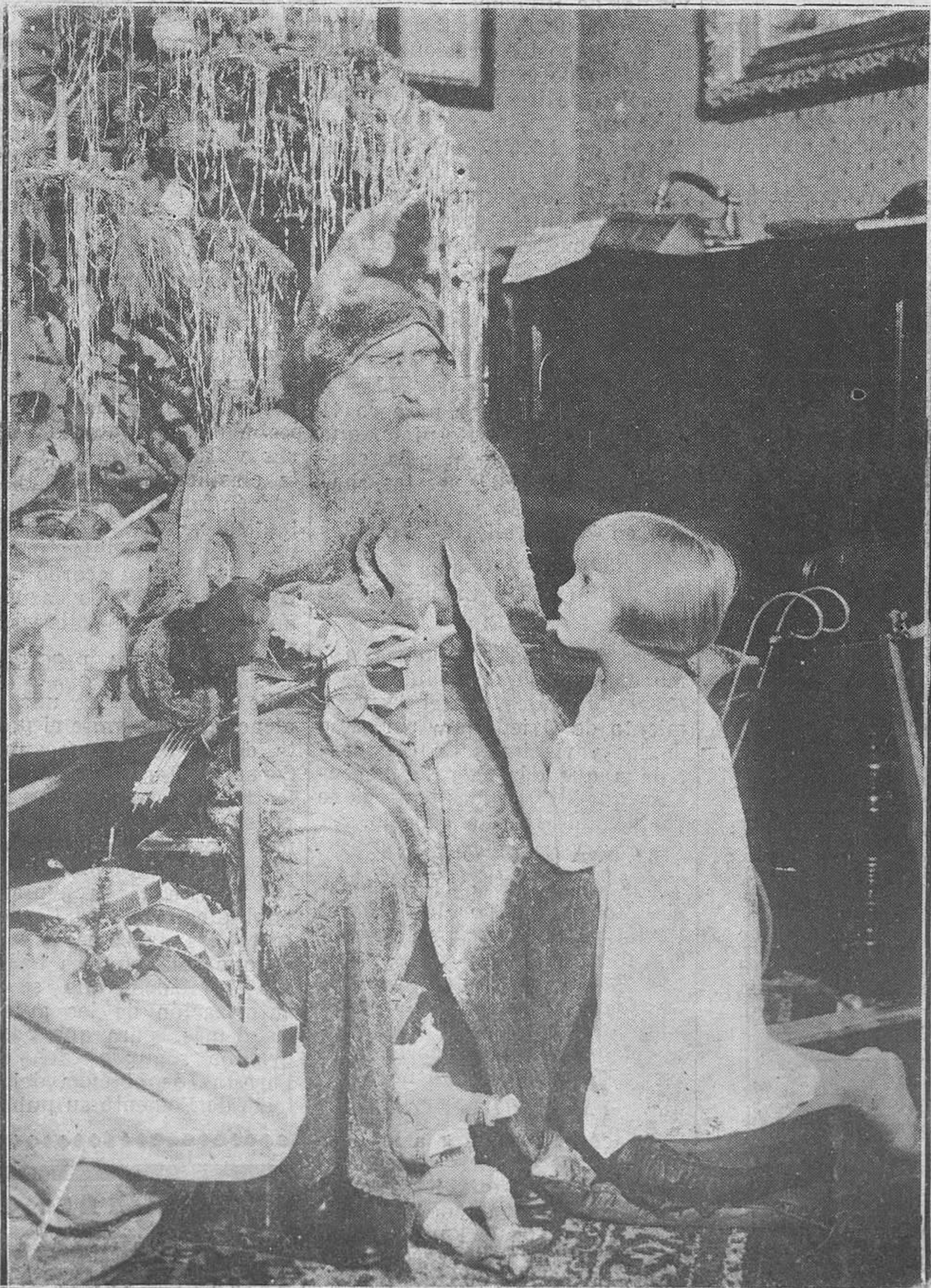
DIA DE REYES

Felicitémonos y felicitemos al general Primo de Rivera y a su colaborador el ministro de Hacienda por este indiscutible y extraordinario éxito de su actuación.