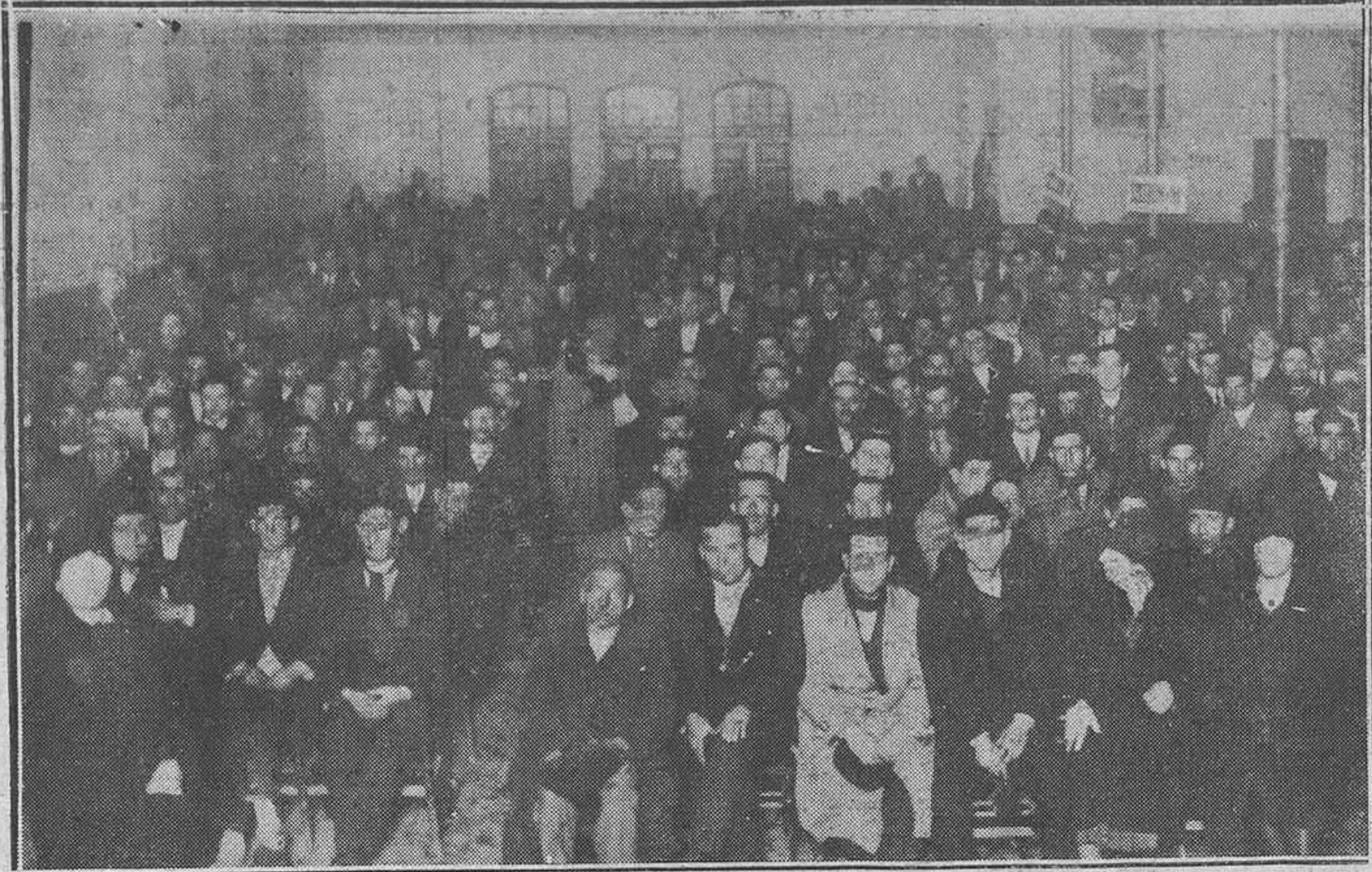
Oviedo: La fiesta de las damas catequistas.—Una vista del salón momentos antes del reparto de turrónes.