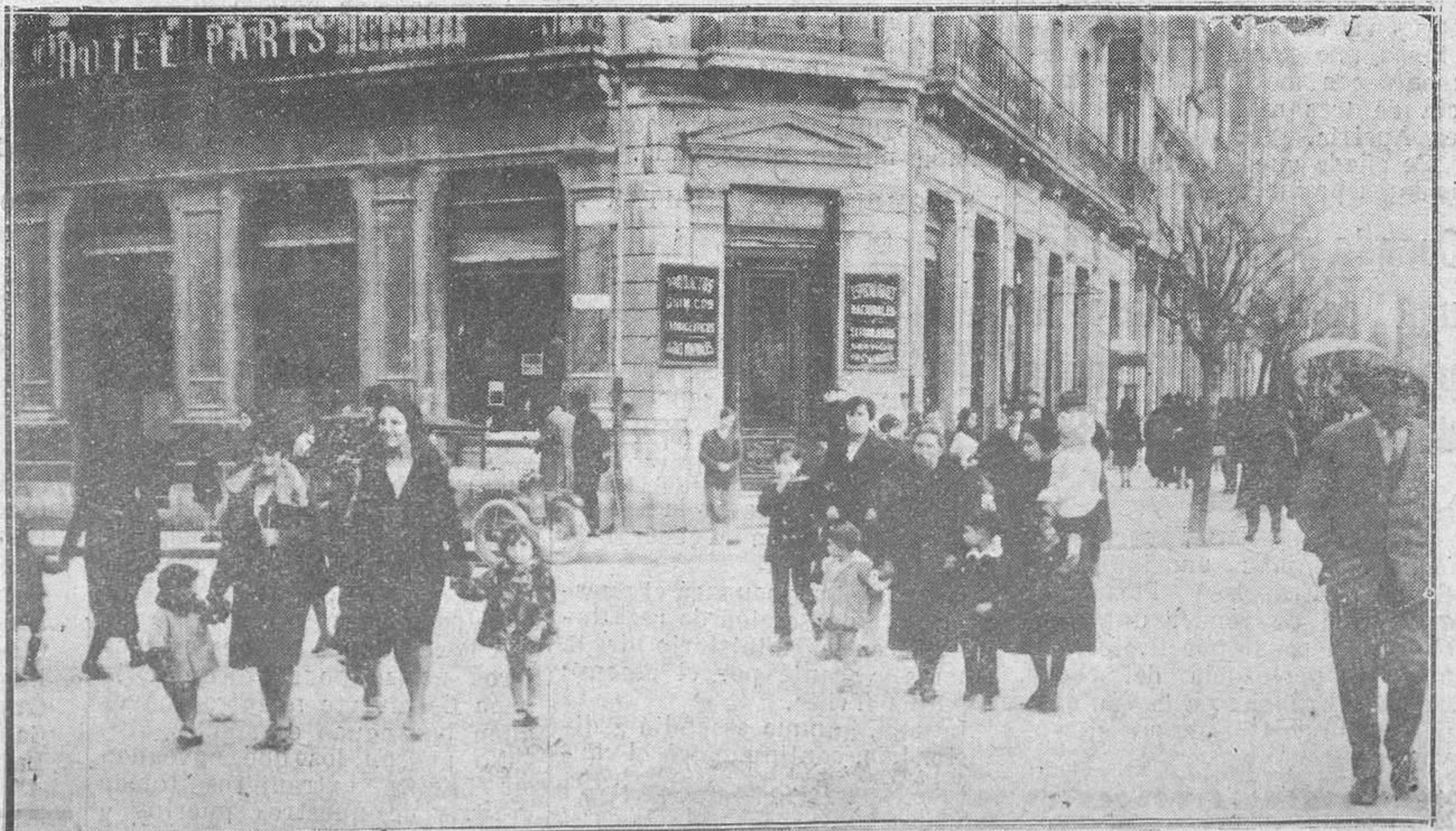
Oviedo.-A la busca de juguetes.