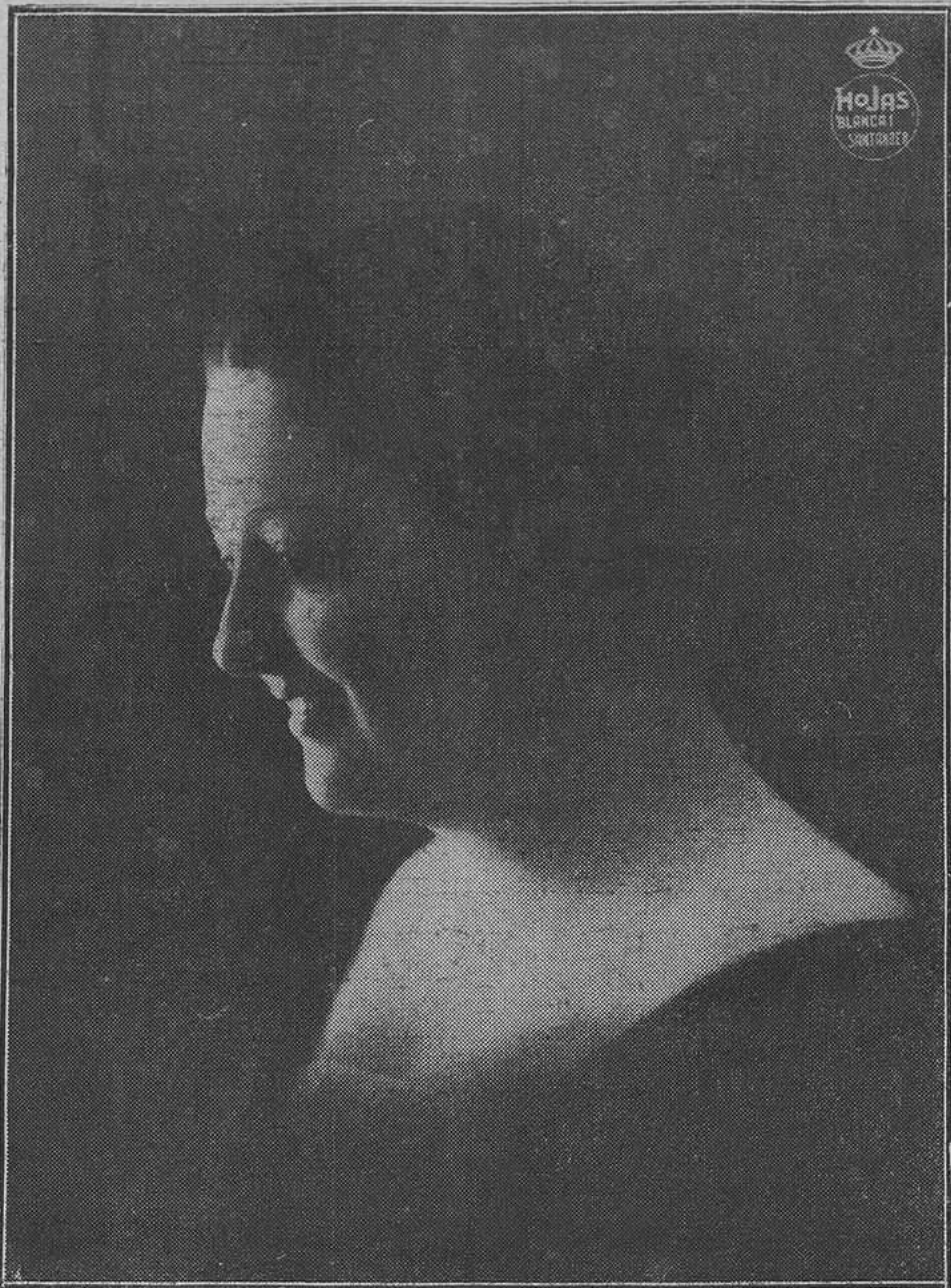
Pepita Meliá, la distinguida artista que actúa en el teatro municipal.