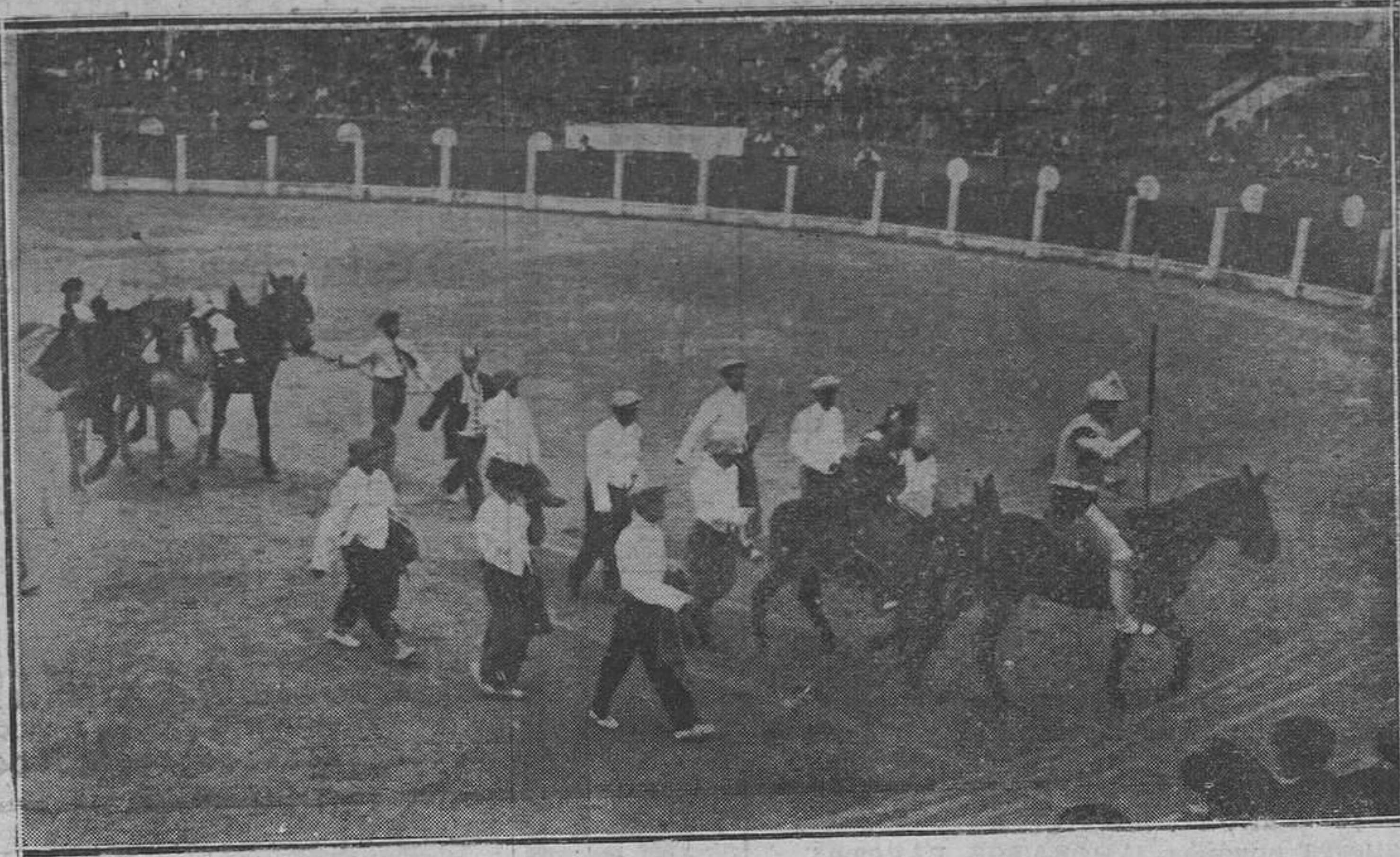
Oviedo: De la becerrada del domingo.-La salida de las cuadrillas

El día 19 de los corrientes se celebrará en la Dirección General de Obras Públicas, la subasta de las obras del trozo segundo de la carretera de Santoseso a la Pera, en esta provincia, por el presupuesto de 196.955'22 pesetas.