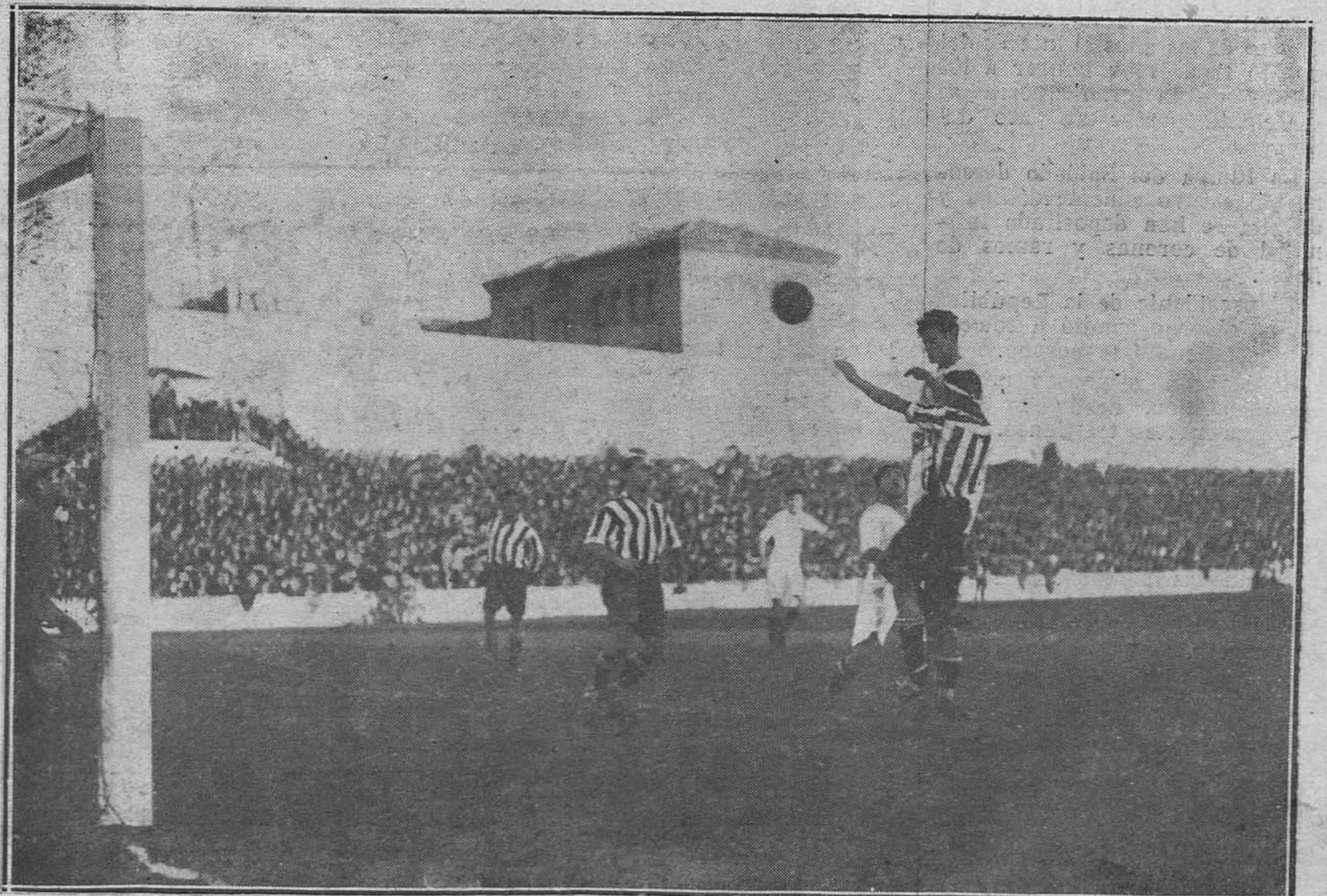
Madrid.-Del partido de foot-ball jugado entre el Real Madrid y el Atlético; venció el primero por 3-2.