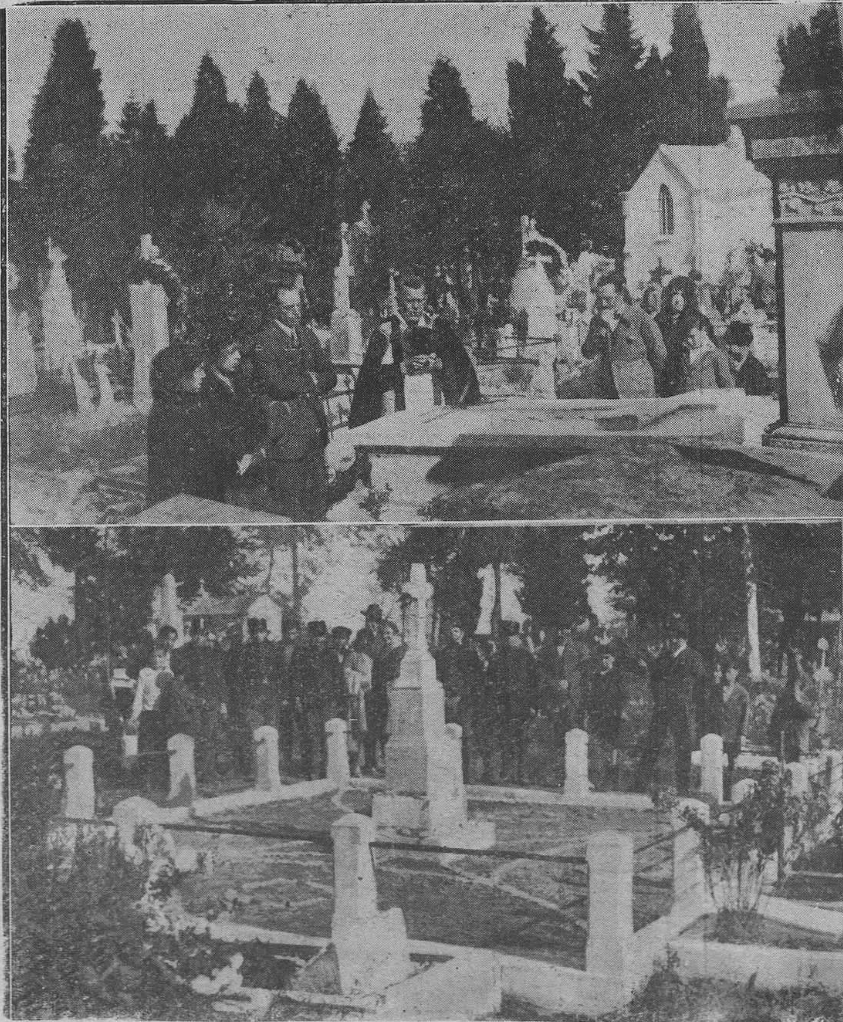
Oviedo: En el cementerio del Salvador.—Arriba: Rezando por los muertos.—Abajo: El panteón del príncipe

El dicho ingeniero cree que la culpa existe y alguien tiene.