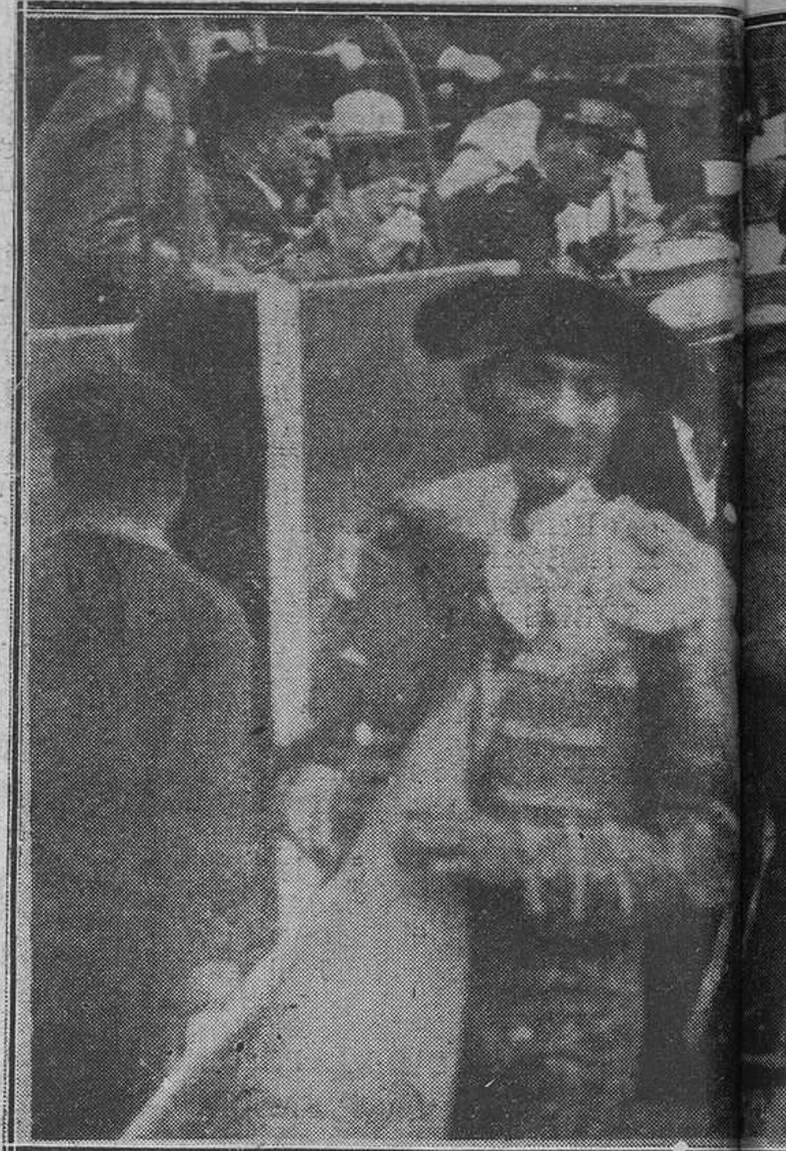
De la cegida de Belmonte en Barcelona. Ser...