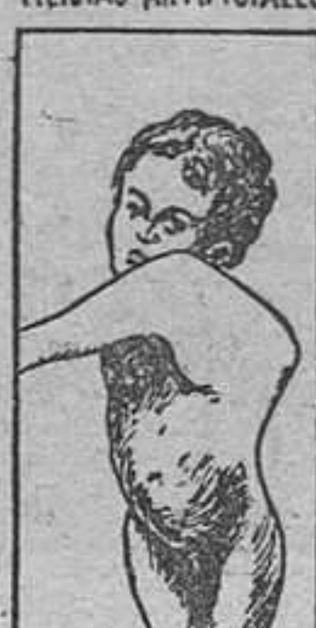
PAL-POTT DE CIRROSIDAD