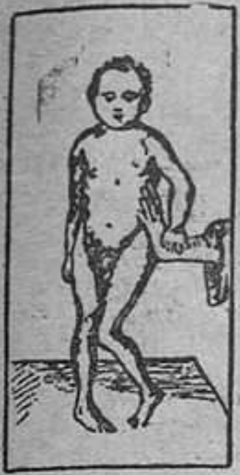
ENFERMEDAD DE LITTE