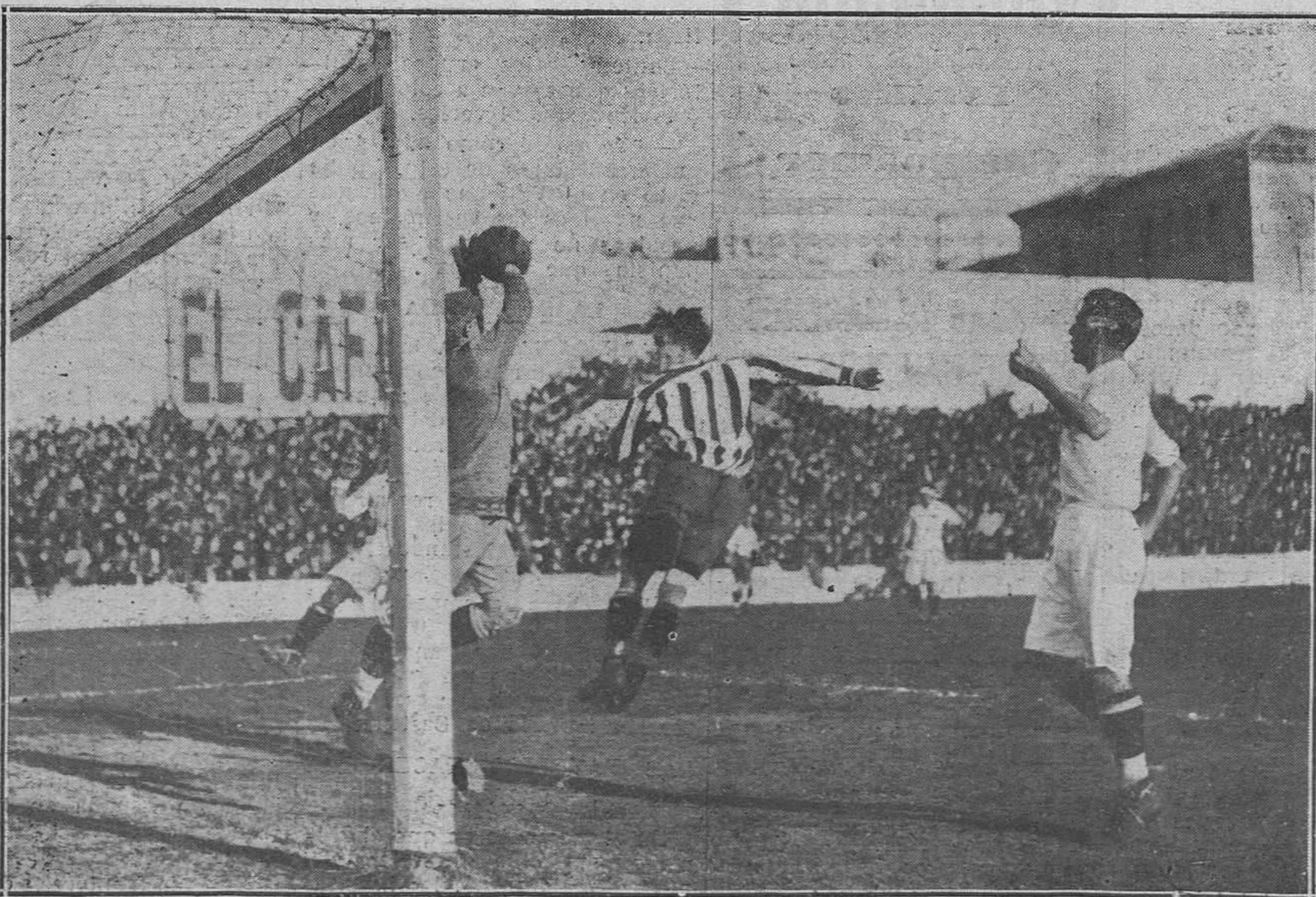
Madrid.-Del partido de foot-ball jugado entre el Real Madrid y el Atlético; venció el primero por 3-2.

¡Oye madre, qué tristezas van los aires transmitiendo!... Son las voces de las almas arrastradas por los vientos que infinitamente crecen,