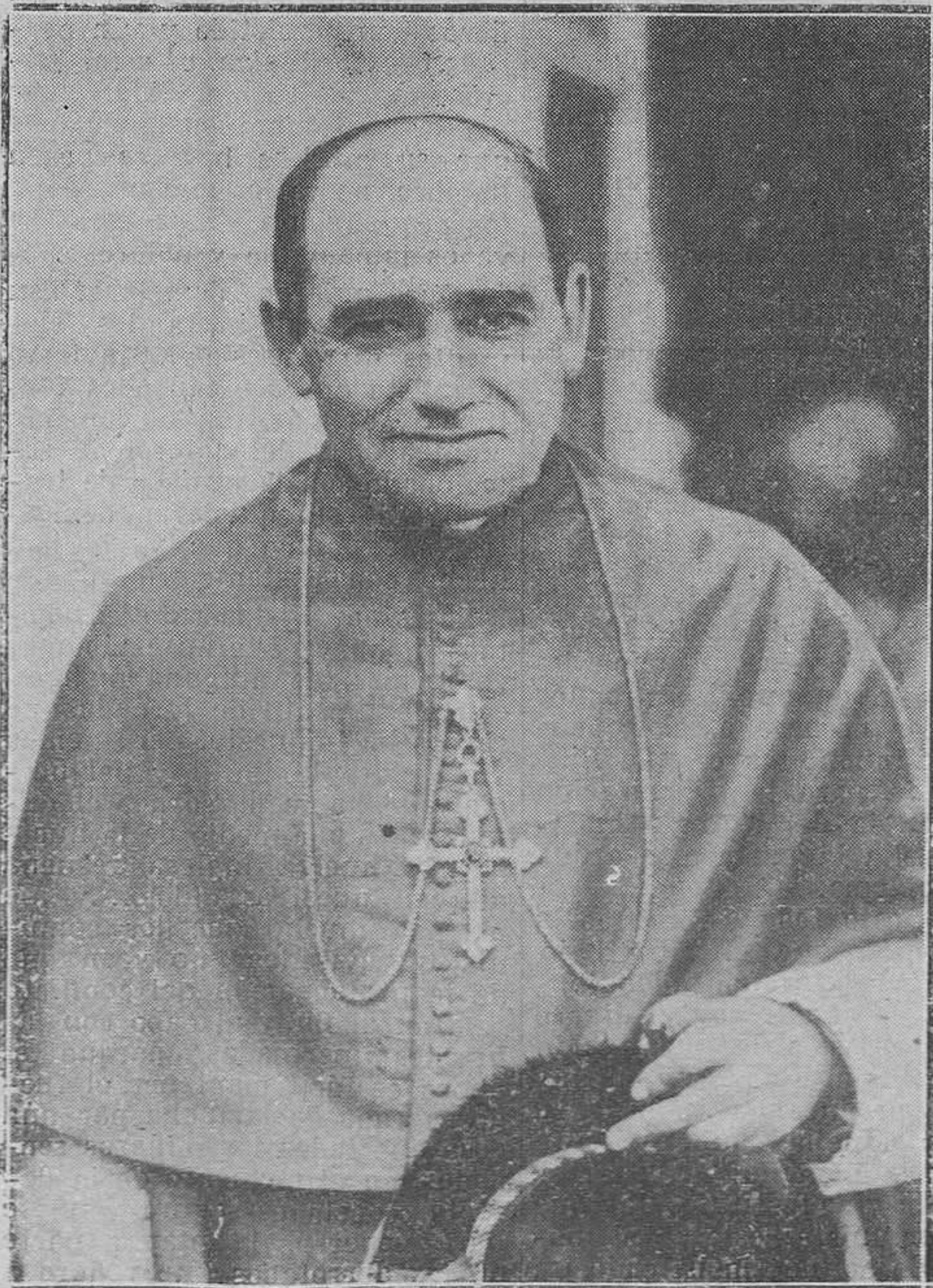
El Ilmo. señor don Pedro Segura y Sáenz, que ha sido elegido para la silla Primada.