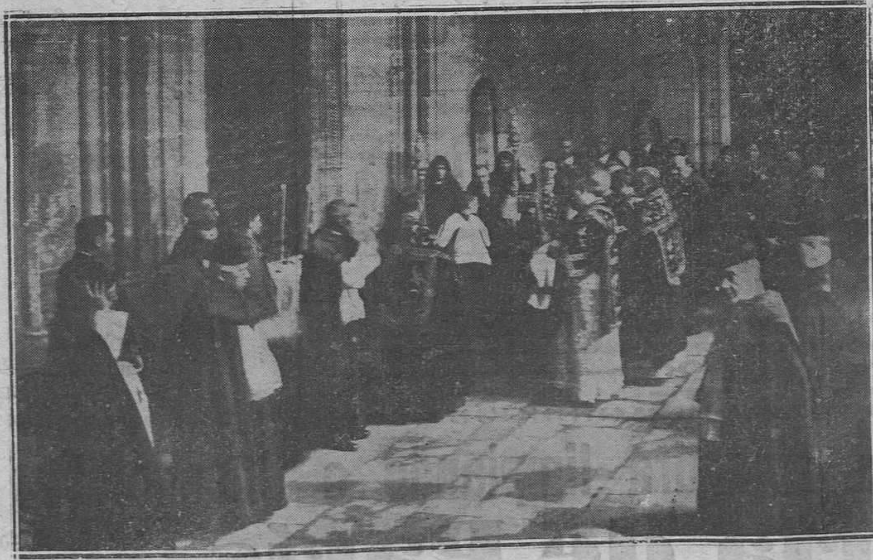
Oviedo.-El Cabildo Catedral cantando los responsos en el Claustro.

Aplaudimos, pues, sin reservas el nombramiento de personas tan capacitadas como las elegidas y nos sentimos francamente optimistas sobre lo que será la V Feria de Muestras Asturiana, por cuya prosperidad laboremos de aquí en adelante con el mismo entusiasmo que lo hemos hecho hasta ahora.