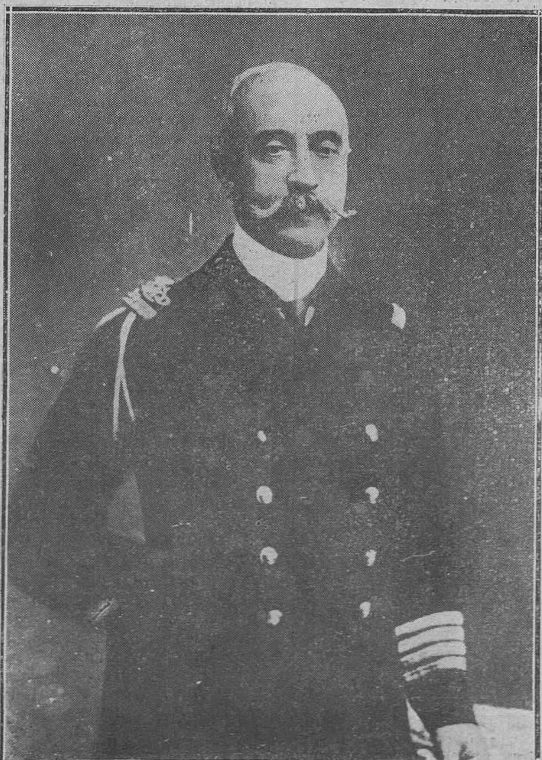
Brecla.-El almirante Conduriotis, presidente de la República, contra quien se verificó un atentado.