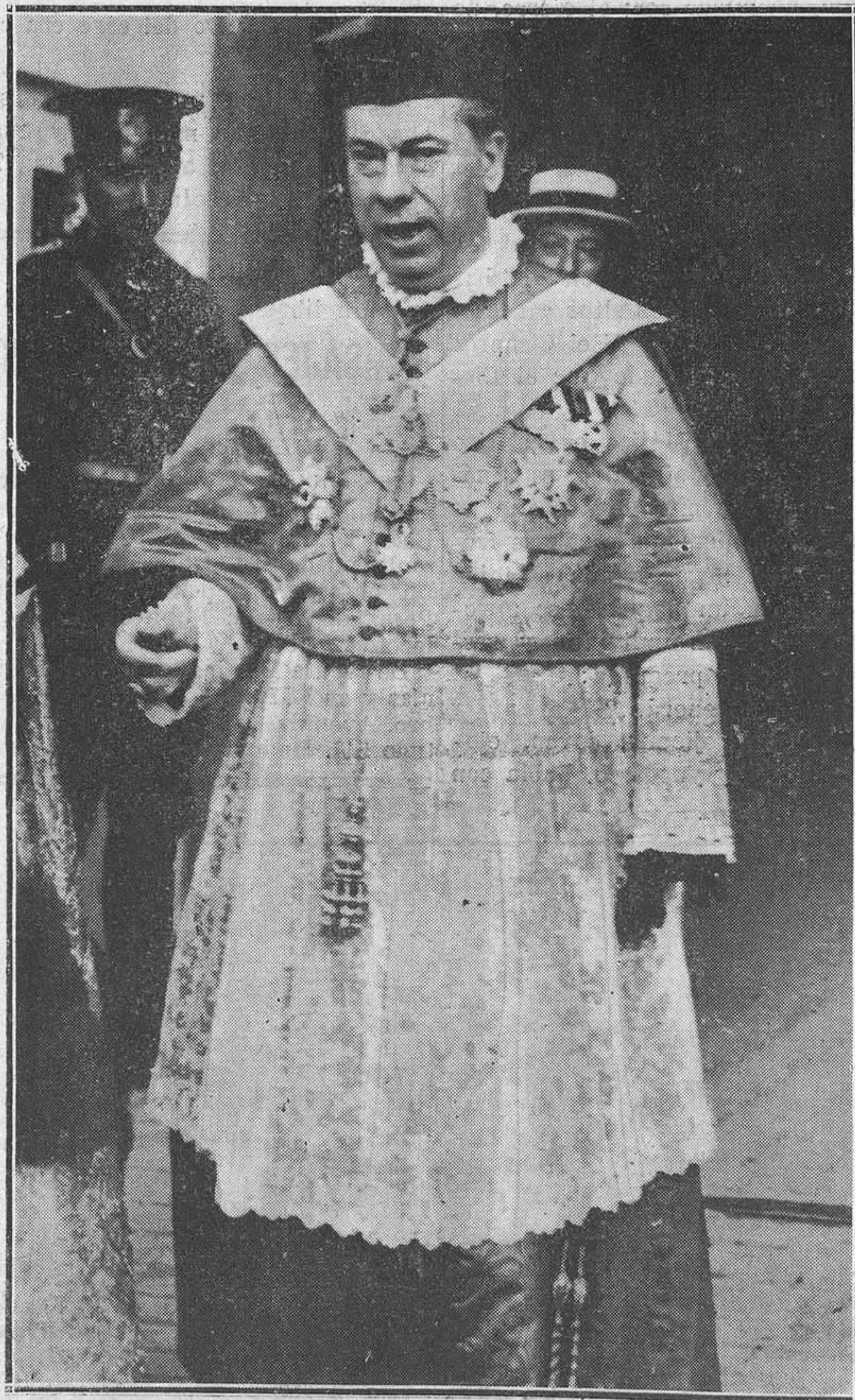
El Cardenal Benloch, de cuyo fallecimiento damos cuenta en nuestra información telefónica.

—Mi corazón—decía él en un momento solemne—es el escabel del Pontífice Romano y de la Majestad Española.