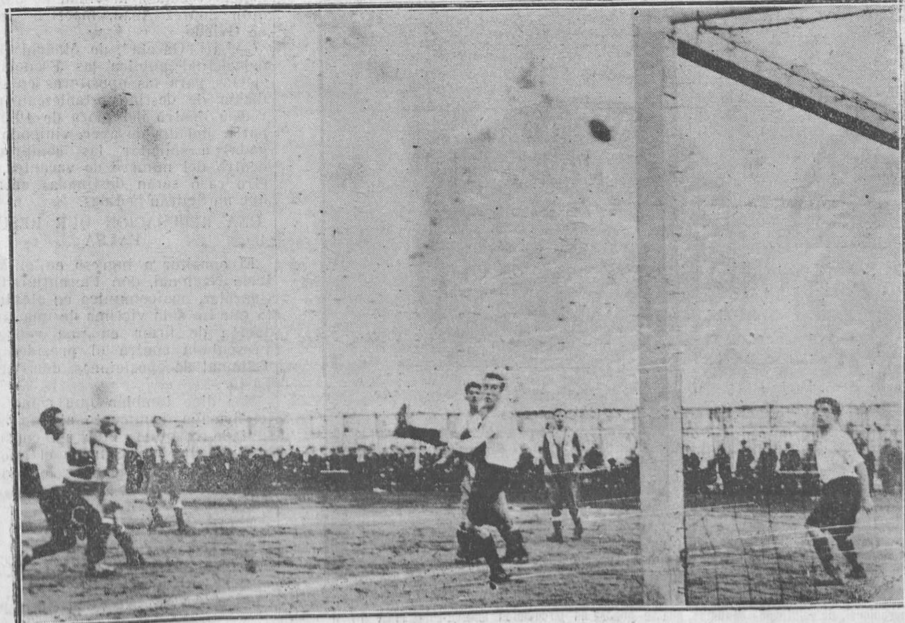
DEPORTIVO-STADIUM DE AVILES.-Un momento de apuro para el Deportivo.

El domingo se presentó el Unión en su campo de Viesques, vivificado por ese juego sacro del entusiasmo que en él nunca muere. Y así, logró una victoria legítima sobre el equipo ovetense, batiéndose netamente,