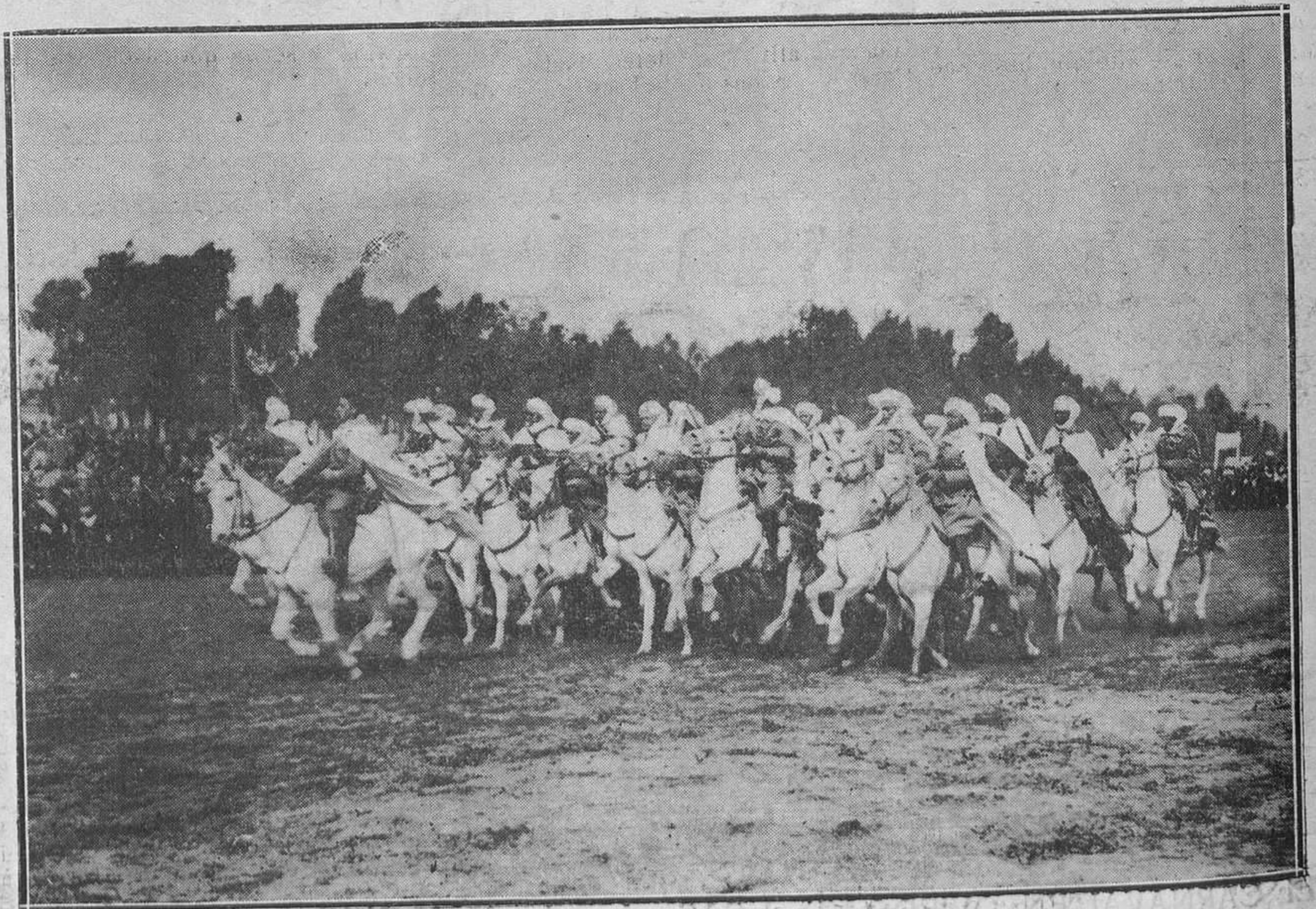
MALAGA: ENTREGA DE LA BANDERA A LOS REGULARES DE MELILLA. La caballería mora, desfilando al galope, ante los Reyes.

En Pesetas o Moneda Extranjera, a la vista, y a plazos, con abono de intereses a tipos muy favorables