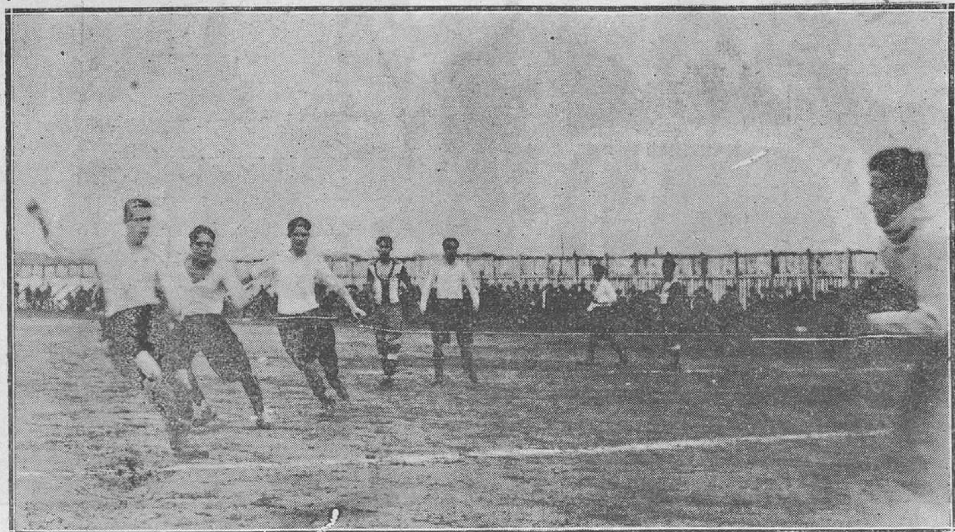
DEPORTIVO-STADIUM DE AVILES.-La línea de ataque del Deportivo, en un ataque a la portería de Paredes.

de la dignidad deportiva. Y hoy insistimos en igual concepto. El Unión, equipo de rancio abolengo, rival sempiterno de todos los Clubs que se han destacado en nuestra región, es el equipo que por más vicisitudes ha pasado. Cien veces se ha visto pujante, y otras cien handicapado, por la defección de aquellos jugadores que eran sus más firmes puntales; pero el Unión, ya alineara en sus filas figuras de relieve, ya se viera representado por biscaños, jamás ha desmayado en su