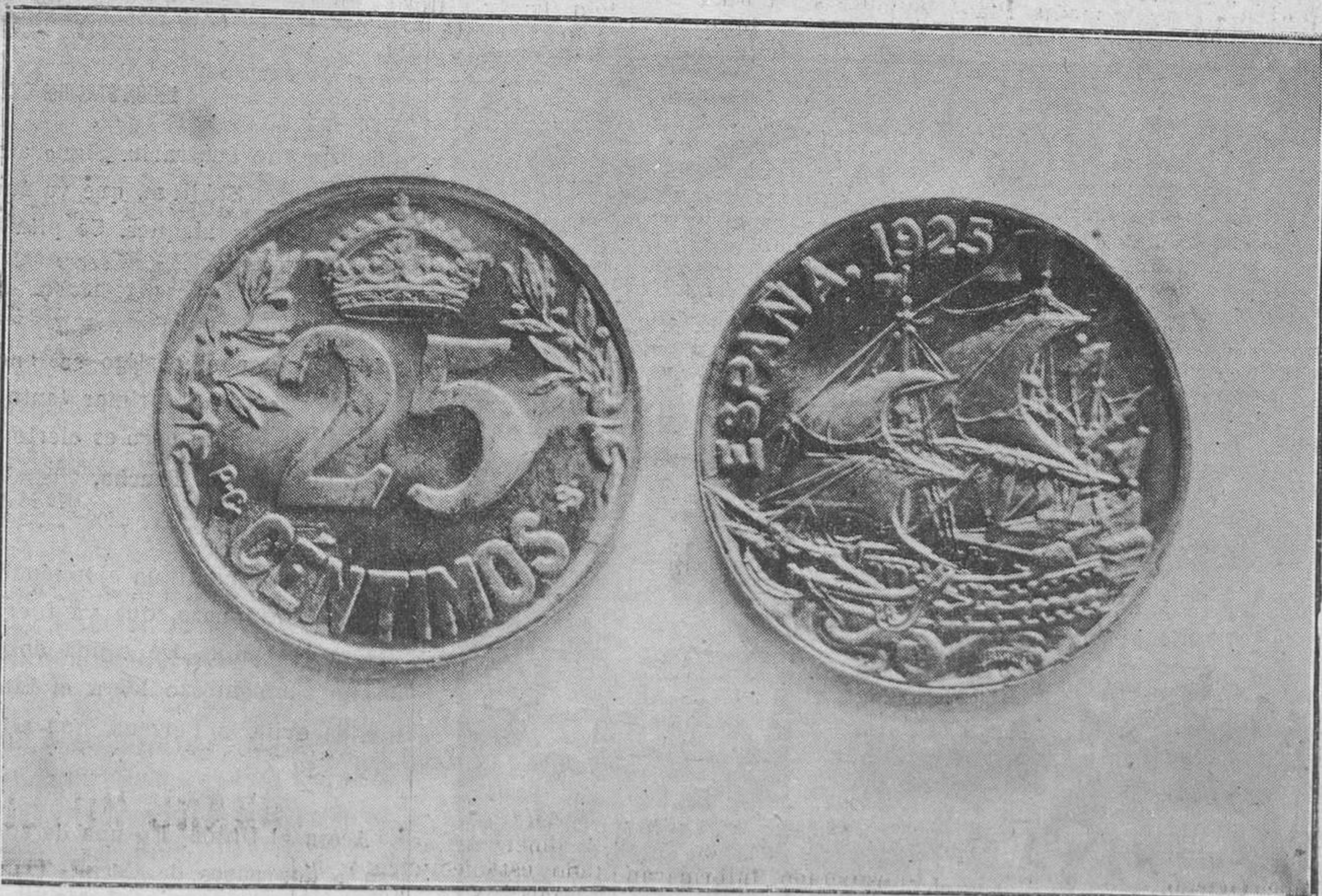
Anverso y reverso de la nueva moneda de cuproniquel, de veinticinco céntimos, que se pondrá en circulación uno de estos días.

Nos dice también que como él no ha firmado documento alguno ha solicitado—y quiere que así conste—de la Superioridad se incoe el oportuno expediente para depurar lo ocurrido.