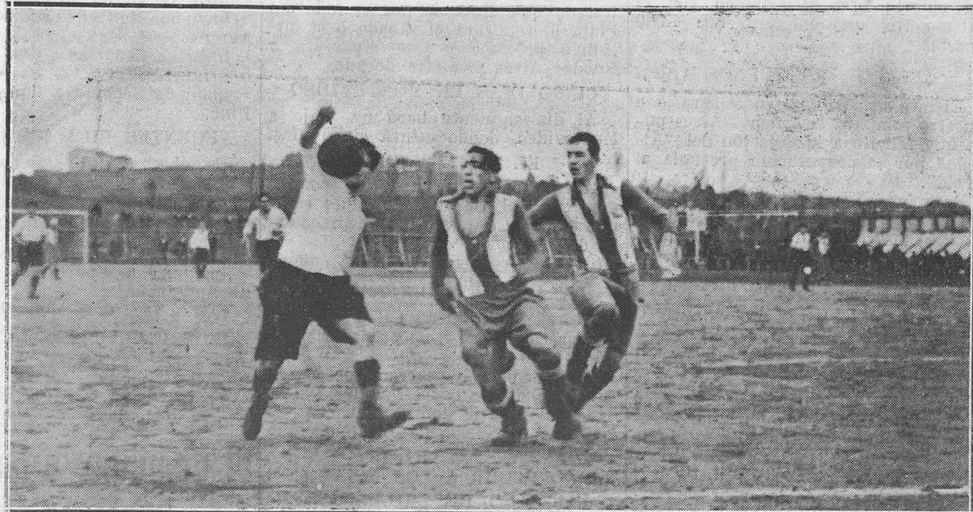
DEPORTIVO-STADIUM DE AVILES.-La defensa avilesina, entrando en juego para cortar un ataque de los contrarios.

Resumiendo: el Stádium es un equipo de algunas