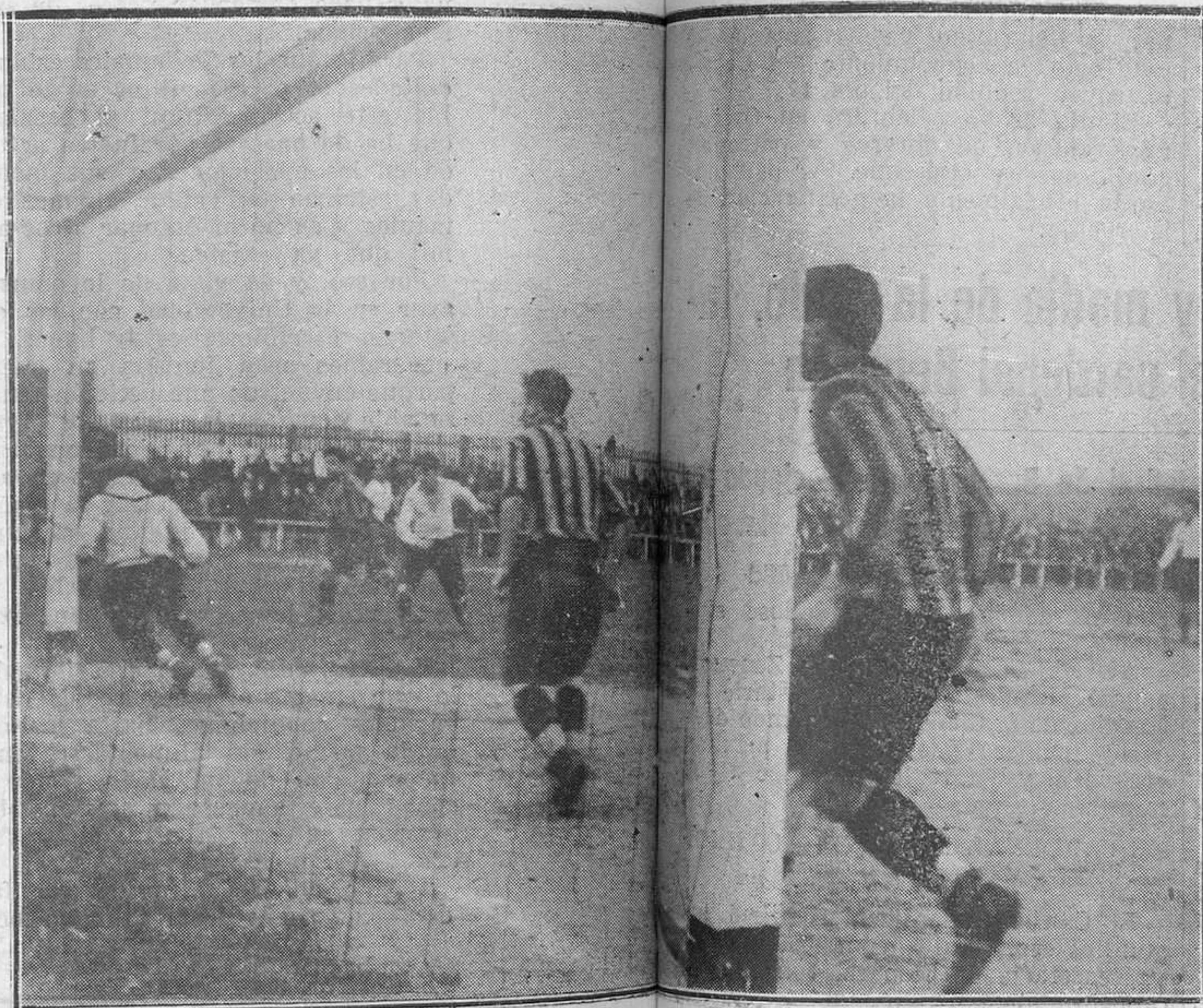
UNION-STADIUM OVETENSE.-Intervención del portero en un momento interesante.

El transcurso del anterior tanto a este quinto tanto que hace el Stádium, vemos algunas buenas jugadas por parte y parte, interviniendo ambos por igual eficazmente. Pero el Unión ataca mucho y, así, Oscar, tiene ocasión de oír aplausos en muchas paradas magnas, que sólo él es capaz de