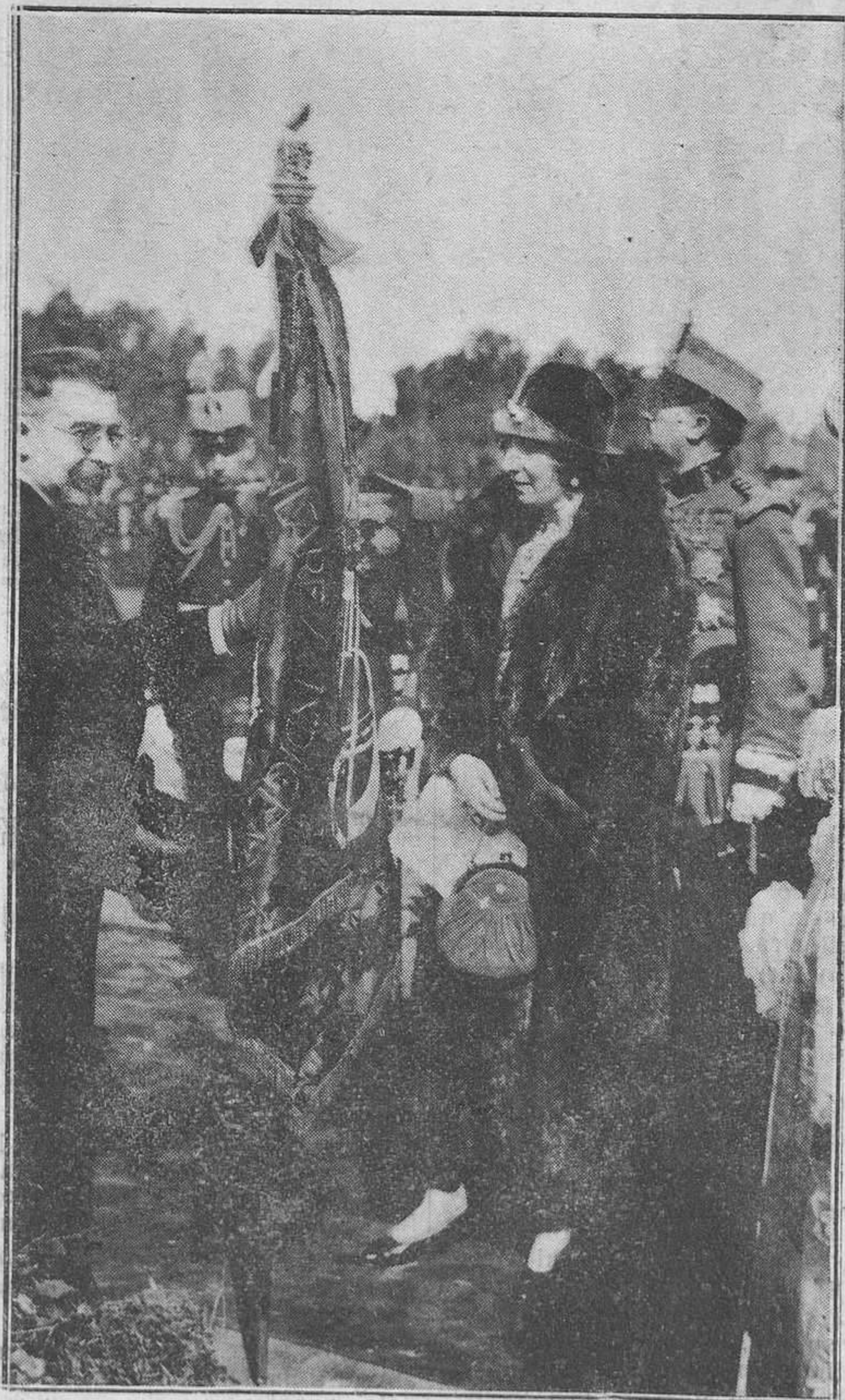
MÁLAGA: ENTREGA DE LA BANDERA A LOS REGULARES DE MELILLA. S. M. la Reina doña Victoria, recibiendo del alcalde de Málaga la bandera que ha entregado a los Regulares de Melilla.

La emisión ha sido asegurada por los Bancos Urquijo y Español de Crédito.