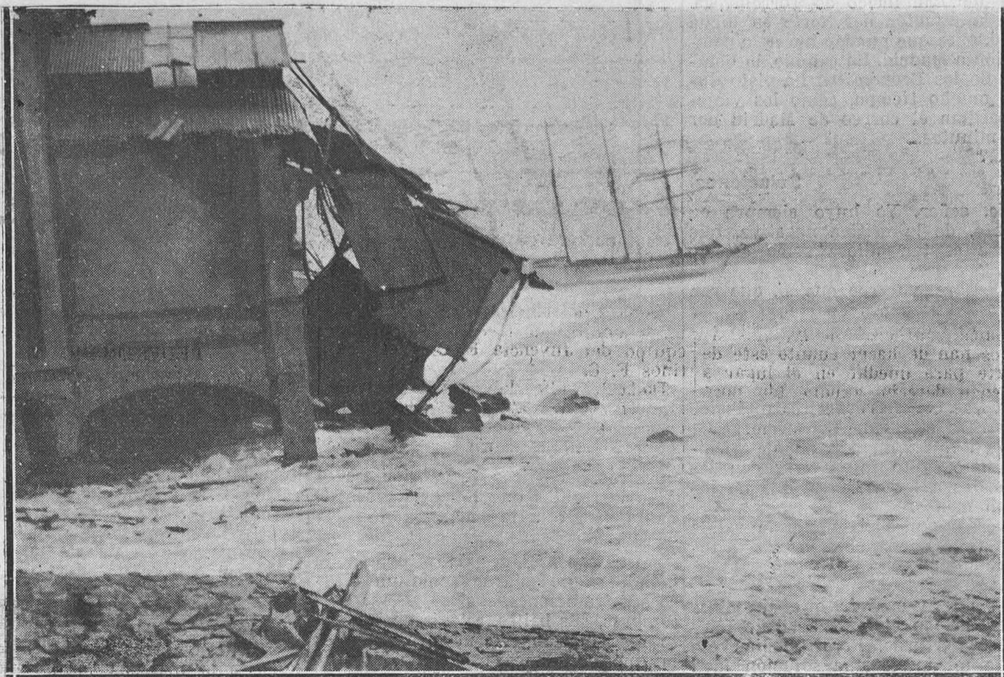
EL TEMPORAL EN BARCELONA. Los baños de Casa Antuñez, derribados por el mar. Al fondo el velero italiano Orietta, embarrancado al entrar en el puerto.

los planos, perfiles y demás detalles del proyecto de prolongación de la calle del Marqués de Santa Cruz. Como ya es sabido, la prolongación a que se hace referencia llegará hasta el antiguo campo de maniobras atravesando uno de los extremos de la