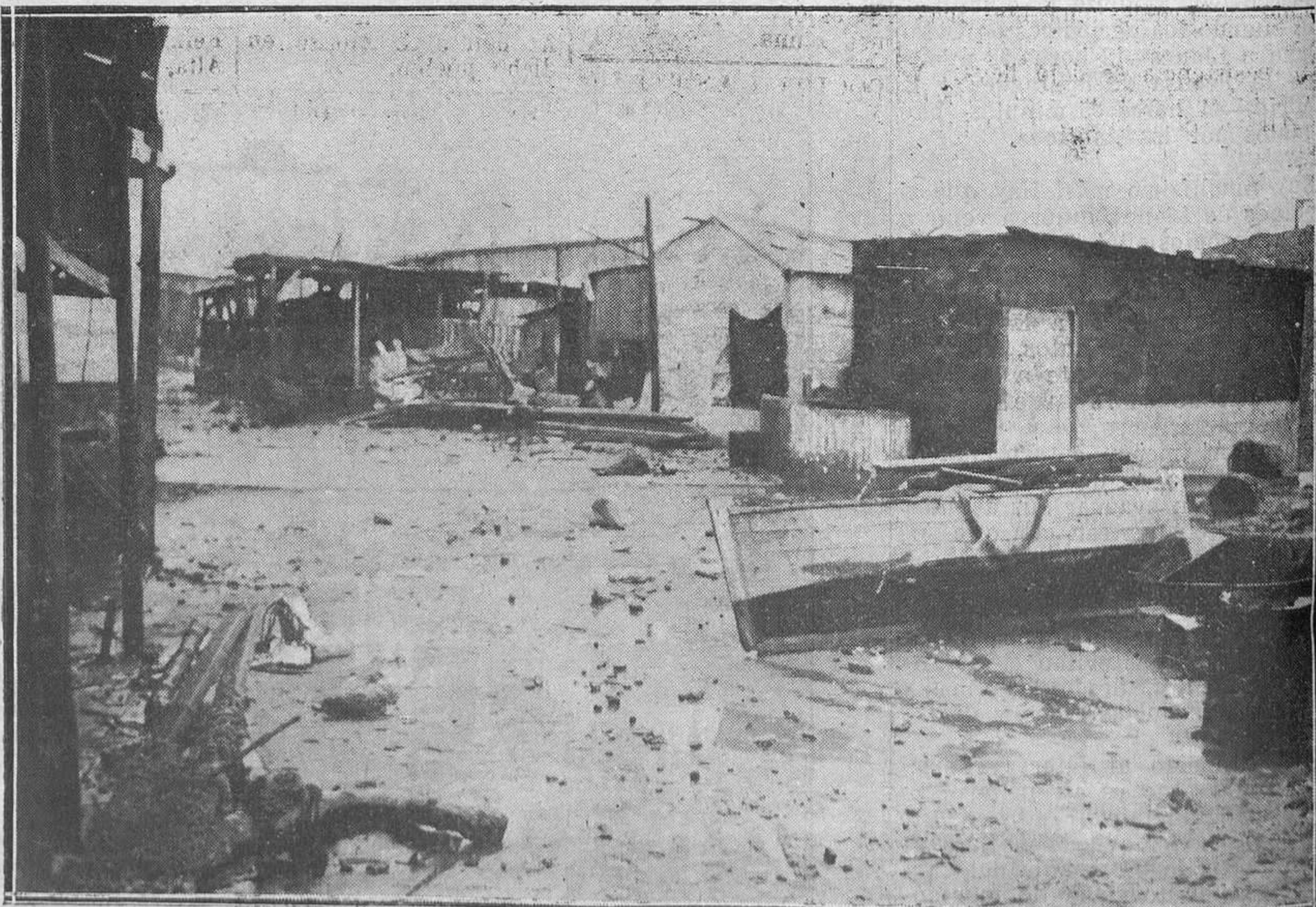
EL TEMPORAL EN BARCELONA. La barriada de Pekin donde el mar se ha llevado más de 200 barracas, quedando sin albergue más de 500 familias.

EL BANCO DE CREDITO LOCAL DE ESPAÑA, encauzando y desarrollando la gran fuerza económica que poseen instituciones tan fundamentales como las Corporaciones locales, ha realizado ya operaciones por valor