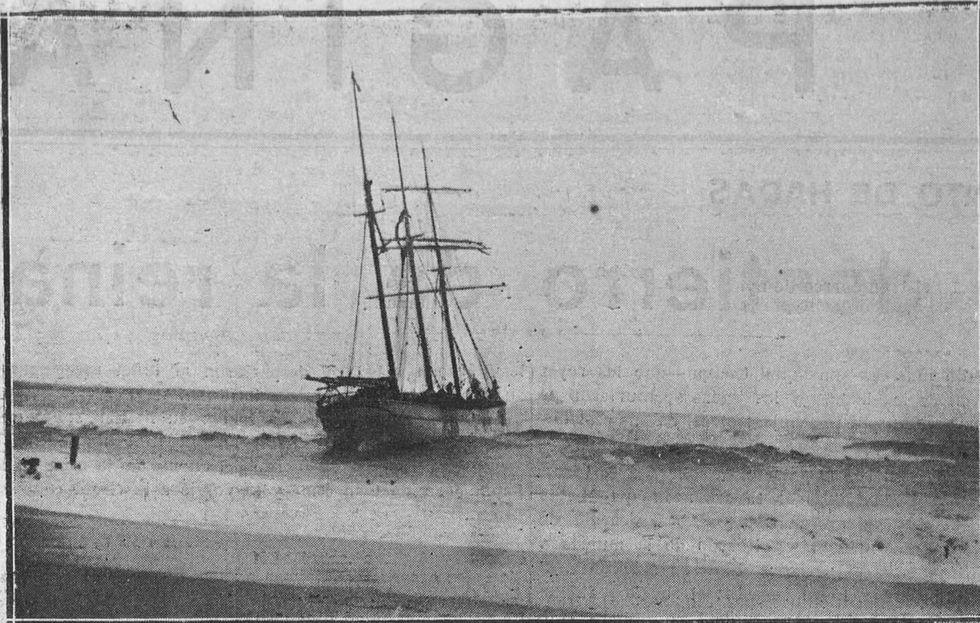
EL TEMPORAL EN BARCELONA.-El velero Orietta, que ha embarrancado por efecto del temporal.