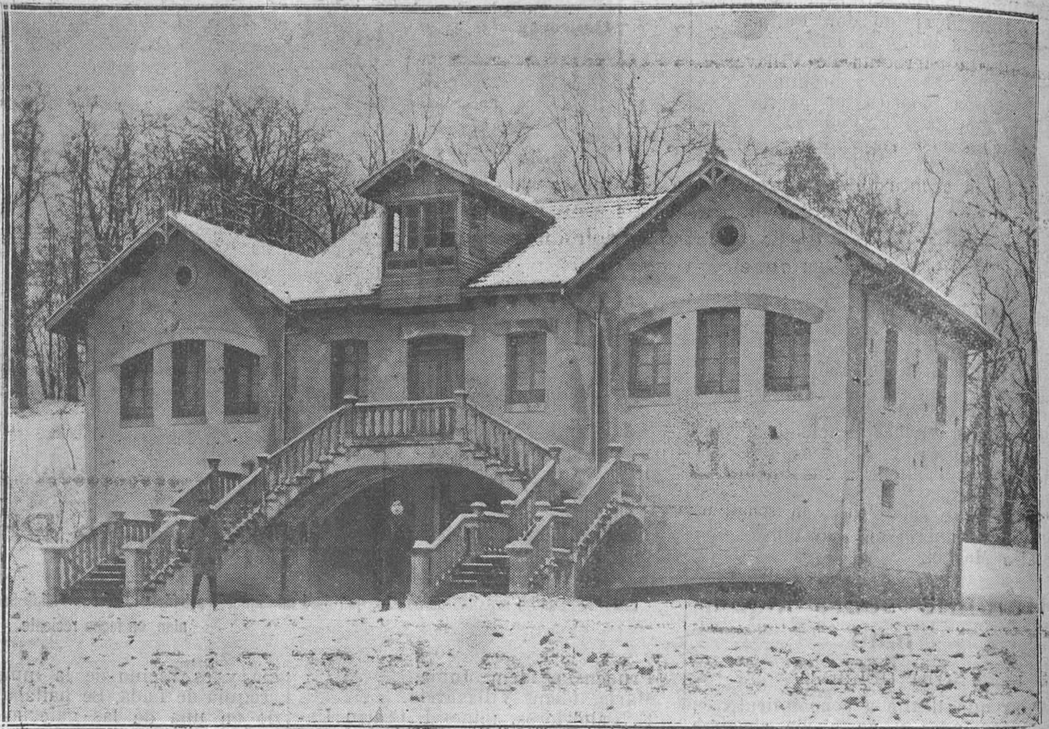
NAVA.-La estación de industrias derivadas de la leche, duerme el sueño de los justos debajo de la nieve.