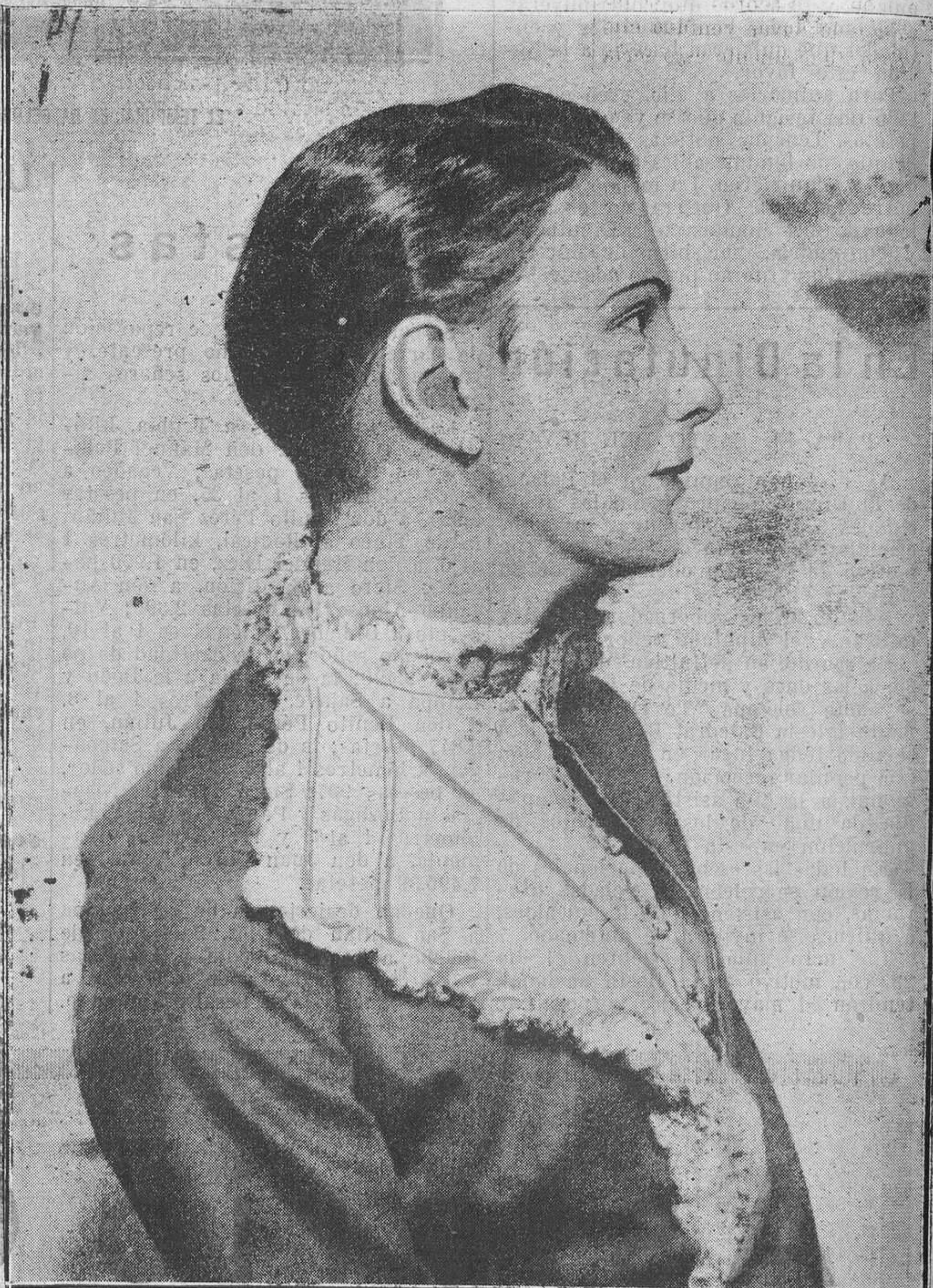
Beatrice Joy, popular estrella de film, a la que se alude en "Vida femenina".