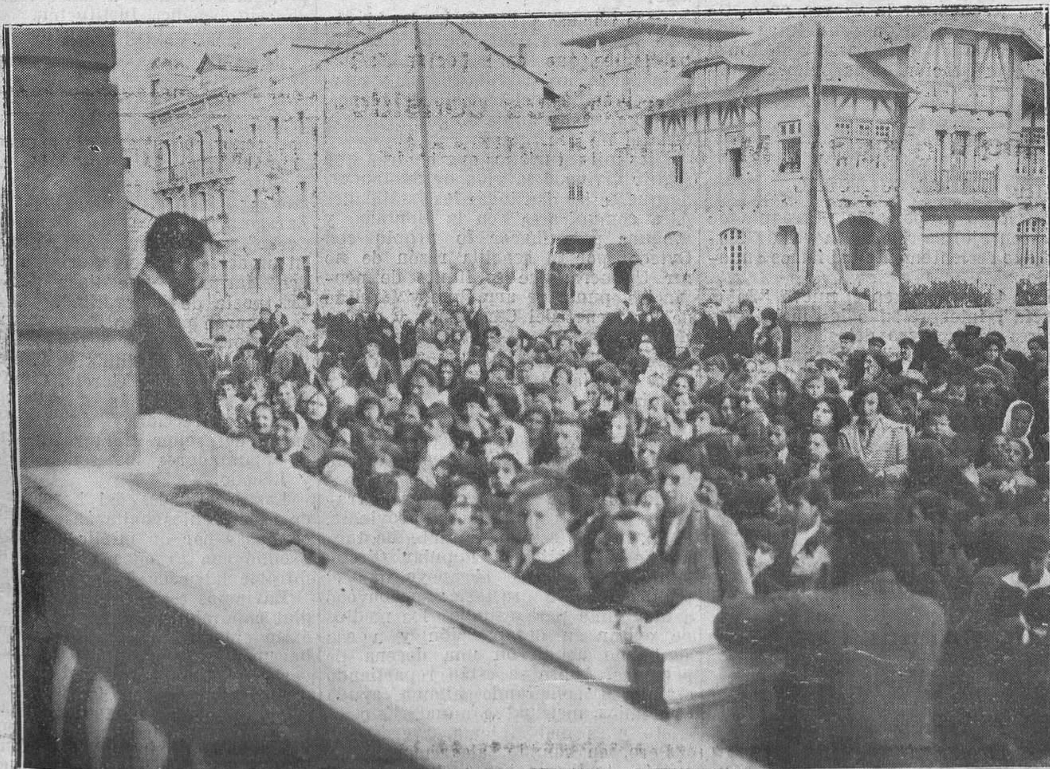
NAVIA.-Las proximidades del Casino, durante el reparto de juguetes a los niños pobres.