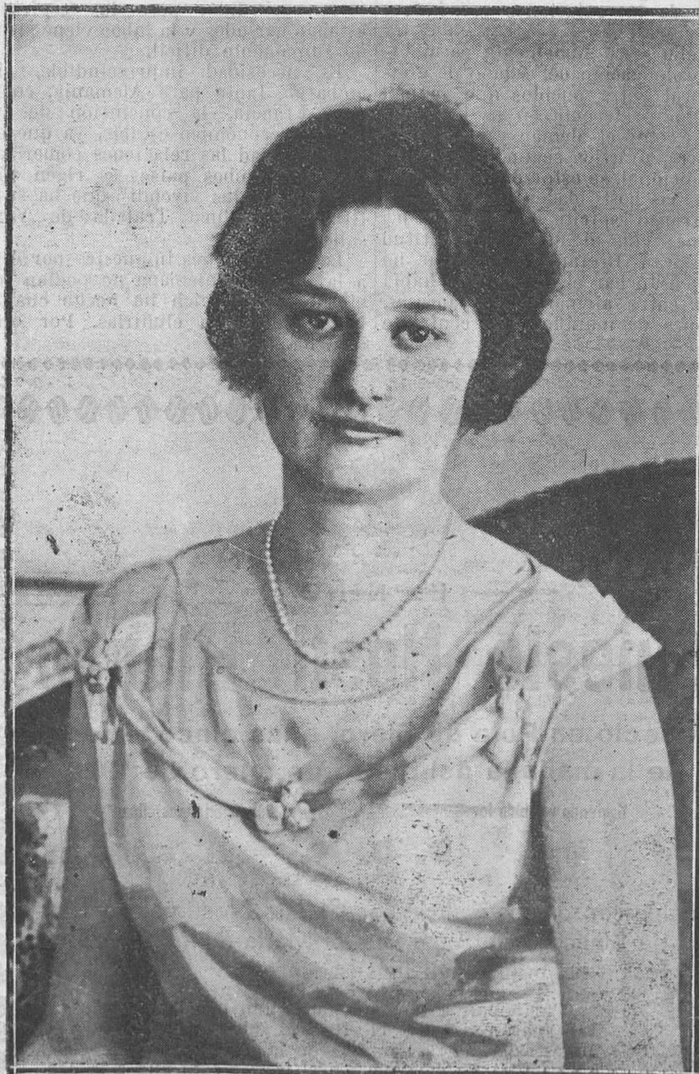
La Princesa Astrid, de Suecia, cuyo viaje a Londres ha dado lugar a que se hable de su matrimonio con el Príncipe de Gales.