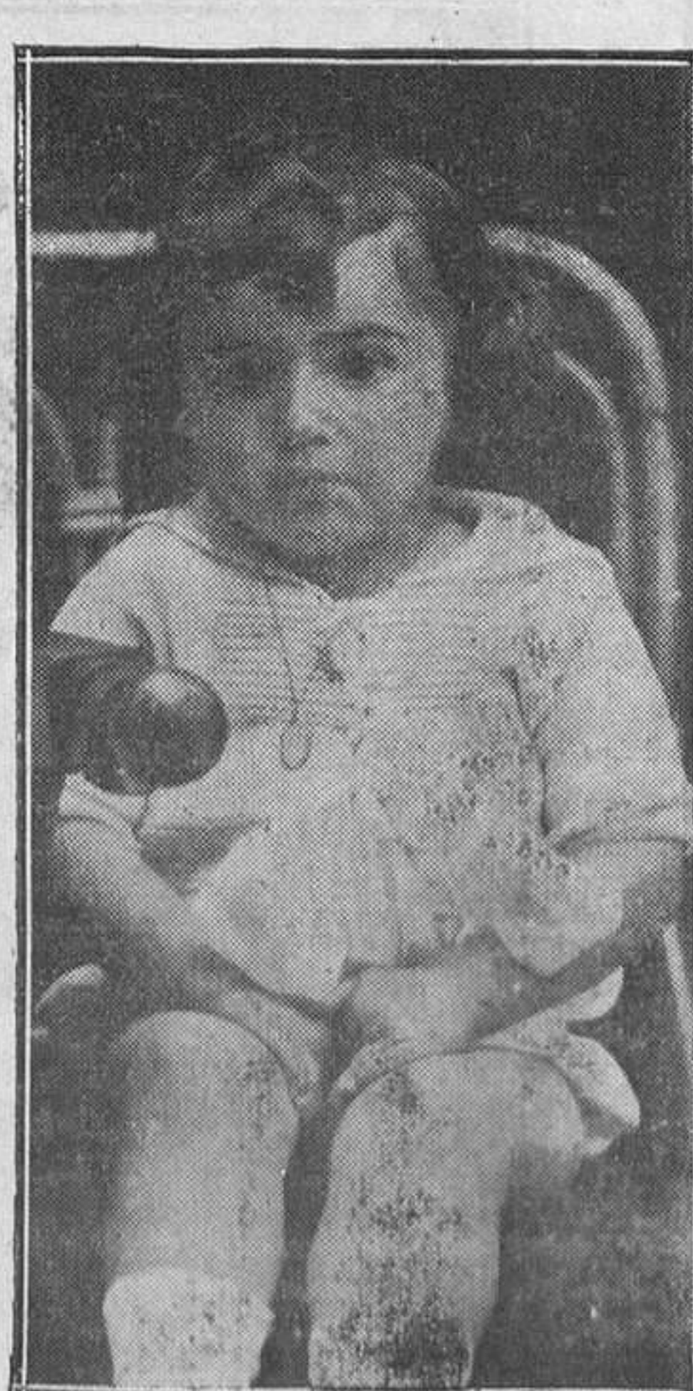
OVIEDO.--Tatatín, rey de la simpatía.