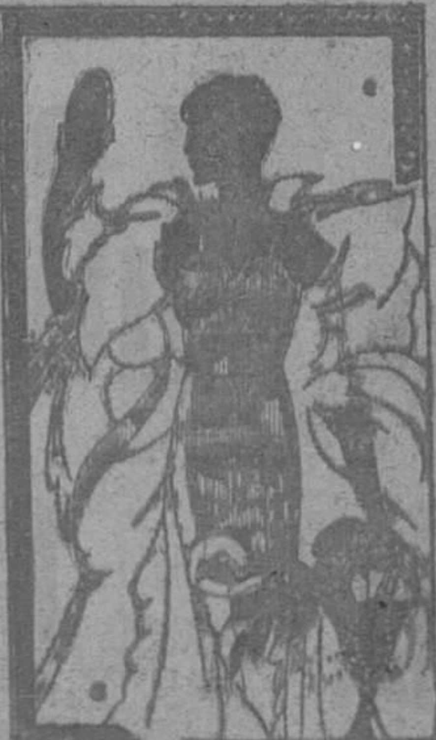
«MADAME X» Fajas para adelgazar Melquíades Álvarez, 6