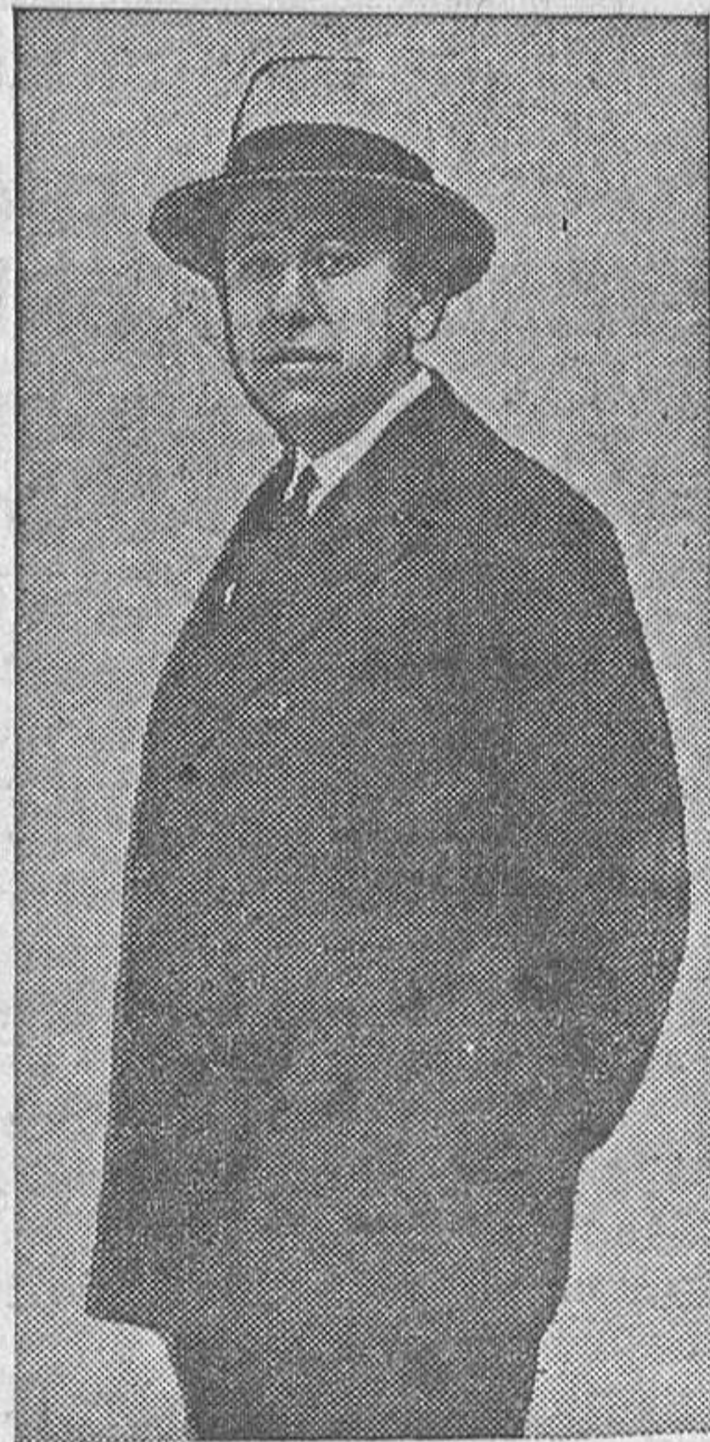
Don José María Gil Robles, el popular diputado agrario, que pasa unos días en Asturias.

Hoy hará una excursión el señor Gil Robles a Grado, Proaza y Teverga, donde tomará parte en los actos organizados por Acción Popular, y por la tarde se trasladará a Cangas del Narcea, donde también habrá mitin.