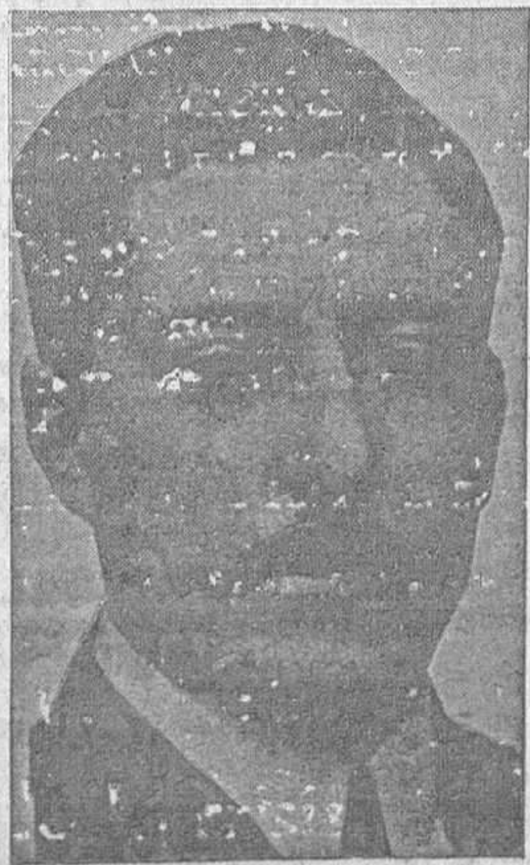
Don FELIPE SANCHEZ ROMAN, indudable personalidad de la República, de quien se dice será nombrado Ministro de Estado.

Conviene en la ocasión presente que estas elecciones generales o políticas precedan a las administrativas o municipales.