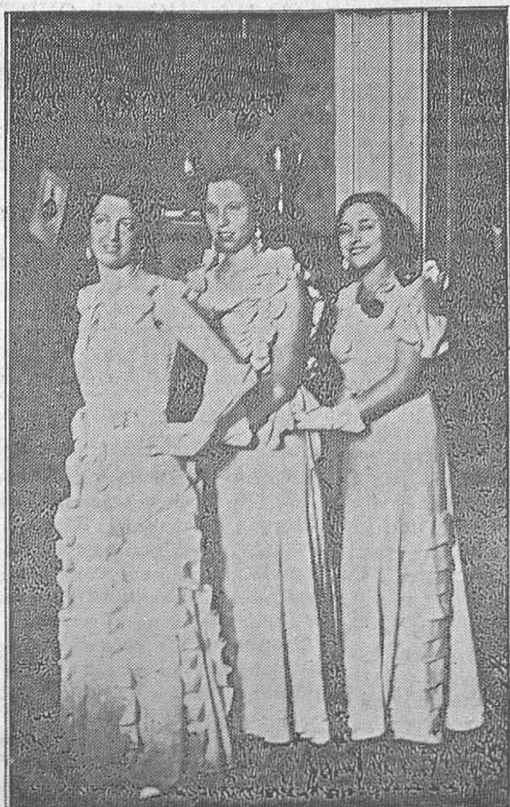
He aquí las tres señoritas que han sido premiadas en el original concurso del vestido de 4 pesetas organizado por el Orfeón Ovetense. En honor suyo se celebrará un festival que tendrá lugar el jueves día 3 de Agosto.

Desde luego que se ignora quién haya sido el autor.