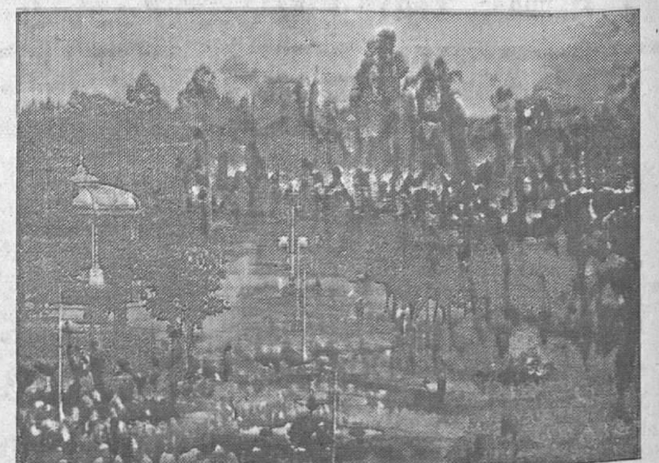
El Parque de Dorado

Producción y distribución de electricidad en los concejos de Sobrescobio, Laviana, San Martín del Rey Aurelio, Langreo, Siero, Nava, Sarriego, Villaviciosa, Colunga, Caravia, Ribadesella, Parres, Cangas de Onís y Onís