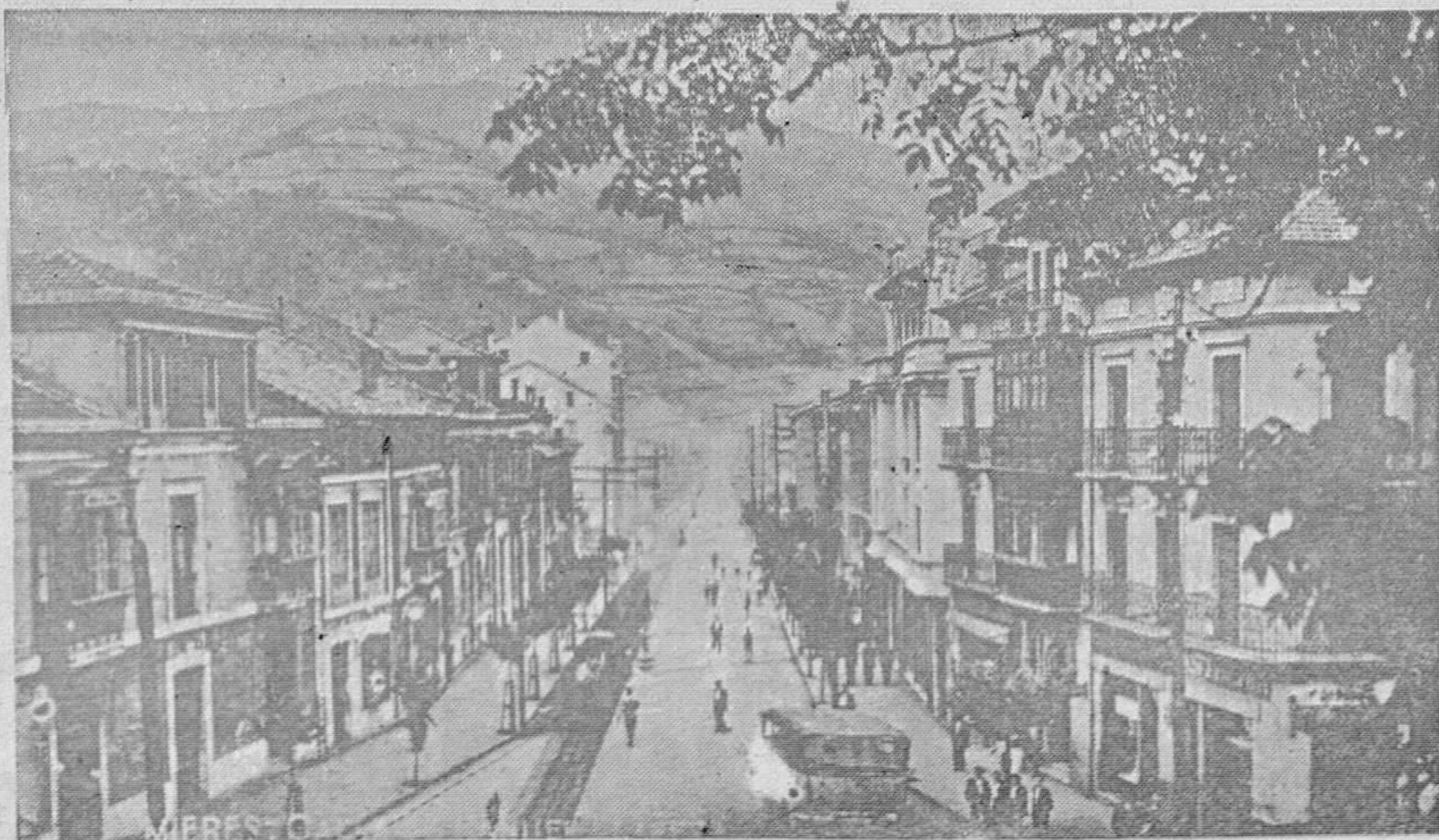
MIERES.-Calle de Manuel Llanceza, una de las más céntricas vías de la populosa villa.