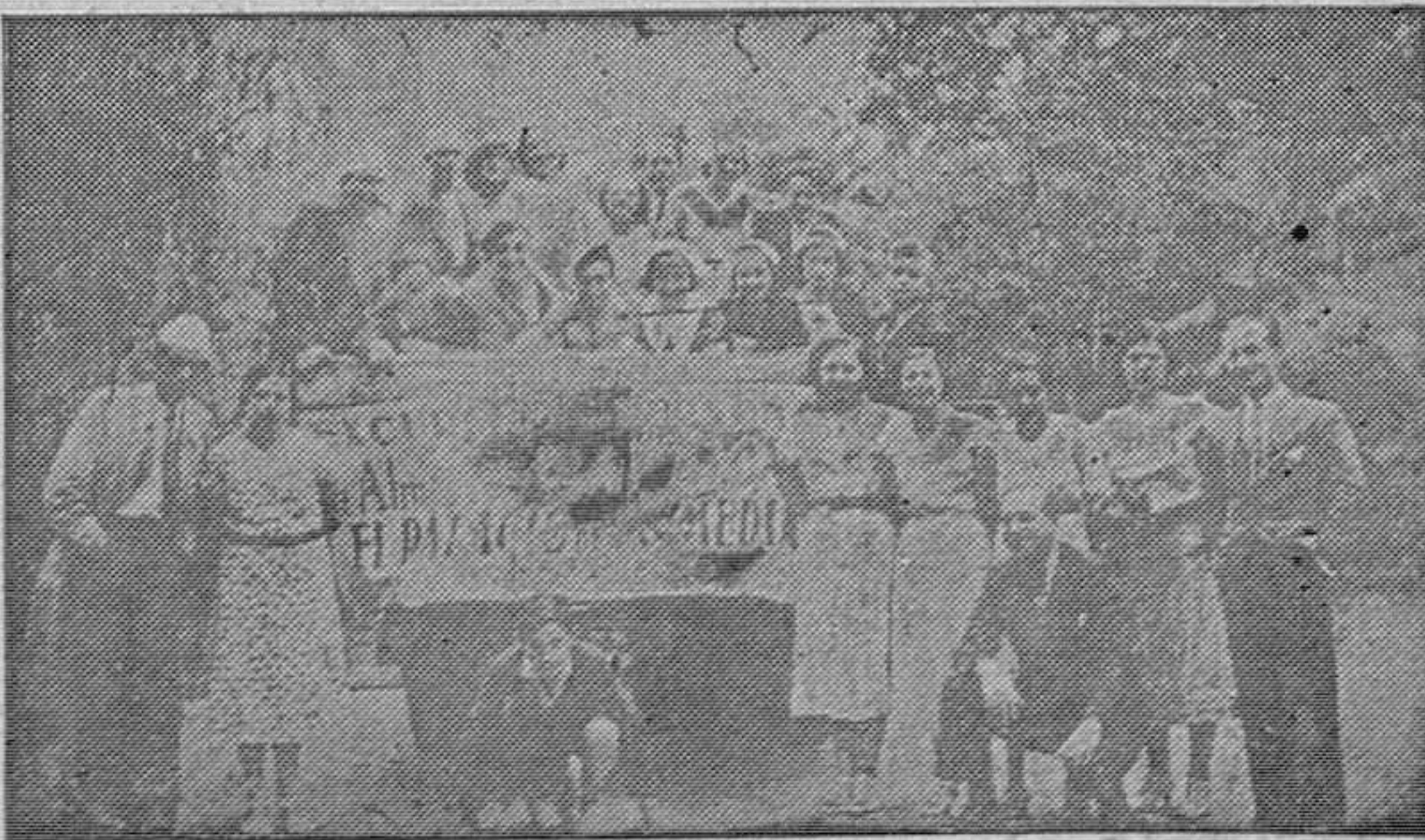
El personal de los Almacenes Díaz Alonso y del "Palacio de las Medias", comercio de la misma firma, ha hecho su primera excursión de estudio en un circuito por la parte oriental de la provincia, interior y costa, de la cual es la adjunta fotografía. El día 8 de Julio celebrará

la segunda excursión por la zona centro del litoral. El personal de tan popular almacén es objeto de agasajos en todos los pueblos que atraviesan y ya han recibido noticias de los que han de tributarles en la próxima excursión.