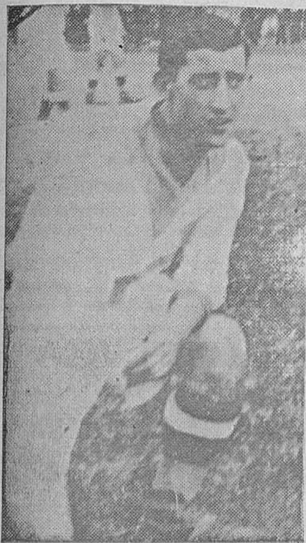
SAN MIGUEL.-Capitán del Racing de Mieres, y tan excelente jugador como persona

Ultramarinos finos, paquetería y tejidos. Garantía de clase y precios económicos