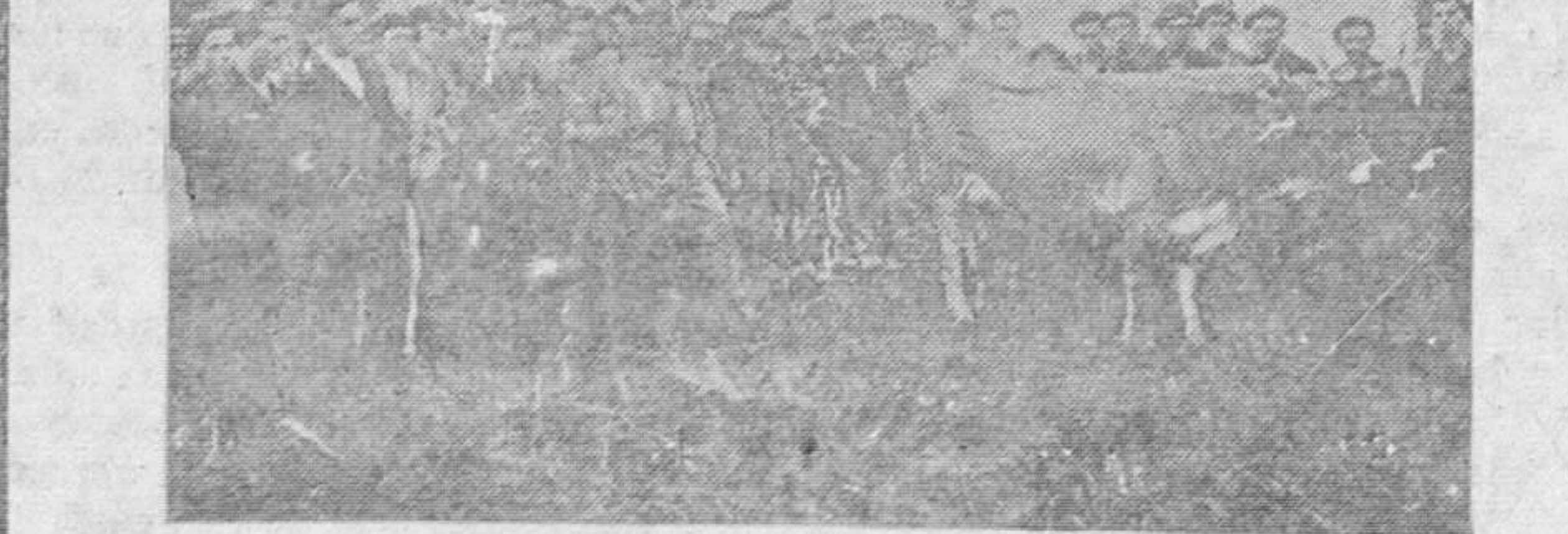
EN CELORIO (LLANES).—En el cursillo de divulgación agrícola celebrado con gran éxito, se realizaron entre otras enseñanzas, prácticas de desfonde de tierras con arado, según se atestigua en la presente nota gráfica