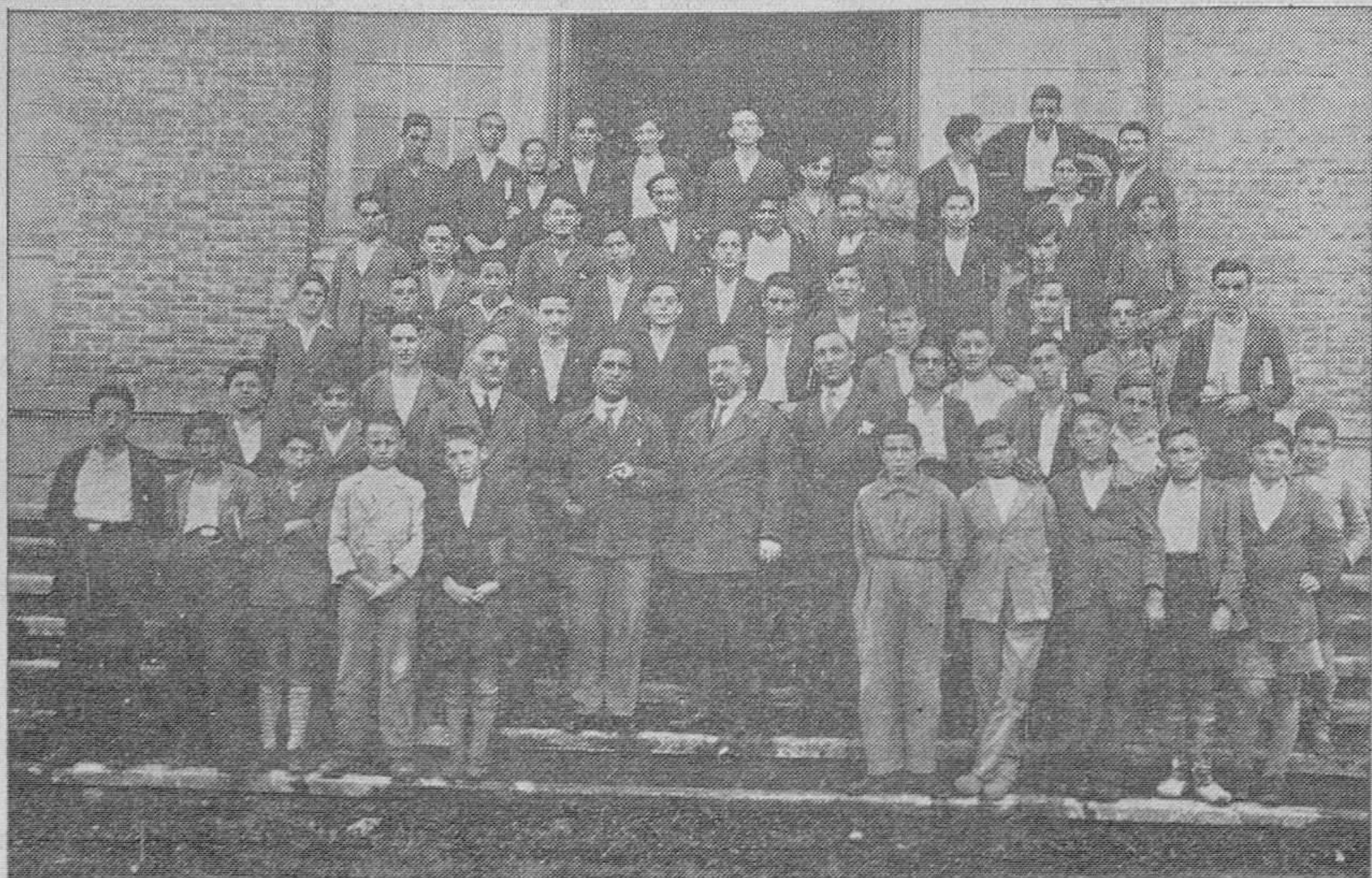
Los aprendices de la Fábrica de Armas de la Vega, con sus profesores

es un periódico esencialmente asturiano, y para todo lo que afecta al comercio y a la industria asturiana hay un interés particular en hacer pública en él mismo.