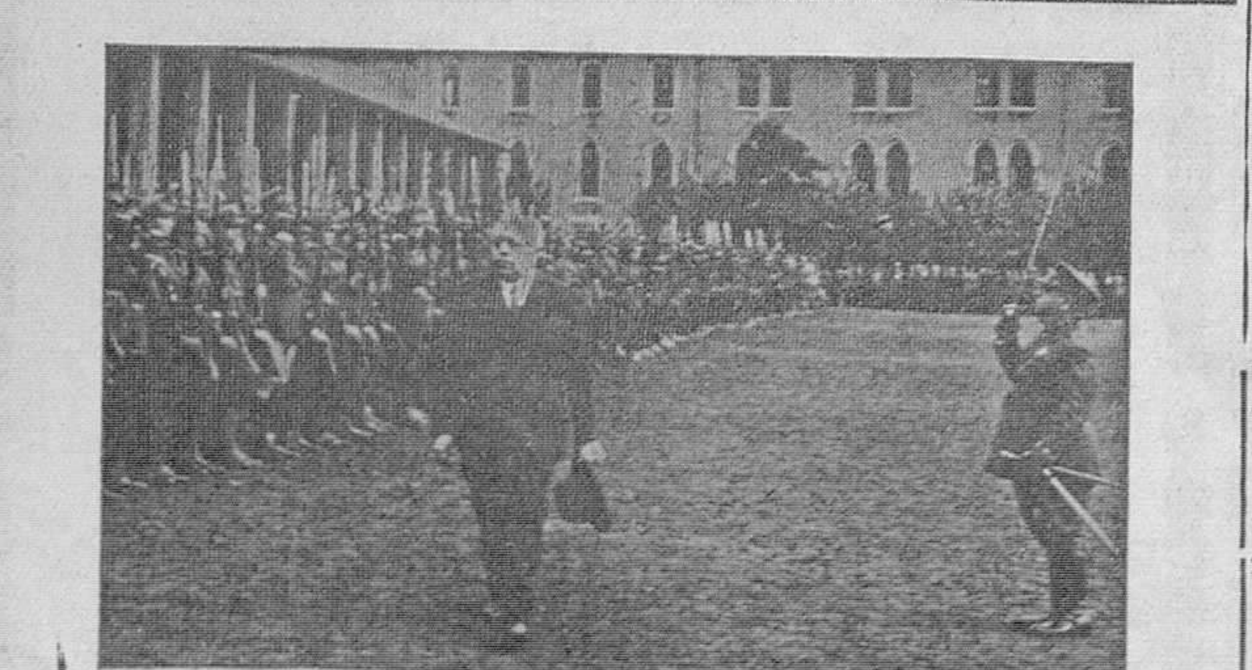
El ministro de la Guerra pasando revista a las tropas en el patio del cuartel de Pelayo

luego por reveses de la fortuna acepta una plaza de chófer de punto en la propia capital que lo vio brillante y triunfador... Porque esta circunstancia sería apreciable en un muchacho entregado luego a la austeridad en aras de su familia; pero no enamorado a espaldas de su mujer de una feminista absurda, con menos de mujer que un maniquí de cera.