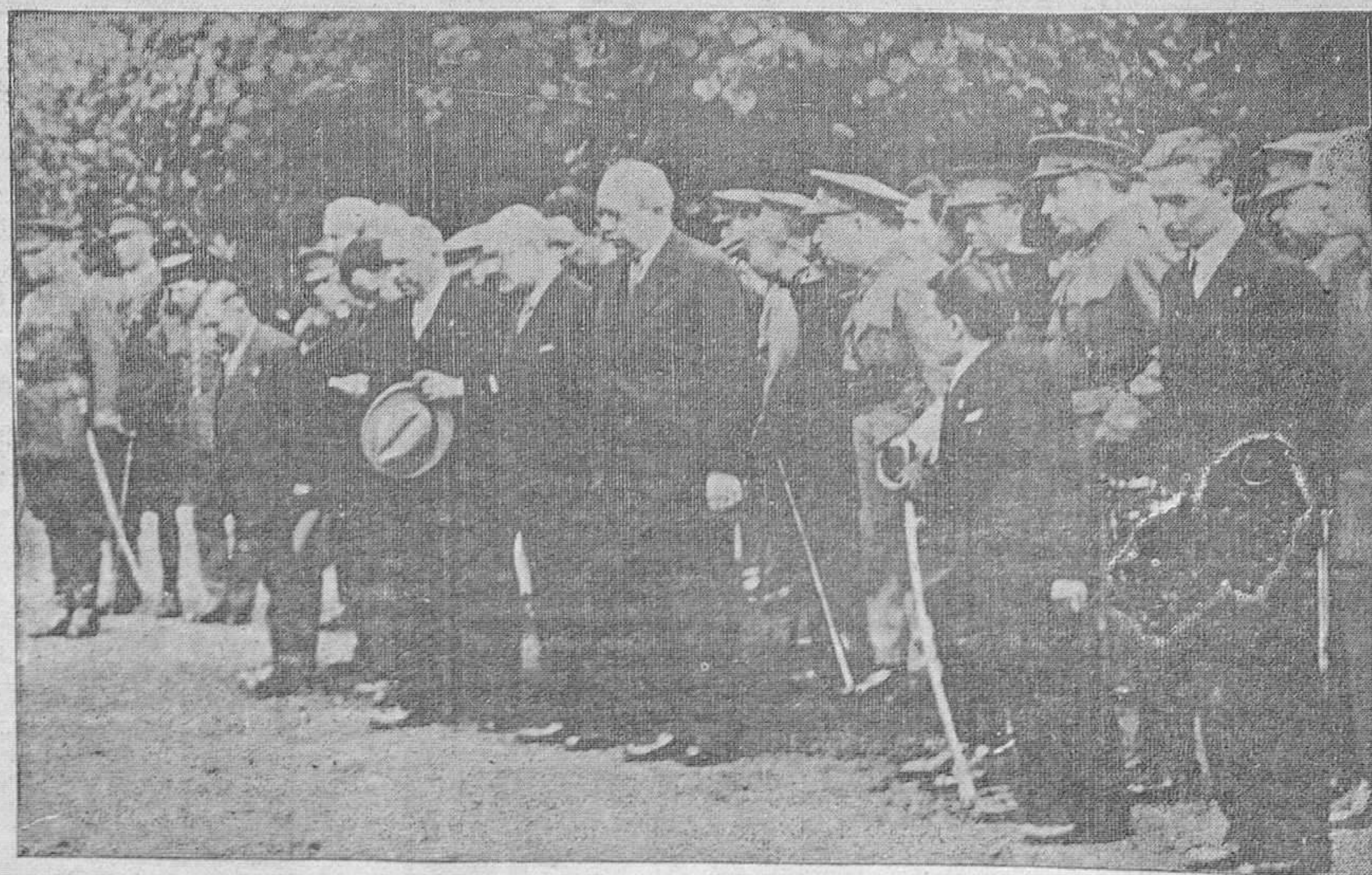
El jefe del Gobierno con las autoridades y representaciones saluda a la bandera durante el desfile militar

(Continúa esta información en sexta y séptima planas.).