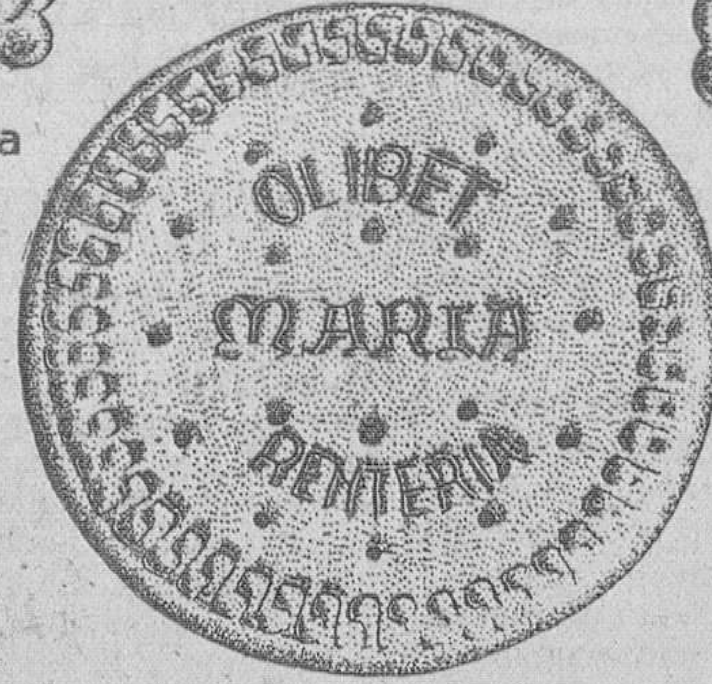
María sin rival