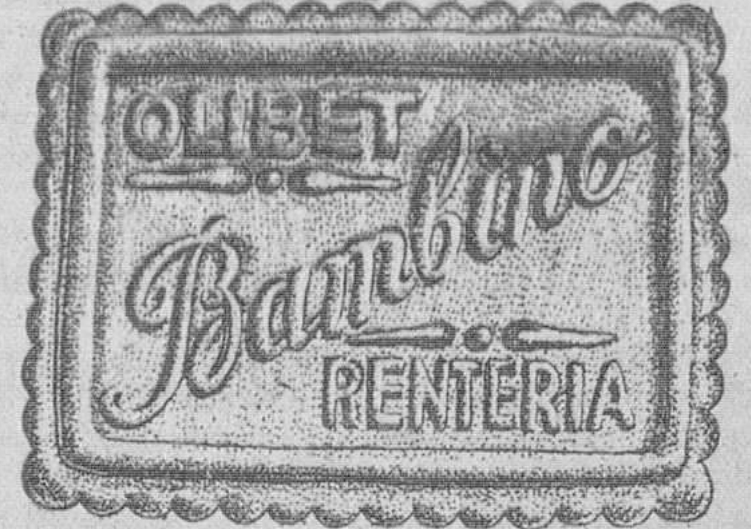
Deliciosa para los niños