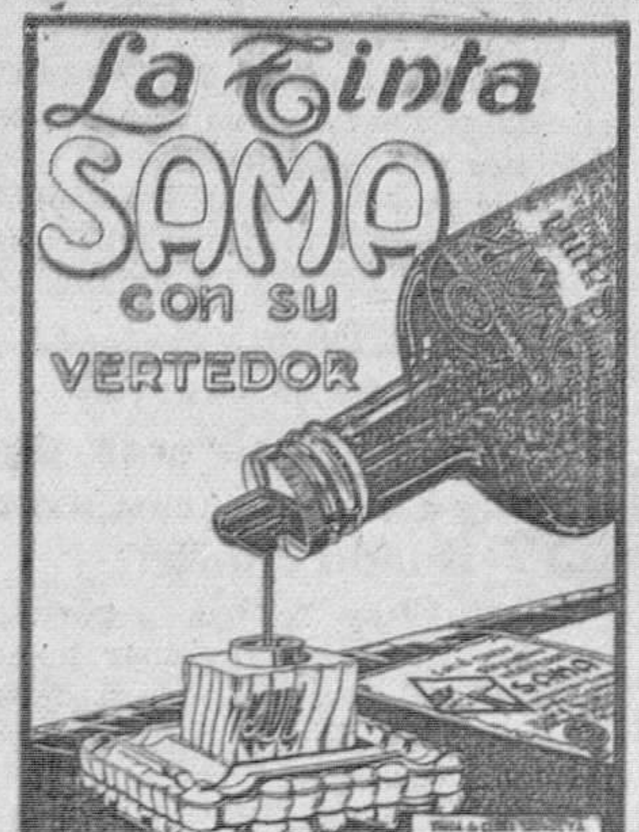
Es especial para Estilográficas DE VENTA EN LAS BUENAS PAPELERIAS

solicita viajante a comisión para la zona de Asturias-Galicia.—Ofertas con informes Apartado 9017 - Madrid