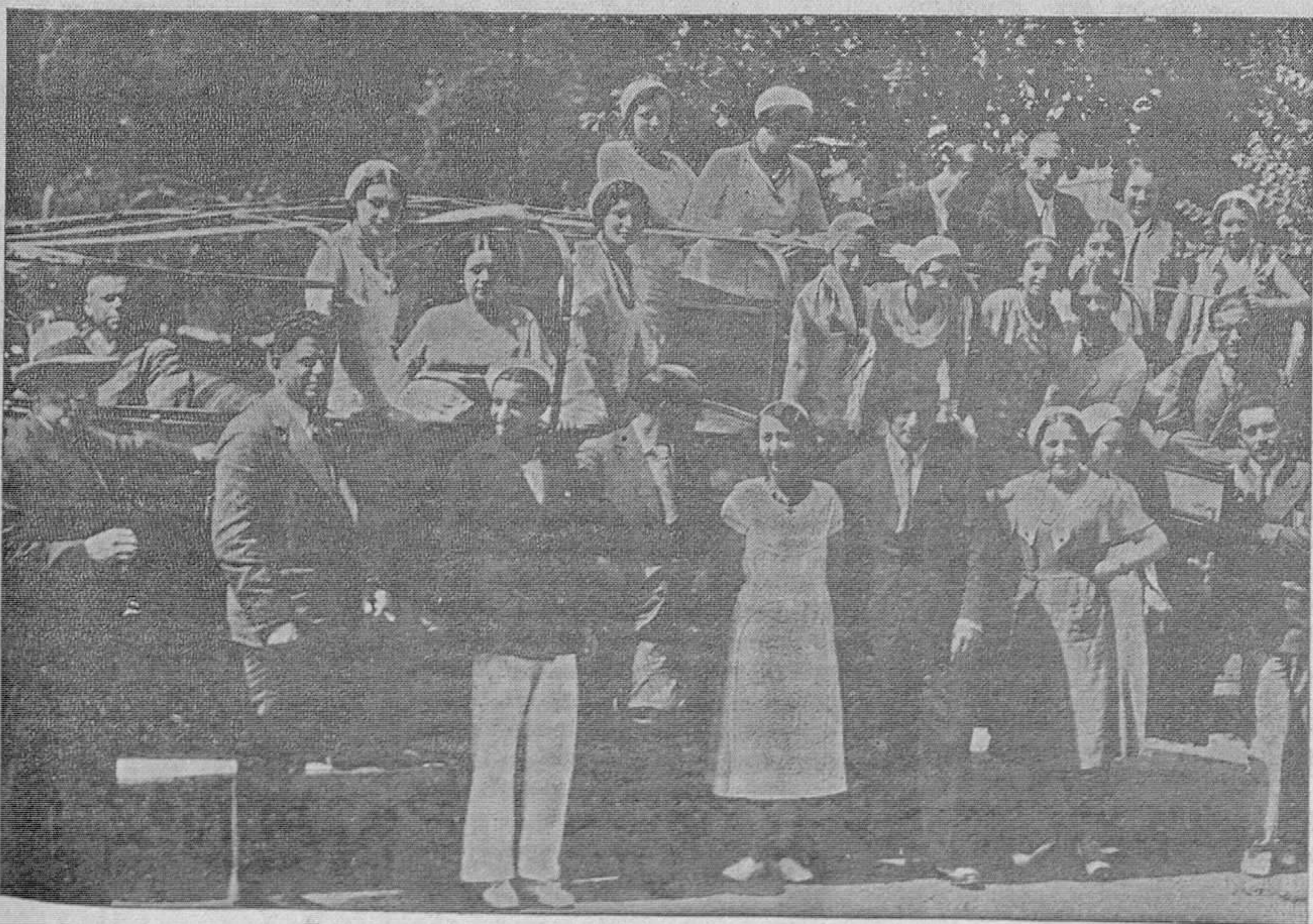
Ante el fondo del hermoso parque de San Francisco, los excursionistas han hecho un alto en la marcha a su paso por la capital, que Mena aprovecha para tirar unas placas y presentar ante el lector de «LA VOZ» a este plantel de hermosas señoritas de Salas, que en el día de ayer recorrieron en automóvil una buena parte de Asturias, acompañadas de unos cuantos muchachos de la pintoresca villa