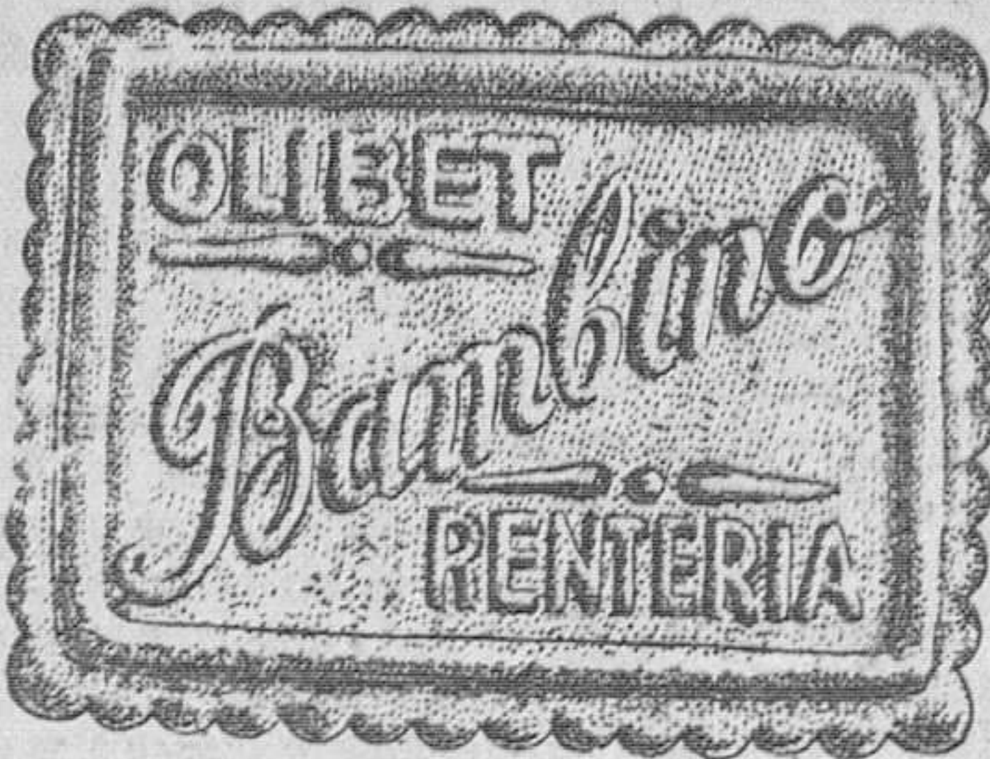
Deliciosa para los niños