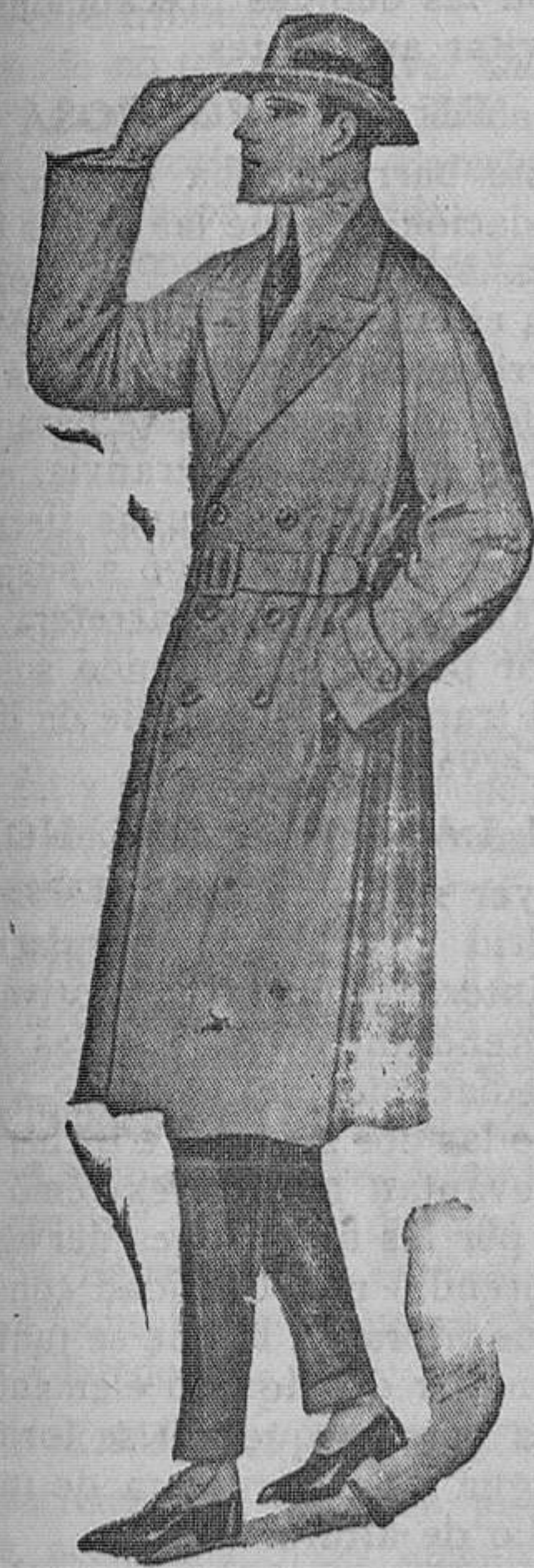
Gabardina impermeable modelo cruzado. Lo más nuevo en puro estambre. Pesetas 116

VEAN MODELOS Y PRECIOS PARA LA PRESENTE TEMPORADA