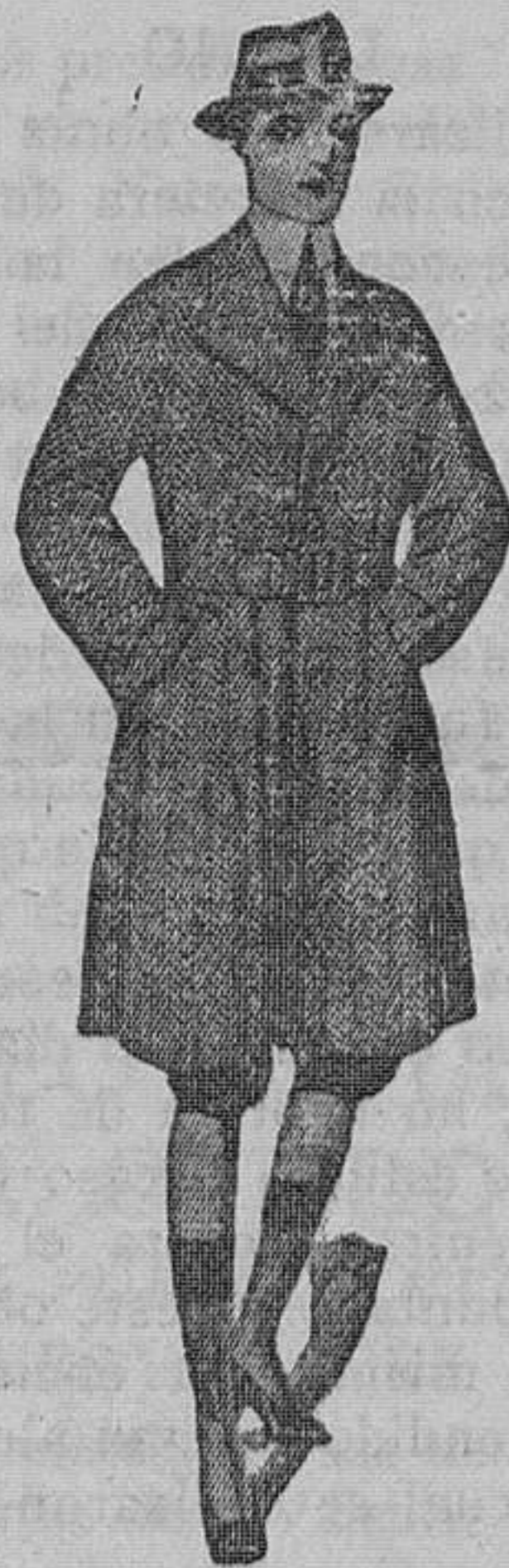
Gabancito niño recto, con o sin cinturón, muy sport. En cheviot de lana para 12 a 14 años. Pesetas 46

Exclusividad de los Gabanes «REGIUS» Son los preferidos del público por su esmerada confección.