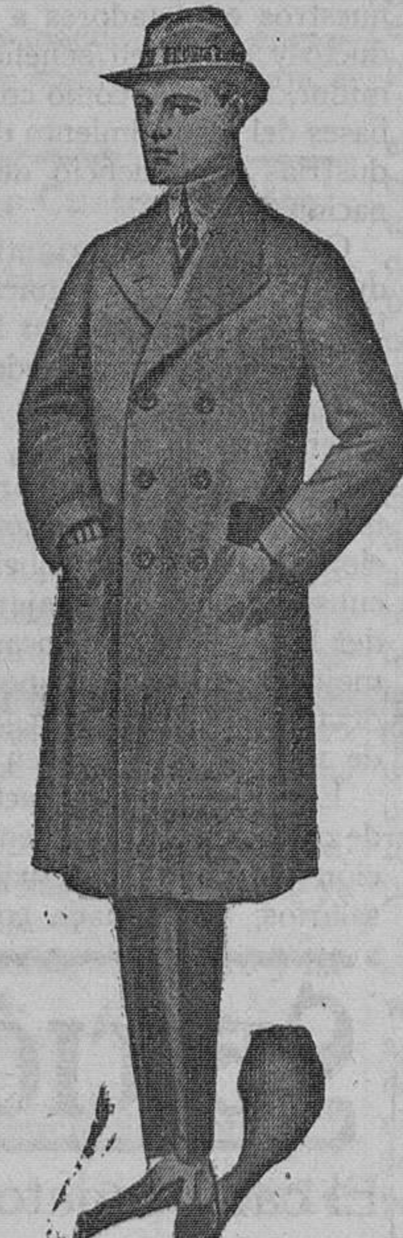
Gabán cruzado, modelo recto, gamuza o ratina superior, colores oscuros lisos. Pesetas 86

Si todavía es usted cliente, honrenos con su visita y nos lo agradecerá después.