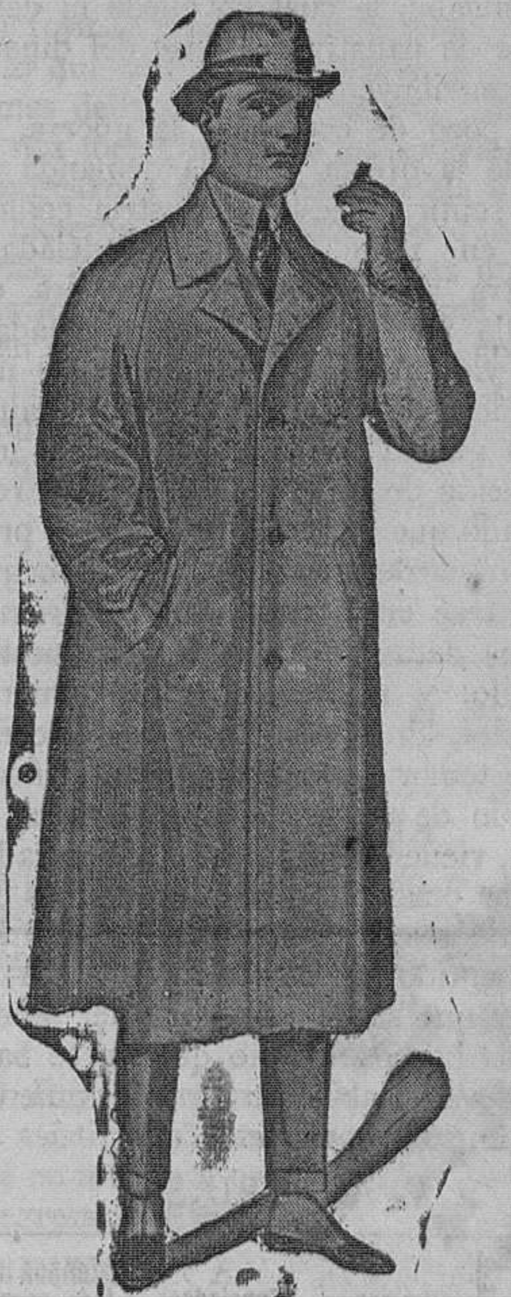
Impermeable hule negro o color, distintos modelos, muy práctico, garantizado. Pesetas 42

Ropas hechas de todas clases — Uría, núm. 44. — OVIEDO