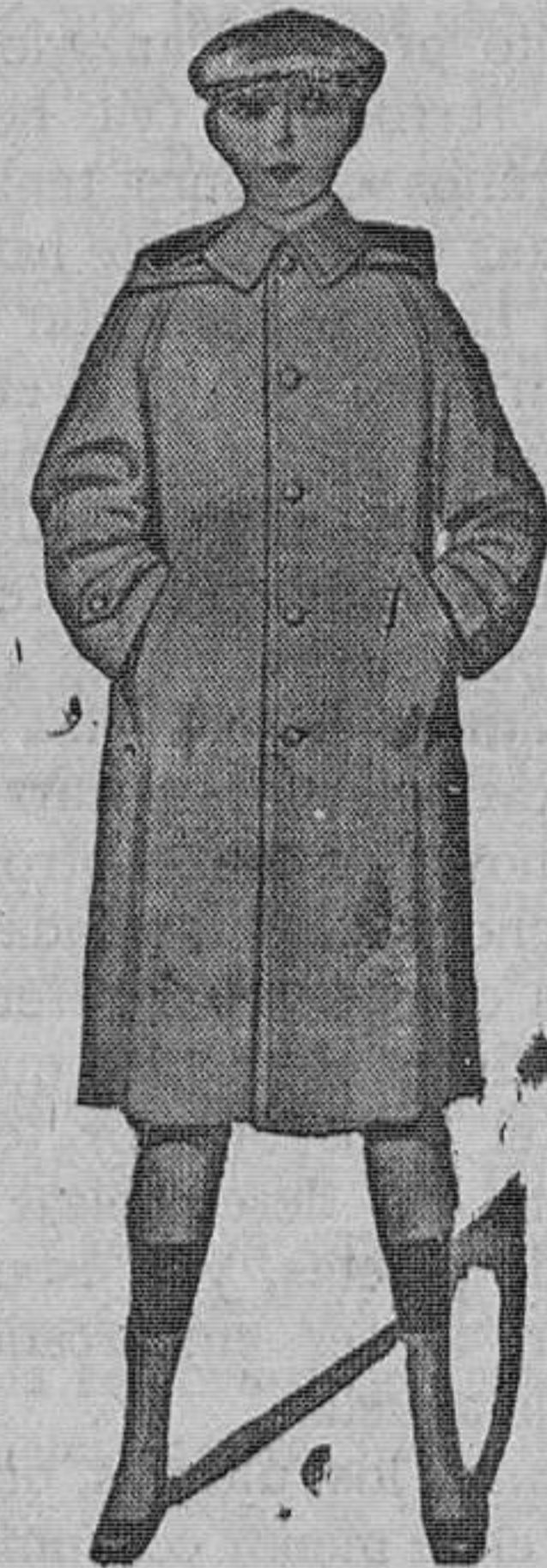
Impermeable niño, modelo cerrado, con o sin cinturón y capucha. En hule de primera, negro, gris y liso, para 12 o 14 años. Pesetas 54

Si todavía es usted cliente, honrenos con su visita y nos lo agradecerá después.