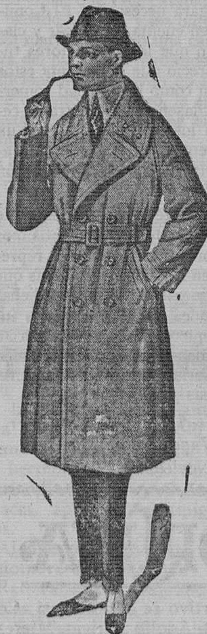
Abrigo cruzado con o sin cinturón, muy elegante, modelo «Regius», clase superior. Pesetas 105