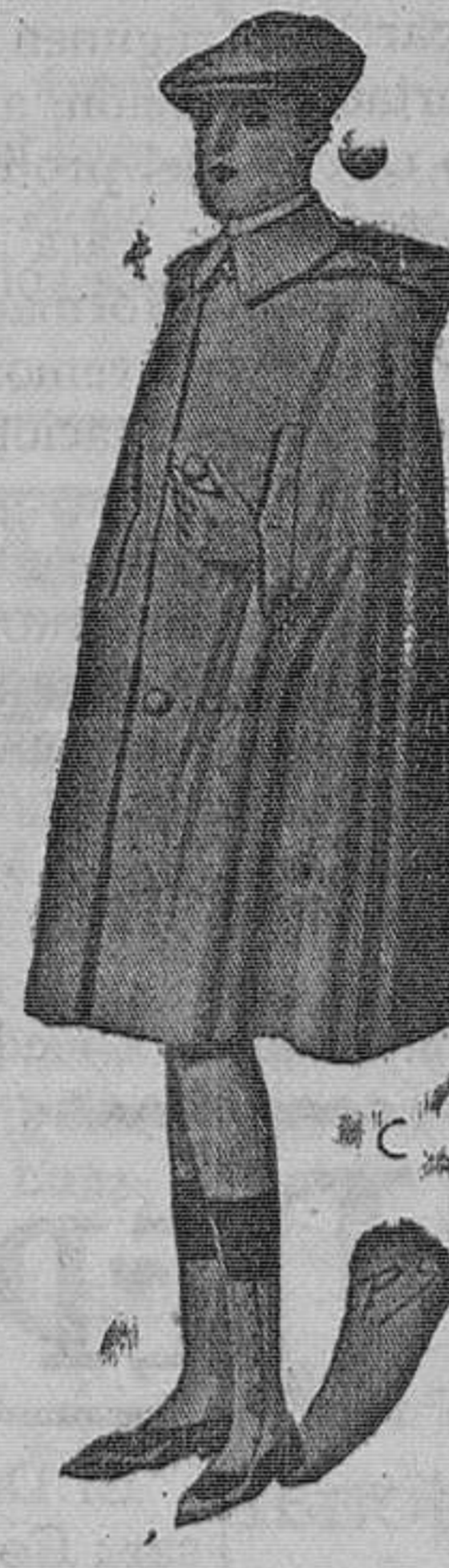
Capita impermeable niño, hule negro o color, calidad inmejorable. Tamaño 50 cms. Pesetas 9,25