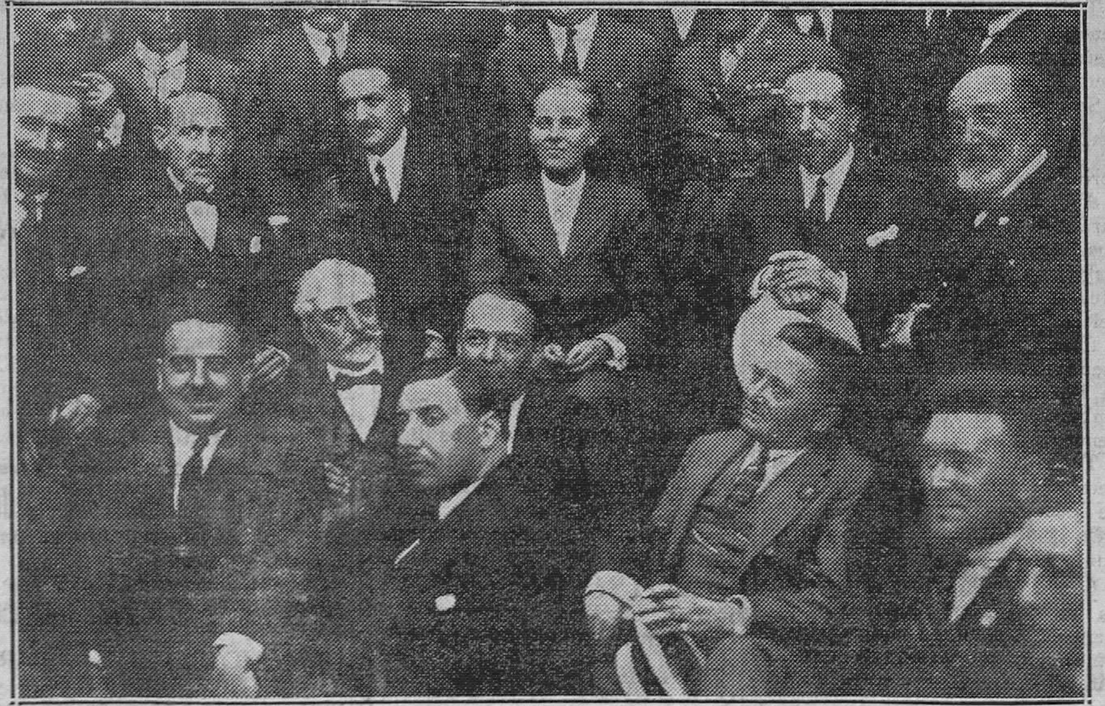
DEL ACTO EN COVADONGA.—Un grupo de alcaldes rodea al heredero del Trono