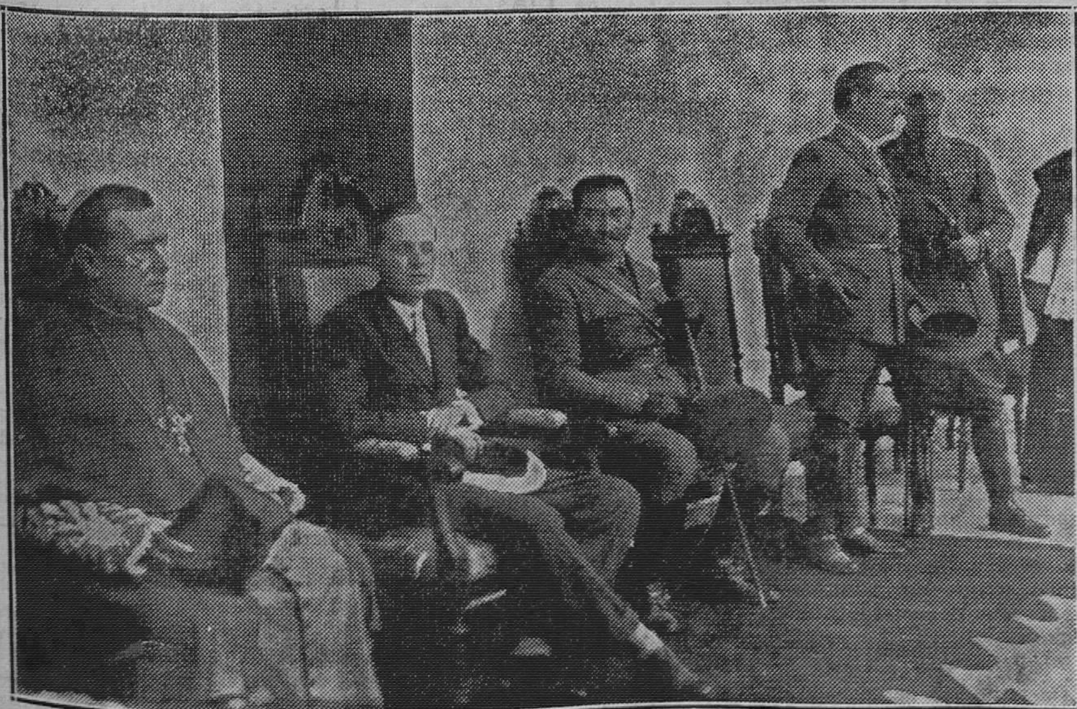
EN LA FERIA DE MUESTRAS.—Su Alteza Real el Príncipe de Asturias en la sesión de clausura

Se ha comprobado que no estaba echada la cadena del paso a nivel.