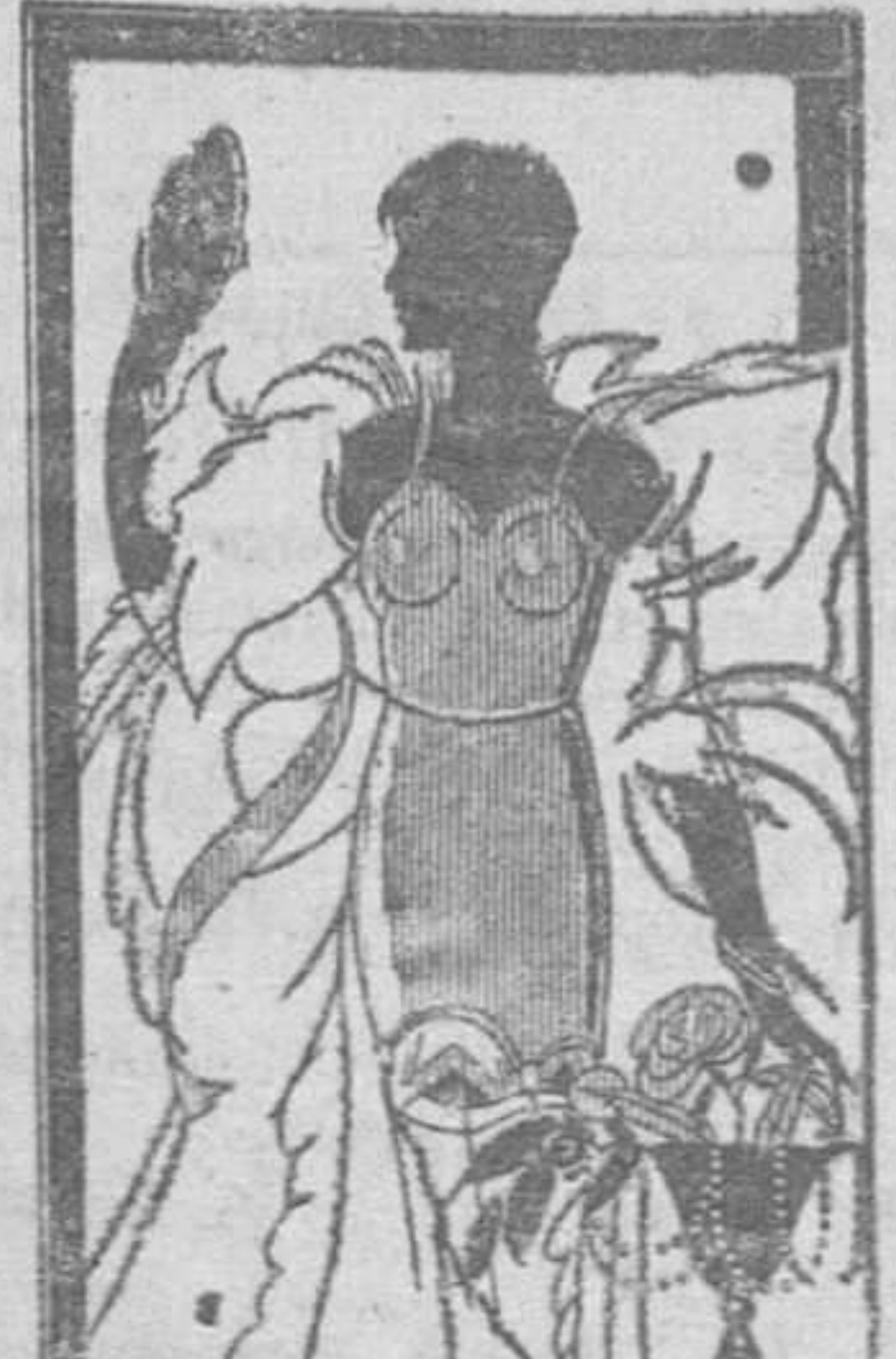
«MADAME X» Fajas para adelgazar