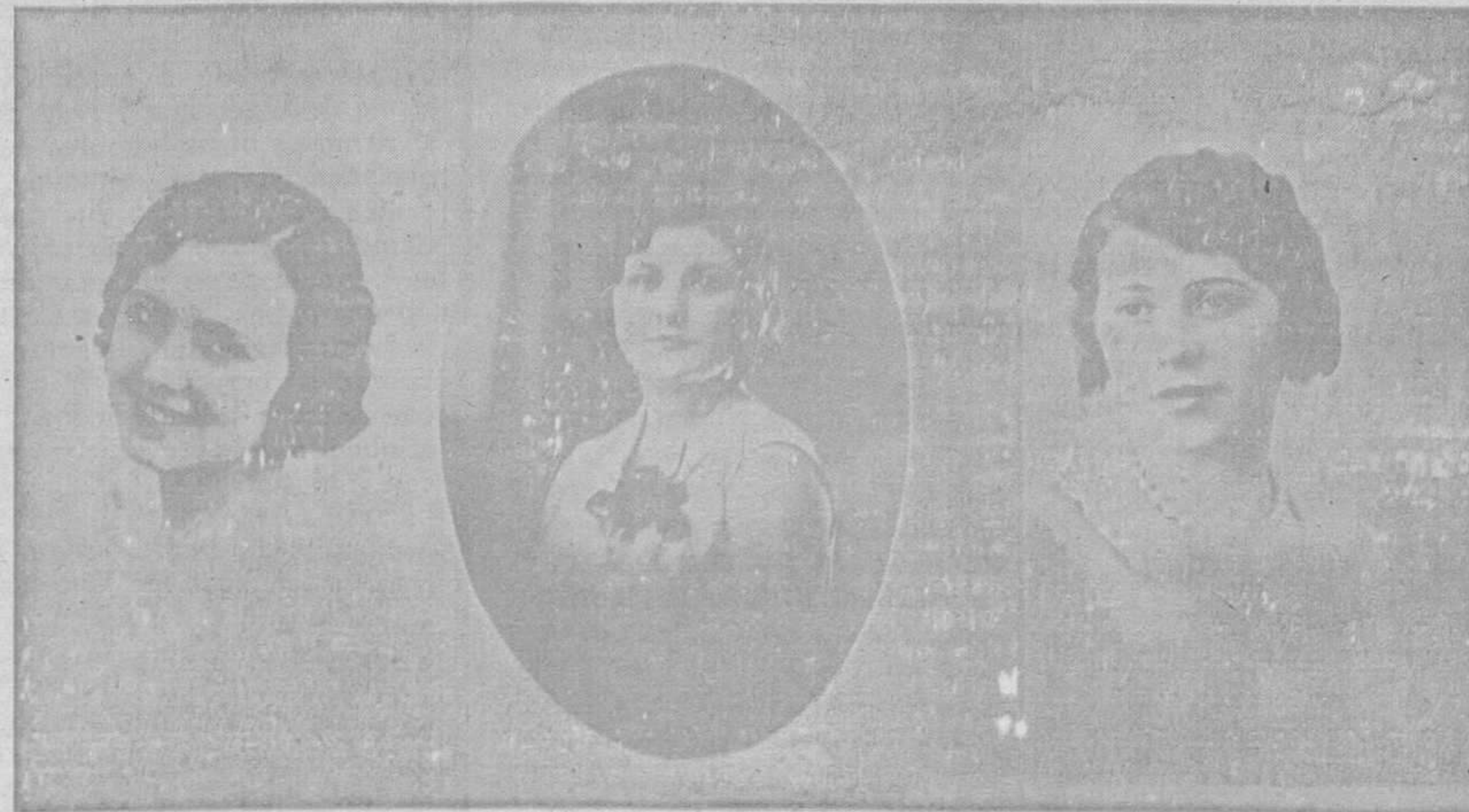
No hará falta decir al lector—puesto que se «inspirará» ante el cuadro de belleza que se le presenta—que este maravilloso trio de divinidades son las elegidas últimamente para tomar parte en el concurso de «Miss Asturias», ¿Verdad que no es para envidiar a los designados para elegir entre estos prodigios de la naturaleza?

Nada de esto hay. La ilusión de escalar este ansiado y soñado puesto debe volver a la mente de todas nuestras siempre bellas sotroñdinas, pues si es cierto que las hay que parecen rositas, también las hay que son claveles, pero claveles naturales, criados en estas huertas sotroñdinas, que dejarían ahitas a todas esas rositas que se marchitarían y se deshojarían al ver que los