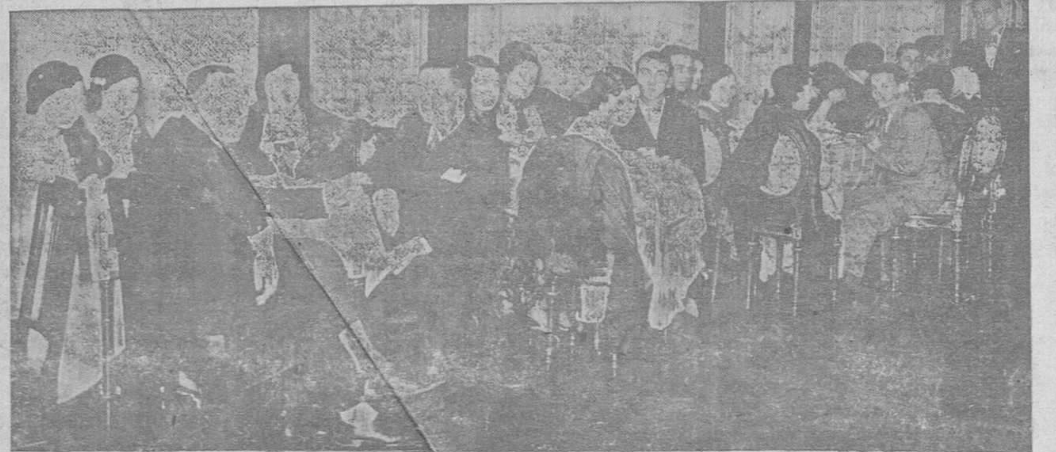
Uno de los acogedores e interesantes lugares del salón de fiestas del Circulo Mercantil, durante el baile inaugural celebrado el pasado viernes, en cuya reseña quedamos cortos a la hora de tributarle los elogios que merece

Añade, que el Gobierno español, en reconocimiento a sus conocimientos en materia de enseñanza, va a confiarle la cartera de Instrucción.