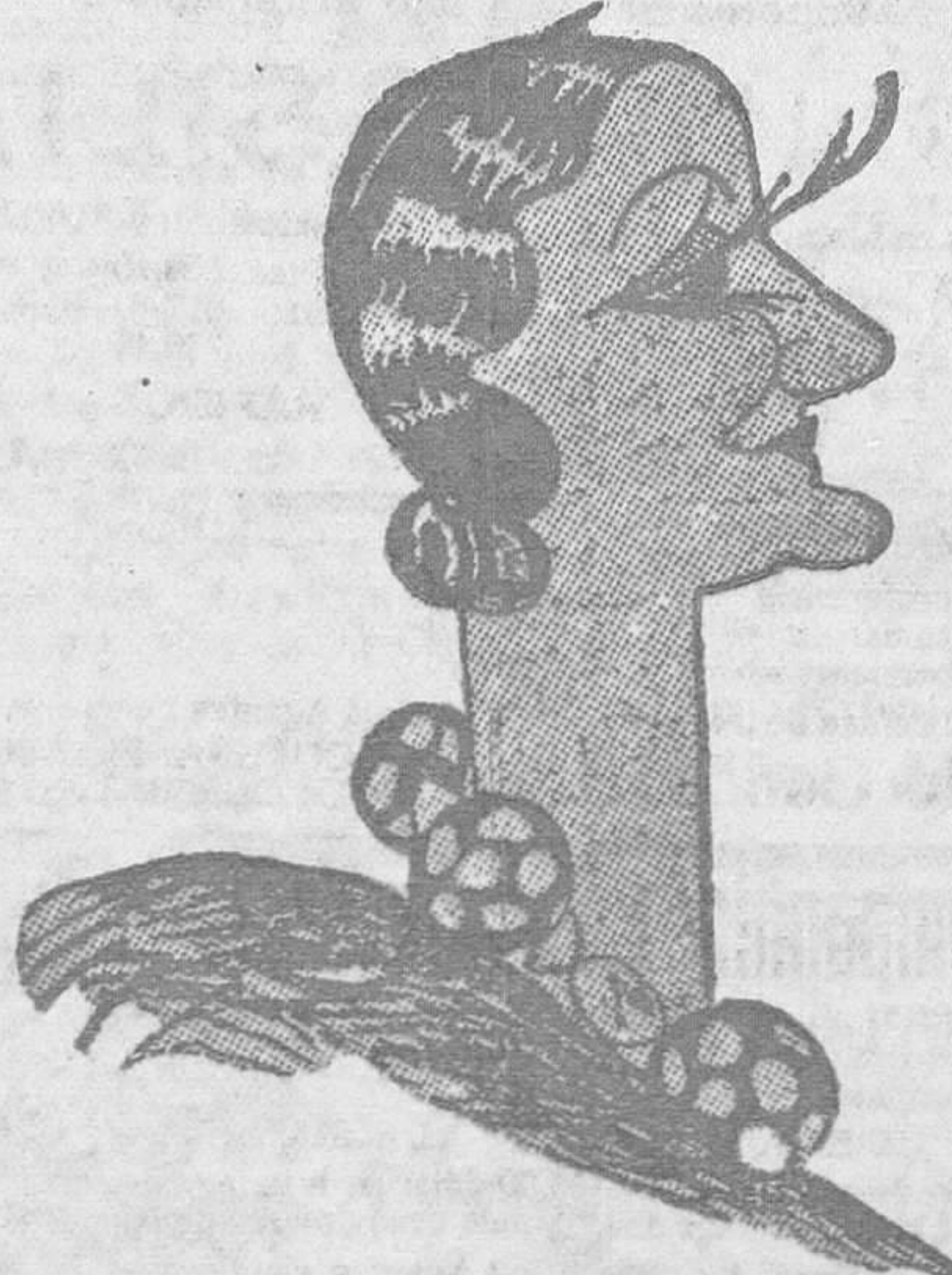
TERESITA DANIEL, VISTA POR EL CARICATURISTA «BON»