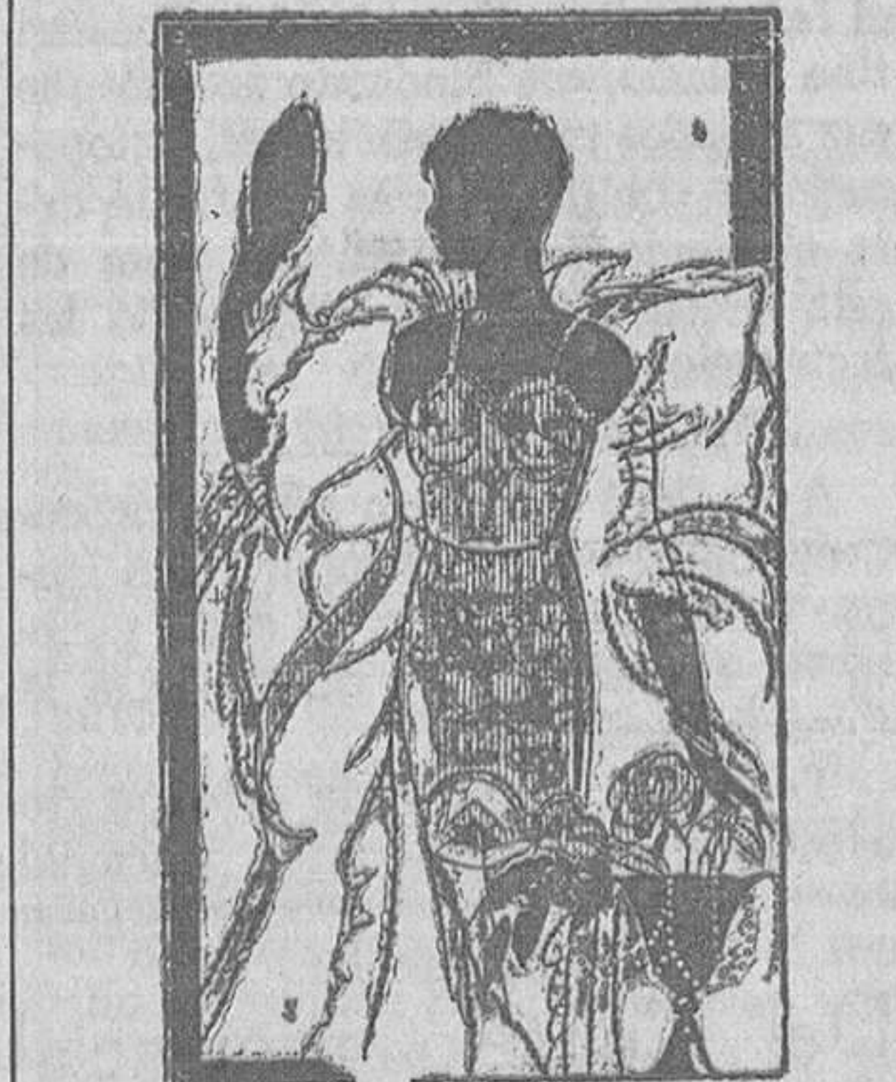
«MADAME X» Fajas para adelgazar Melquiades Alvarez, 6

En el mismo departamento viajaba un individuo. Cuando María notó en su casa que le faltaba el bulto del traje, llamó por teléfono a la estación y le dijeron que el bulto lo había llevado fulano, cuyo fulano era aquel sujeto que venía en el tren y como ella sabe cómo se llama dió el nombre en la Comisaría.