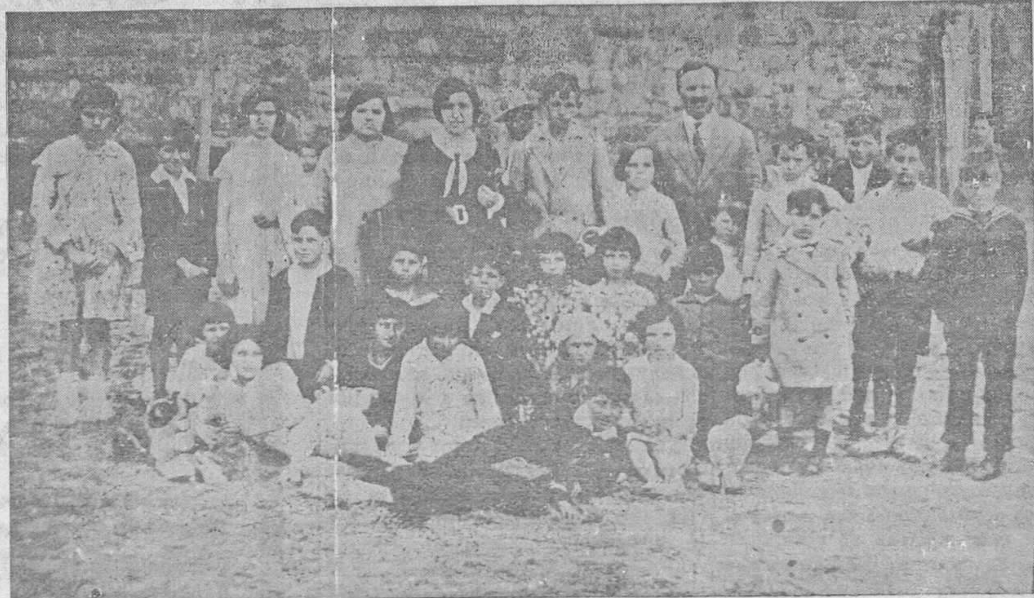
EXCURSION ESCOLAR.—Grupo de niños y niñas, los primeros de la escuela nacional de San Claudio y las segundas de la escuela particular del mismo punto, con los respectivos profesores, que realizaron una excursión por la provincia, visitando después los talleres de «La Voz de Asturias»

Por acuerdo de la Corporación y hasta nuevo aviso, queda sin efecto la subasta anunciada para la ampliación y reforma de la Casa Consistorial.