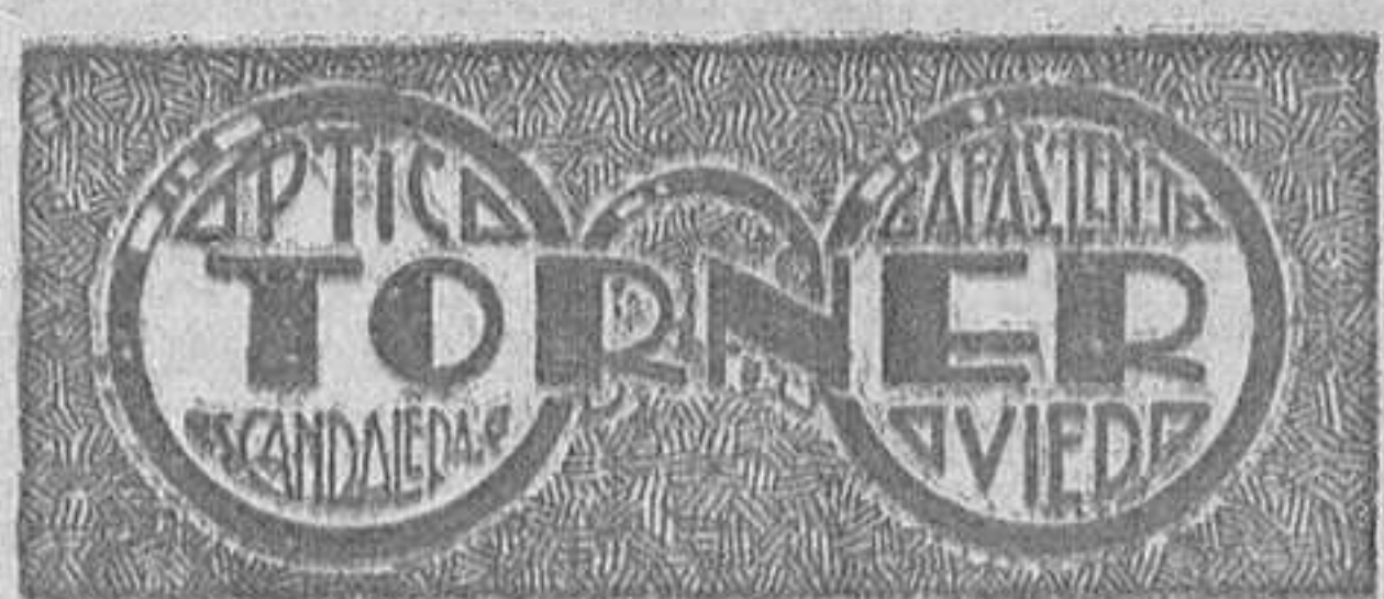
Despacho recetas de Sres. oculistas