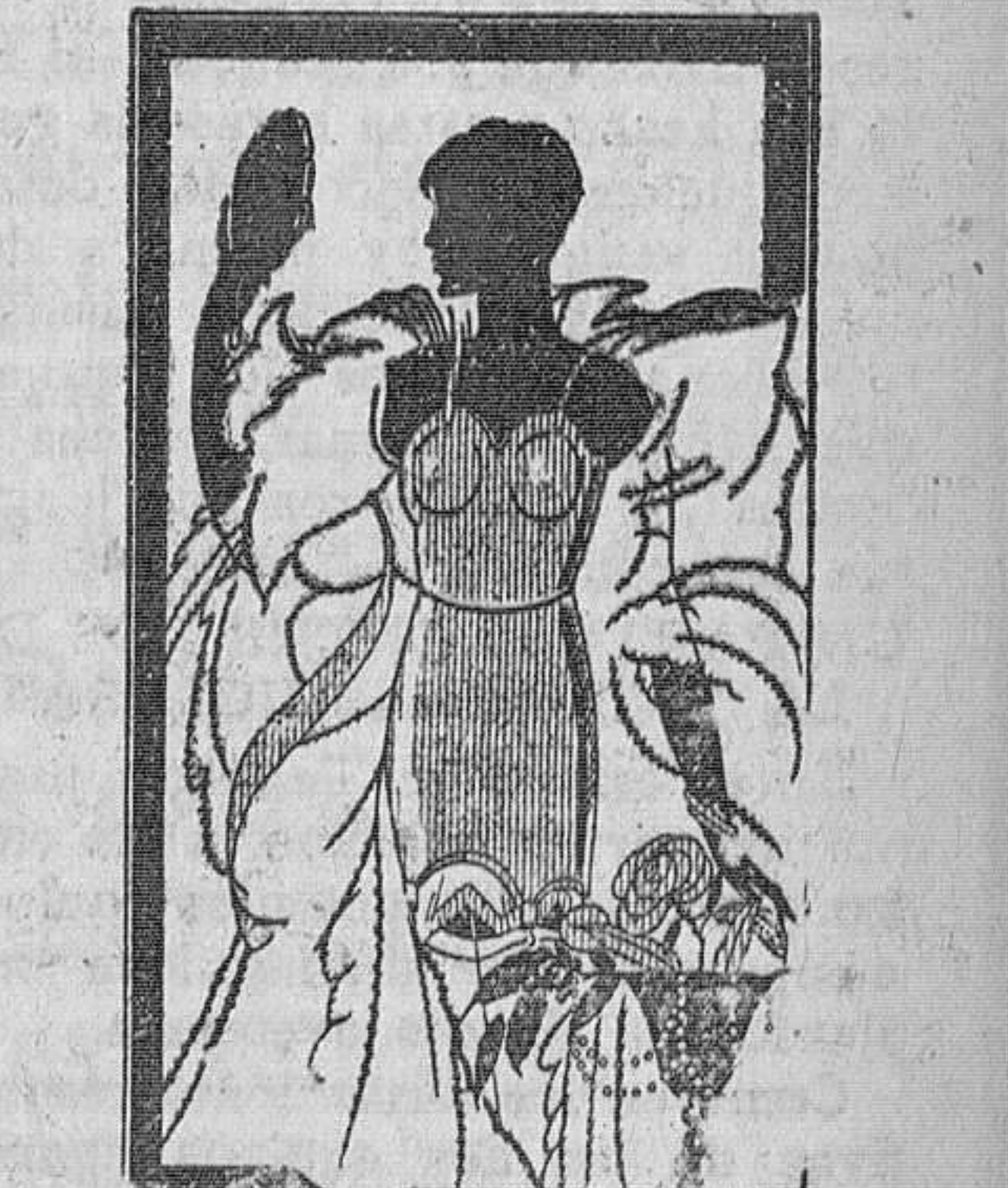
"MADAME X" Fajas para adelgaza. Melquiades Alvarez, 6