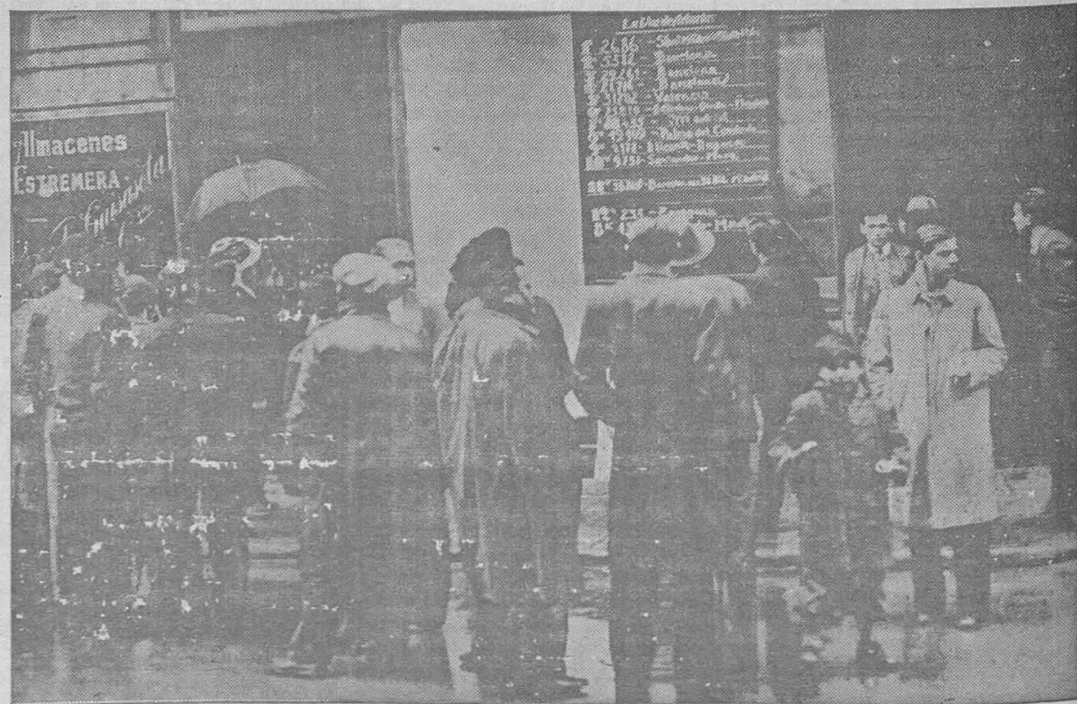
Lo intempestivo del día no impidió que muchas personas se acercasen a los transparentes colocados por los periódicos para conocer el resultado del sorteo de la Lotería