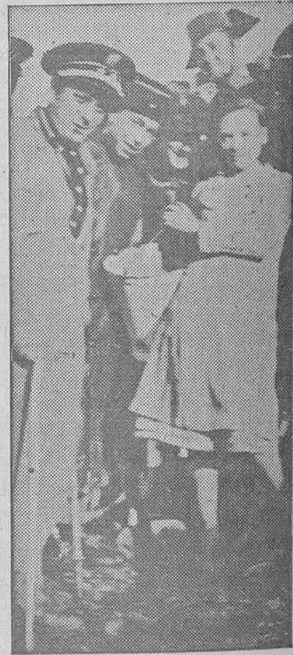
La compañera del "Barganilla" es interrogada por las autoridades.

ES EL PERIODICO DE MAYOR TIRADA Y CIRCULACION DE LA PROVINCIA.