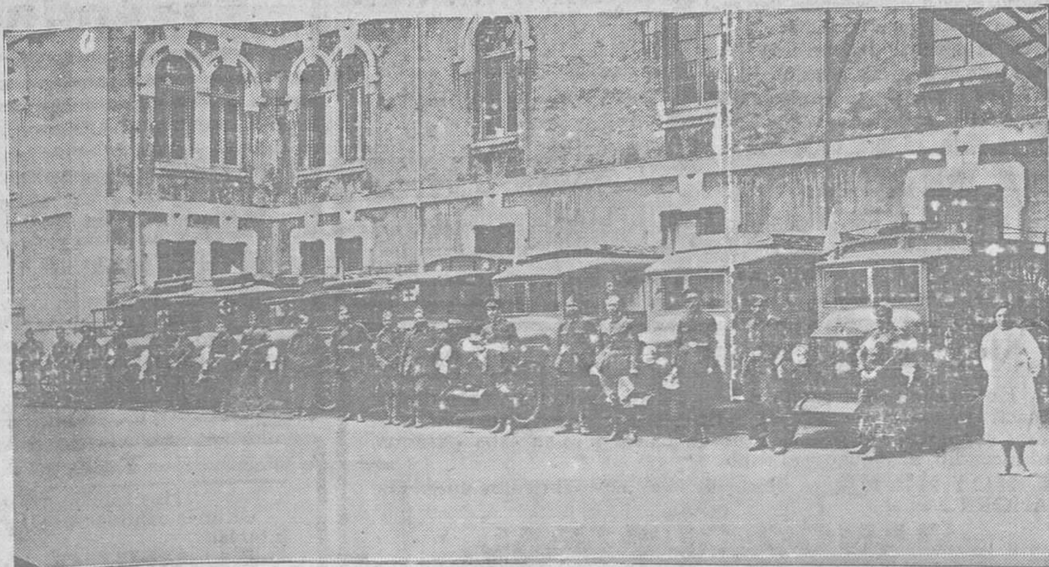
Las ambulancias del Cuarto Grupo de la Segunda Comandancia de Sanidad Militar que hoy abandona ya Oviedo después de haber prestado incalculables servicios, a los que nos referimos en una información de este número.

La minoría agraria hizo entonces fe de acatamiento al régimen, pero no tuvo igual fortuna con la CEDA. Esta no votó la constitución y sus afirmaciones