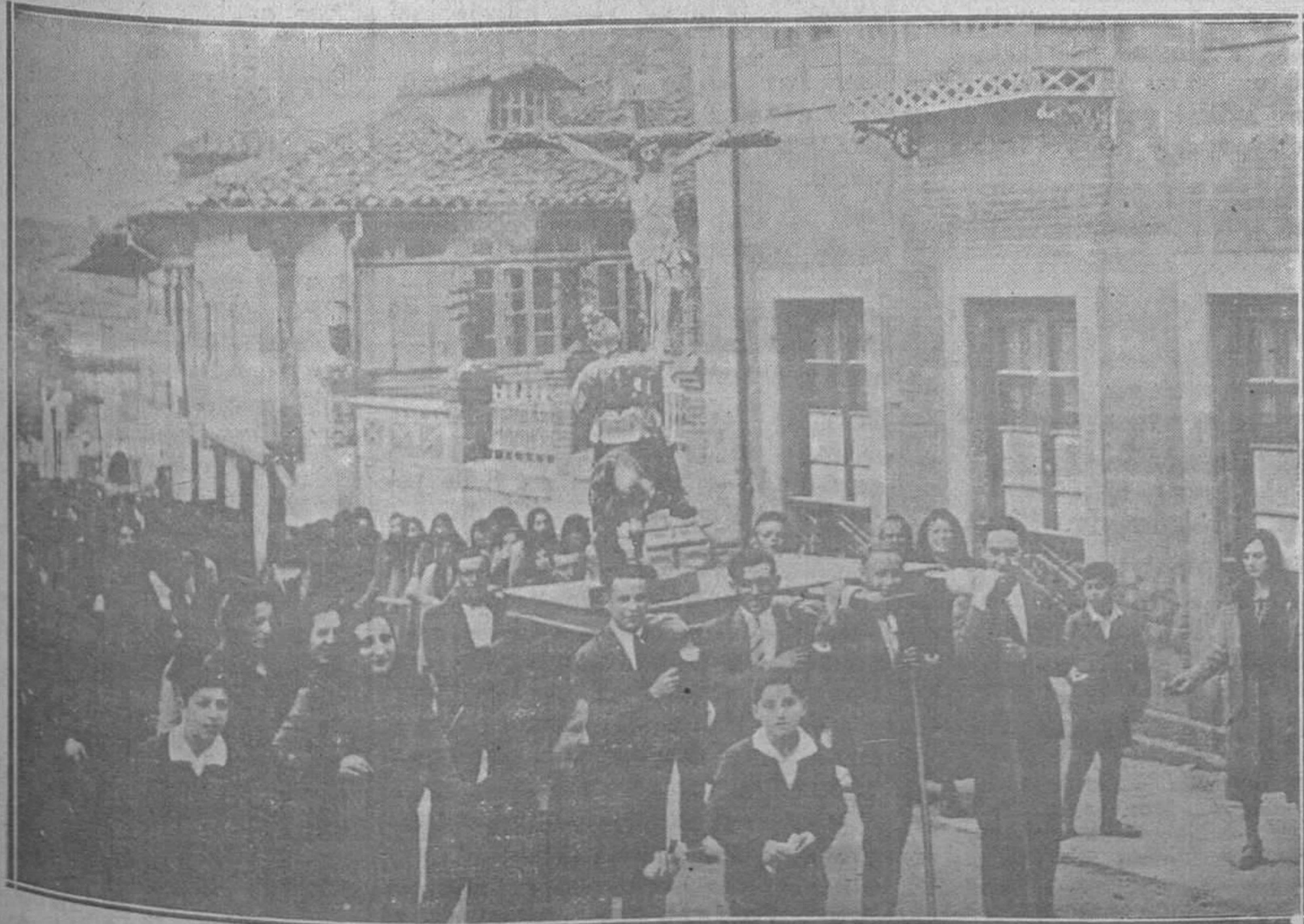
LA SEMANA SANTA EN VILLAVICIOSA.—Uno de los pasos que figuraron en las brillantes procesiones celebradas en la hermosa villa asturiana.

(Este número ha sido visado por la censura)