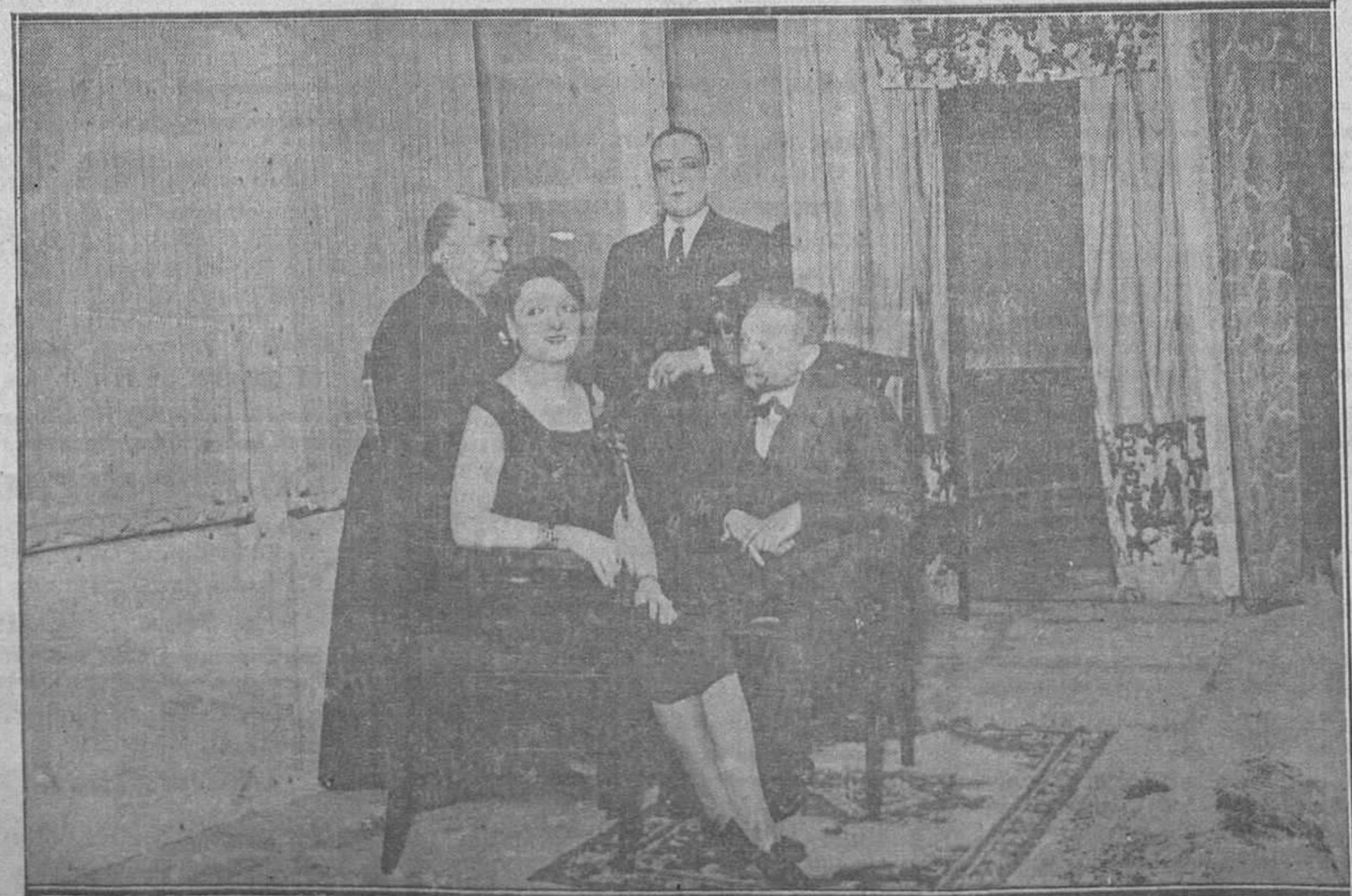
DEL BENEFICIO DE LA ASOCIACION DE LA PRENSA EN EL CAMPOAMOR.—Una escena de la obra de los Quintero «Cristalina», representada brillantemente por la Compañía Meliá-Cibrián en la función a beneficio de los periodistas asociados, en la tarde y noche del viernes último

Redacción de "La Voz de Asturias" Apartado núm. 29